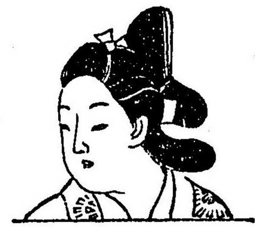
圖 三 第