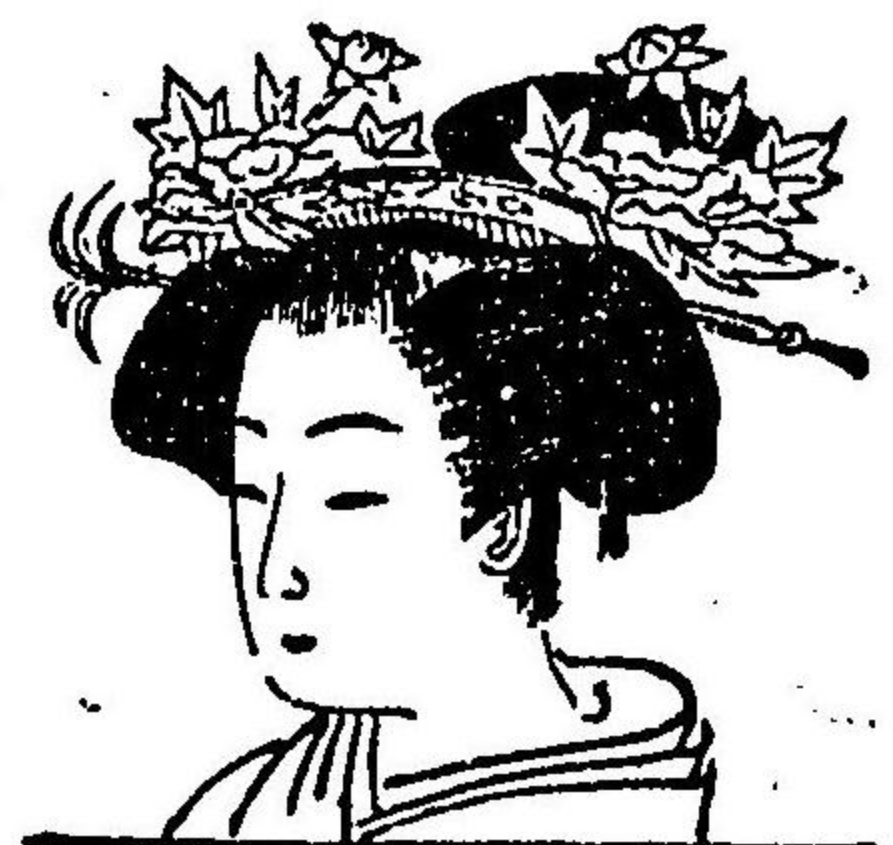
圖 六 第