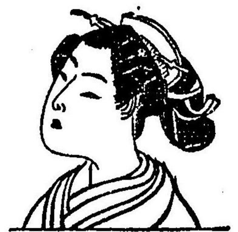
圖 五 第