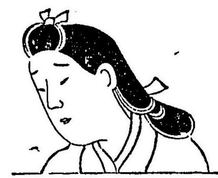
圖 二 第