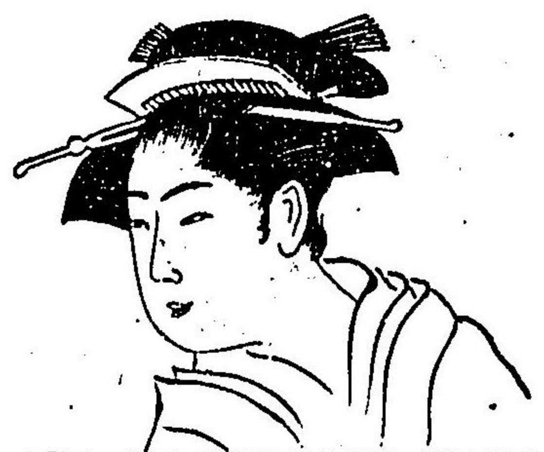
圖 七 第