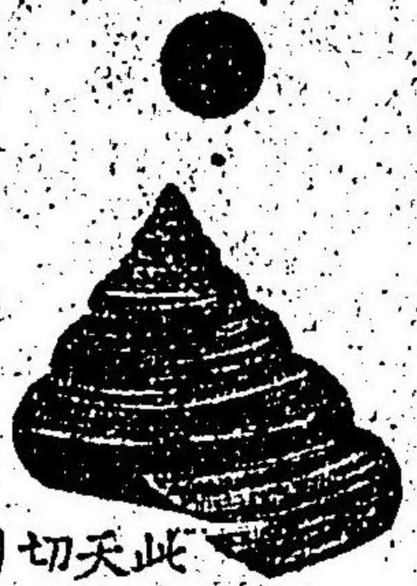
此ノ処ニ天然ノ切目アリ