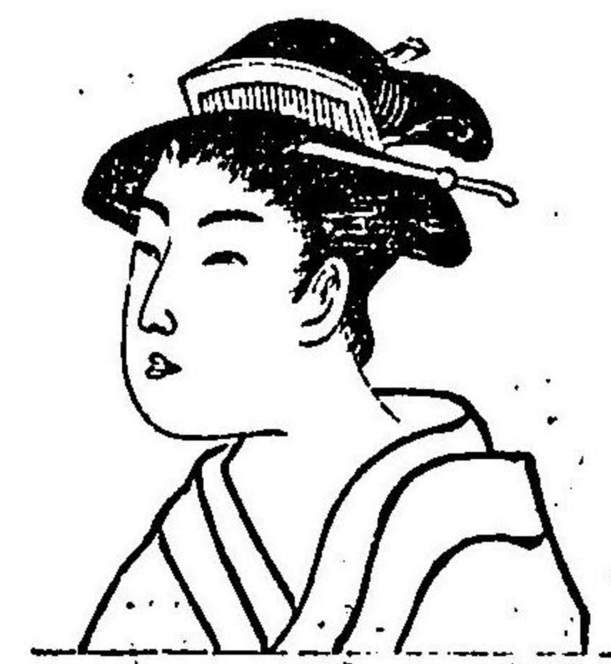
圖 八 第