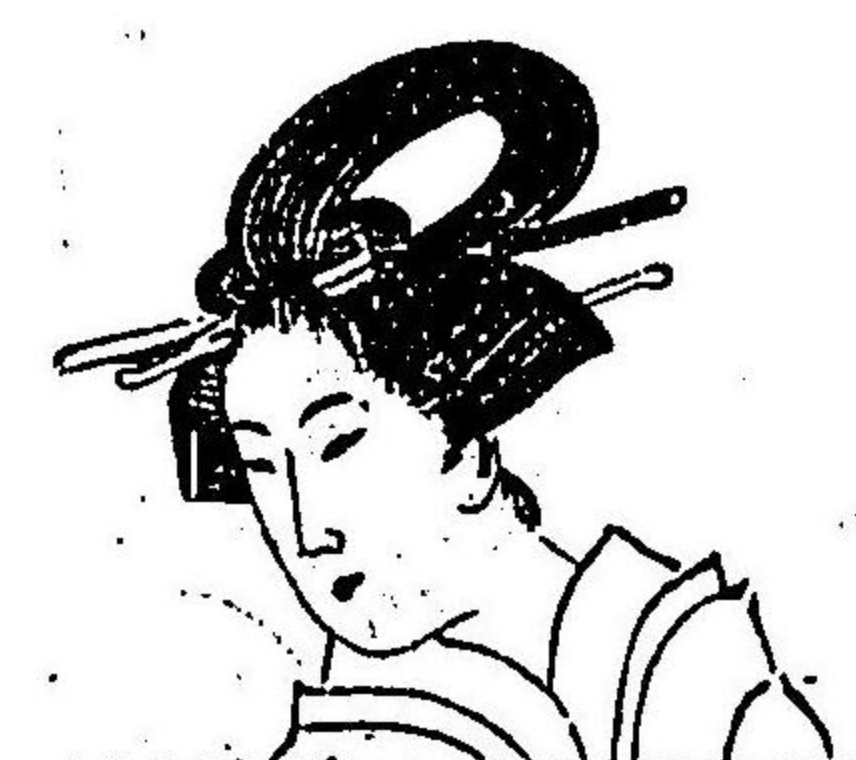
圖 九 第