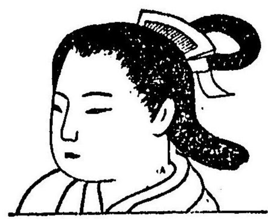
圖 四 第