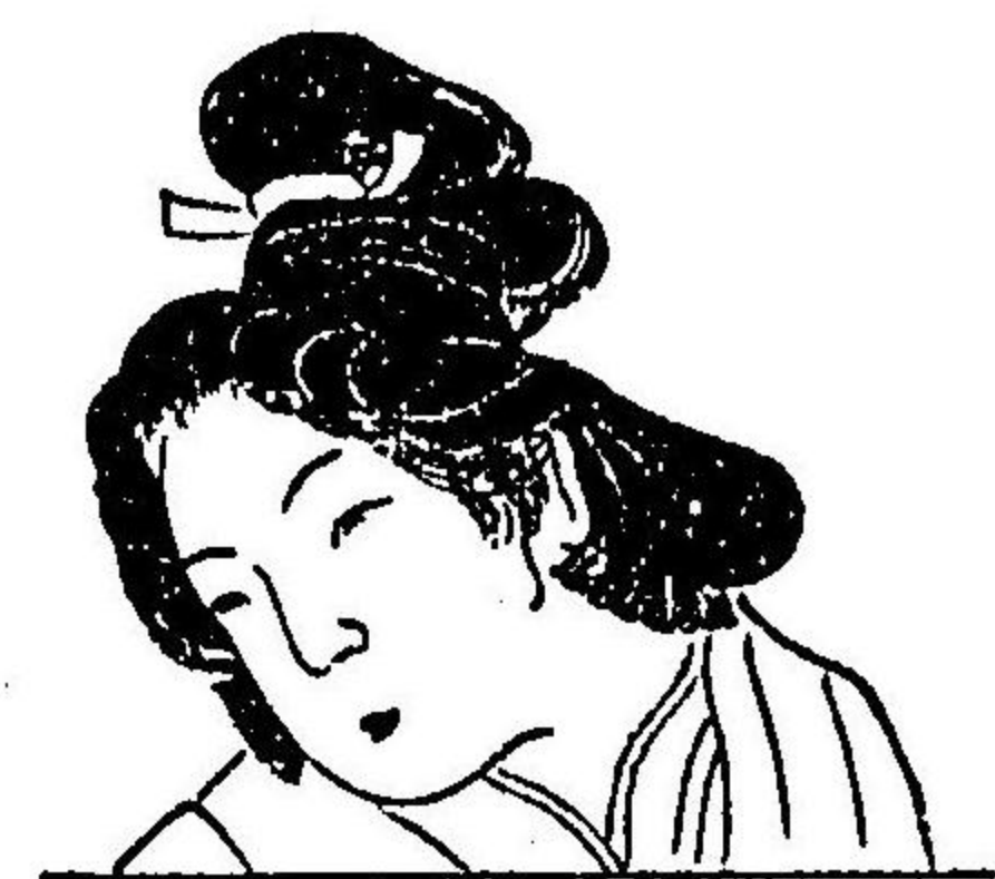
圖 一 第