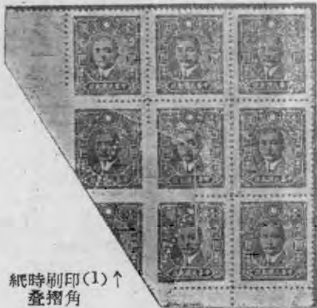
紙時刷印(1) ↑ 疊摺角

等膠就了工印回紙型，滾版布，的含趁，版，候將，出洗淨，將錫版和附着的銅版分成二塊，這銅版 工和是，作刷版上在油筒機，蓋版有潮吸模使滿飽所，（二）印刷的條都，鍍過鋼的版模和模一 作打上接完是票於郵墨轆的經以模油覆乾裏不油含的（三）印刷，鏤下過去，於平面上，模一 。齒背着成告的是票被過鐵回純上墨在，都措墨油，飽及，回縫復將筒滾過，的使於平面上，模一 可付印了。（印刷全張板模）面上如再鍍一層極薄的銅，銅便