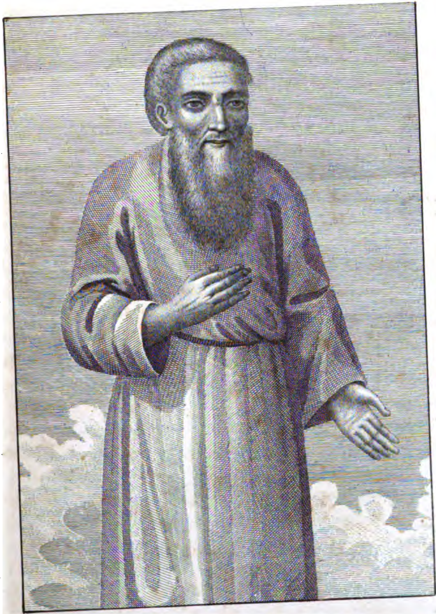
• СТАРЕЦЪ ДАНИЛЪ.