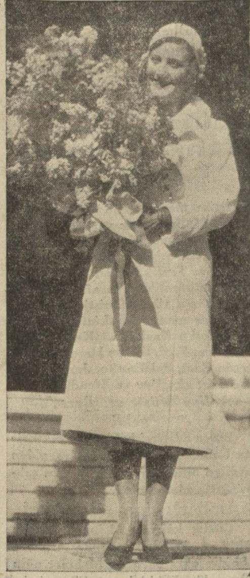
Kraliçe, gazetemizin verdiği buketle beraber

Gazetemiz erkânı tahririyesi, Kraliçenin aile ve akrabaları, ve chibbası daha vapur rıhtıma yanaşırken mendiller sallıyarak