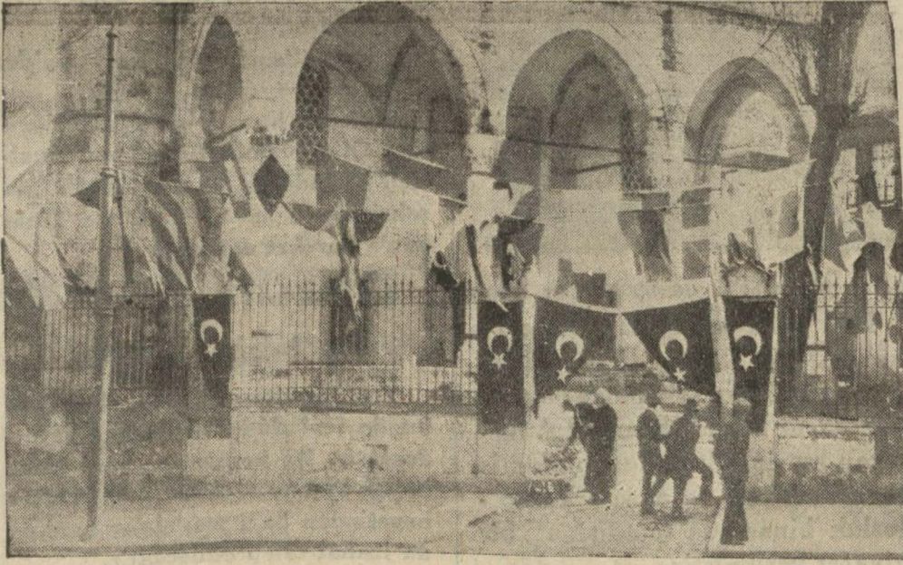
Mahmutpaşa camii avlusunda hazırlanmakta olan intihap mahallı

Müntehibi sani intihabatı bu sabah başlayacak ve cuma akşamı bitecektir