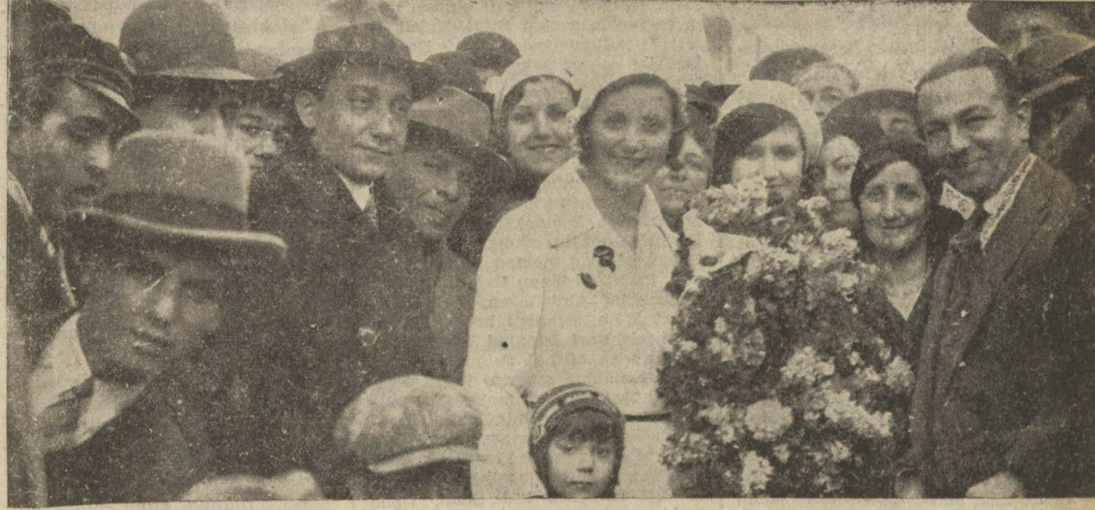
Kraliçe Galata Rıhtımında müstakbilin arasında

Kraliçe diyor ki: «Mis Türki her yerde muhabbetle karşılandı, milletimi şerefle temsil ettiğimden mes'udum.»