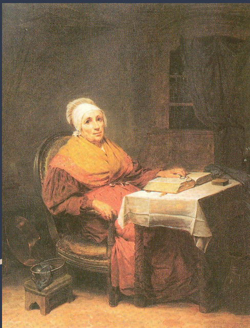
Läsande gumma, de Robert Wilhelm Ekman (1838)