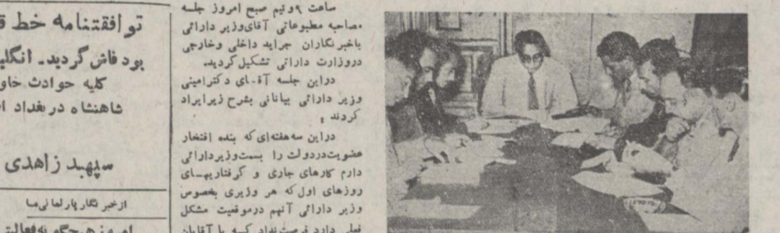
آقای دکتر امینی وزیر دارائی در جلسه مصاحبه مطبوعاتی امروز رئیس جمهوری و وزیر خارجه امریکا در مذاکرات طولانی خویش در باب مسائل مهم المللی در باره موقیعت فعلی ایران مشاوره نمودند

ساعت ۹ و نیم صبح امروز جلسه مصاحبه مطبوعاتی آقای وزیر دارائی با خبرنگاران جراید داخلی و خارجی دوزارت دارائی تشکیل گردید. در این جلسه آقای دکتر امینی وزیر دارائی بیاناتی بشرح زیر ایراد کردند: در این سه هفته ای که بنده افتخار عضویت در دولت را بدست وزیر دارائی دارم کارهای جاری و گرفتاریهای روزهای اول که هر وزیر بیخوسون وزیر دارائی آنها بد موقیعت مشکل نقلی دارد فرستاده که با آقایان بقیه در صفحه چهارم