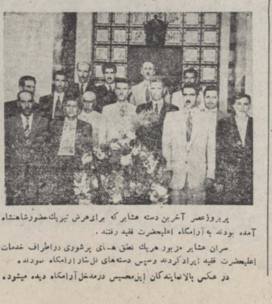
پر بروز عصر آخرین دسته هشار که برای عرض تبریک حضور شاهنشاه آمده بودند به آرامگاه علیحضرت فقید رفتند...