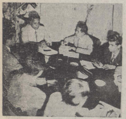
آقای دکتر سید امامی معاون وزارت بهداشتی در مصاحبه با خبرنگاران پاسخ میدهد

معاون وزارت بهداشتی در مصاحبه با خبرنگاران جراید گفت هر کس بدون داشتن پروانه رسمی پزشکی بداروسازی و دندان پزشکی و مامائی اشتغال ورزد بعین تادیبی از ششماه تا سه سال و پرداخت غرامت از ده هزار تا دویست هزار ریال محکوم خواهد شد وزارت بهداشتی مبارزه بر علیه بیماریهای آمیزشی را شروع کرده است