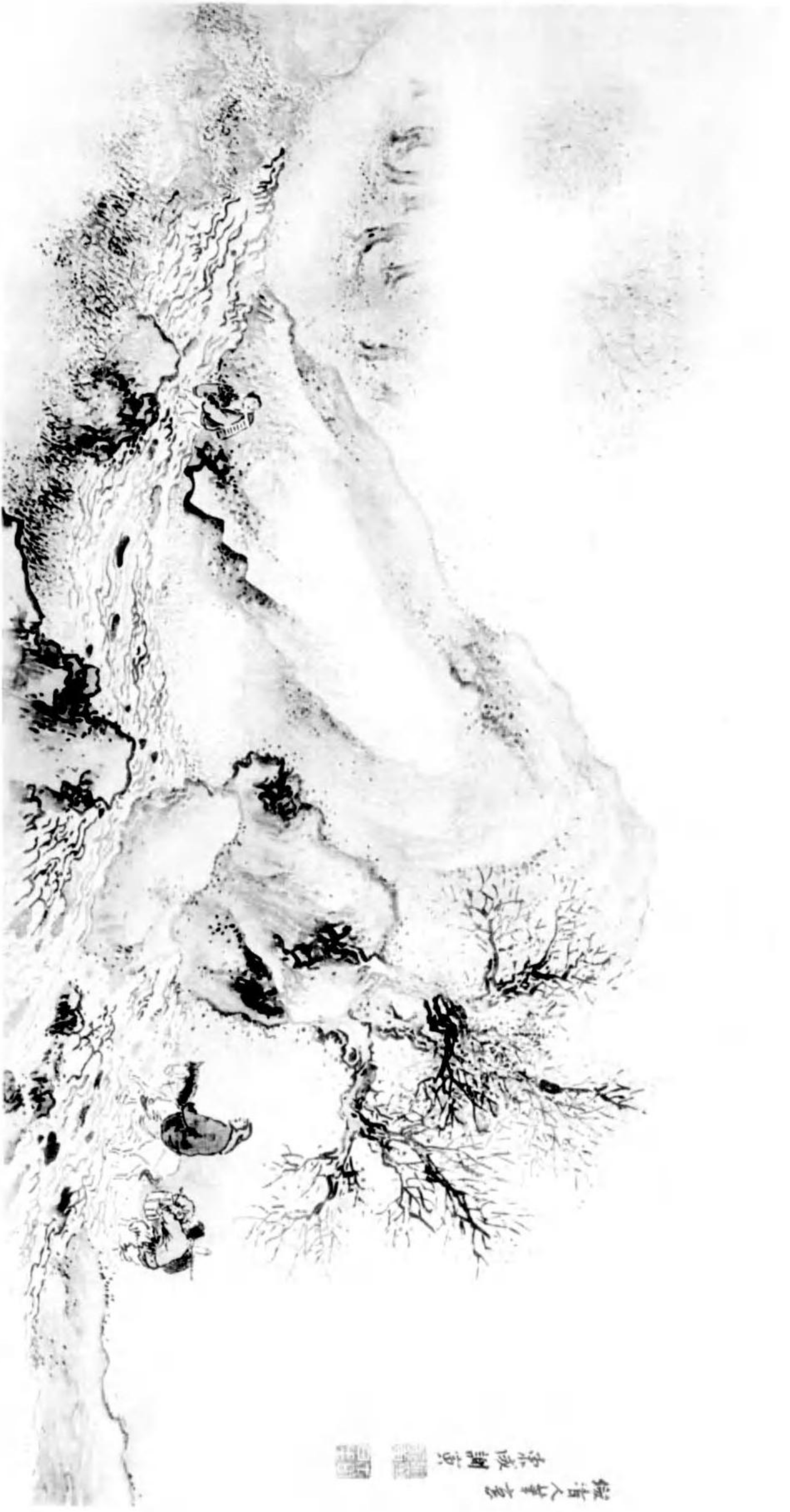
經百人字 宋成謝真