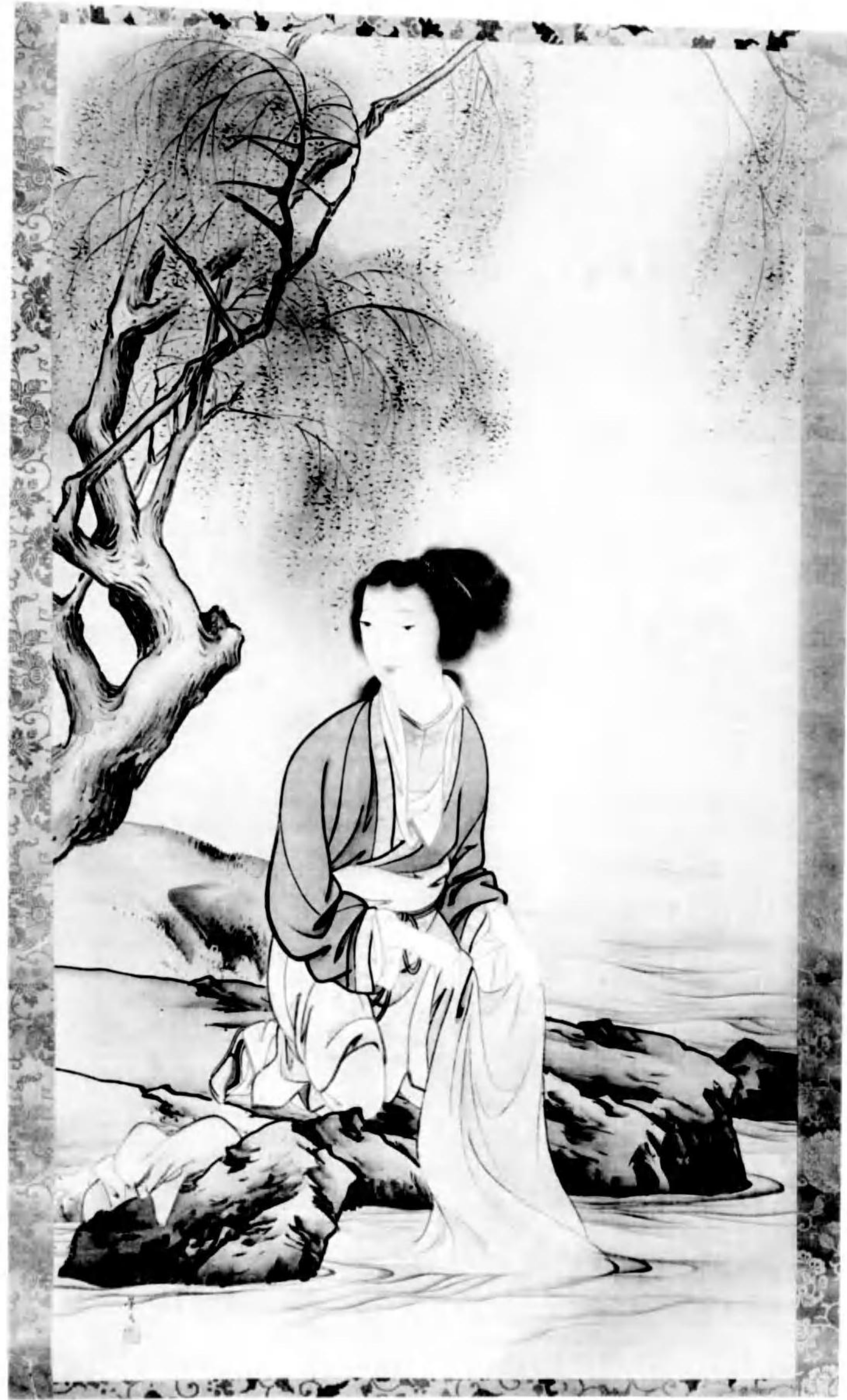
Illustration of a woman in traditional Japanese attire sitting on a rock by a stream, with a willow tree on the left.