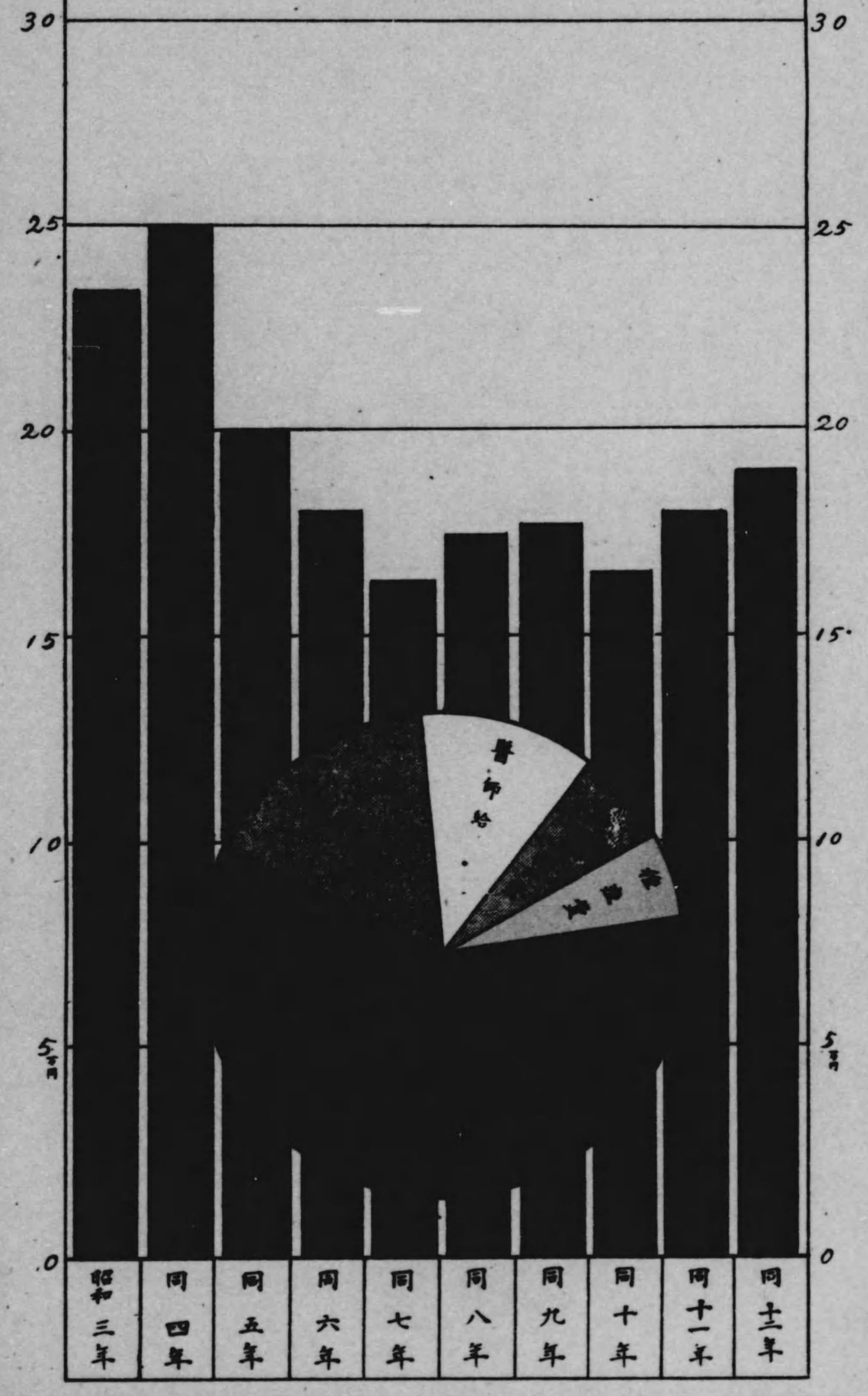
市町村衛生費累年比較 (決算)