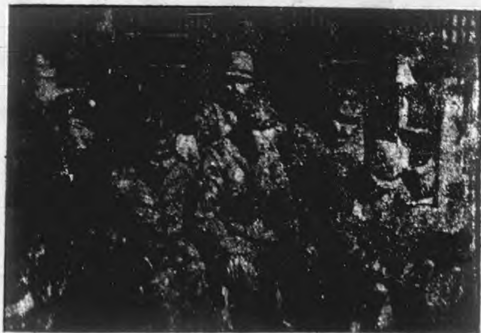
▲留在察冀邊區之俘虜之一部