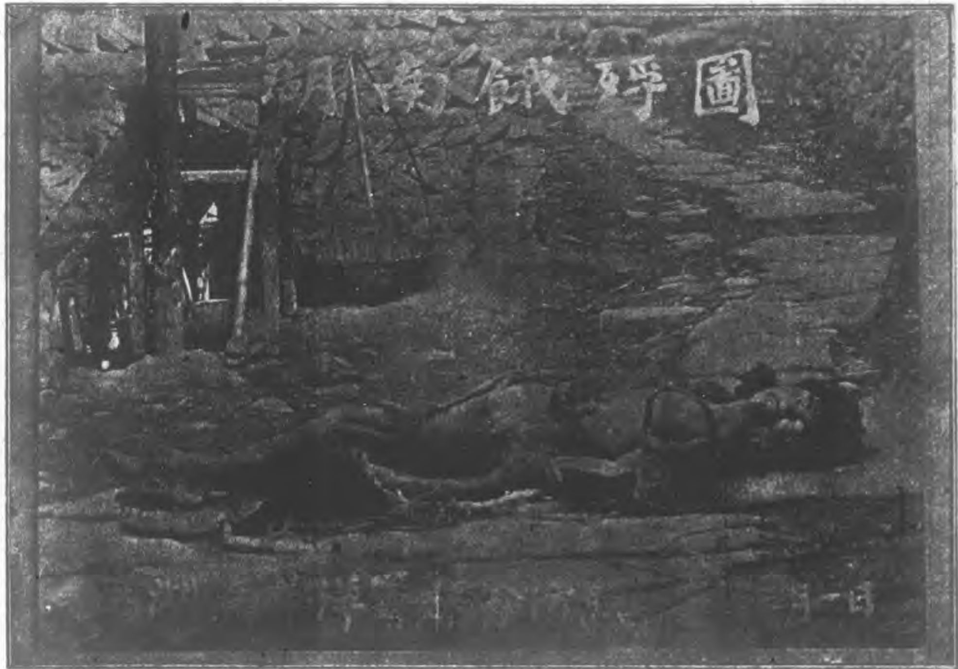
圖 碑 餓 海