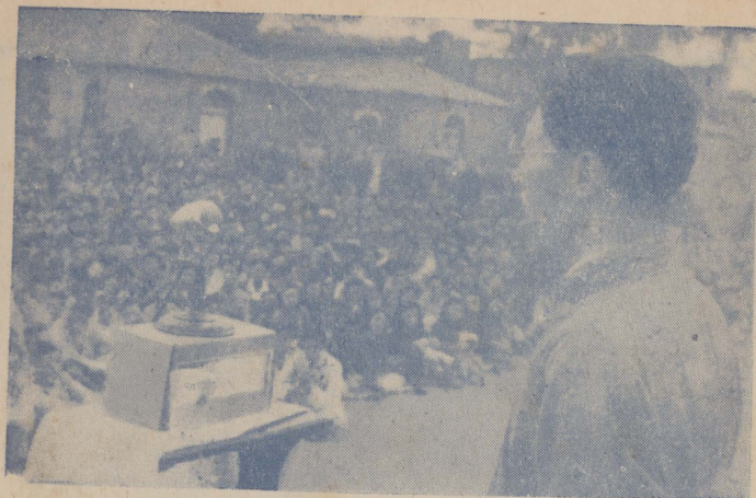
講演生學向生先多一聞