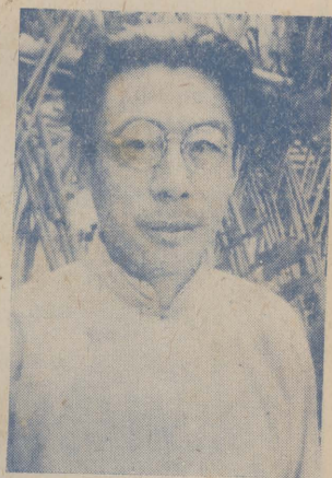
↑像的生先多一聞後利勝