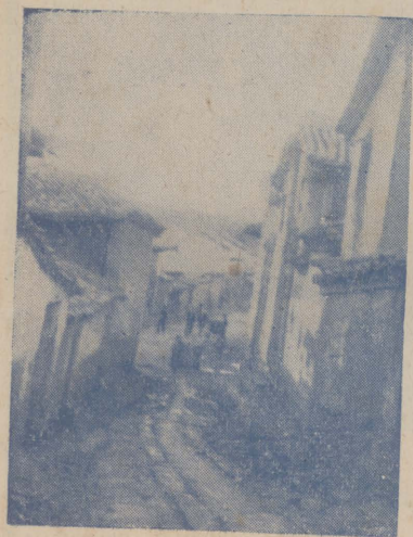
←坡院學的難遇生先聞