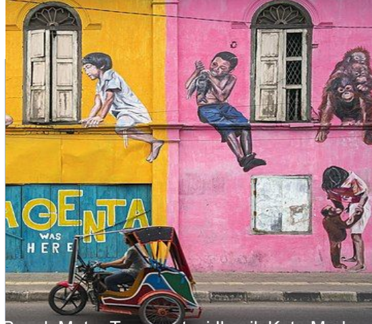
Becak Motor Transportasi Ikonik Kota Medan