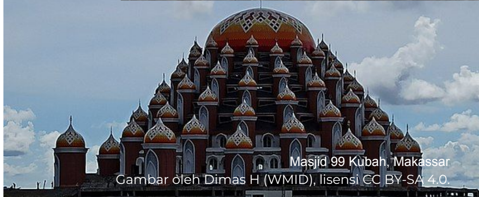
Masjid 99 Kubah, Makassar