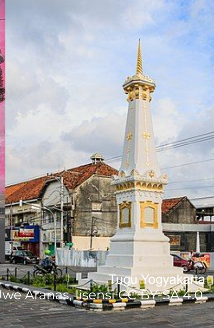
Tugu Yogyakarta