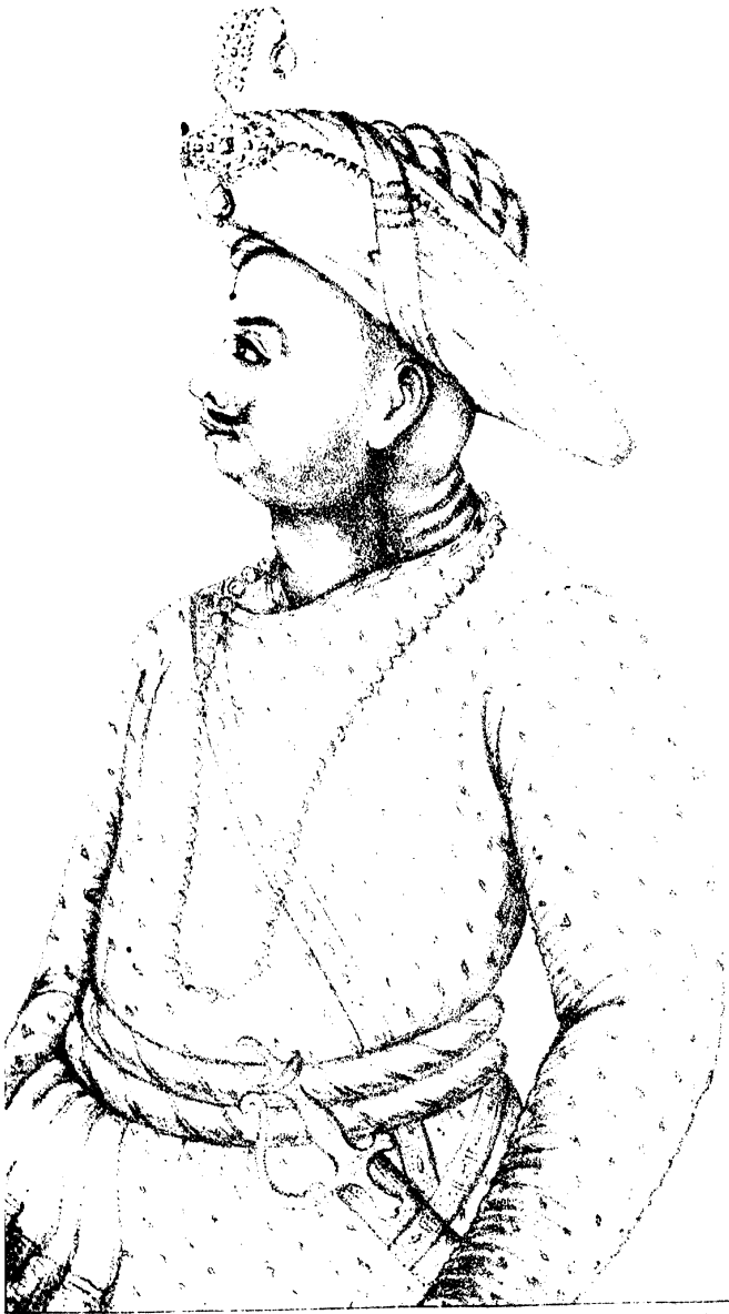
Drawn by Pellicci TIPPOO SULTAUN. by C. V. Kishkince