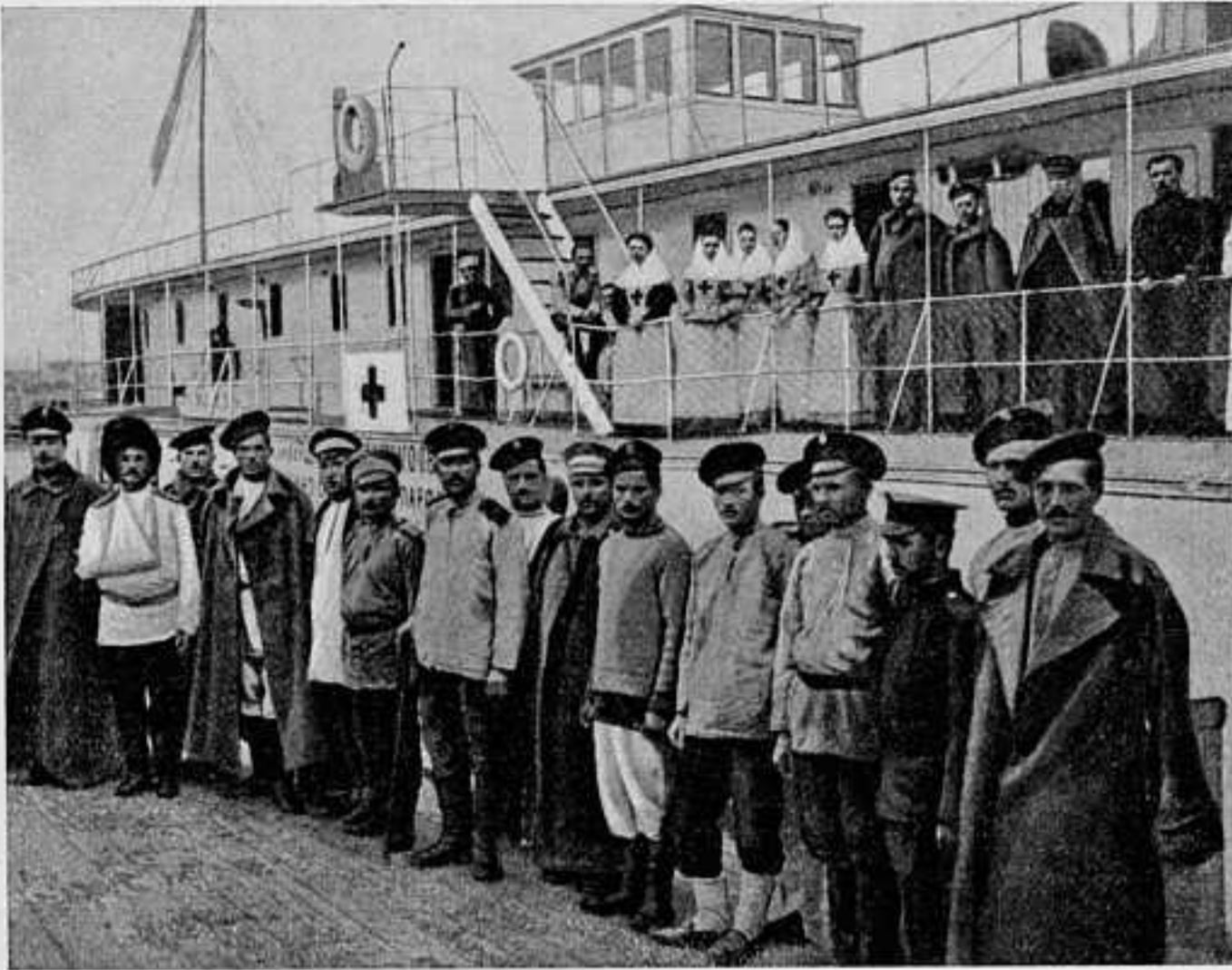
ПРИБЫТІЕ РАНЕННЫХЪ НА ПАРОХОДЪ «НОВИКЪ» ВЪ НИЖНІЙ-НОВГОРОДЪ.

патроны. Съ нашей стороны ранены 4 нижнихъ чина и одинъ пропалъ безъ вѣсти, а противникъ потерялъ до 20 человекъ убитыми и ранеными.