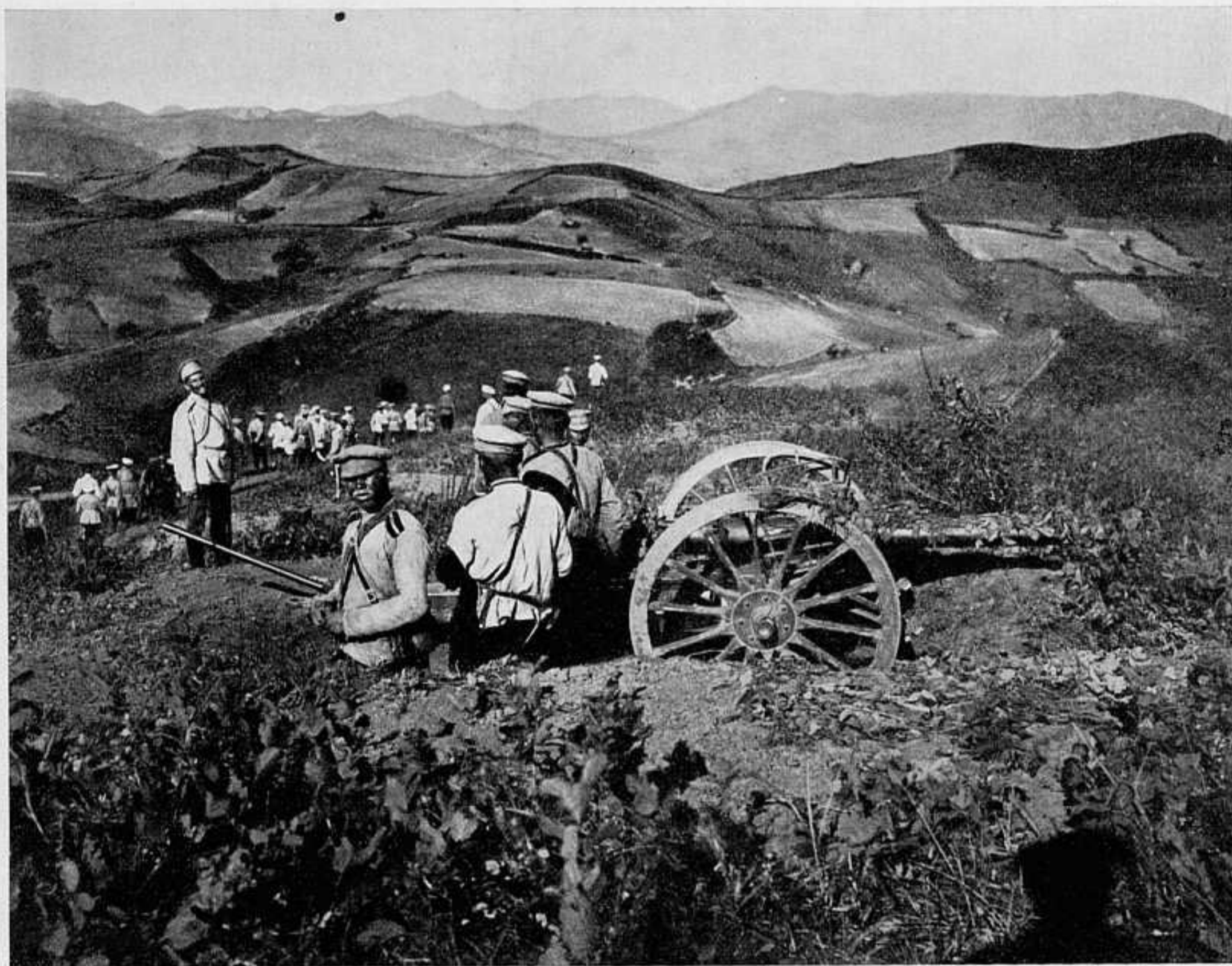
ОРУДІЕ НА ПОЗИЦИ ПЕРЕДЪ БОЕМЪ. съ театра войны.

съ громадными трудностями, потребовалъ чрезвычайныхъ напряженій отъ войскъ. Всѣ обозы были исключительно вьючные, артиллерію можно было имѣть только самого легкаго типа (конно-горную) и въ ограниченномъ количествѣ.