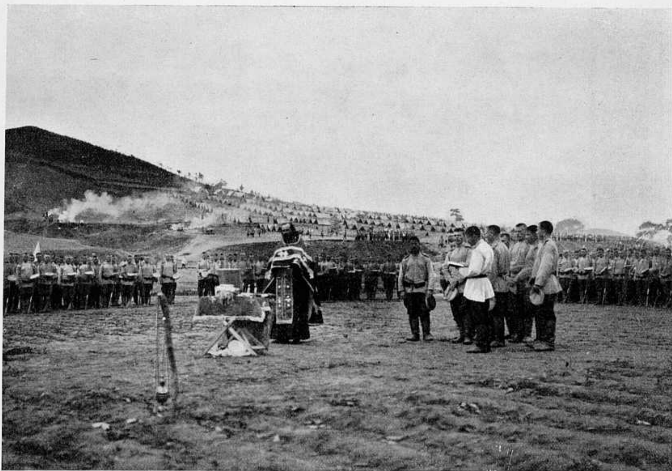
ПАНИХИДА ПО УБИТЫМЪ ВЪ БОЮ НА ДАЛИНСКОМЪ ПЕРЕВАЛѢ.

Непосредственныя послѣдствія осуществленія этой смѣлой, рѣшительной экспедиціи не замедлили сказаться въ политическихъ настроеніяхъ западныхъ державъ. Миротворческая агитація, поднятая во Франціи, сразу затихла. Отношенія къ нашимъ крейсерамъ въ иностранныхъ портахъ приняли приличную, законѣрную, форму. Сознаніе русской силы лучшей регуляторъ нашихъ международныхъ сношеній... Новое ея проявленіе въ образѣ грозной эскадры адм. Рожественскаго дастъ могучій импульсъ разрѣшенію настоящаго конфликта.