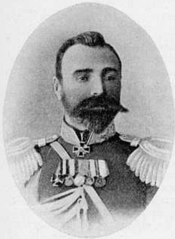
ГЕН.-МАЮРЪ Р. И. КОНДРАТЕНКО. нач. 7-й вост.-сиб. стр. дивизии.