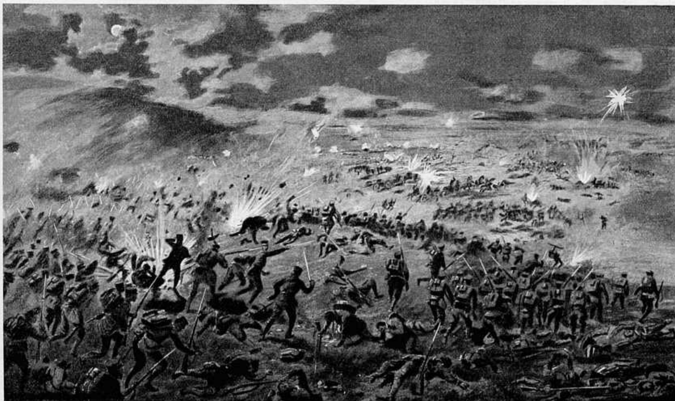
БОЙ ПОДЪ ЛЯОЯНОМЪ. ЯПОНСКІЯ ВОЙСКА АТАКУЮТЪ РУССКІЯ ПОЗИЦІИ.

За 11 сентября въ арміи перемѣнъ не было.