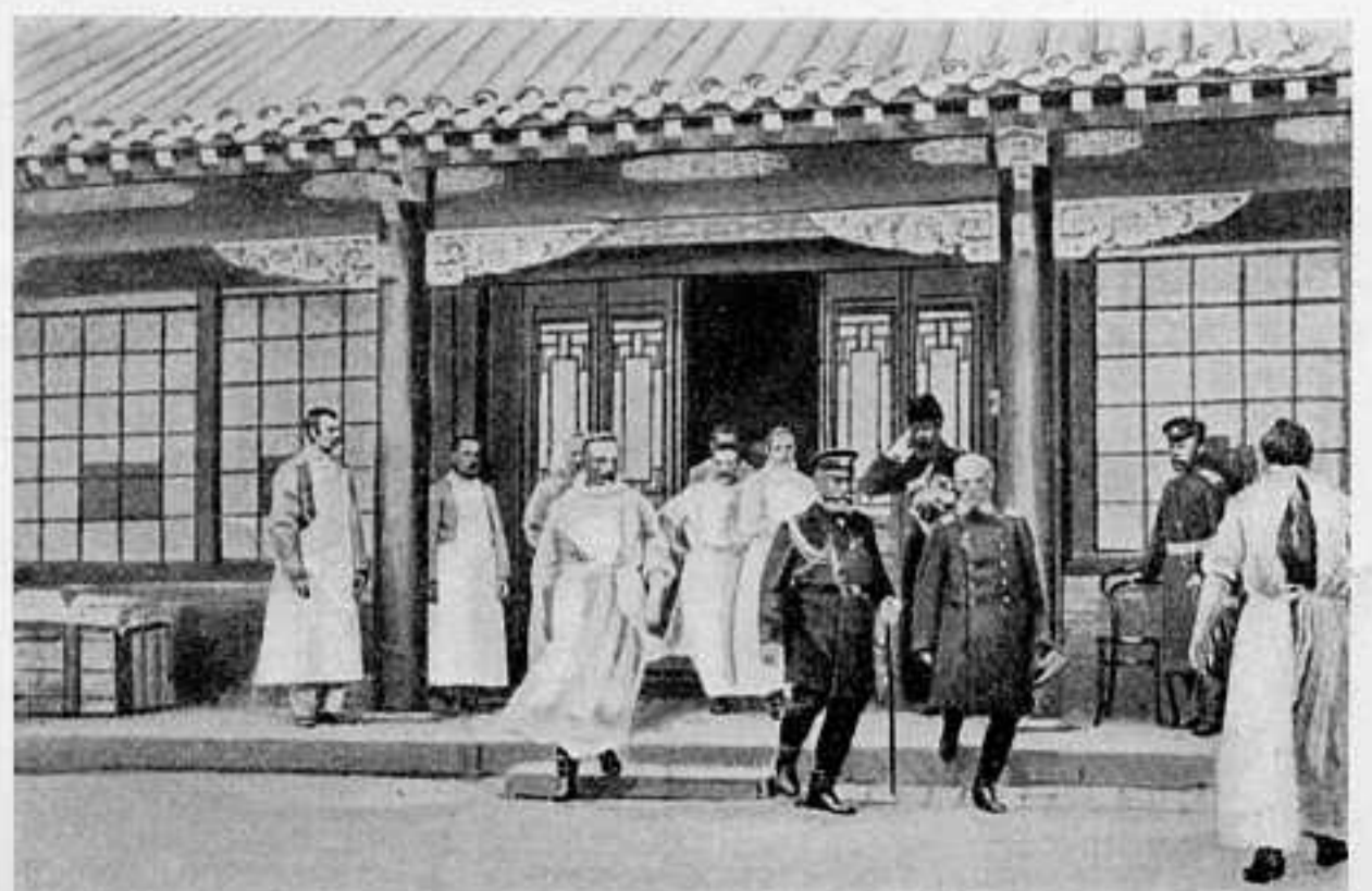
АДМИРАЛЪ АЛЕКСѢЕВЪ ПОСѢЩАЕТЪ ГОСПИТАЛЬ ВЪ МУКДЕНѢ.

Занимая обширную площадь, до 130 верстъ въ длину, Лунганскій хребетъ имѣетъ чрезвычайно дикій видъ, изобилуя расщелинами,