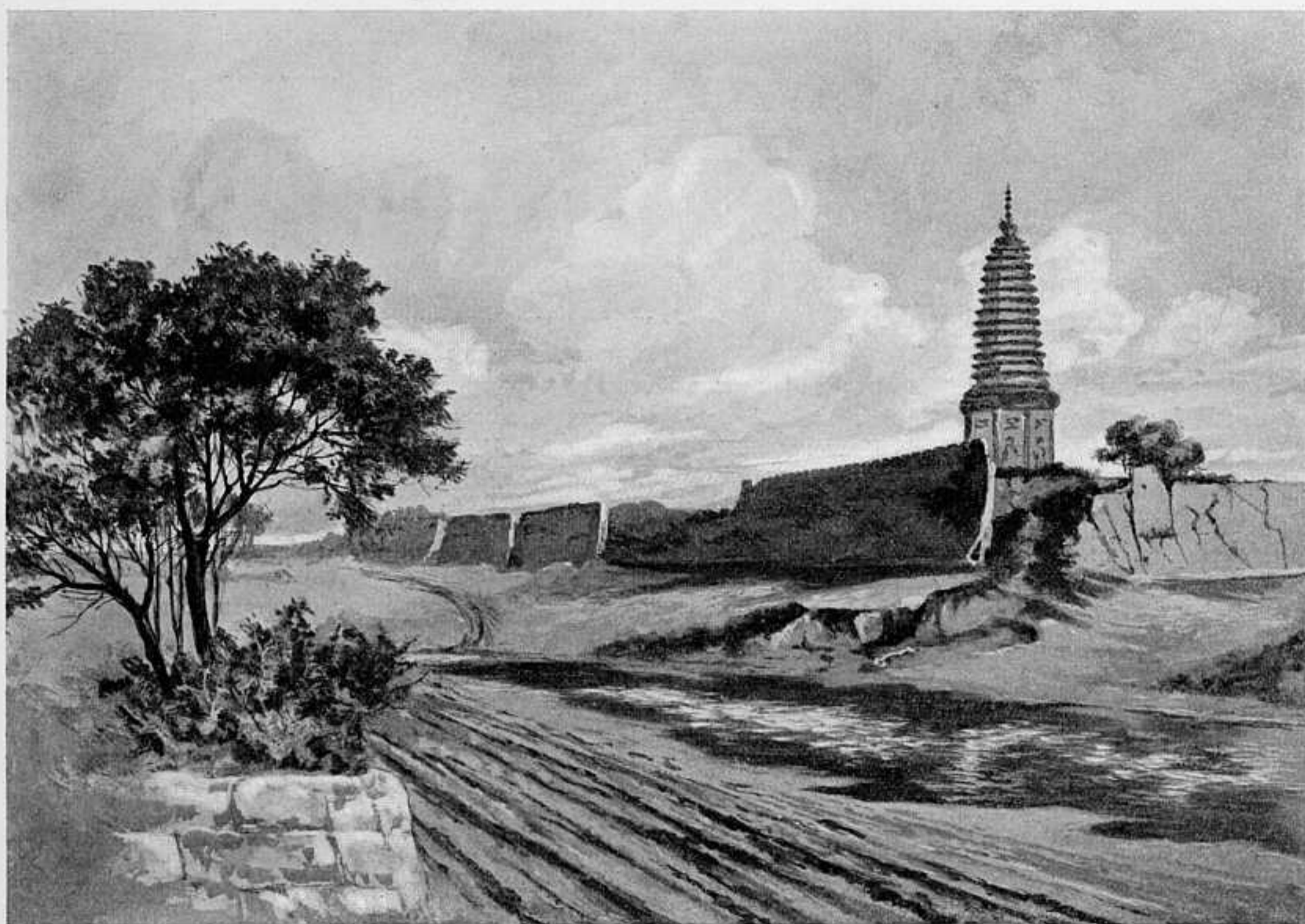
ГОРОДЪ ТЕЛИНЪ. РИС. А. ЛЕО. СОБСТВЕННОСТЬ «ЛѢТОПИСИ».

побѣдамъ полками и въ послѣдній разъ преподаль имъ свои завѣты: «глупо бить всѣмъ фронтомъ равно, нужно хорошо бить въ одномъ мѣстѣ, въ другихъ сами побѣгутъ... Усиленно стойте за то, чтобы не дробили дивизіи... Подтягивайте резервы». Завѣты эти дивизія понесетъ съ собой на Маньчжурской театрѣ, равно какъ и память о Дунаѣ и Шипкѣ.