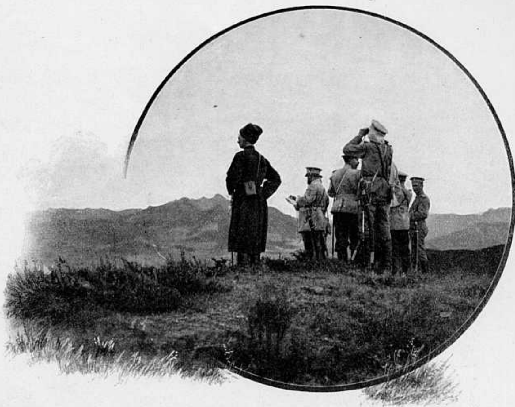
ГЕН.-АДЪЮТ. А. Н. КУРОПАТКИНЪ СО СВОИМЪ ШТАБОМЪ ОСМАТРИВАЕТЪ ПОЗИЦИИ.

Хребетъ Далинь и его отроги въ общемъ являются проходимыми во мно-