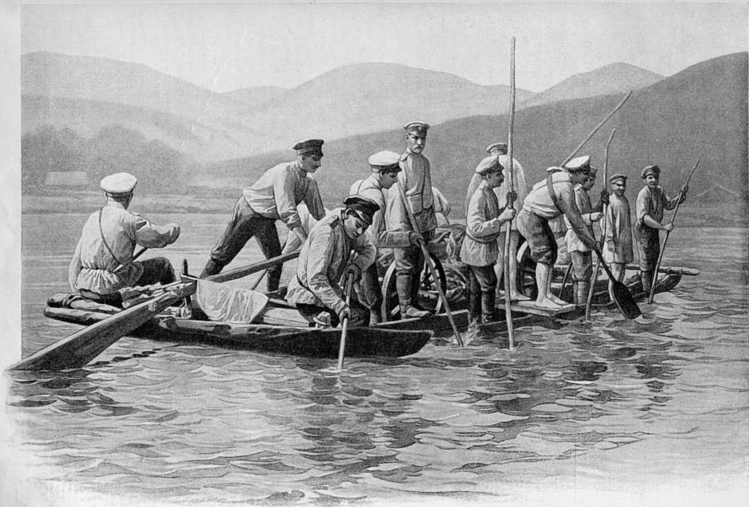
ПЕРЕПРАВА КАЗАКОВЪ КОННО-ГОРНОЙ БАТАРЕИ ЧЕРЕЗЪ Р. ТАИТЕХЕ ОКОЛО ДЕР. МИНЗЫ.

ПО ФОТОГР. ГЕНЕР. П. РЕННЕНКАМПА, РИС. ХУД. М. ДАЛЬКЕВИЧА. СОБСТВ. «ЛЪТОПИСИ».