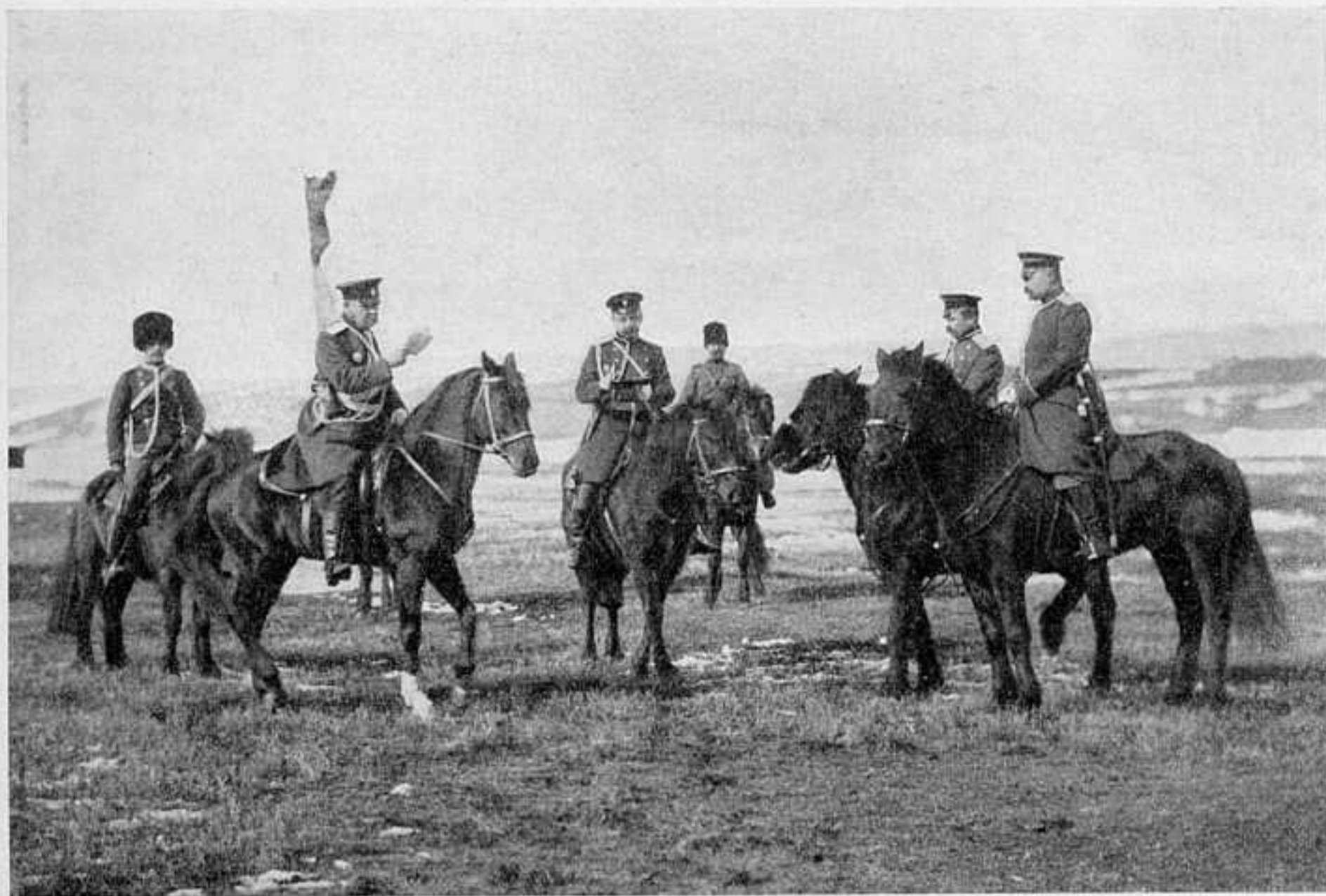
КОМАНДУЮЩІЙ ЗАБАЙКАЛЬСКОЙ КАЗ. ДИВ. ГЕН.-ЛЕЙТ. П. К. ФОНЪ-РЕННЕНКАМПФЪ СО СВОИМЪ ШТАБОМЪ.

считываетъ до 30—50 т. жителей, имѣеть большое торговое значеніе.