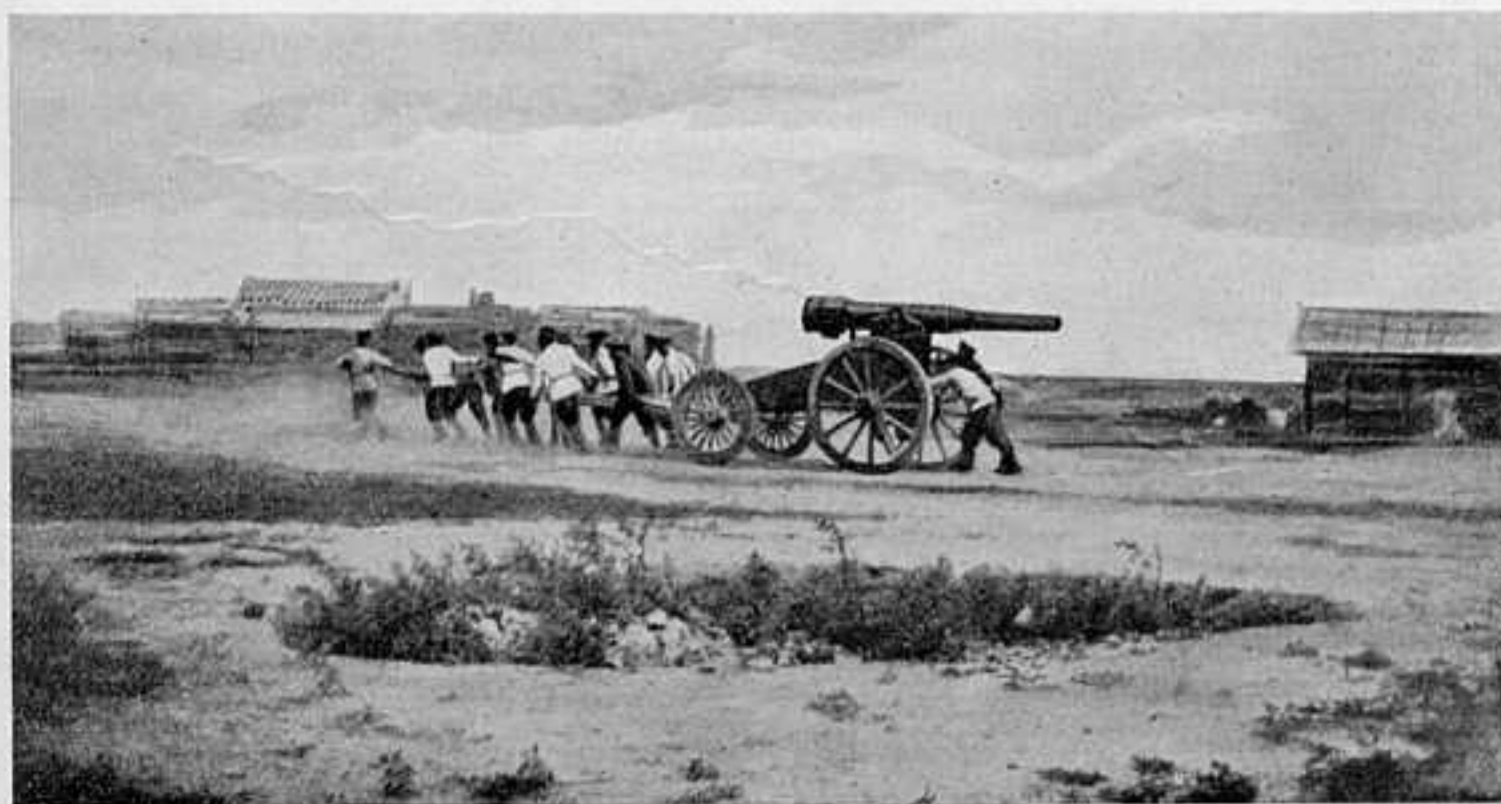
ВЫВОЗЪ ОРУДІЙ СЪ ПОЗИЦІЙ ПРИ ВЫСТУПЛЕНІИ ИЗЪ ЛЯОЯНА.