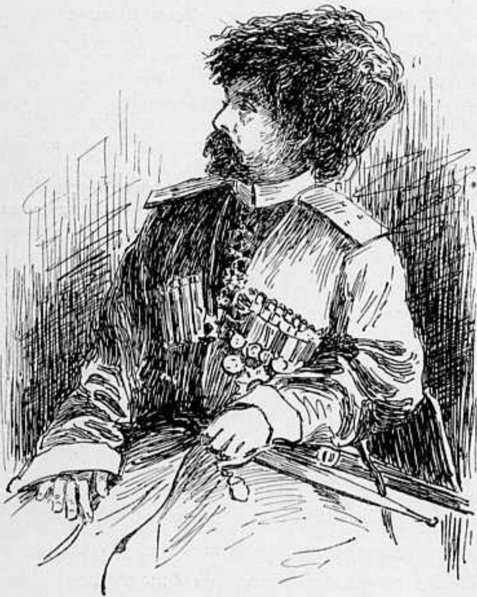
ГЕНЕРАЛЪ-МАЮРЪ КНЯЗЬ Г. И. ОРБЕЛИАНИ.

НАЧАЛЬНИКЪ КАВКАЗСКОЙ КОННОЙ БРИГАДЫ, ОТПРАВИВШІЙСЯ 8 ІЮНЯ НА ТЕАТРЪ ВОЕННЫХЪ ДѢЙСТВІЙ.