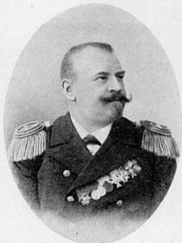
КАПИТ. II РАНГА А. И. БЕРЛИНСКІЙ. Командиръ транспорта «Лена».