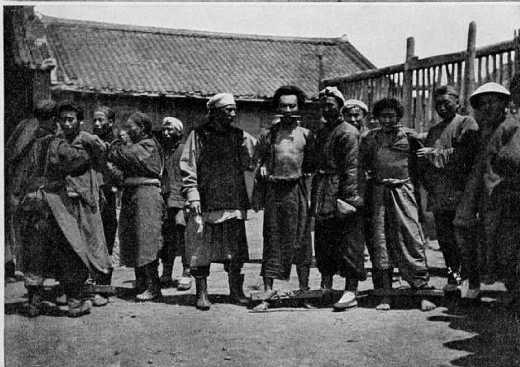
ХУНХУЗЫ ПЕРЕДЪ КАЗНЬЮ.

русскихъ военноплѣнныхъ, взятыхъ послѣ 23 юля. Всего въ списокъ внесено 161 человѣкъ.