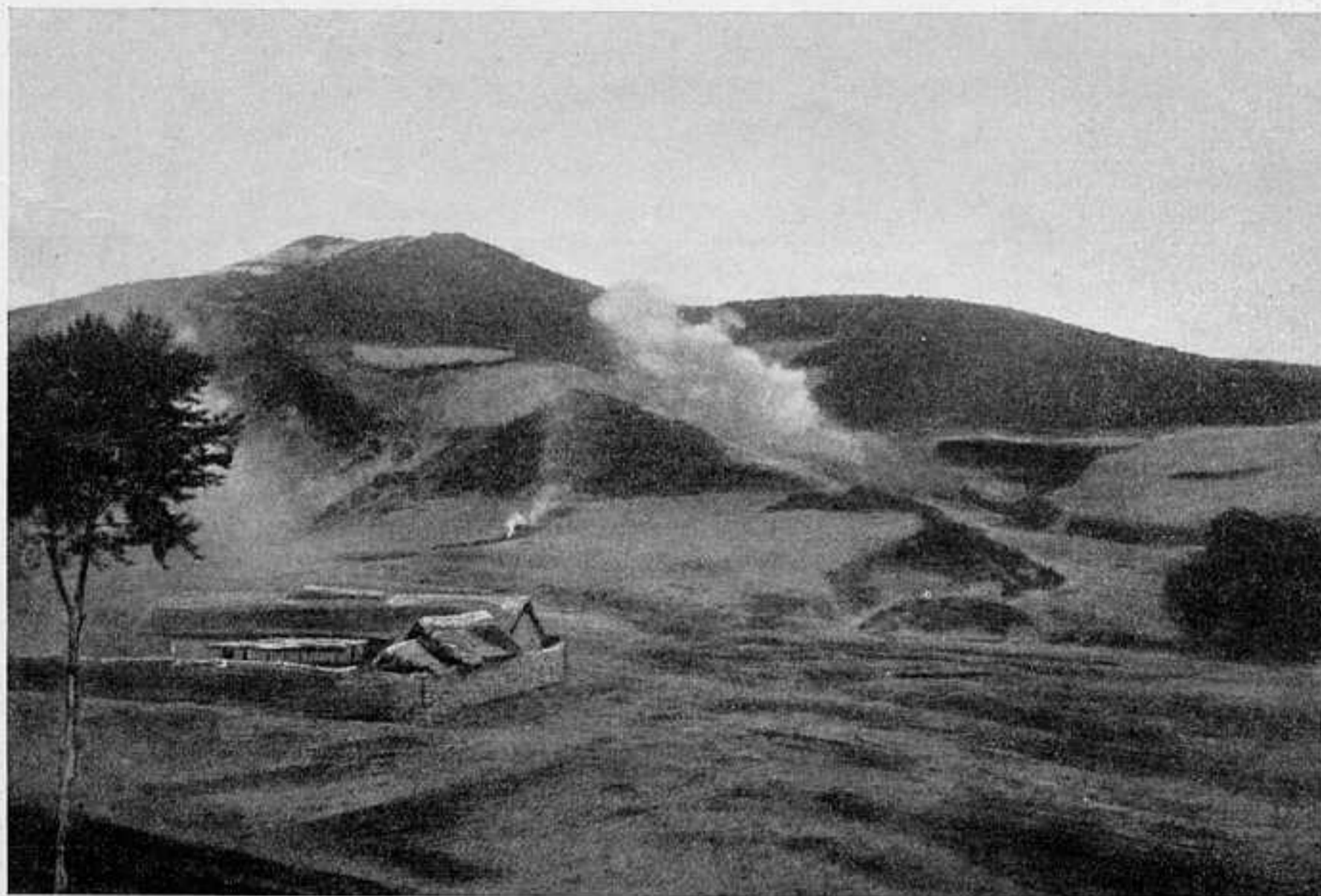
ОБЩІЙ ВИДЪ БОЯ НА ДАЛИНСКОМЪ ПЕРЕВАЛѢ 14 ІЮНЯ.

СЪ ФОТОГРАФИИ В. БУЛЛА, СЪ ТЕАТРА ВОЙНЫ.