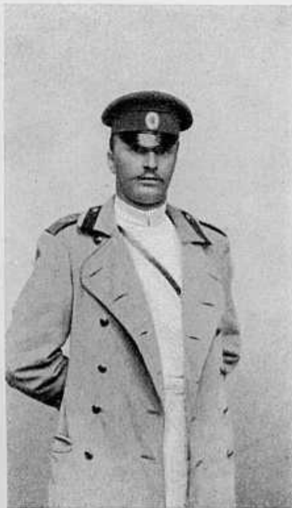
ШТАБСЪ-КАПИТАНЪ 137-ГО ПѢХОТН. НѢЖИНСКАГО ЕЯ ИМП. ВЫС. ВЕЛИКОЙ КНЯГИНИ МАРИИ ПАВЛОВНЫ ПОЛКА

Сторожевыя части противника за послѣдніе дни приближались къ перевалу Каутулинъ 1) , но занять его имъ не удалось вслѣдствіе противодѣйствія, оказаннаго нашимъ передовымъ отрядомъ. На южномъ фронтѣ противникъ пока держится пассивно, ежедневно происходятъ перестрѣлки и стычки на передовыхъ постахъ.