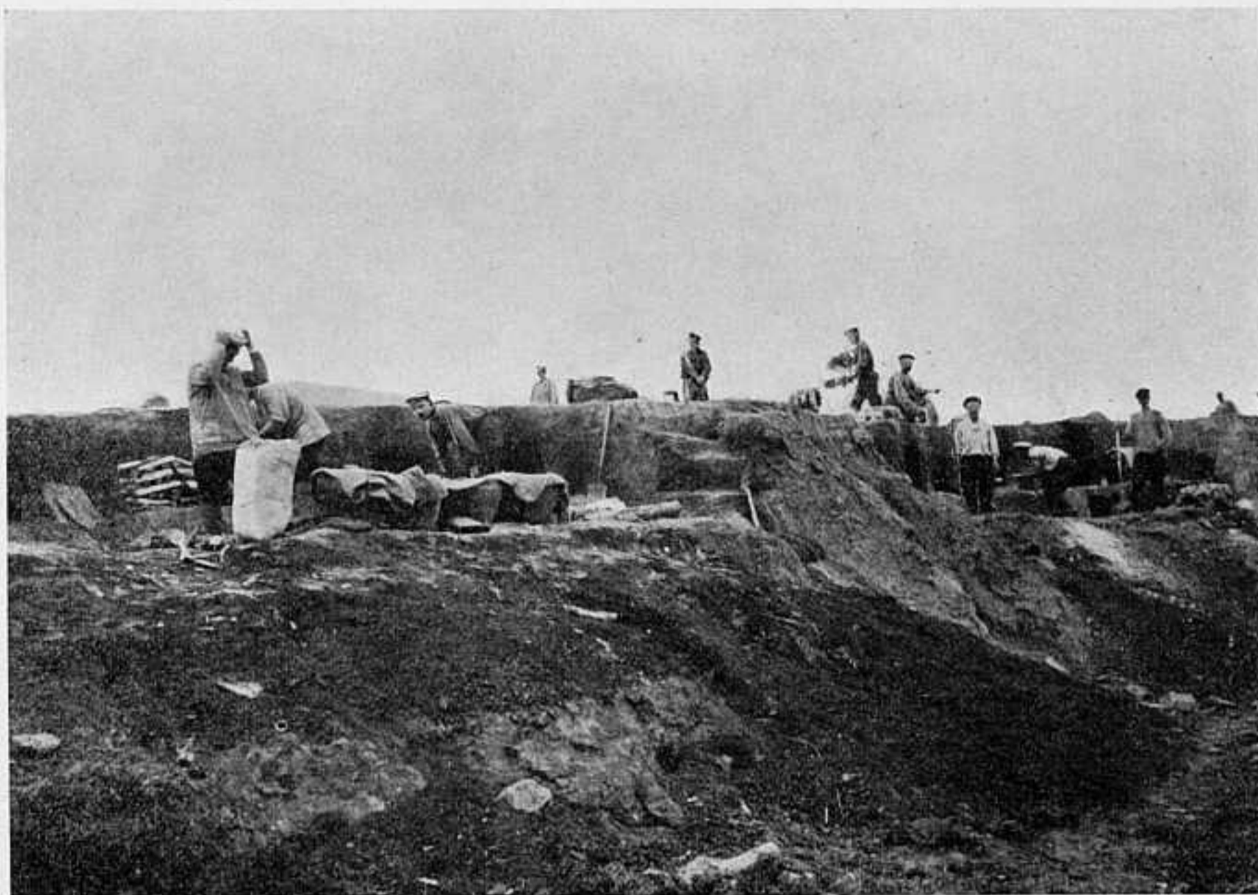
ОКОПЫ НА ПОЗИЦІЯХЪ. съ театра войны.

Г. Телинъ лежитъ на рѣкѣ Чайхе, въ наиболѣе узкомъ мѣстѣ долины Ляохе; онъ является важнѣйшимъ узломъ района, на-