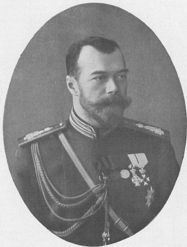
Его Императорское Величество Государь Императоръ НИКОЛАЙ АЛЕКСАНДРОВИЧЪ Самодержецъ Всероссійскій.