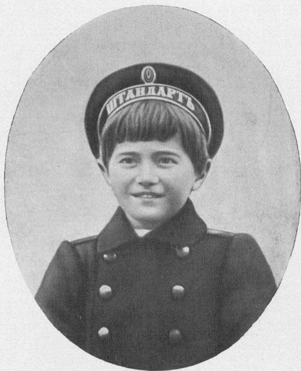
Его Императорское Высочество Наслѣдникъ ЦЕСАРЕВИЧЪ и ВЕЛИКІЙ КНЯЗЬ АЛЕКСѢЙ НИКОЛАЕВИЧЪ.