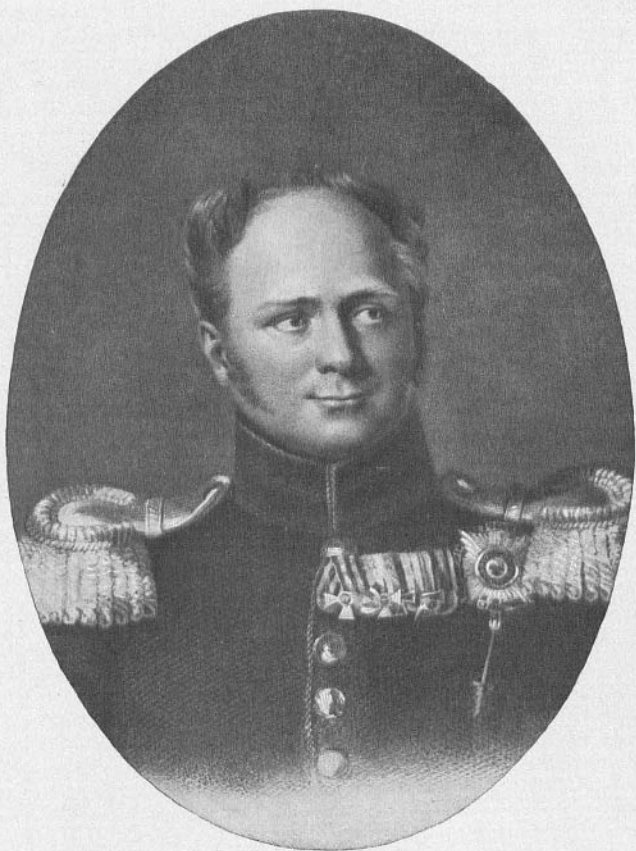
ИМПЕРАТОРЪ АЛЕКСАНДРЪ I ПАВЛОВИЧЪ 1801—1825.