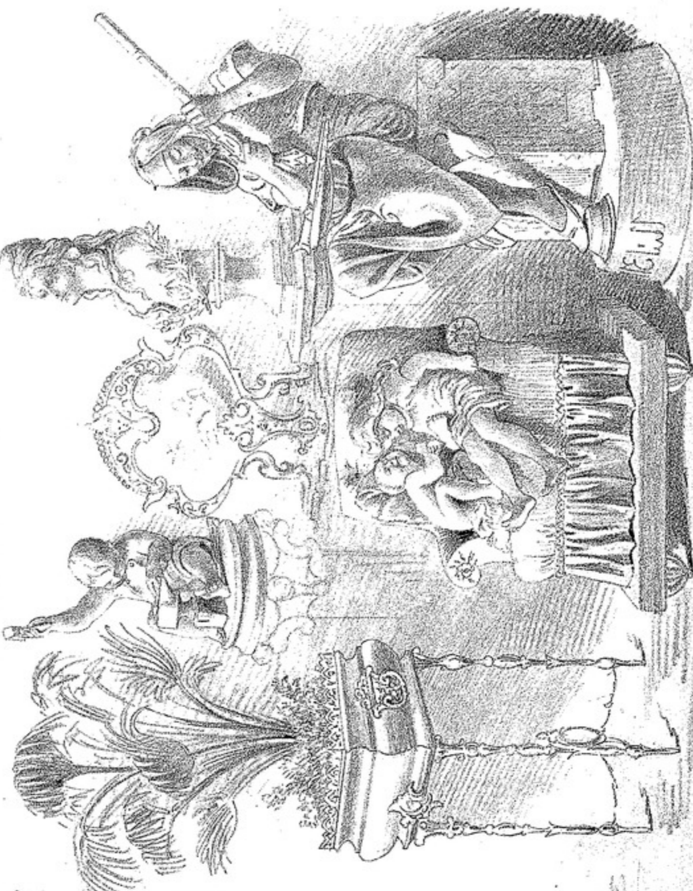
Recomendamos a nuestros lectores el magnifico surtido de objetos de arte, bronce, terracotas, muebles, objetos de fantasía, etc., puesto en exposicion por la casa LACOSTE, PERU y sobrinos sus deheros hermanos Buisser.