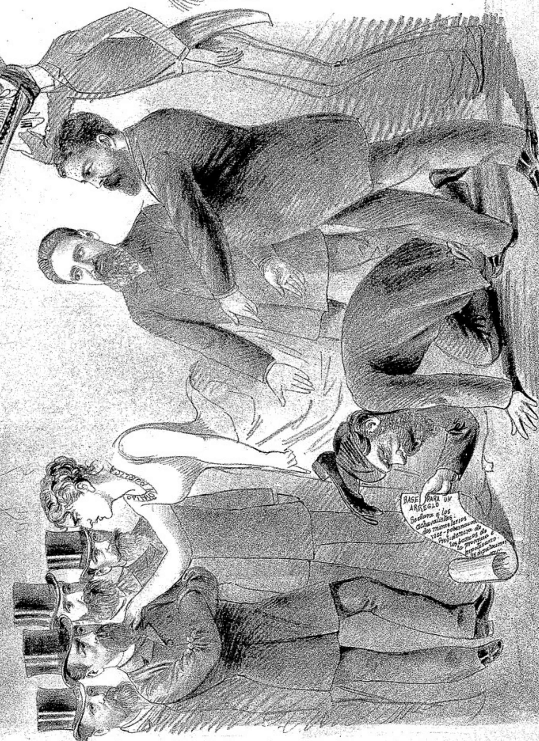
DEL VALLE y COPROSTIACA. — Bueno, Dn. Máximo, ¿ha pensado la parvita; venimos a proponerle un arreglo. OPINION PUBLICA. — Máximo, nada de arreglo, has triunfado; curatele el zorro que se arrastra, venrás a los pies.