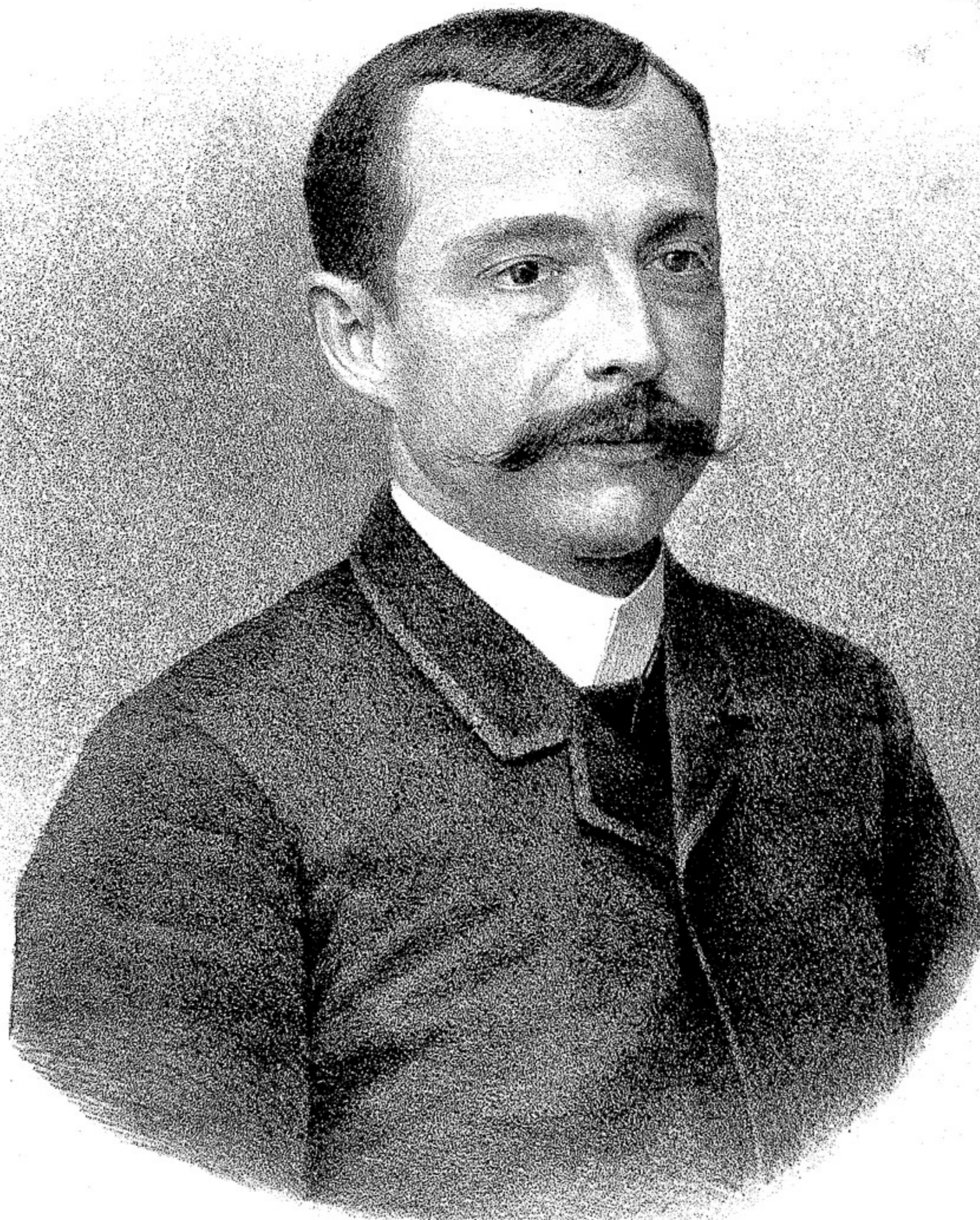
DOCTOR DON JOSÉ MARÍA RAMOS MEJÍA DIRECTOR GENERAL DE LA «ASISTENCIA PÚBLICA»