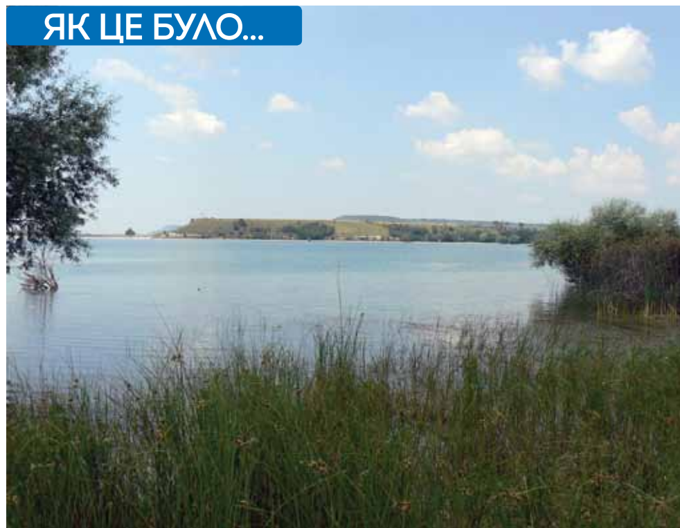
Найстаріше кримське водосховище – Альмінське

Перше велике промислове водосховище – Альмінське було збудовано упродовж 1929 (перша черга) та 1934 років (друга черга). Його загальна місткість становить 6,2 млн м 3 . У 1935 році ввели в експлуатацію Бахчисарайське водосховище, яке живилось водою річки Качі. Для його обла-