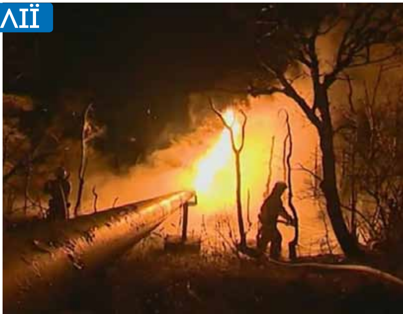
«Диверсія» під Алуштою. 31 жовтня 2017 р.

Сам же Крим, як з'ясувалося, наприкінці четвертого року свого «возз'єднання з батьківщиною»... потерпає і, вочевидь, потерпатиме надалі від браку її сумнозвісного