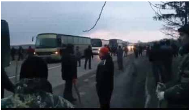
Як було насправді