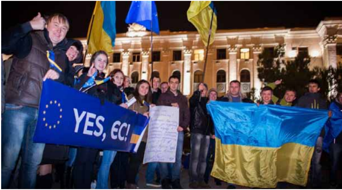
Євромайдан у Сімферополі, 27 листопада 2013 року

російського окупаційного режиму. У 2014 р. брав участь у проукраїнських мітингах у Криму. 16 травня 2014 р. заарештований у Сімферополі за звинуваченням у підпалі офісів «Єдиної Росії» і «Російської общини Криму», підготовці вибуху біля меморіалу Вічного вогню та належності до організації «Правий сектор». 23 травня вивезений до Москви. 25 серпня 2015 р. був засуджений до 10 років позбавлення волі у колонії суворого режиму. Нагороджений орденом «За мужність» I ступеня за особисту мужність і самовідданість, виявлені у від-