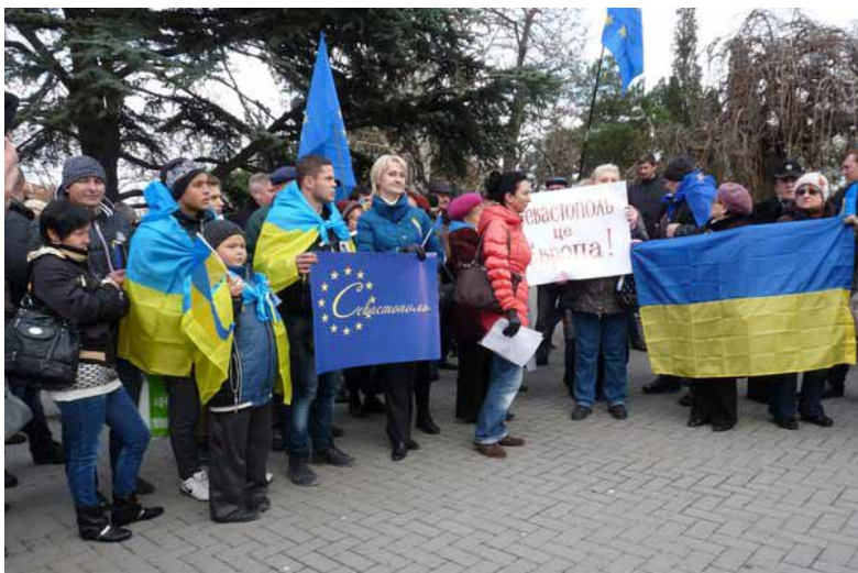
Євромайдан у Севастополі

стоюванні конституційних прав та свобод людини, цілісності Української держави.