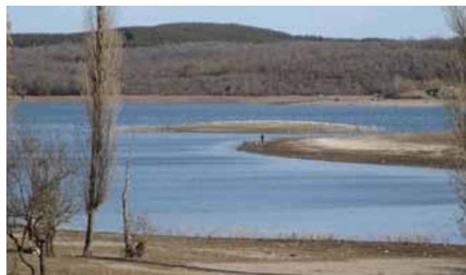
Найбільші на Кримському півострові рукотворні водосховища – Чорноріченське під Севастополем та Сімферопольське

штування обрали балку Егиз-Оба, місткість водосховища майже 7 млн м 3 .