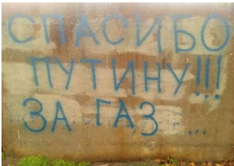
Генічеськ, листопад 2016 р.

газу. Цієї осені у компанії «Роснефть» повідомили, що вперше за всю свою діяльність призупинили на 5 років геологорозвідку та буріння на Південно-Чорноморській ділянці у східній частині Чорного моря через міжнародні санкції та відсутність на ринку бурових суден і обладнання для праці. Ліцензію на проведення робіт компанія мала до 10 листопада 2040 р., а до 2022 р., згідно з зобов'язаннями, мала пробурити на вказаній ділянці дві свердловини. З огляду на цю обставину дещо недоречно лунають обіцянки провести газогін на півострів з російської території.