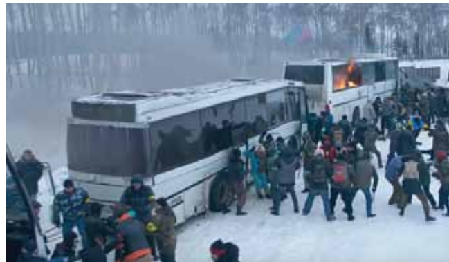
Кадри з фільму

ревіруючих» сфотографувати на телефон...».