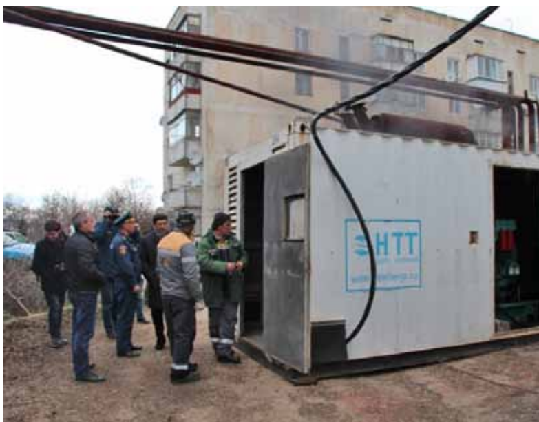
Встановлення дизель-генератора. Крим, 2015 р.