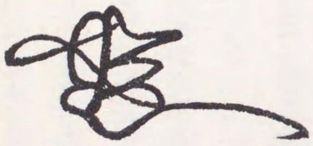
○五條文書 (筑後) 七月廿八日書狀