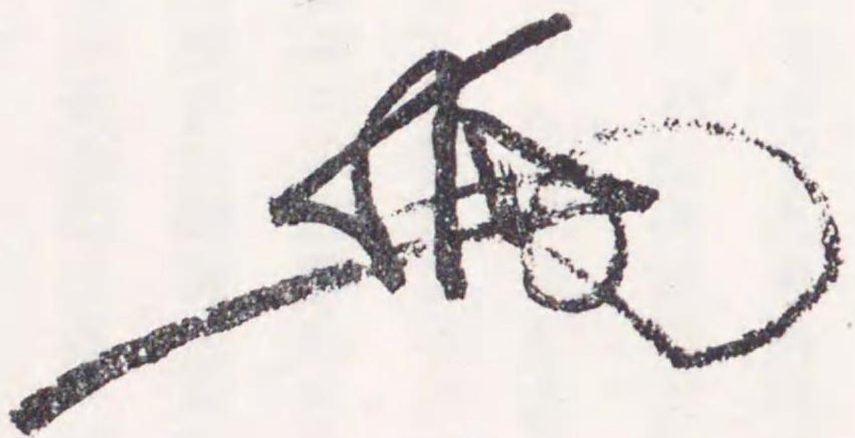
○清源寺文書 (肥後) 五月十日書狀