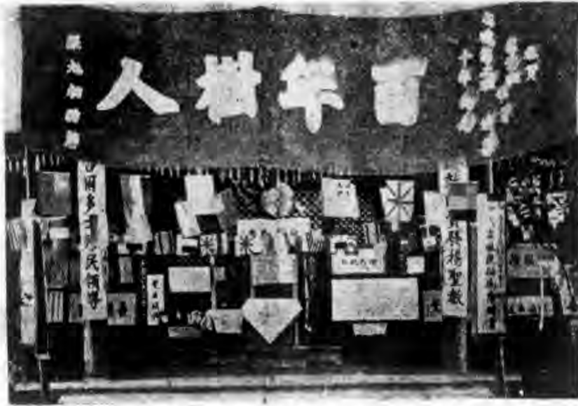
畢業典禮會場之一部

諸生肩負這種責任，決不是很簡單的，況當此世界紛紛之際；「知己知彼，百戰百勝」，諸生想完成自己的使命，決不是妄自尊大所能湊效的。所以於今日希望於諸生者兩端：