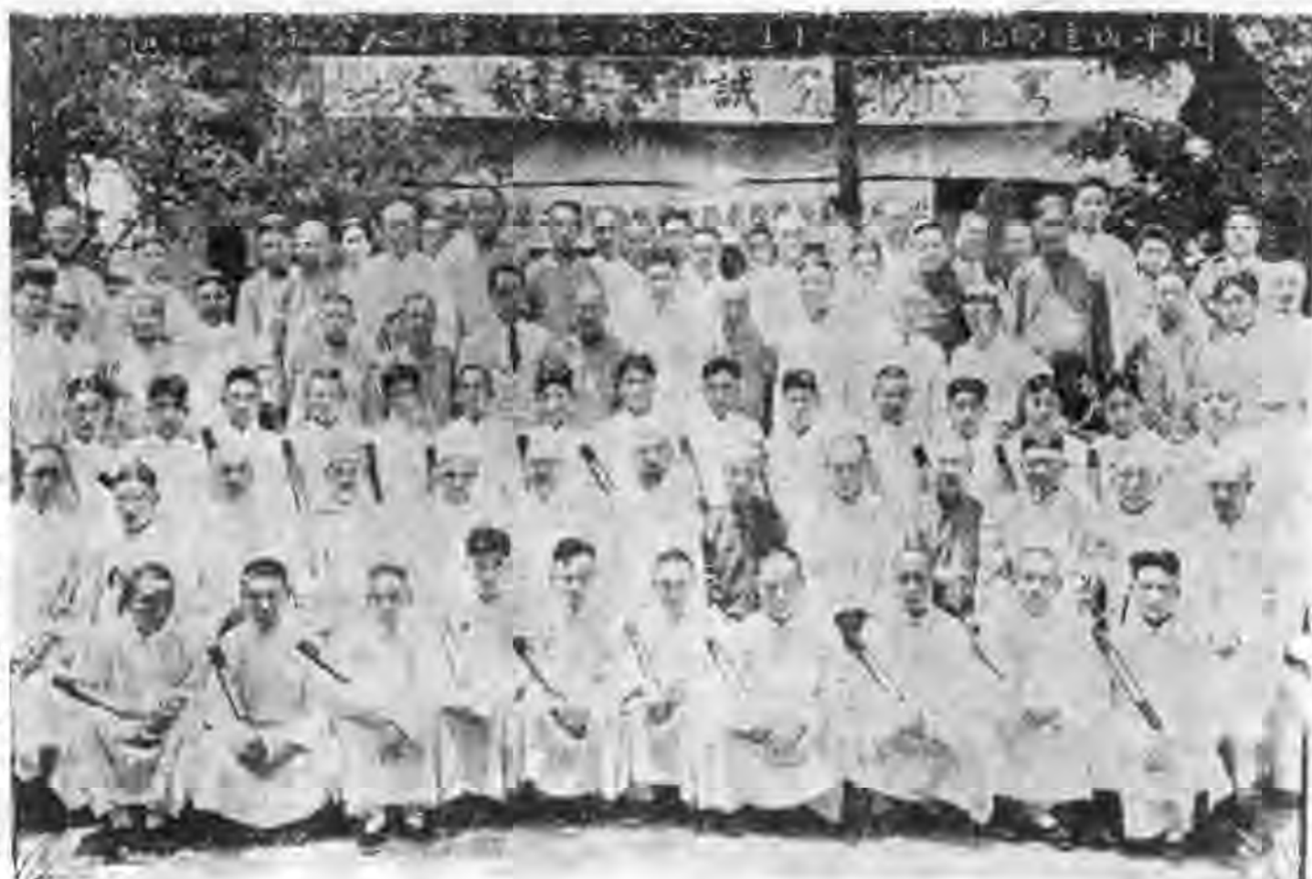
董事教職員及畢業生

爲複雜，（詳見成師二期十年來之回顧一文）。至於經濟方面，日日除夕，天天節關；可謂困難已極。本校因處於