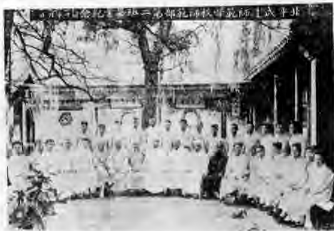
職教員暨師範部第二班畢業生

最後希望，再有十年，舉行二十年典禮時候，盛況要十倍大起來，并祝畢業諸君前途勝利！