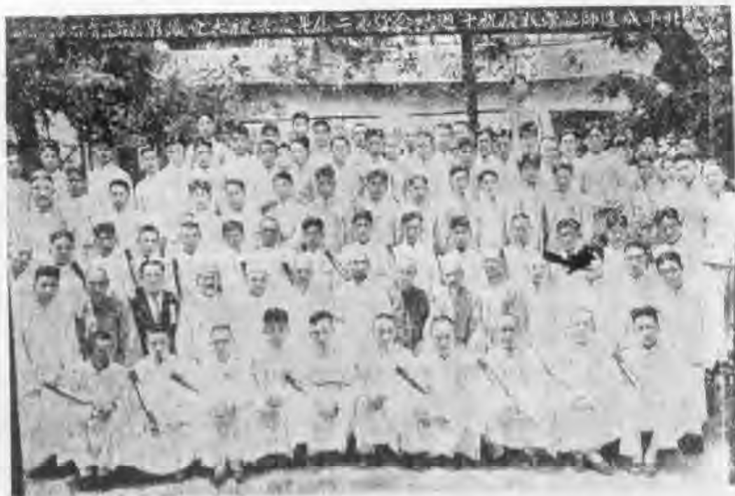
職教員學生全體暨畢業生

以挽救垂危的宗教，衰弱的國家，所以品行的修養，比什麼都是要緊的。 二、關於求學方面： 學校可以別，學問是無止境的，却