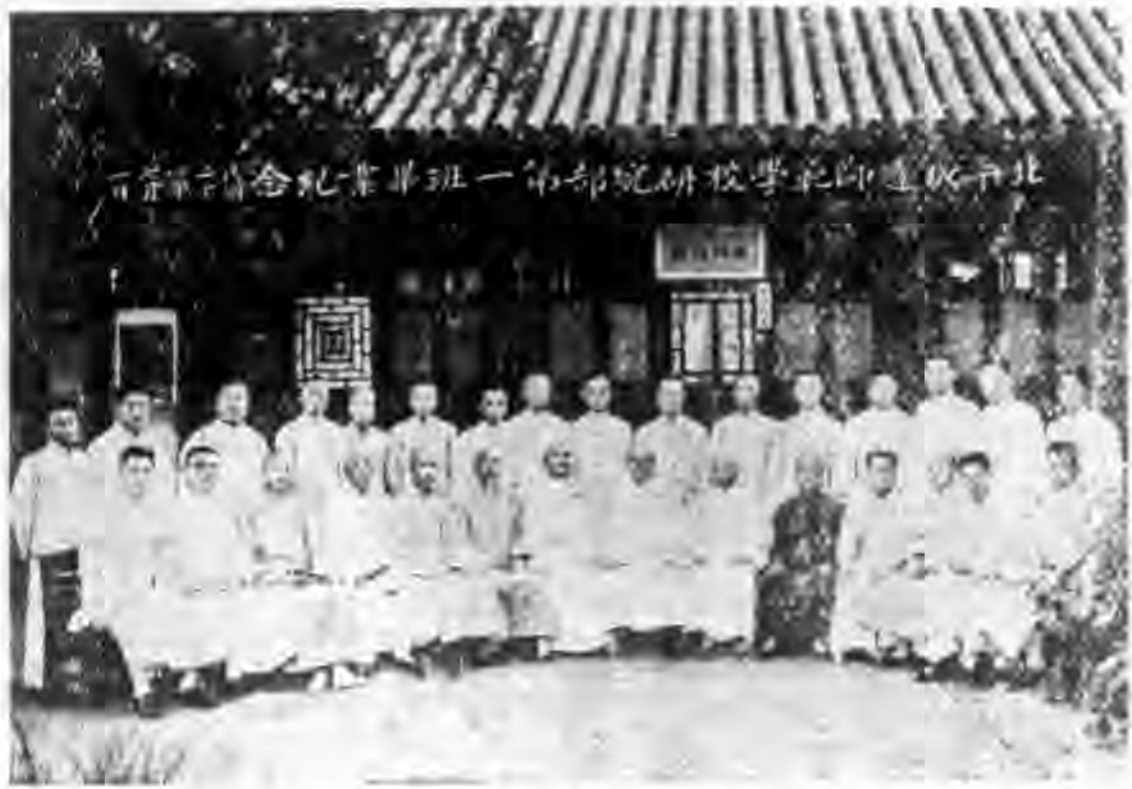
職教員暨研究部第一屆畢業生

如學問之可貴：一、學問之獲得匪易，世界之最難獲得者，即最珍貴者，學問之獲得較之財貨艱難百倍，故學問重於財貨也。二、學業助人，而財物求助於人，世人能得學業可譽辨是非，理曉曲直，而避人類於罪惡禍患，學問貴於財物也。三、學問用之不盡，財物取之便竭，故財物終不如學問之可貴也。所以望於諸生者畢業後，仍當努力求學。