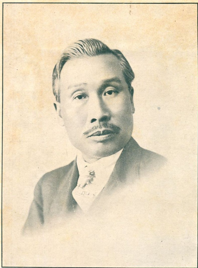
相我之年四十國民