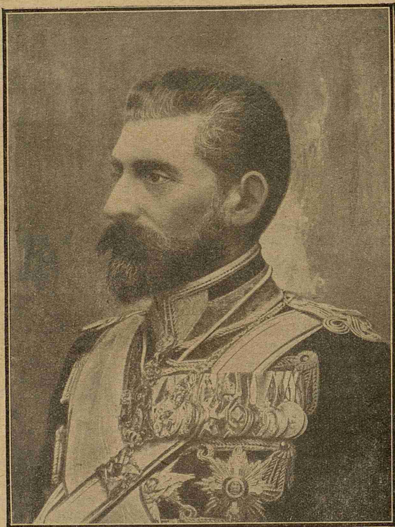
Ferdinand I-ii, întregitorul României.

din această sală, cel din urmă ca vârstă — ceia ce înseamnă foarte mult în urma vrâstei mele, dar și a vrâstei d-lui Dumitrescu, cred, — să înțeleagă și el. Pentru că, pe lângă obiceiul pe care-l avem noi de a strica toate aniversările, toate zilele mari