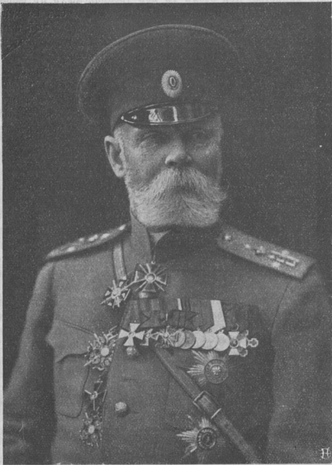
Генераль-лейтенантъ Владиміръ Николаевичъ ГОРБАТОВСКІЙ.

СОДЕРЖАНИЕ: Портреты: Генераль-лейтенантъ Владиміръ Николаевичъ Горбатовскій, генераль-отъ-кавалеріи Александръ Ивановичъ Литвиновъ и генераль-лейтенантъ Карль-Августъ Александровичъ Шульманъ. — Распоряженія по военному вѣдомству. — Война 1914 года. — Біографіи. — Корреспонденція. — Свѣдѣнія объ убитыхъ и раненыхъ. — Почтовый ящикъ. — Объявленія.