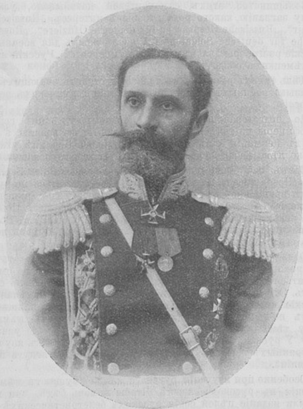
Генераль-лейтенантъ Карль-Августъ-Александровичъ ШУЛЬМАНЪ,

рядовъ. Австрійскія войска, наступавшія въ направленіи Калиновика, были окружены черногорскою колонною и, понеся тяжелыя потери, отступили въ безпорядкѣ къ Доброполью, бросая скорострѣльные орудія, лошадей и военные припасы.