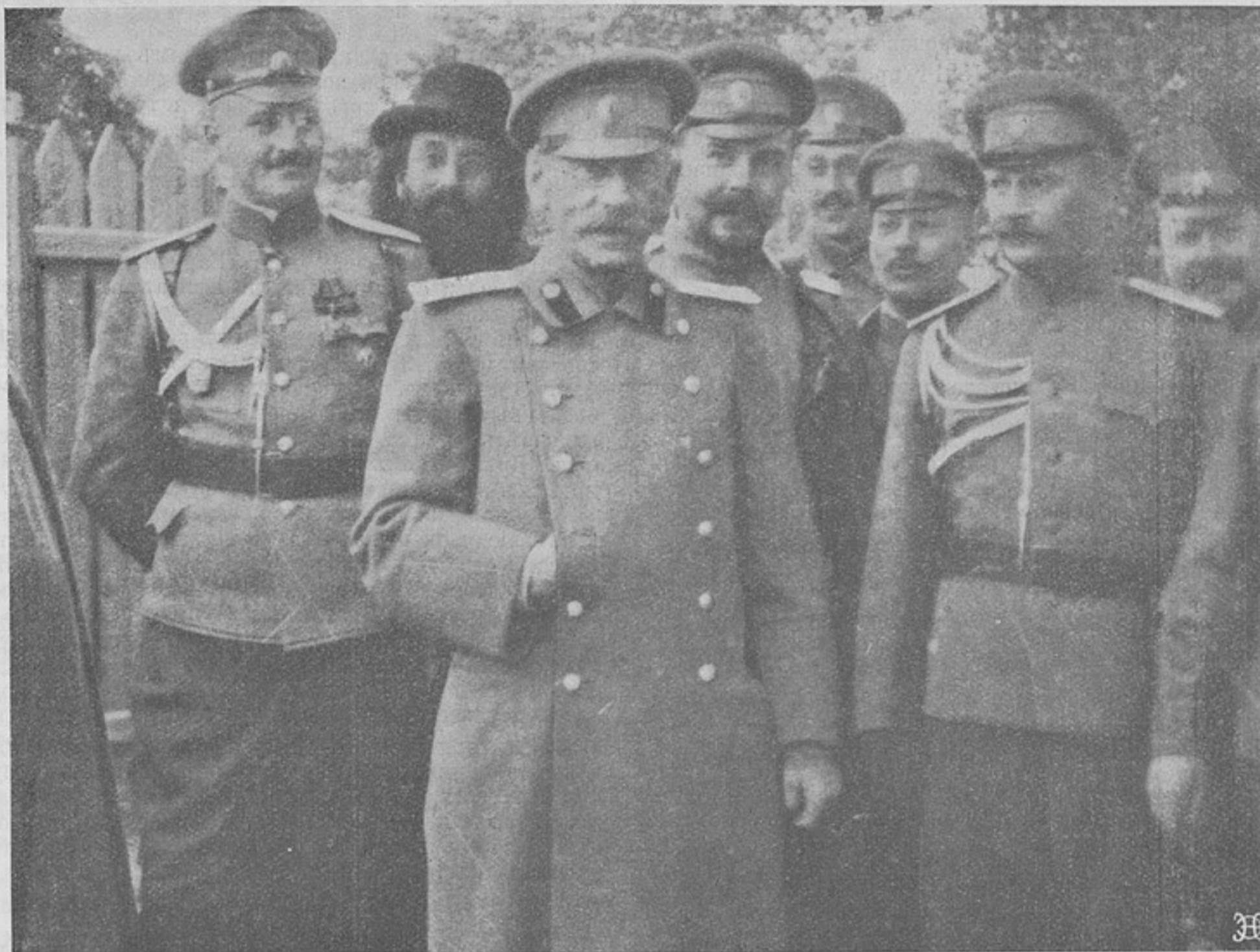
Генераль-адъютантъ Русскій со своимъ штабомъ.

рядовъ. Австрійскія войска, наступавшія въ направленіи Калиновика, были окружены черногорскою колонною и, понеся тяжелыя потери, отступили въ безпорядкѣ къ Доброполью, бросая скорострѣльные орудія, лошадей и военные припасы.