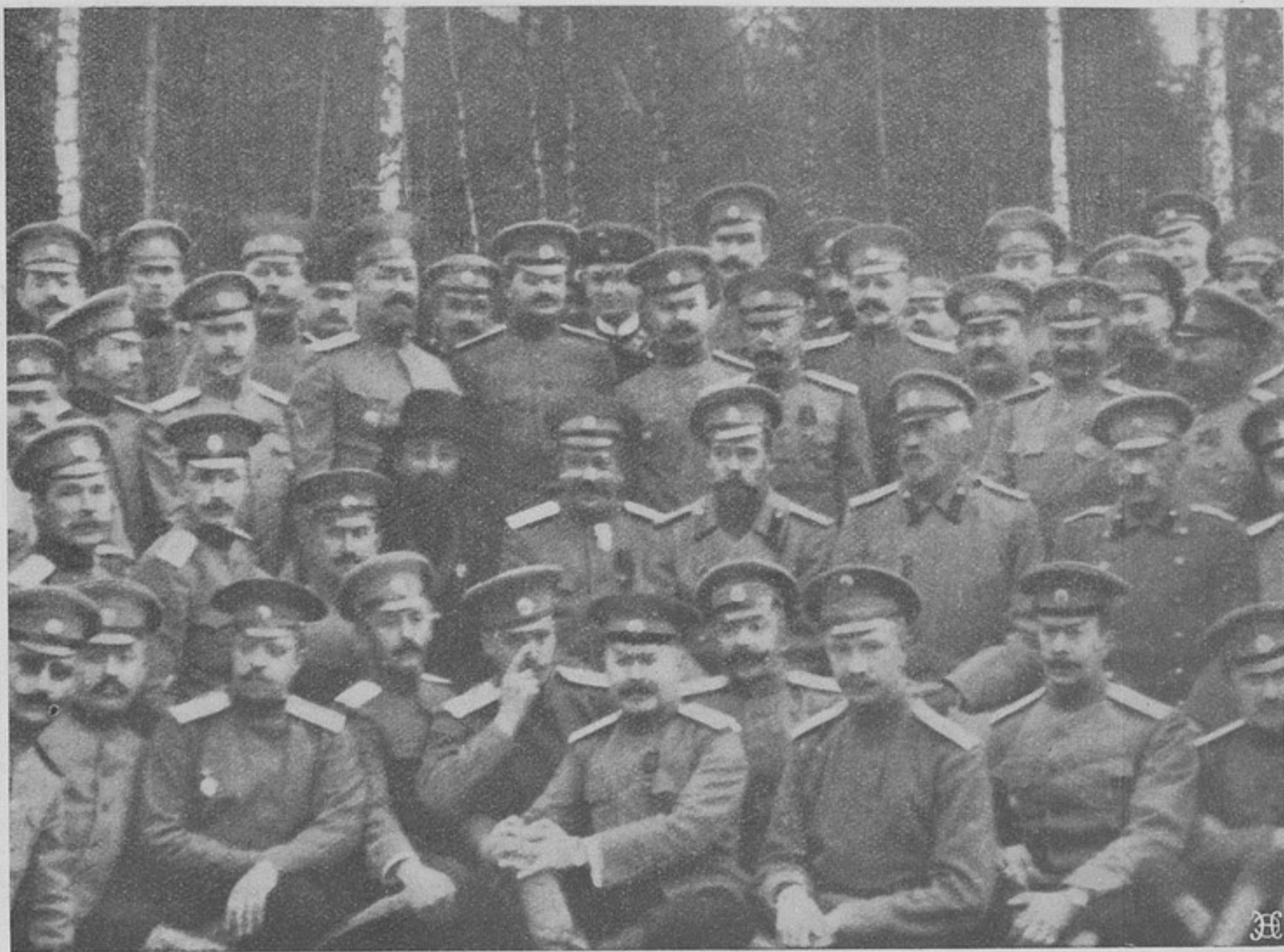
Его Императорское Величество Государь Императоръ въ дѣйствующей арміи.

обнаружено еще 8-го числа, продолжали весьма энергичныя атаки во всемъ районѣ между моремъ и каналомъ Лабассэ.