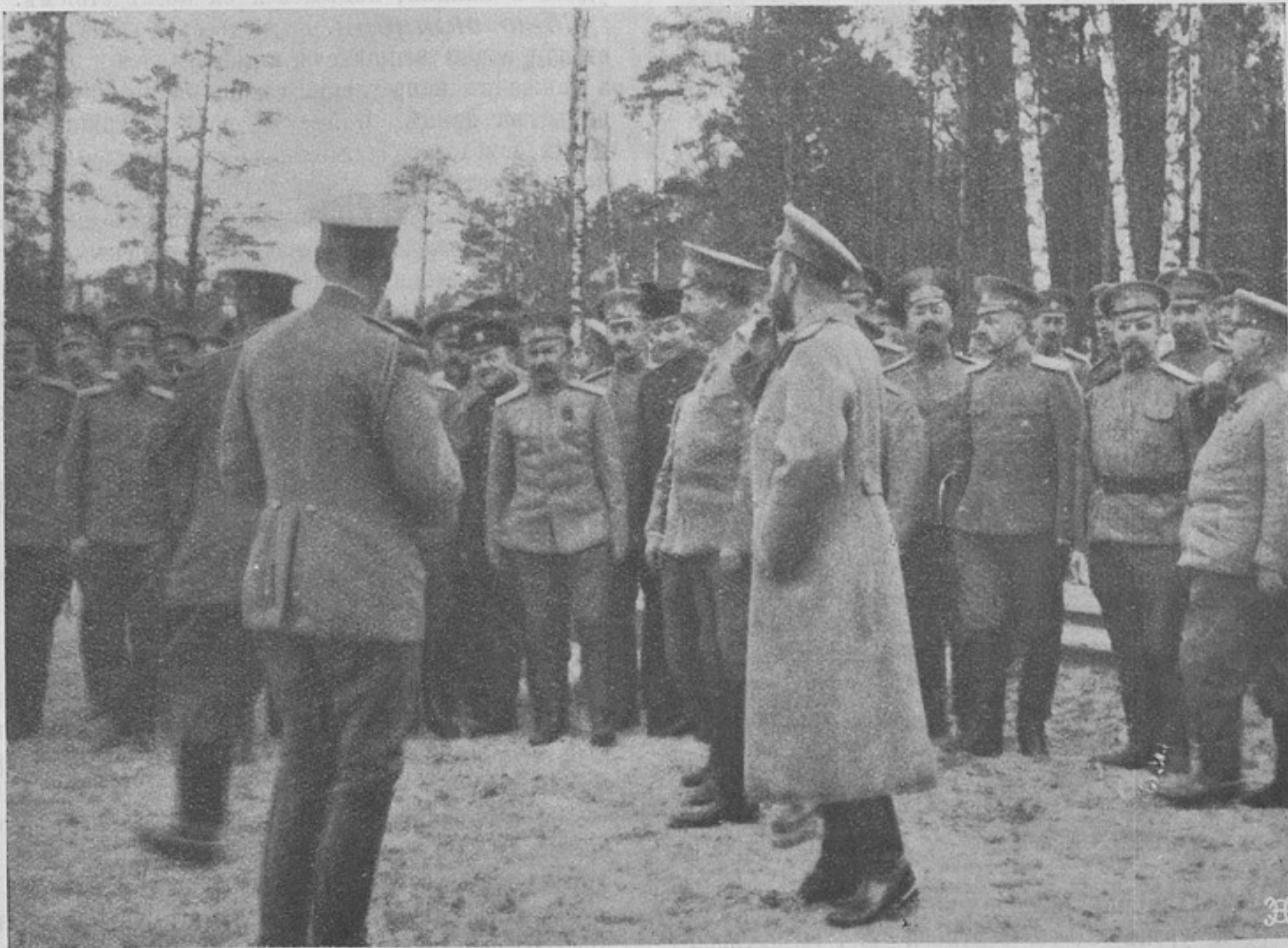
Его Императорское Величество Государь Императоръ въ дѣйствующей арміи.

Въ общемъ, нѣмцы, повидимому, пытаются произвести