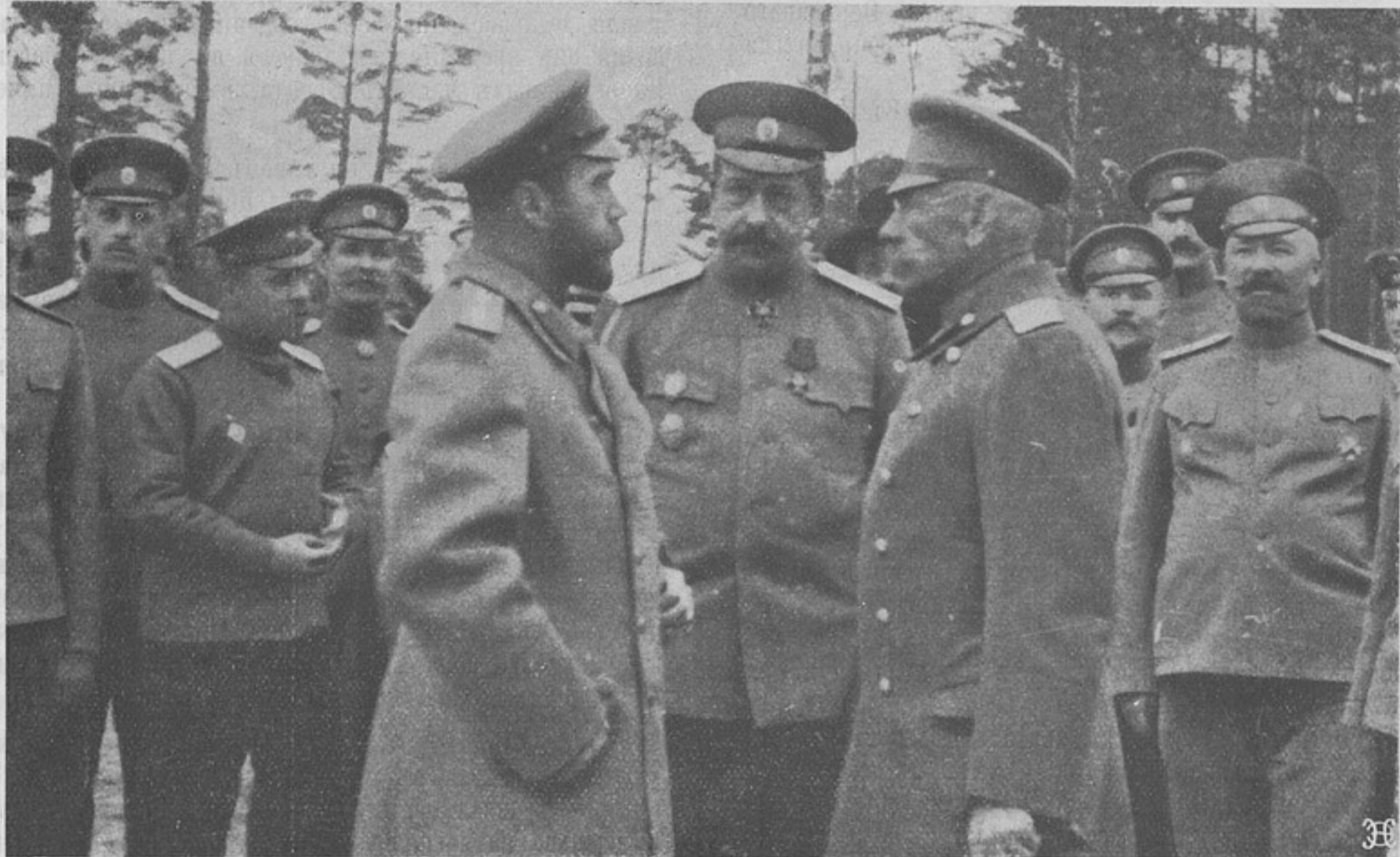
Его Императорское Величество Государь Императоръ въ дѣйствующей арміи. Его Императорское Величество изволилъ бесѣдовать съ генераль-адъютантомъ Рузскимъ.

«Командиръ третьяго кавказскаго корпуса донесъ мнѣ изъ дѣйствующей арміи, что имъ получена телеграмма главнокомандующаго юго-западнаго фронта генераль-адъютанта Иванова, слѣдующаго содержанія: «Въ виду особыхъ заслугъ вашего корпуса, въ изытаніе изъ правилъ назначьте достойнѣйшихъ по сто крестовъ на польскія и артиллерію по вашему усмотрѣнію. Раненыхъ награждать всѣхъ, достойныхъ офи-