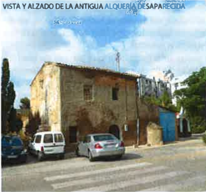
VISTA Y ALZADO DE LA ANTIGUA ALQUERÍA DESAPARECIDA