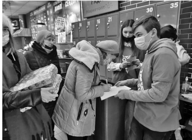
Збір підписів за закриття неба

— зателефонувати селищному голові. І що ви думаєте? Теж допомога не потрібна, а коли буде потрібна — до нас звернуться.