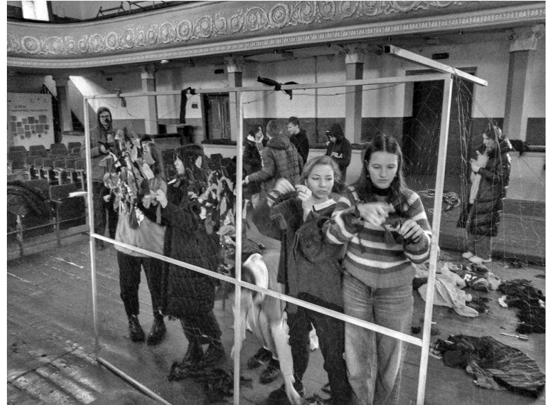
Плетіння сіток у приміщенні музичної школи

Спочатку, у перші дні виготовляли сітки лише волонтери, тож робота йшла повільно. Але через декілька днів почало приходити багато охочих, які за один день могли сплести велику сітку. Усього від початку війни, а це більше місяця, ми разом