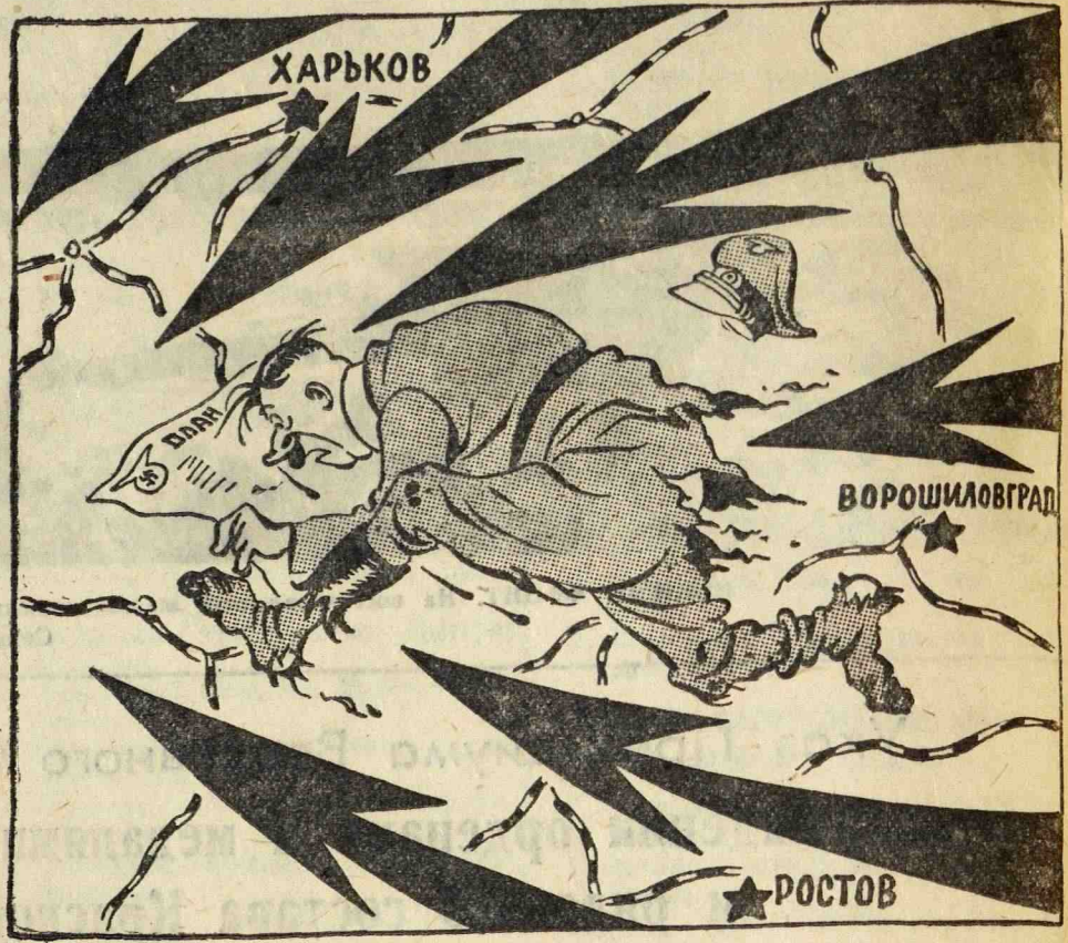
Рис. Бор. Ефимова.

Потеря немецкими войсками важнейших стратегических позиций, какими являются города Ростов и Ворошиловград, по объяснению гитлеровцев, произошла по «точно намеченному плану».