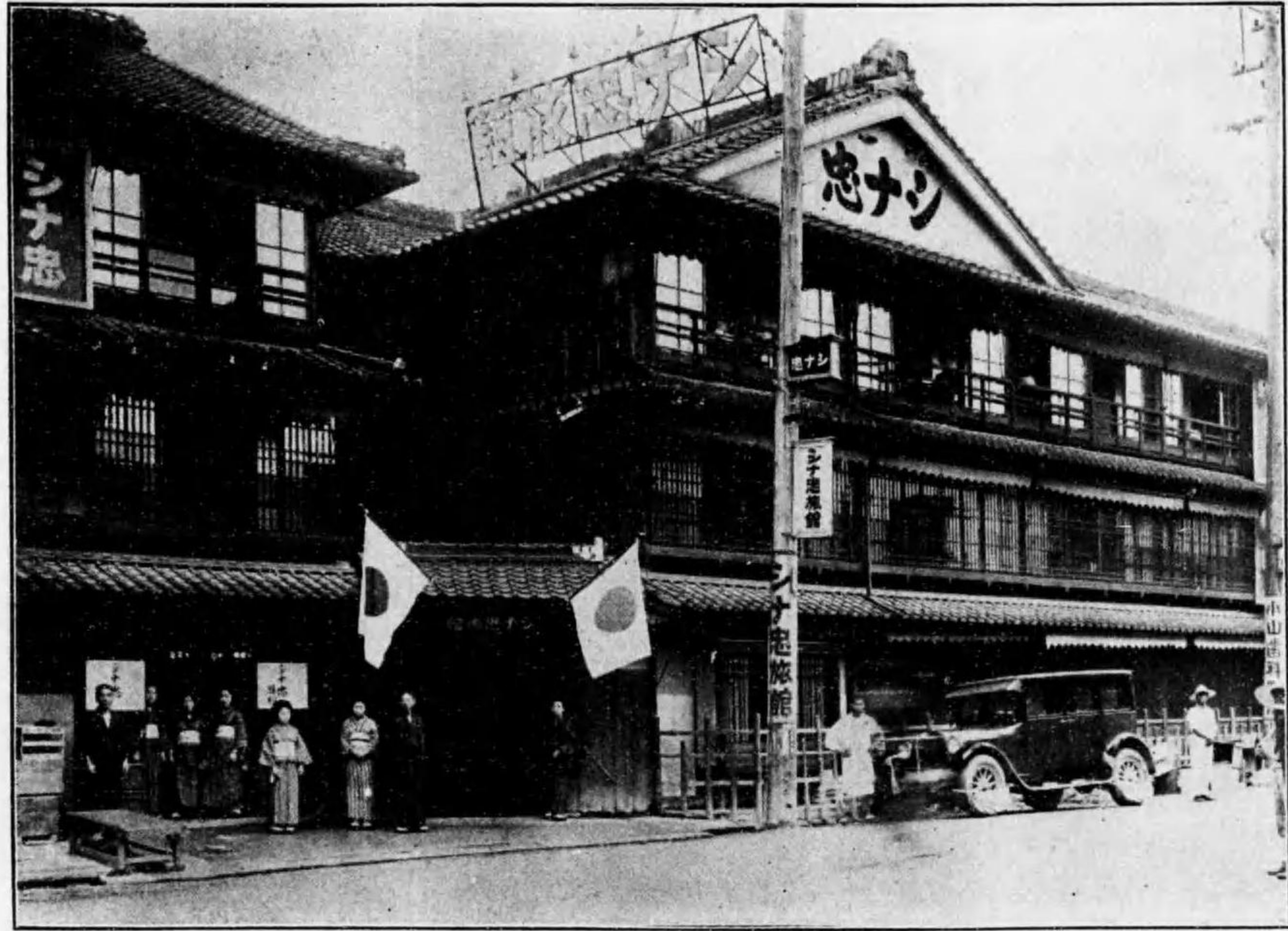
リア場列陳産物下縣及場突玉