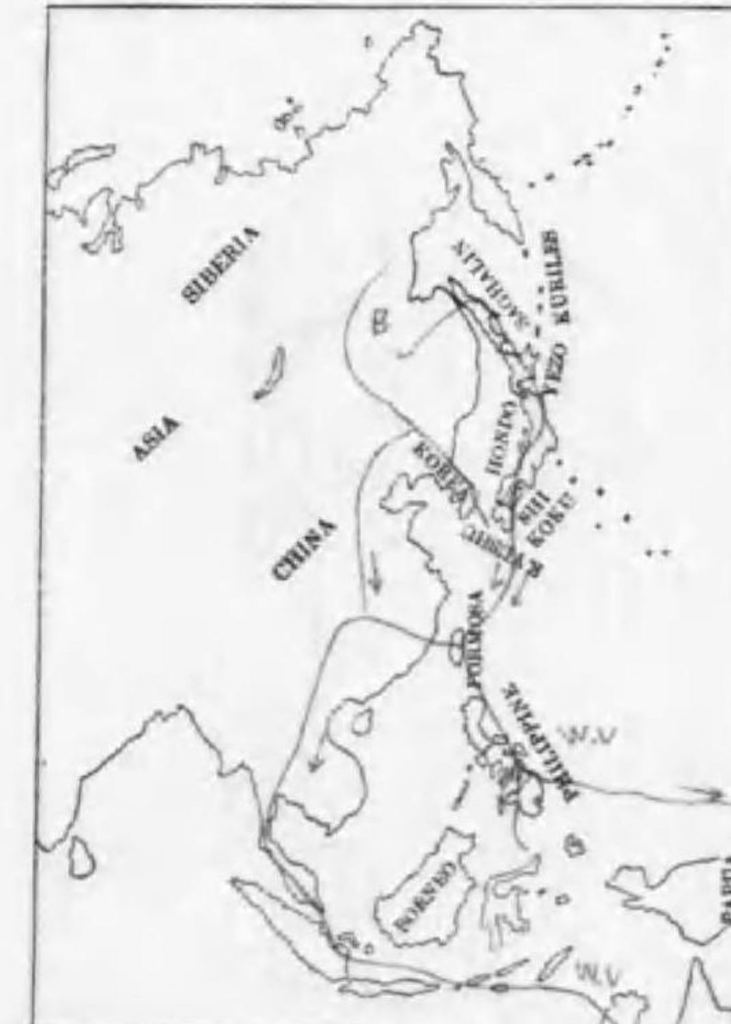
220. Pisobia acuminata (Horsfield) ウツラシギ