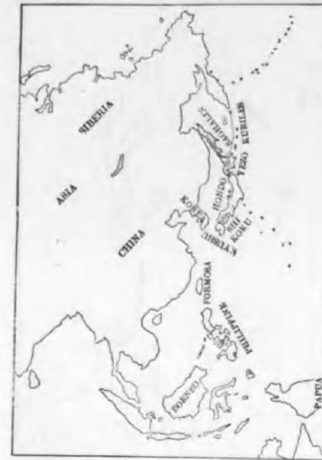
50. Sitta europaea clara Stejneger (B) シロハラコジフガラ