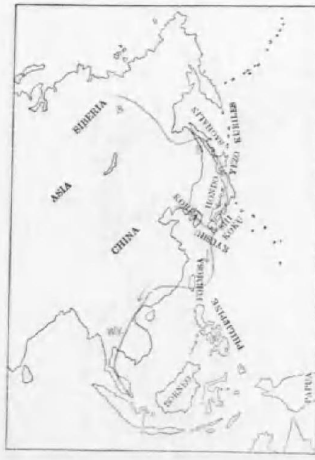
67. Siphia mugimaki (Temminck) (B) ムギマキ