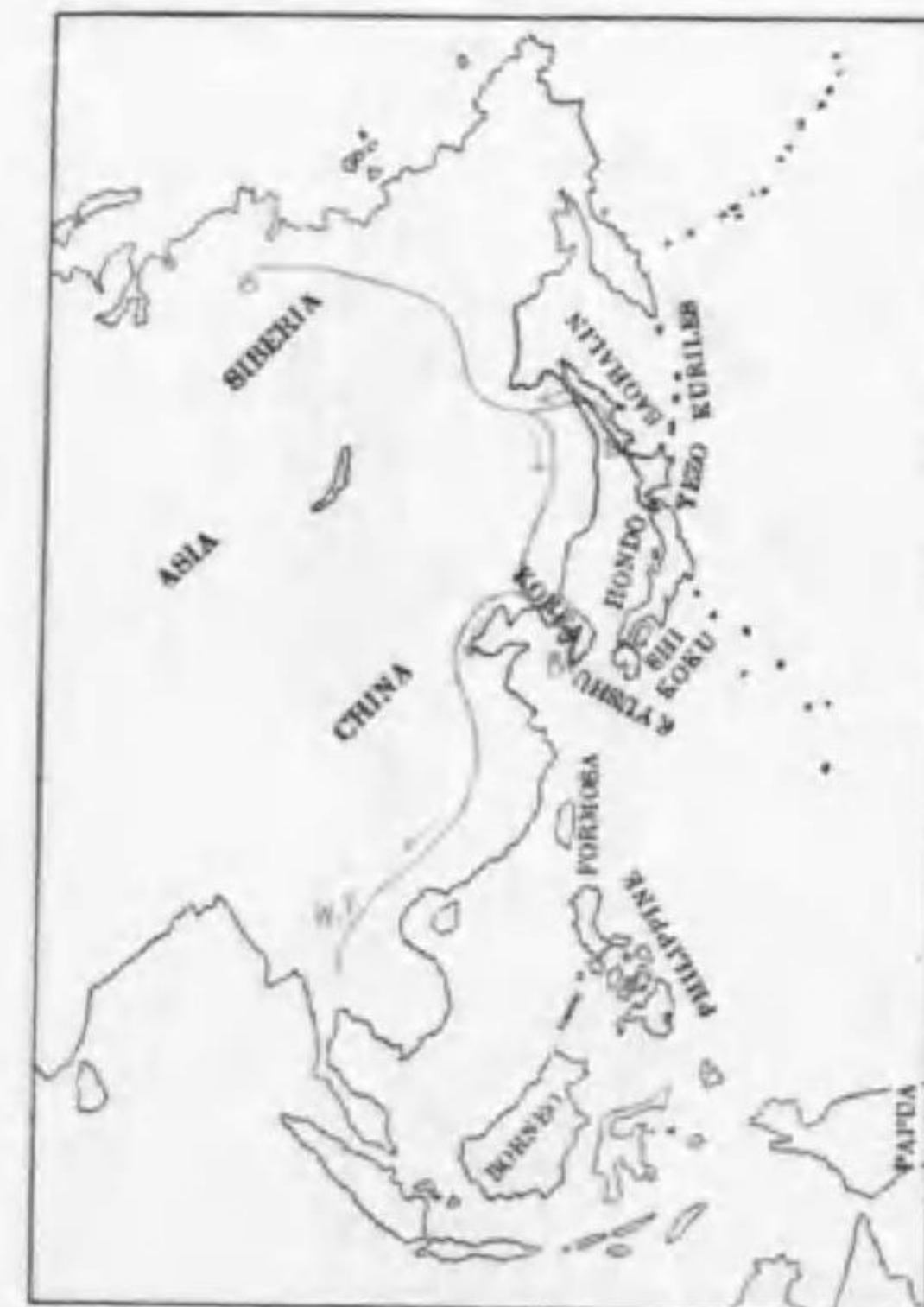
76. Herbivocula schwarzi (Radde) (B) カラフトムヂセツカ