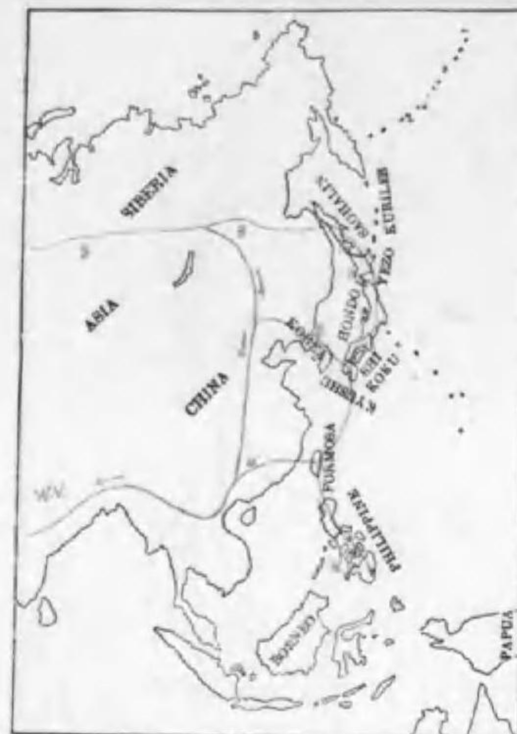
82. Turdus aureus aureus Holandre (B) トラツグミ