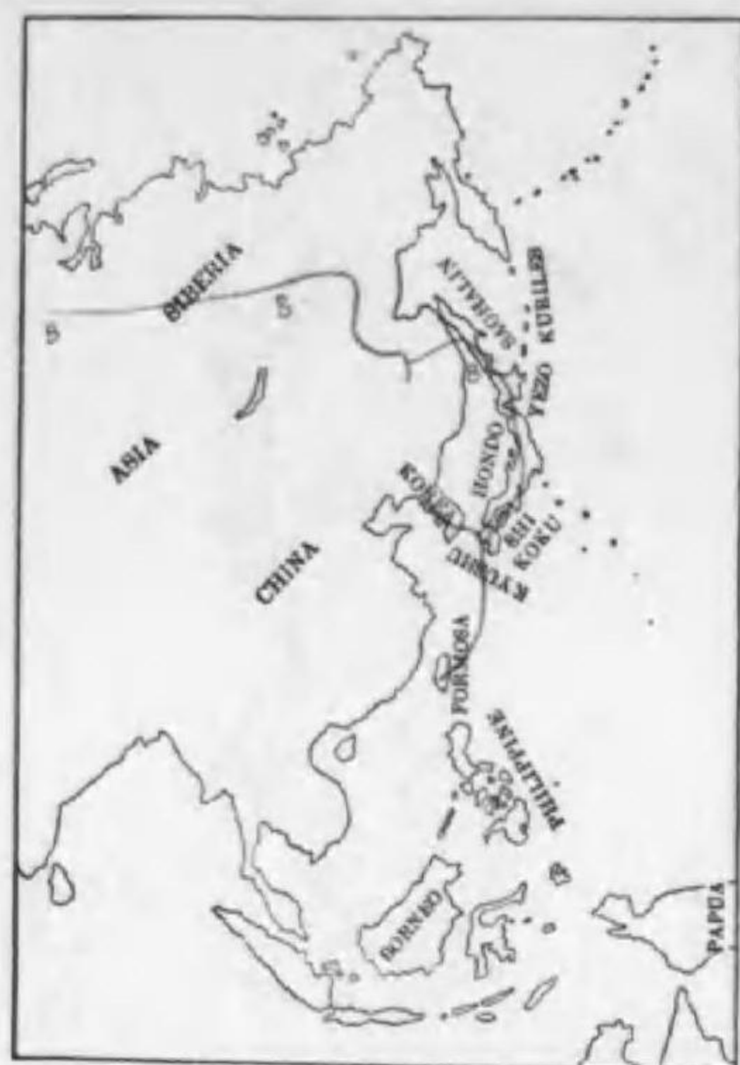
125. Asio flammeus flammeus (Pontoppidan) コミミヅク (B)