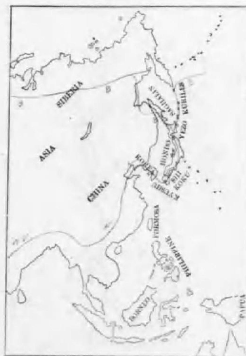
155. Cygnus cygnus (Linnaeus) (B) オホハクテウ