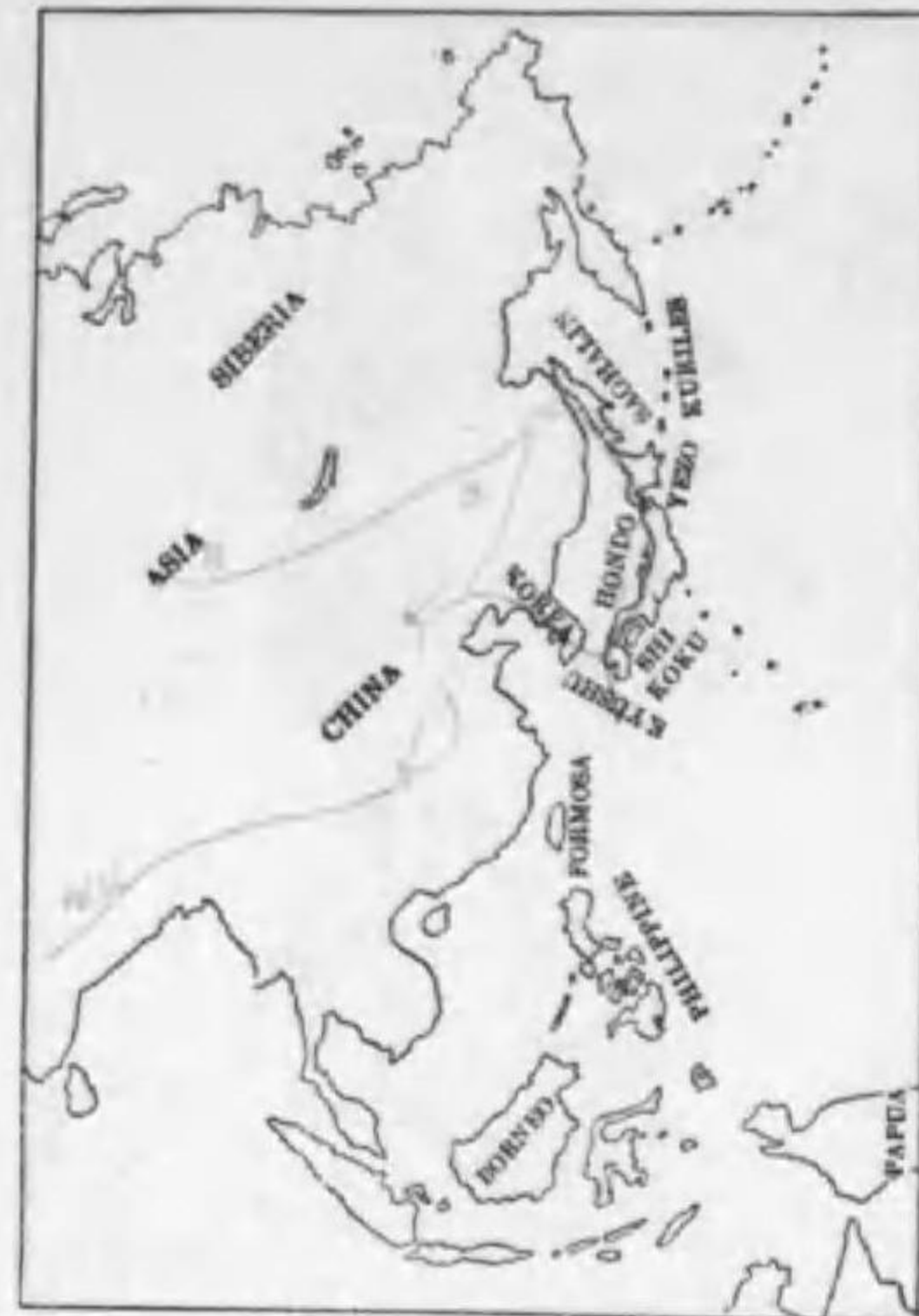
141. Accipiter nisus nisosimilis (Tickell) ハイタカ