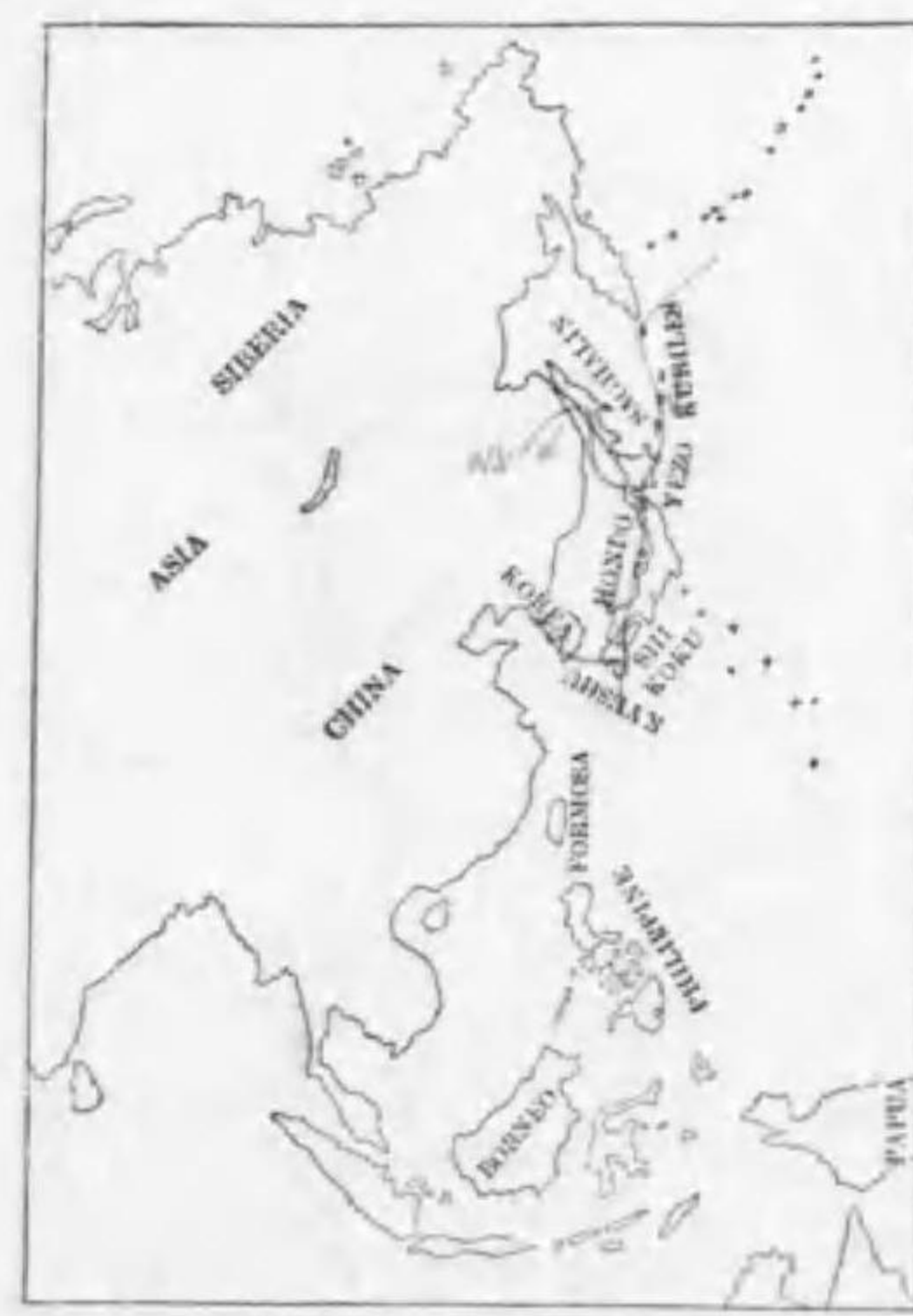
195. Colymbus arcticus pacificus Lawrence シロエリオホハム