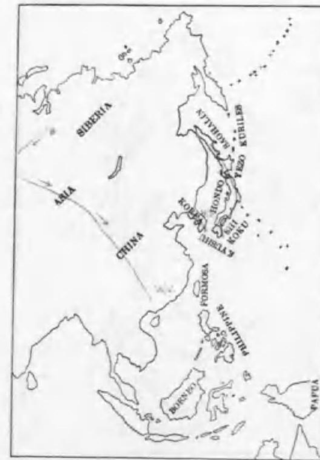
20. Erythrura rosea (Pallas) (B) オホマシコ