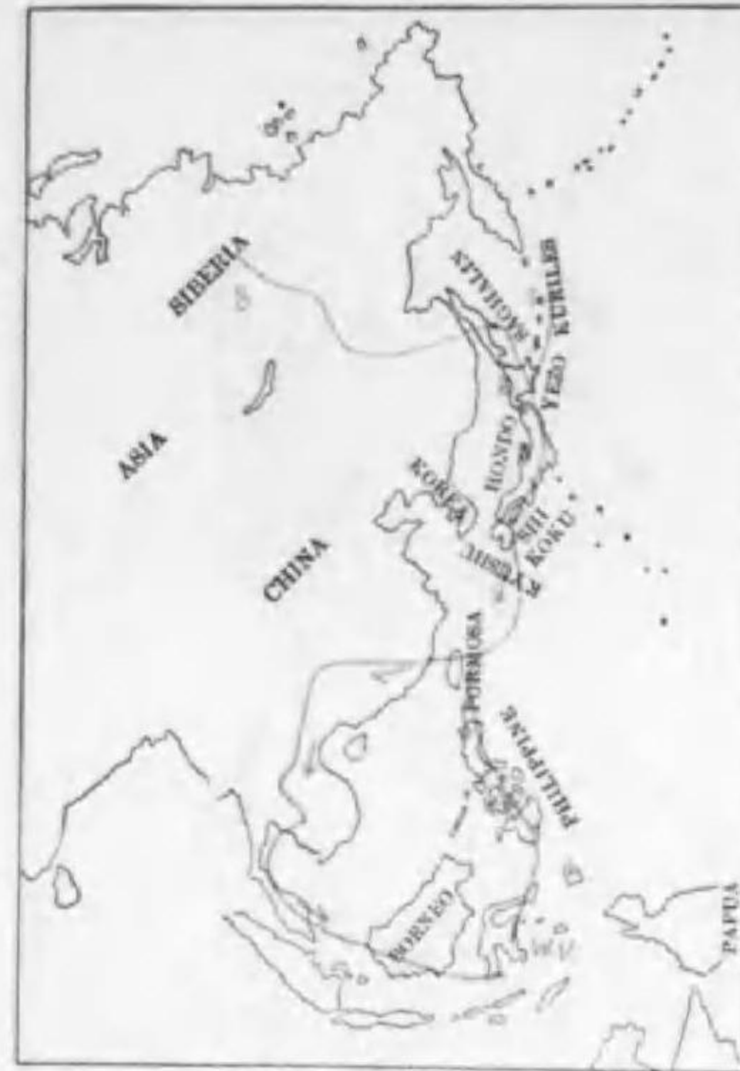
65. Hemichlidon griseisticta Swinhoe エゾビタキ