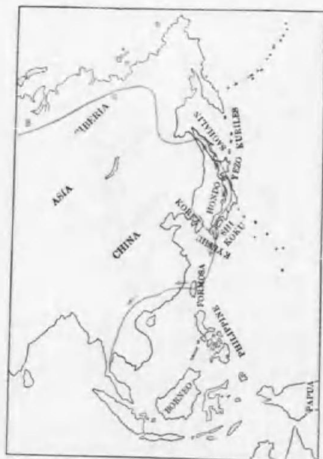
72. Acanthopneuste borealis borealis (Blasius) (B) コムシクヒ