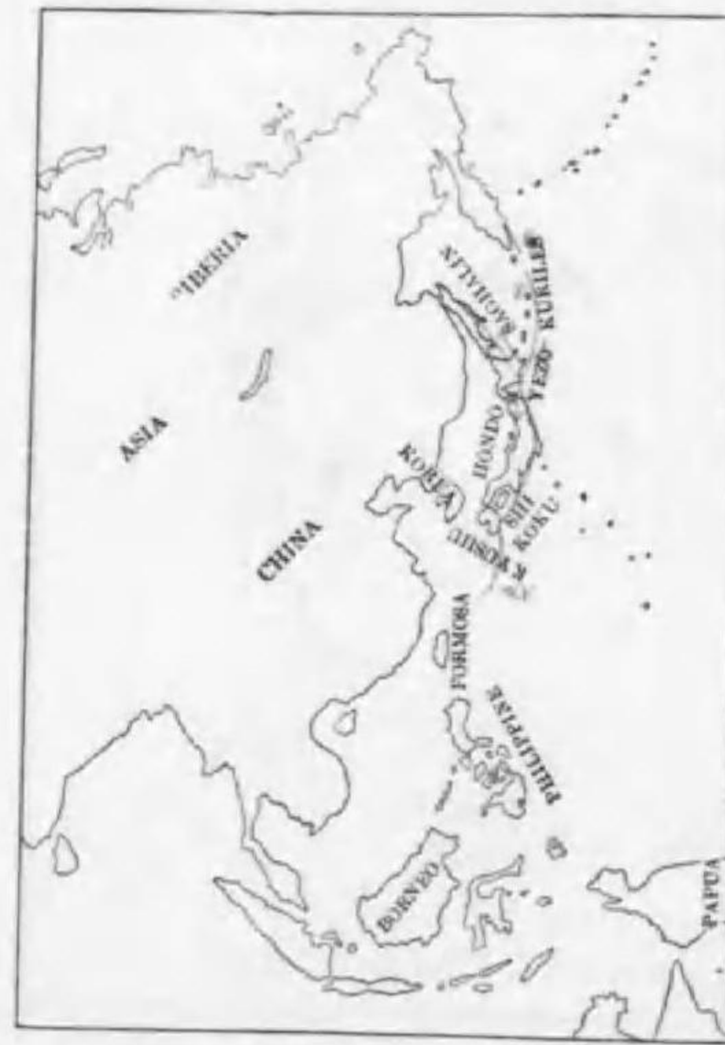
32. Emberiza variabilis Temminck クロジ