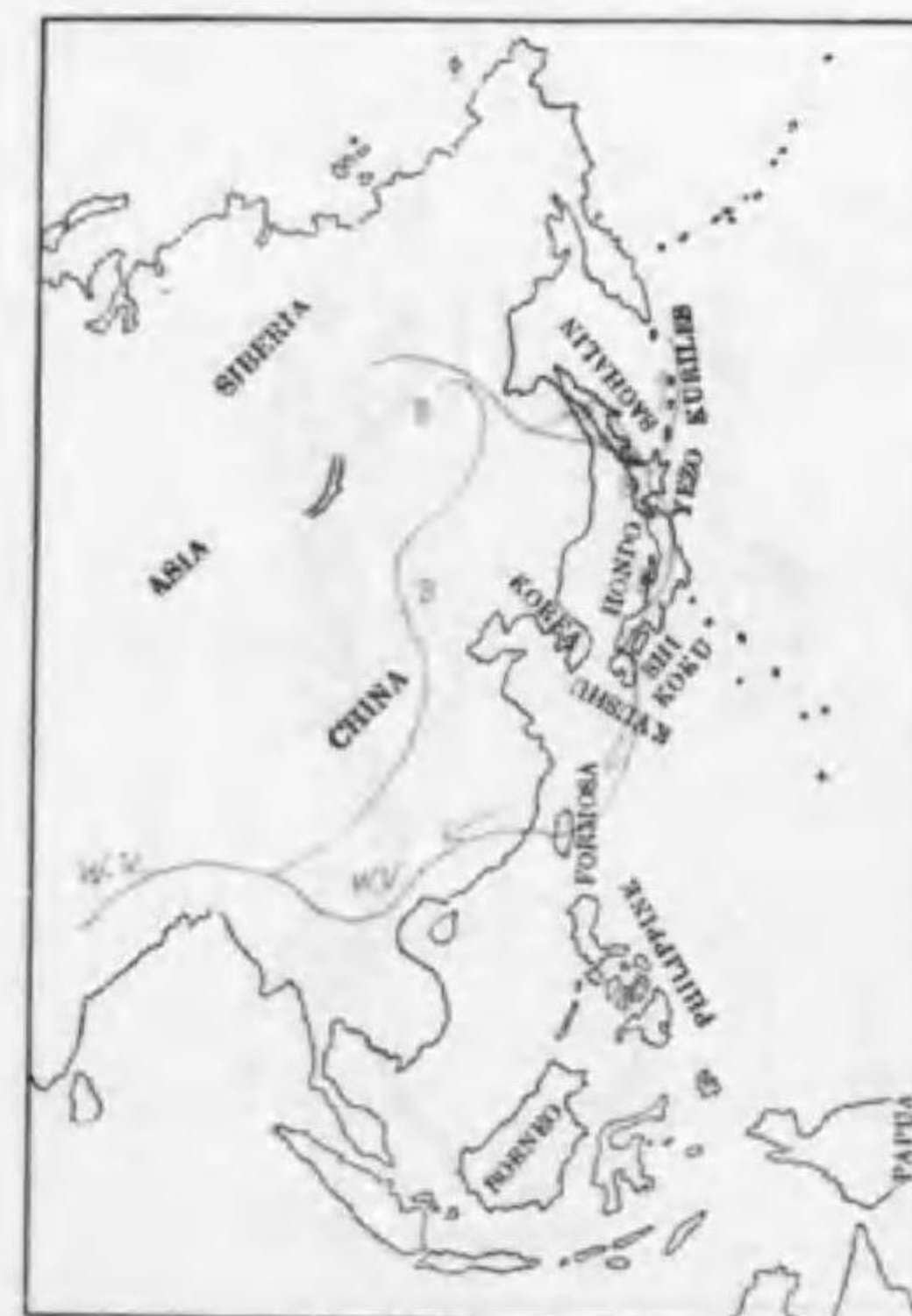
147. Ardea cinerea rectirostris Gould アラサギ