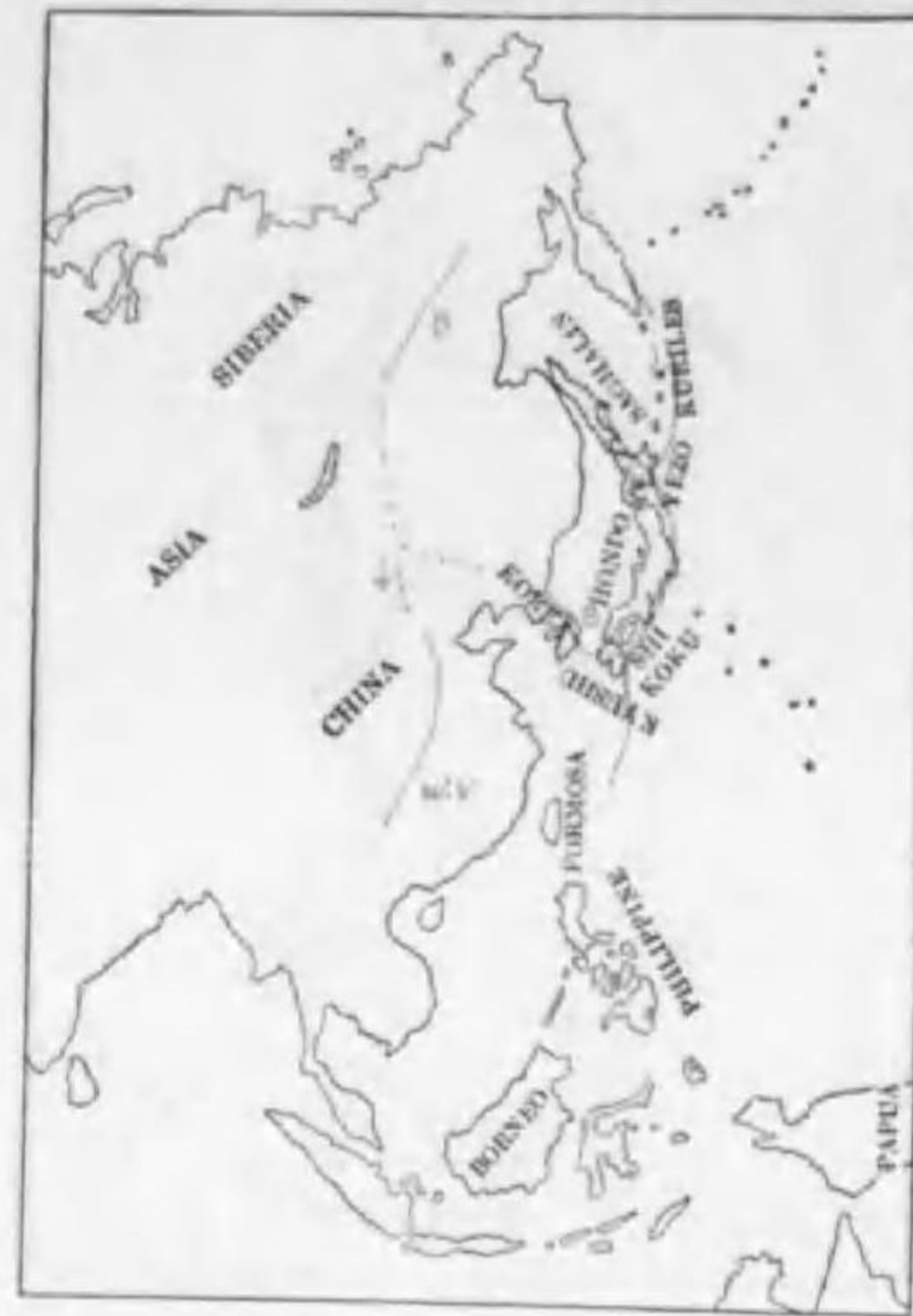
30. Emberiza rustica Pallas (B) カシラダカ