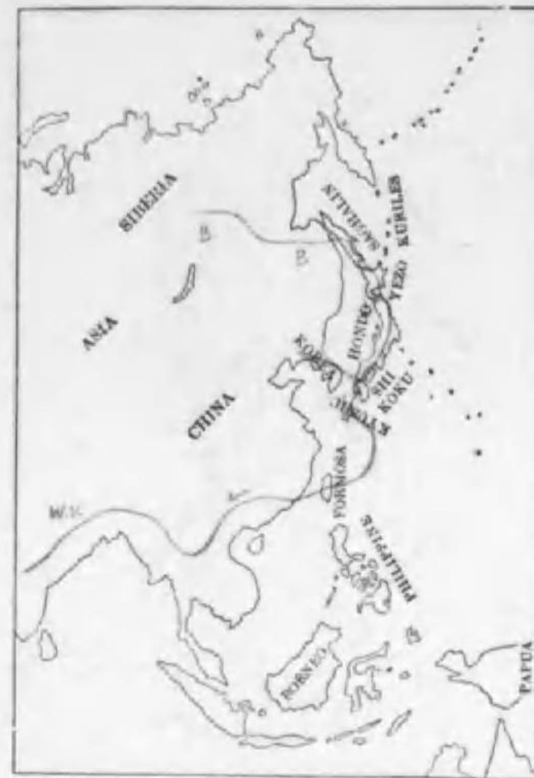
169. Querquedula falcata (Georgi) ヨシガモ