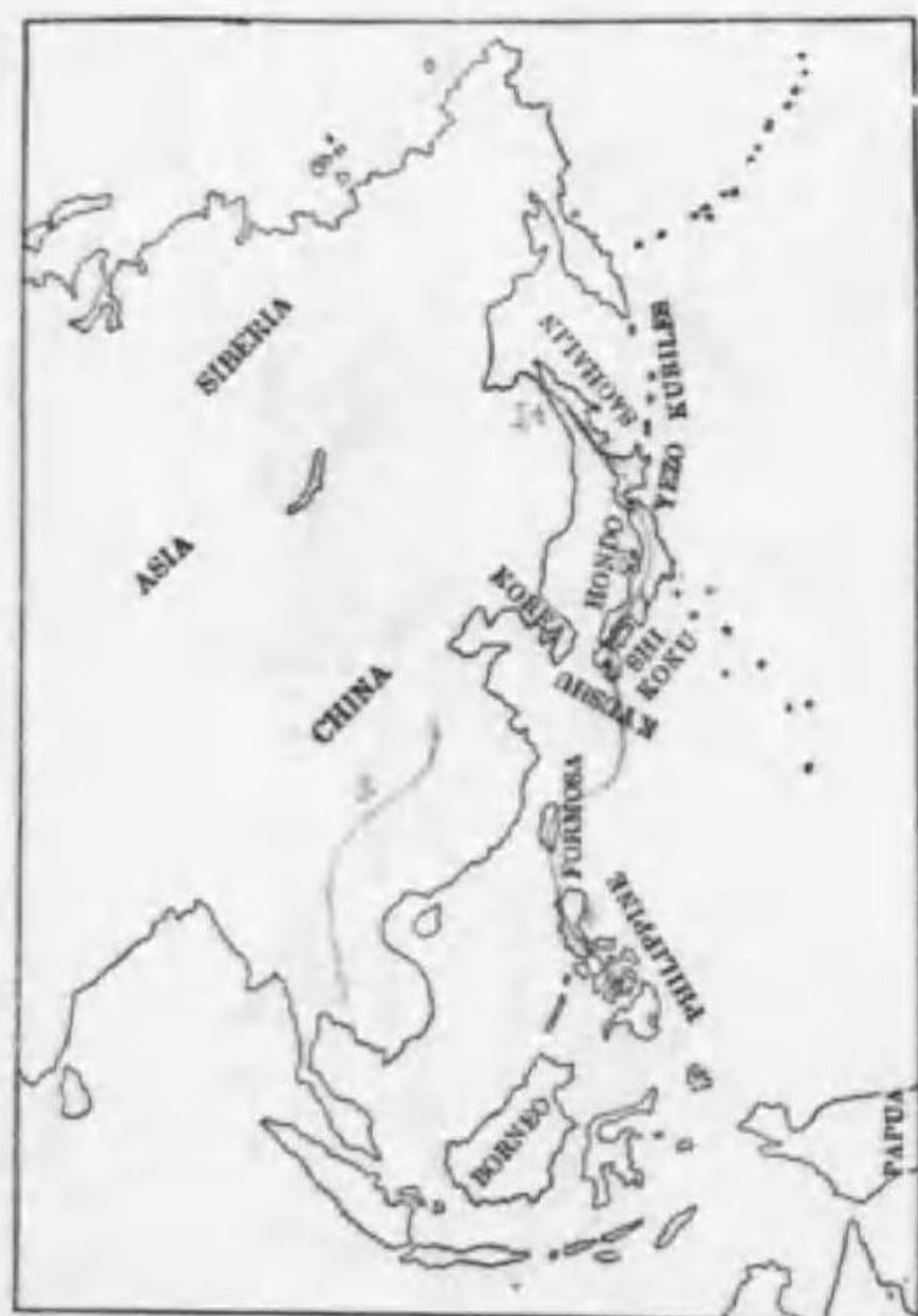
151. Gorsakius gaisagi (Temminck) (St.) ミゾゴキ