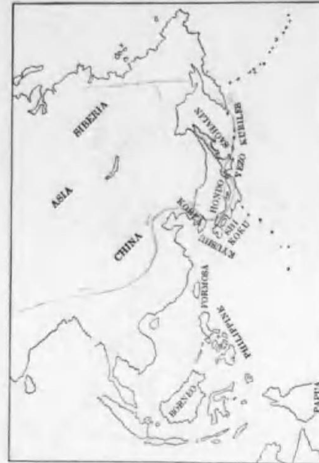
185. Mergus merganser merganser Linnaeus カハアイサ