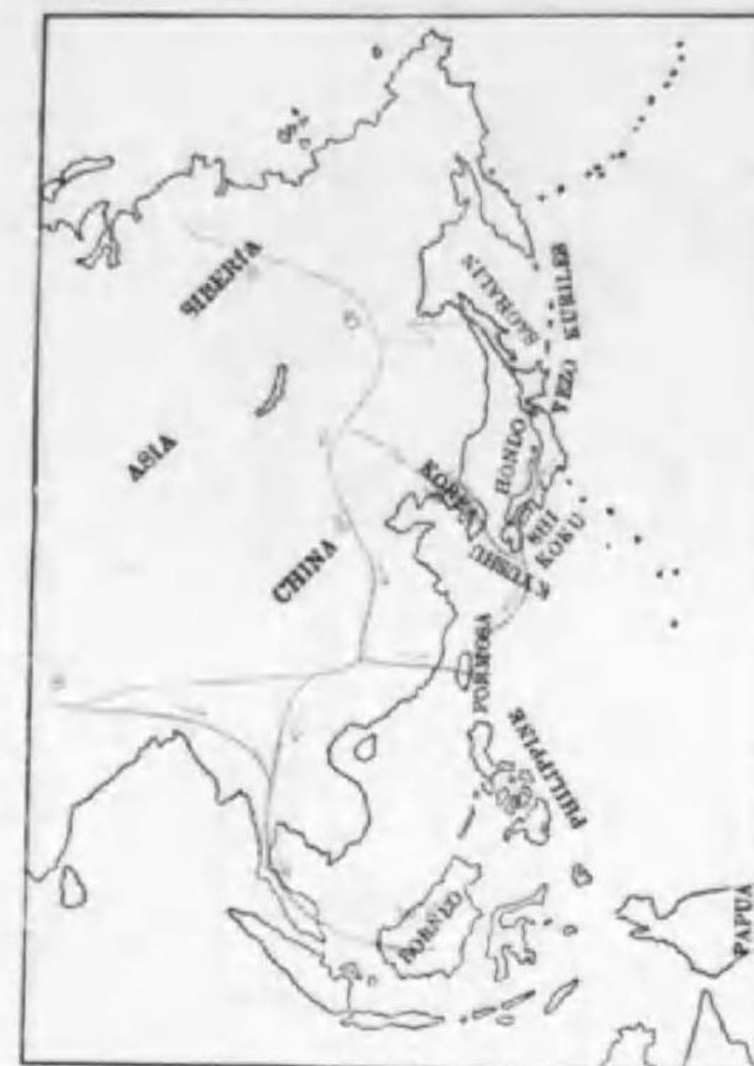
106. Eurystomus orientalis calonyx Sharpe ブツボウソウ (St.)