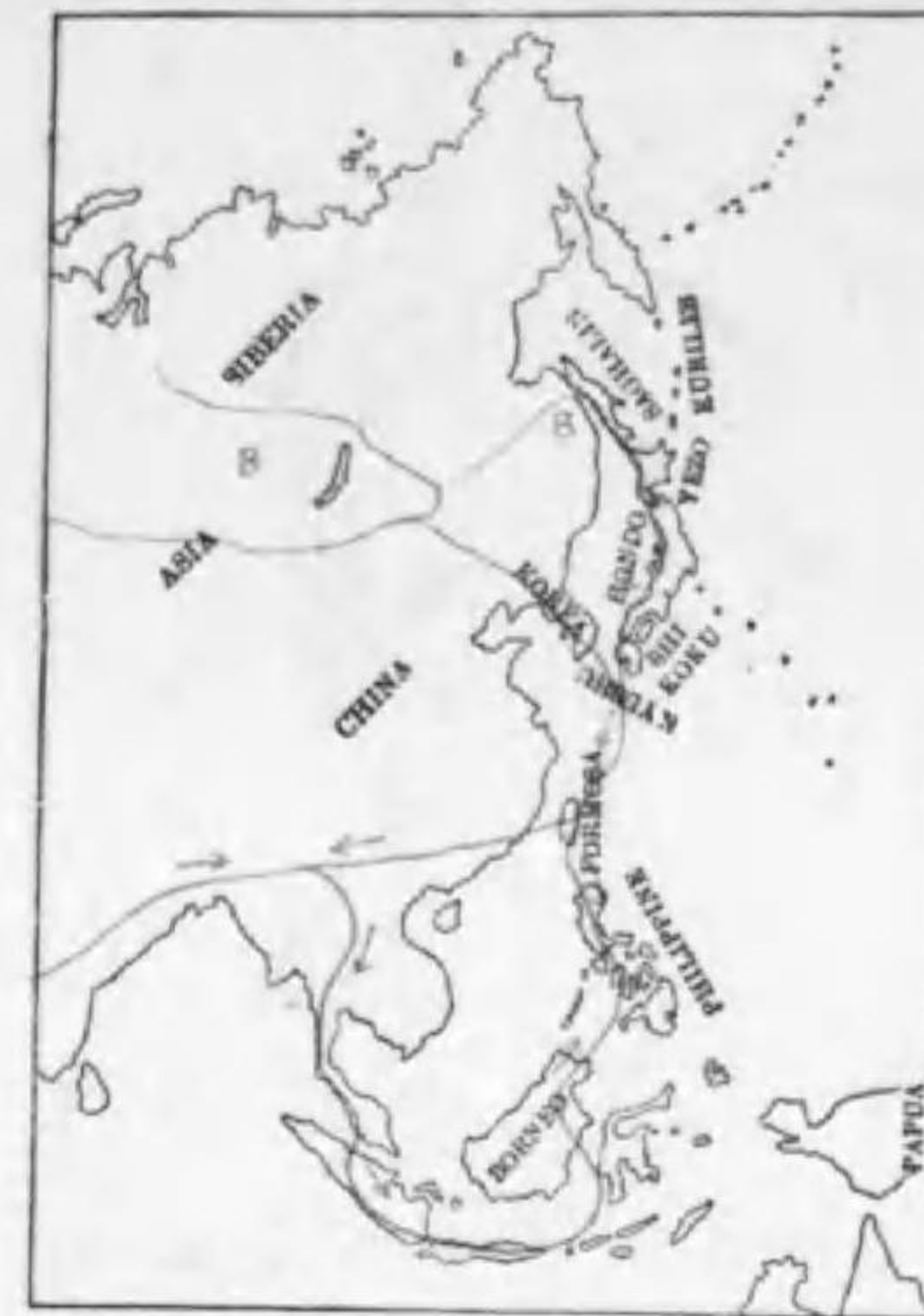
202. Tringa hypoleucos Linnaeus (B) イソシギ