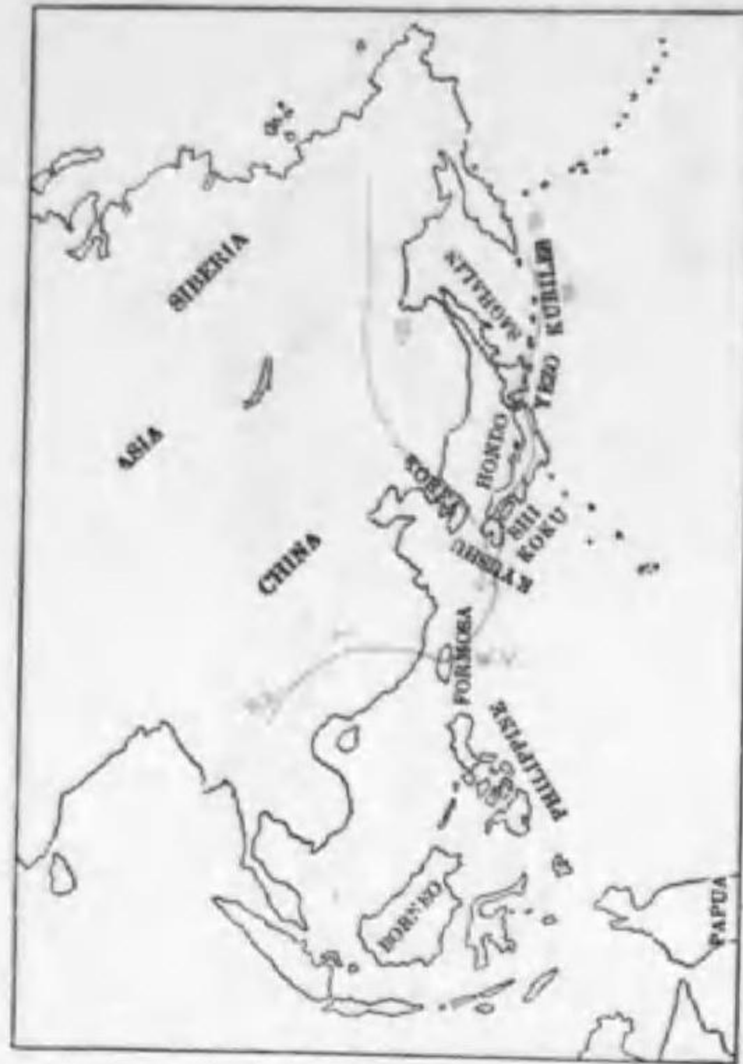
245. Larus casus major Middendorff カモメ