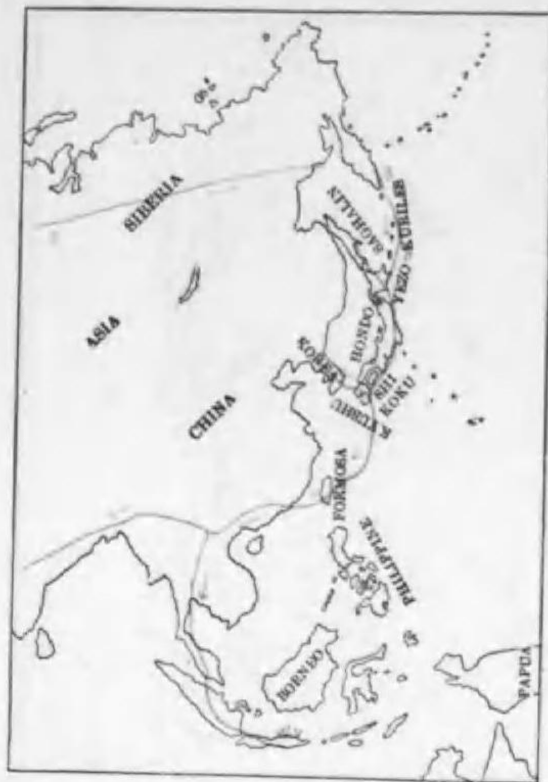
45. Motacilla cinerea caspica (S.G.Gmelin) キセキレイ (B)