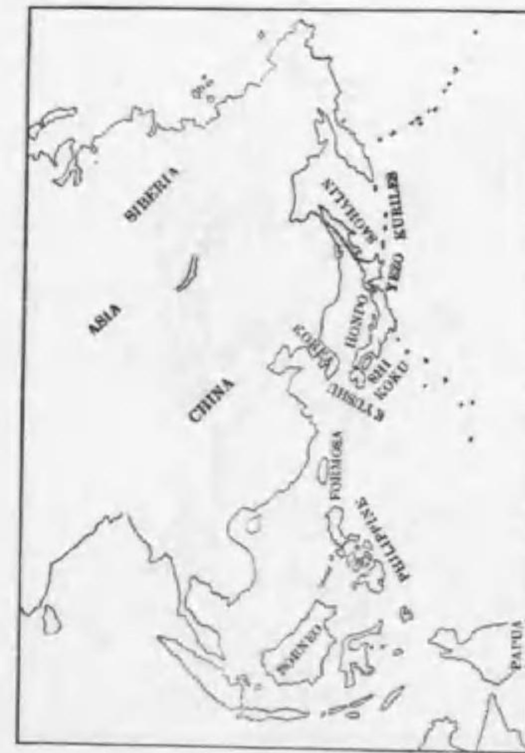
115. Picoides tridaetylus sakhalinensis Buturlin (B) ミユビゲラ