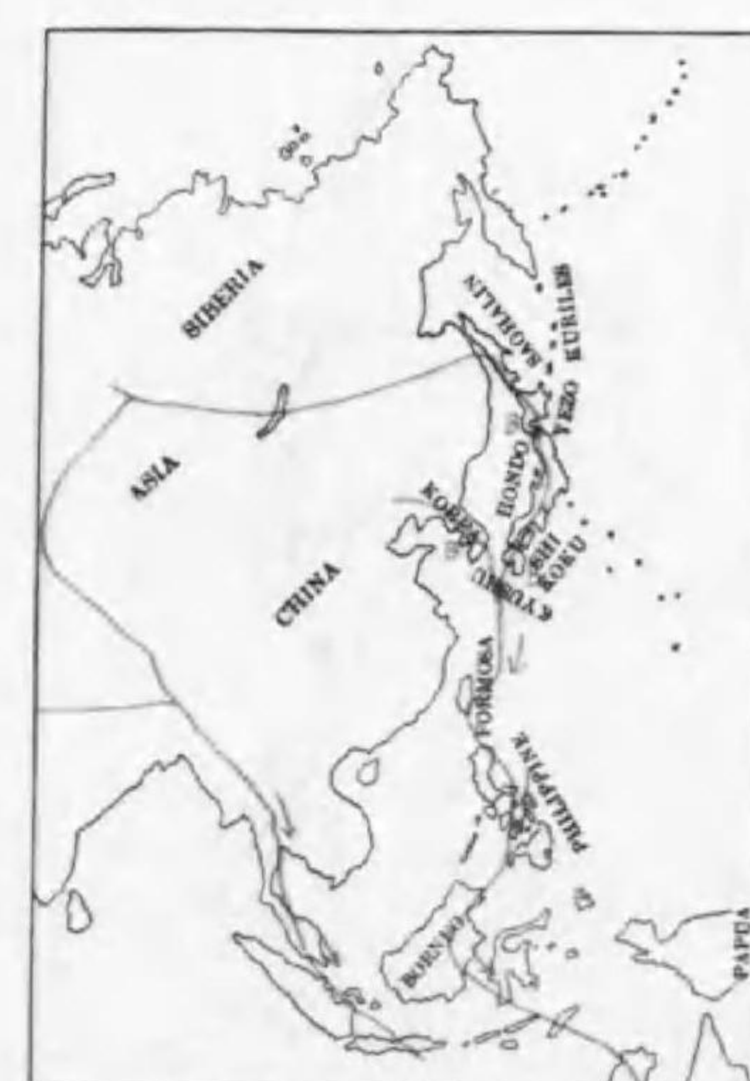
236. Charadrius dubius euronicus Gmelin コチドリ