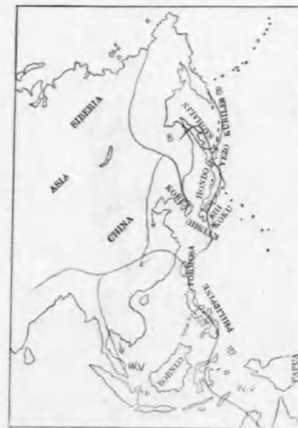
219. Pisobia minutilla acuminata (Midlendorffi) ヒバリシギ