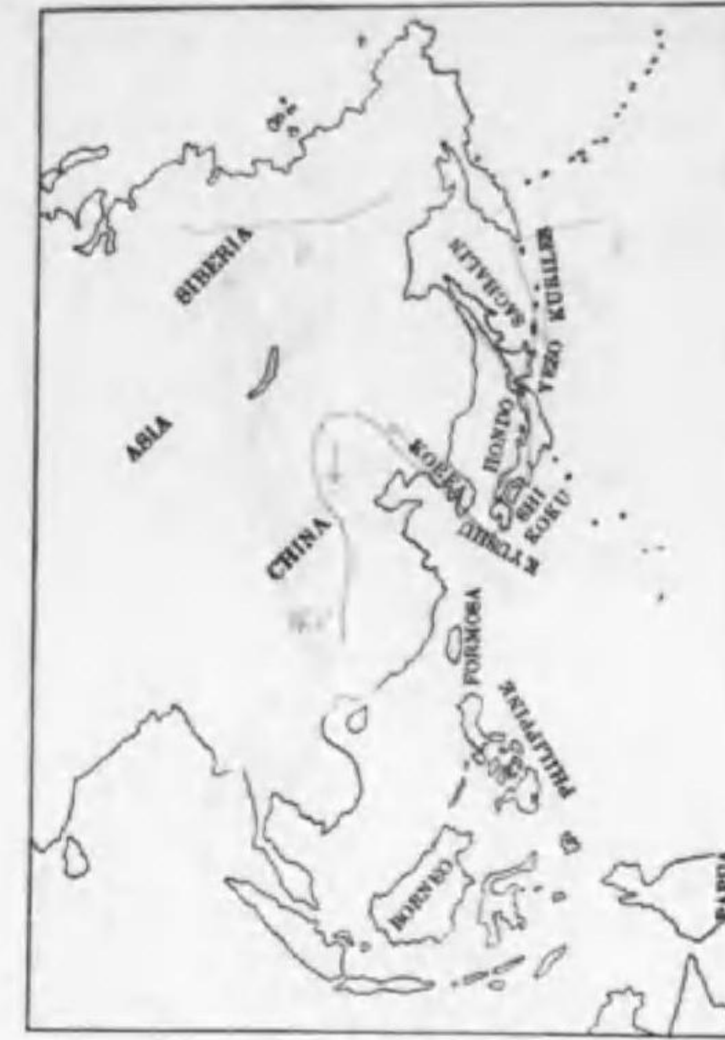
194. Colymbus arcticus veridigularis (Dwight) オホハム