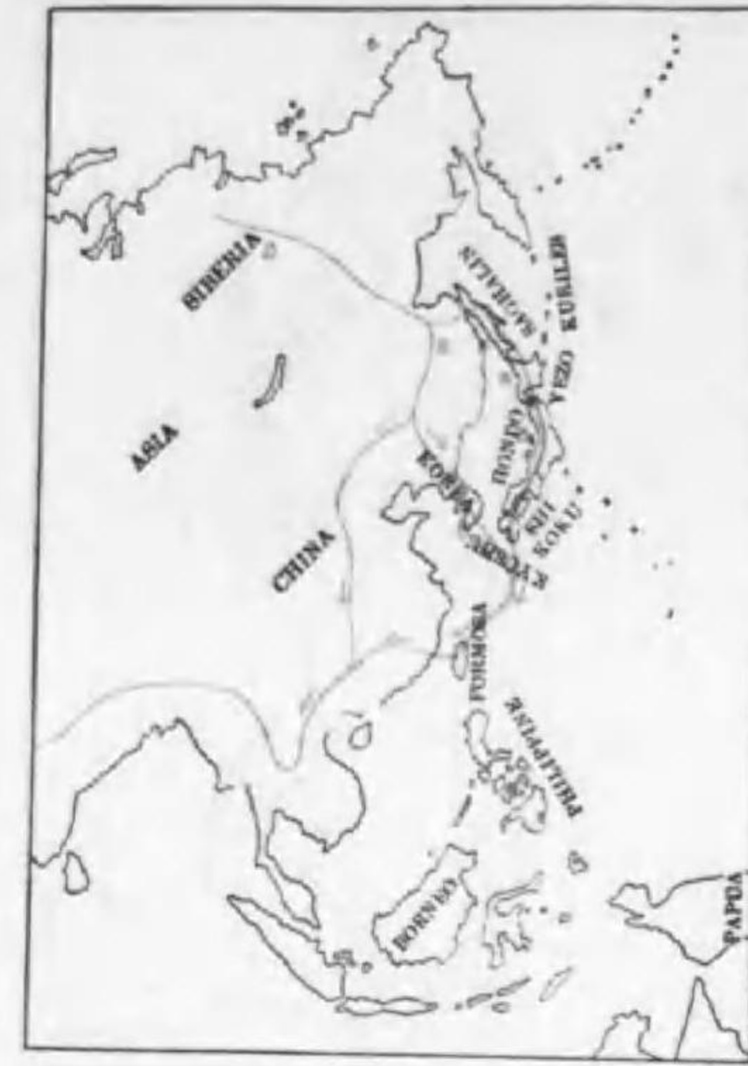
90. Saxicola torquata stejnegeri (Parrot) ノビタキ (B)