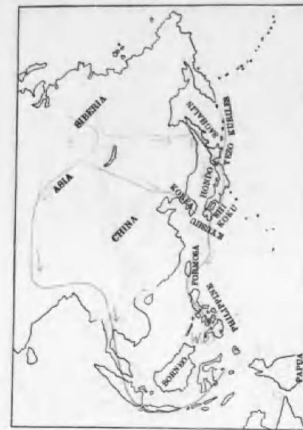
226. Capella gallinago gallinago (Linnaeus) タシギ