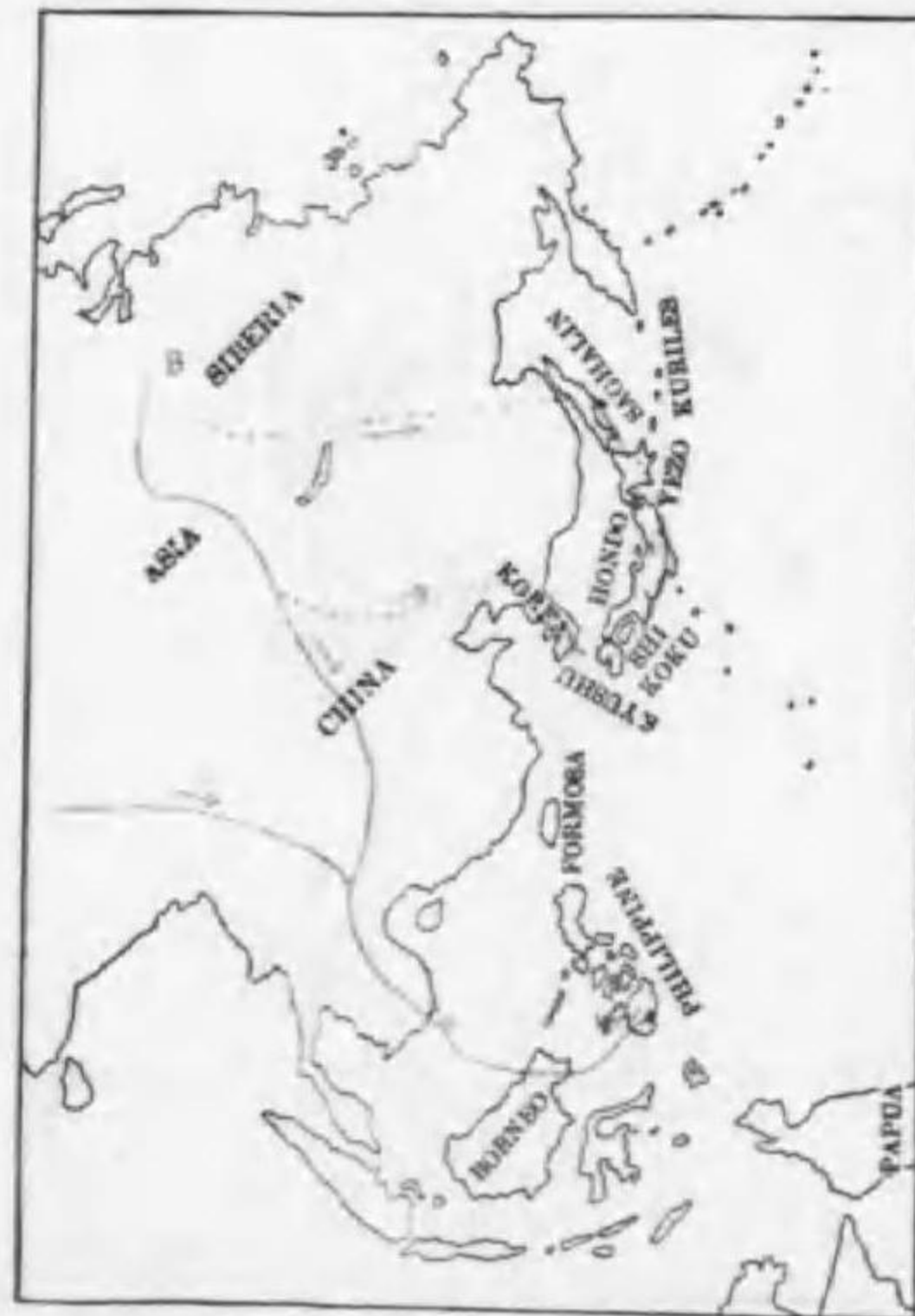
31. Emberiza pusilla Pallas コホホアカ