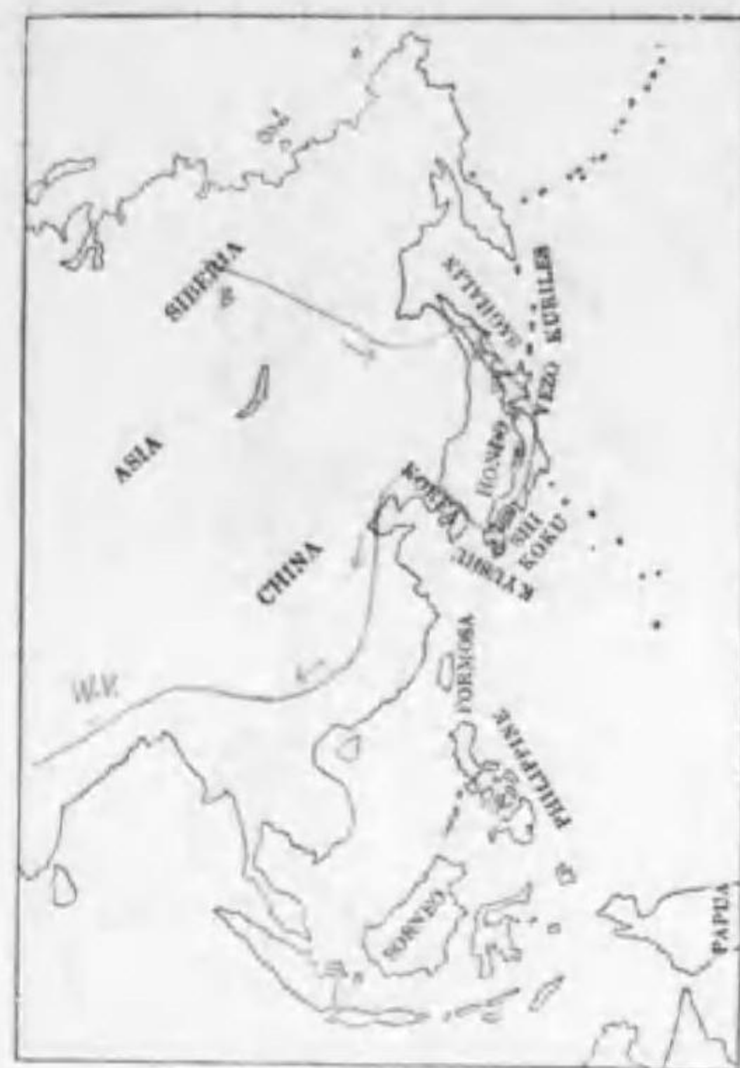
81. Aerocephalus histriciceps Swinhoe (B) コヨシキリ