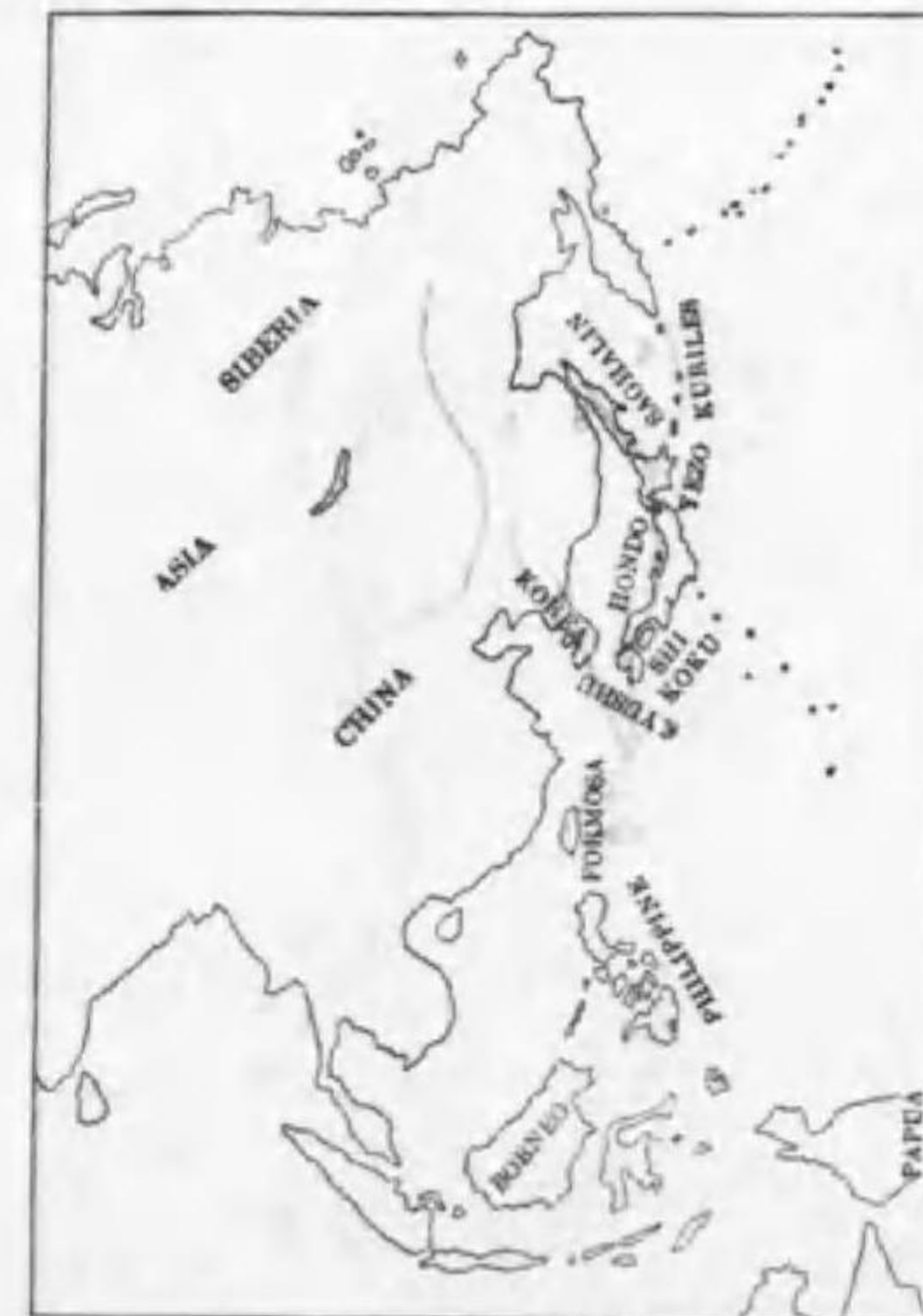
244. Larus schistisagus Stejneger (B) オホセグロカモメ