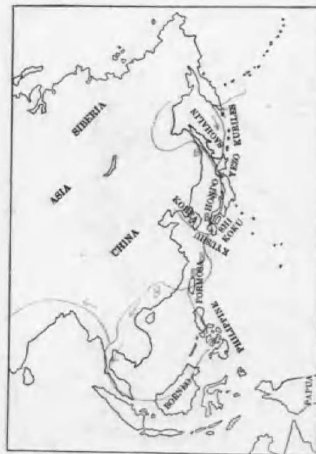
144. Haliaeetus pelagicus pelagicus (Pallas) オホワシ (B)