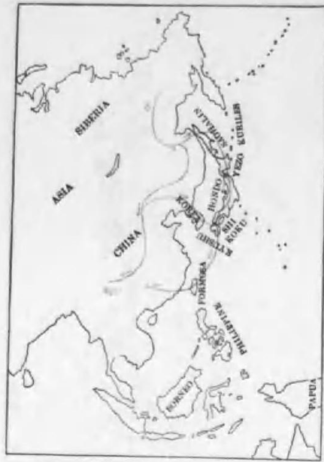
86. Turdus pallidus Gmelin シロハラ