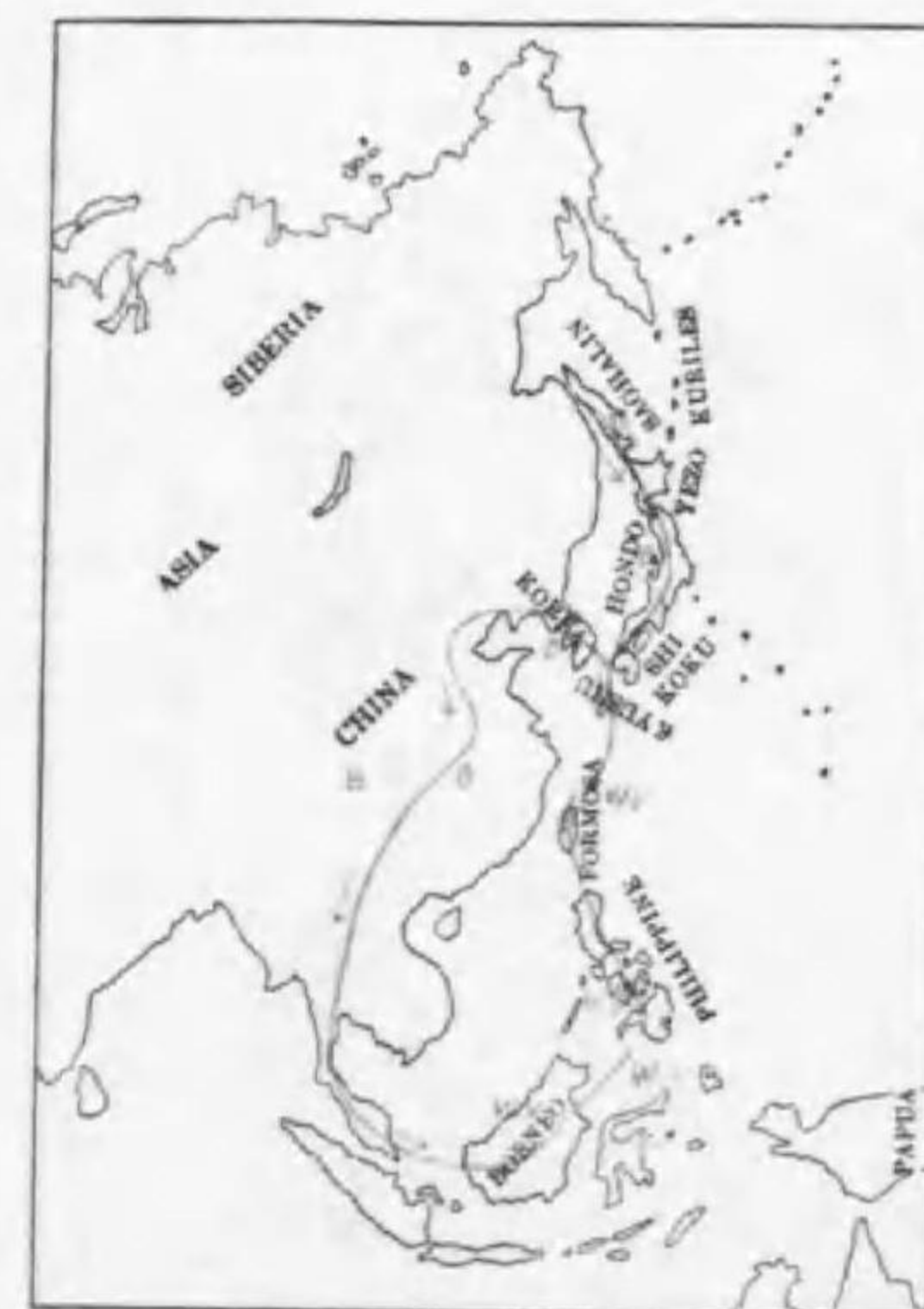
108. Halcyon coromanda major (Temminck & Schlegel) アカセウビン