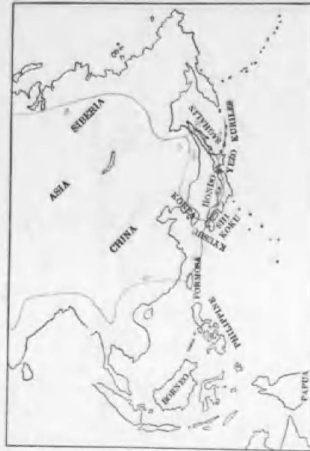
89. Turdus cinomus Temminck (B) フグミ