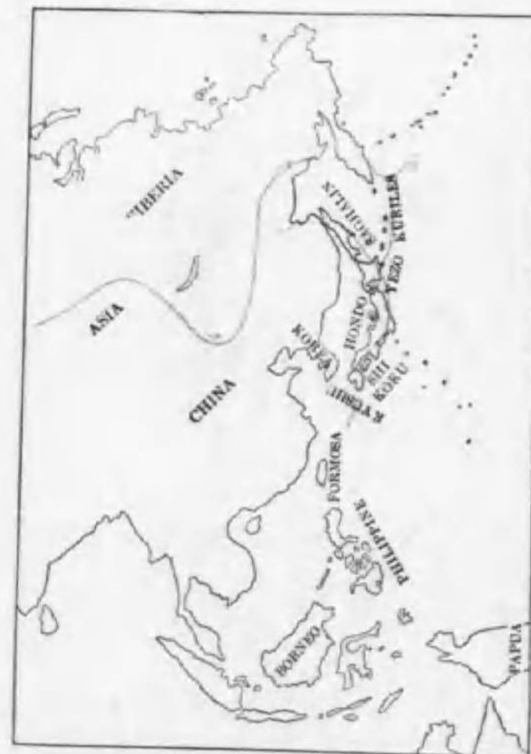
40. Chionophilus alpestris flavus (Gmelin) ハマヒバリ