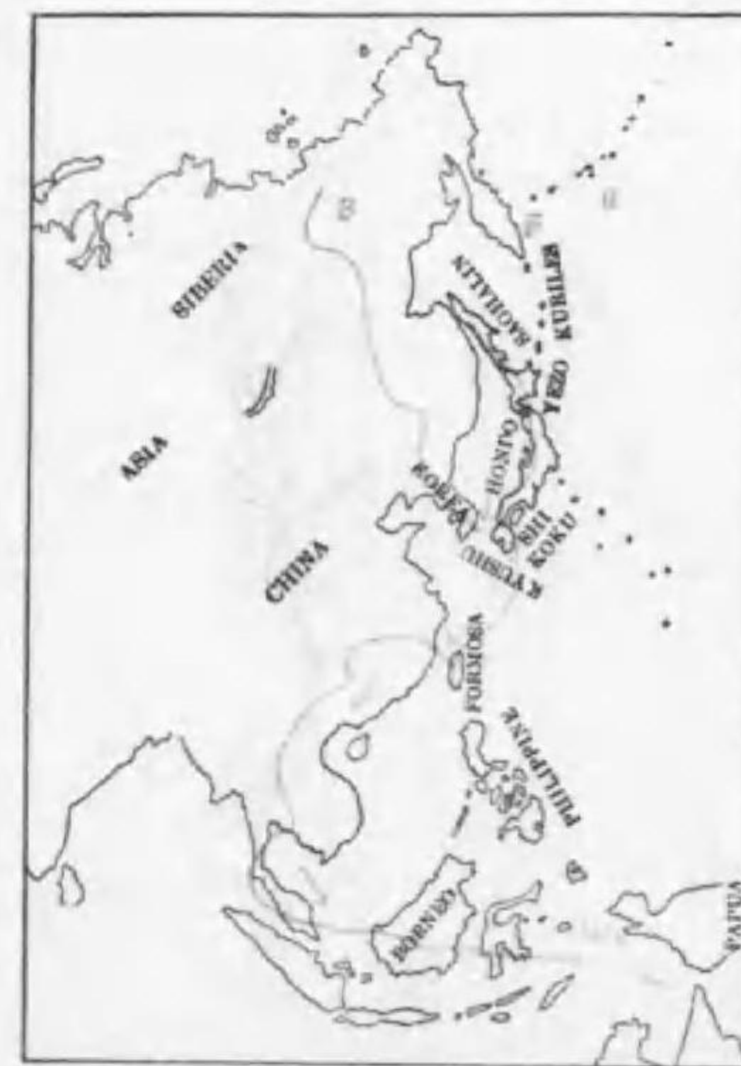
243. Larus argentatus vegae Palmén セグロカモメ