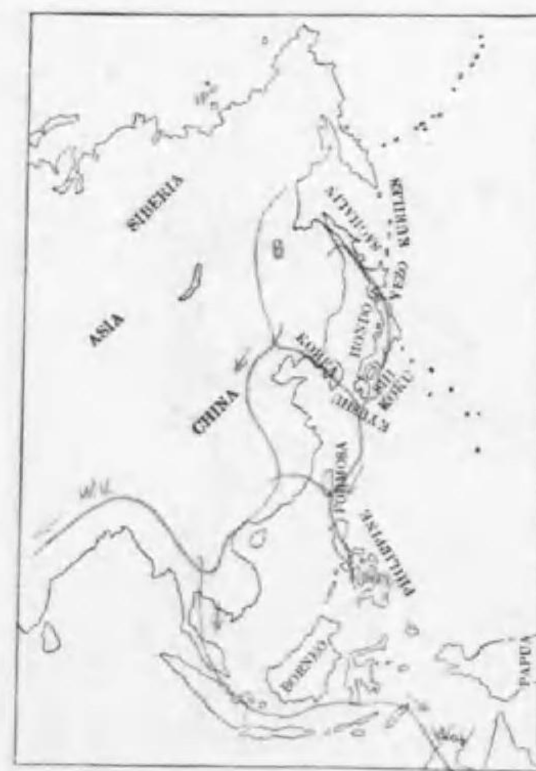
227. Capella megala (Swinhog) チウヂンギ