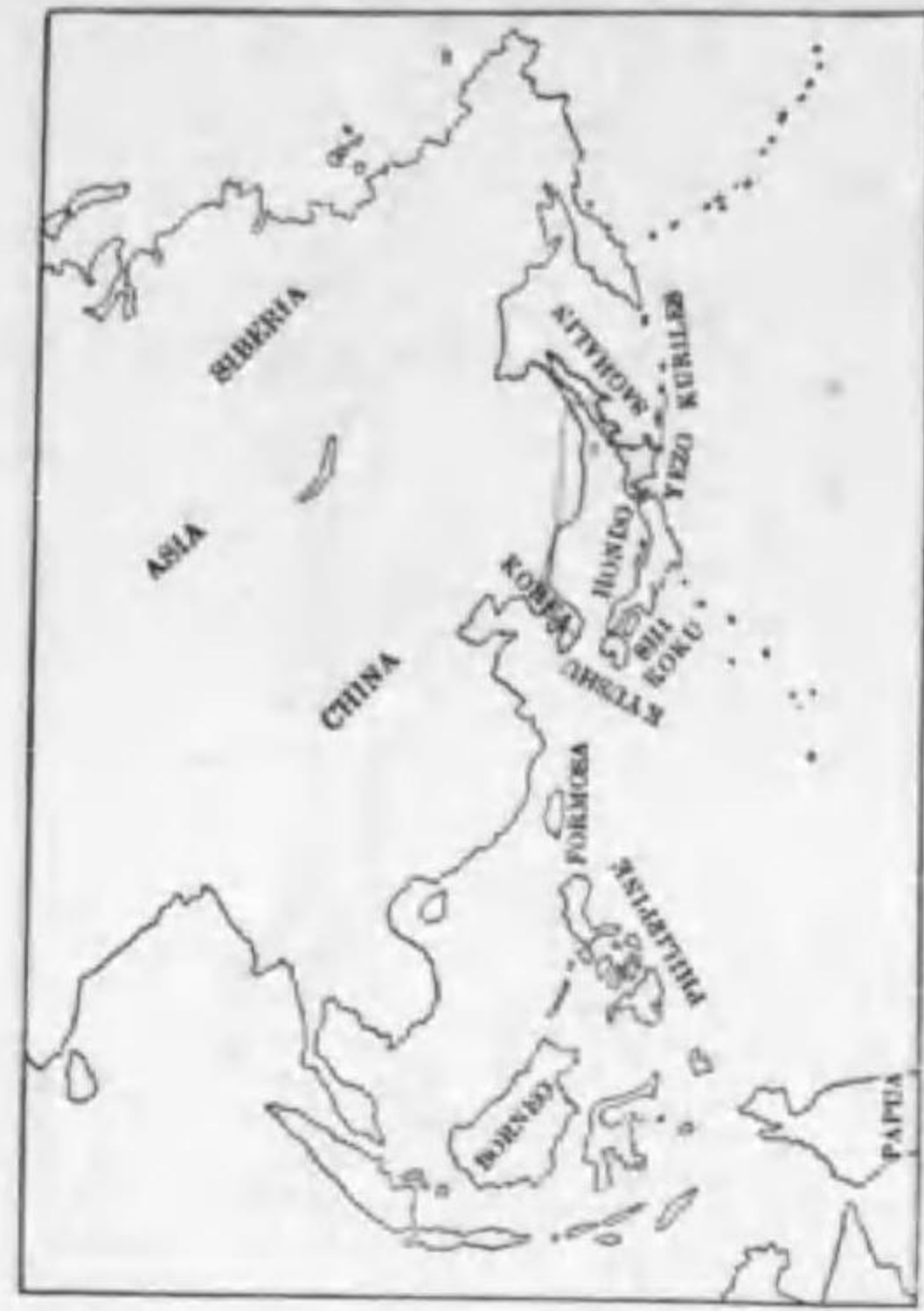
6. Garrulus glandarius taeanensis Lönnerberg (B) カラフトミヤマカケス