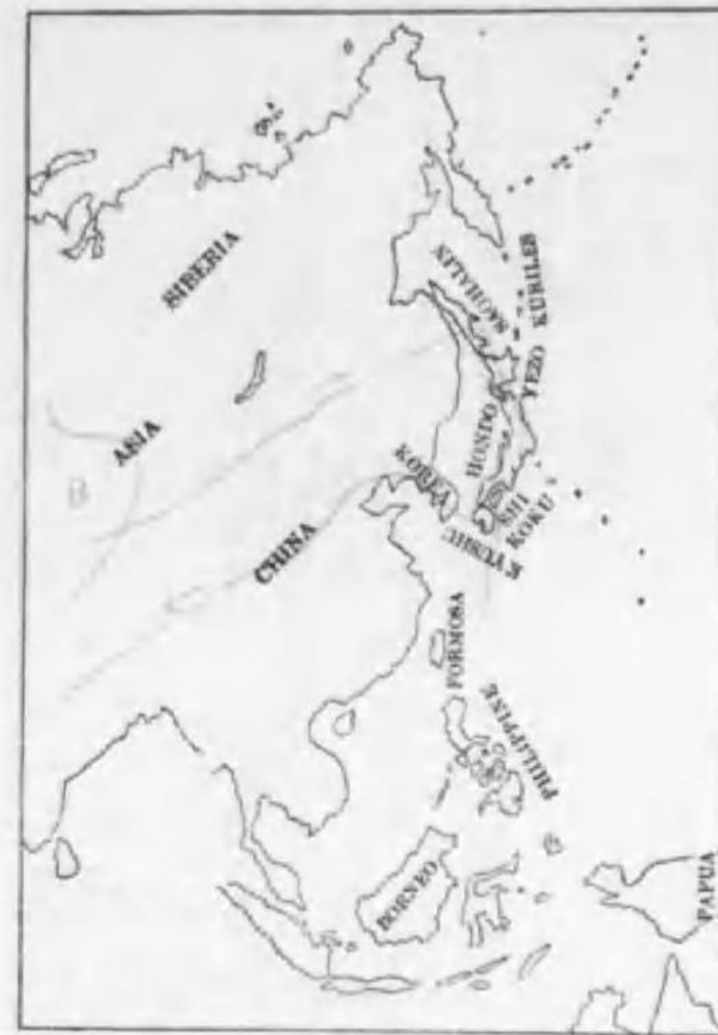
225. Capella solitaria (Hodgson) アラシギ