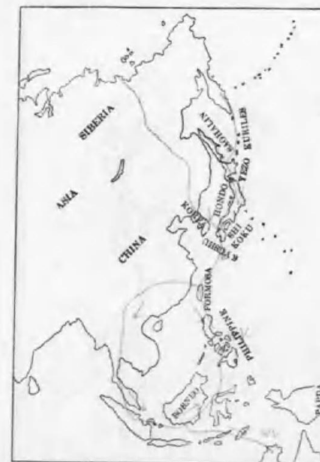
212. Numenius cyanopus Vieillot ホウロクシギ