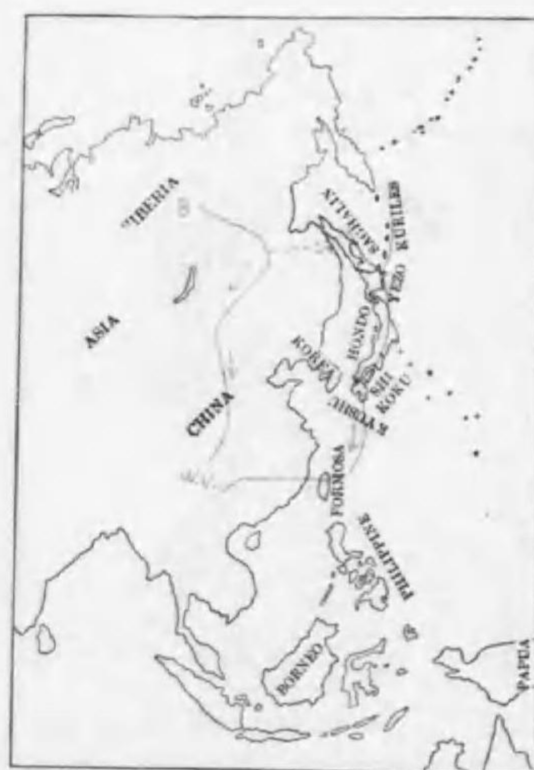
160. Anser fabalis serrirostris Swinhoe ヒシクヒ