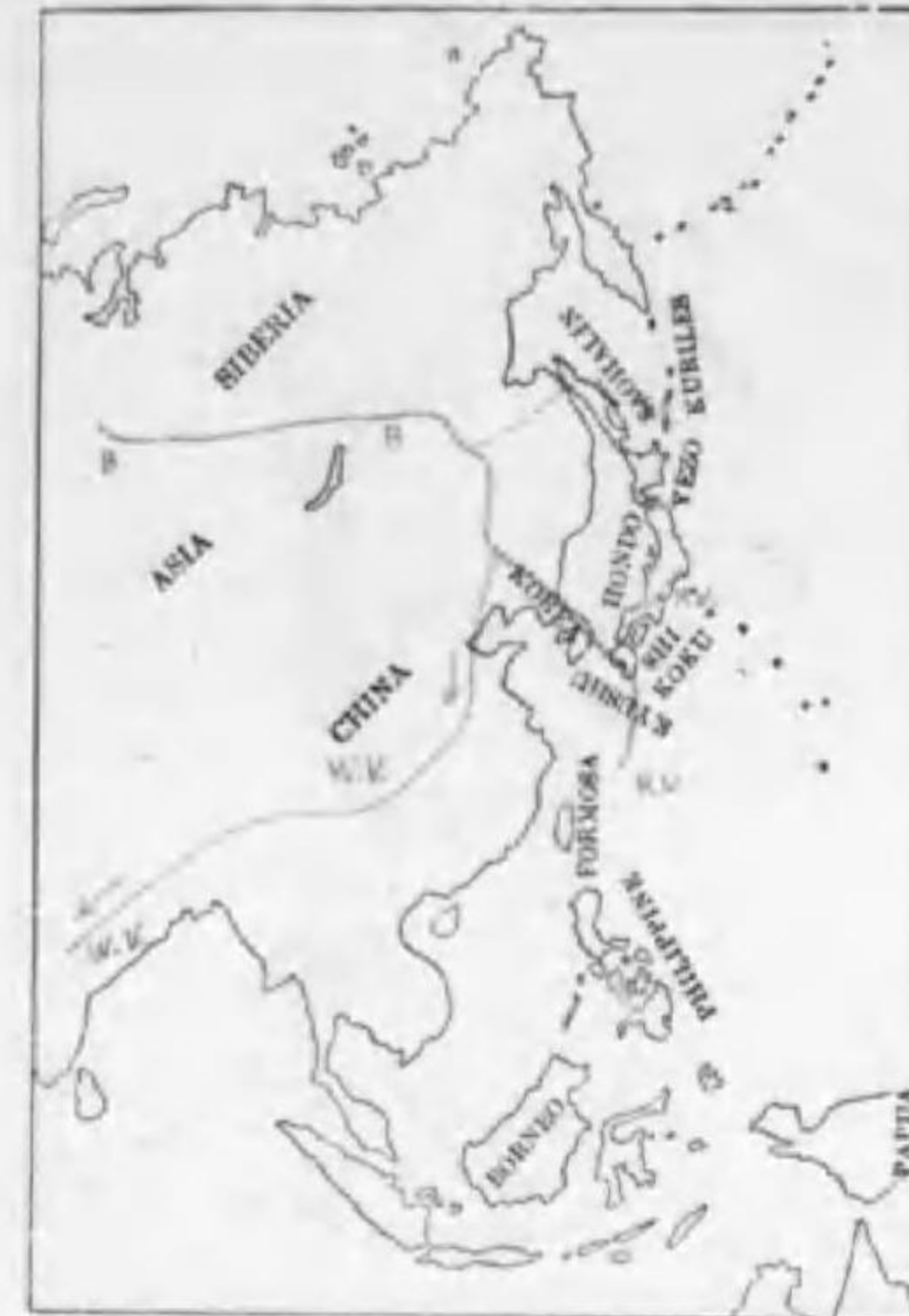
145. Ciconia nigra (Linnaeus) (St.) ナベカフ