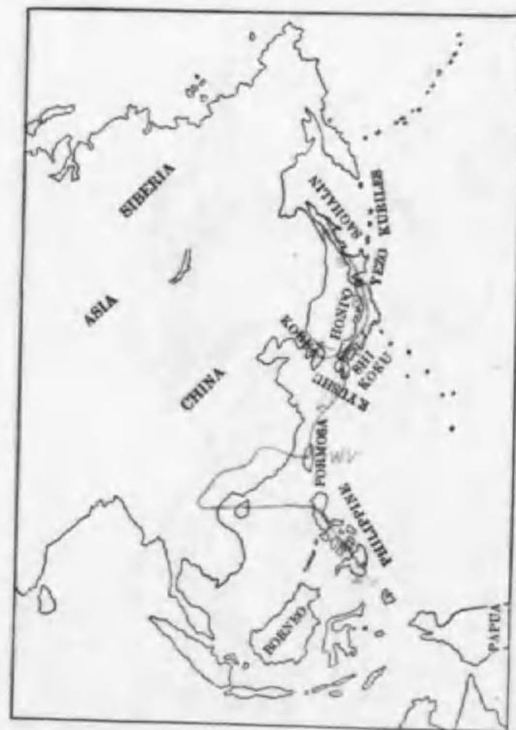
88. Turdus chrysolaus chrysolaus Tmeminck (B) アカハラ