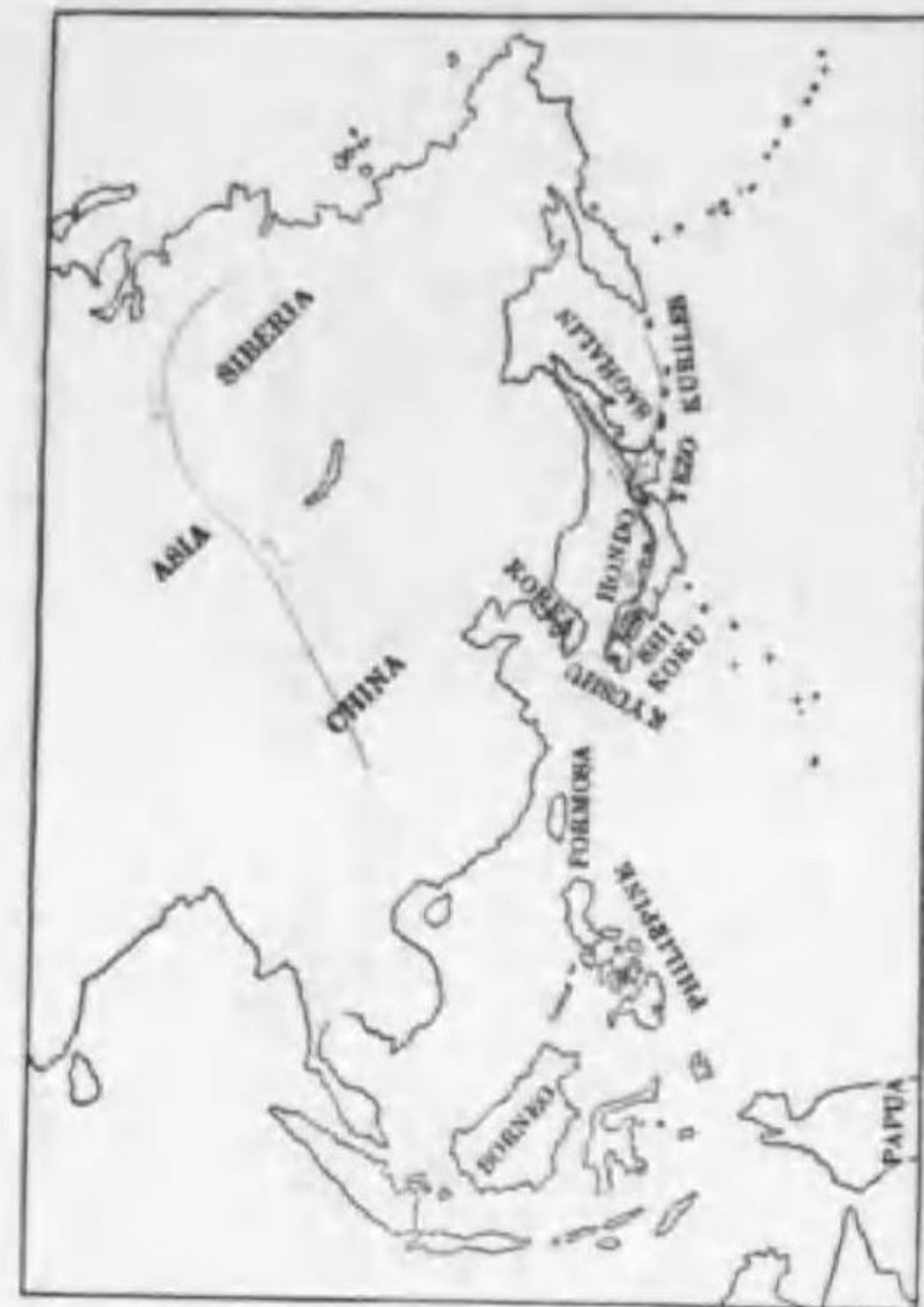
22. Loxia curvirostra japonica Ridgway イ ス カ