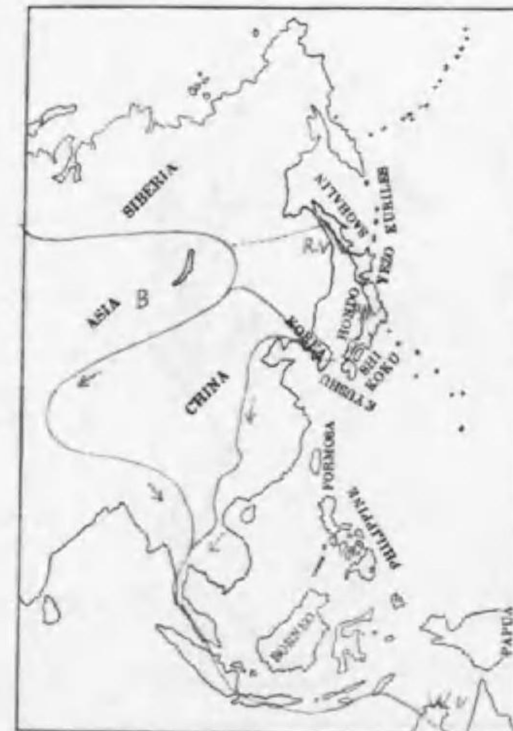
204. Tringa totanus eurhinus (Oberholser) アカアシシギ (Rv.)