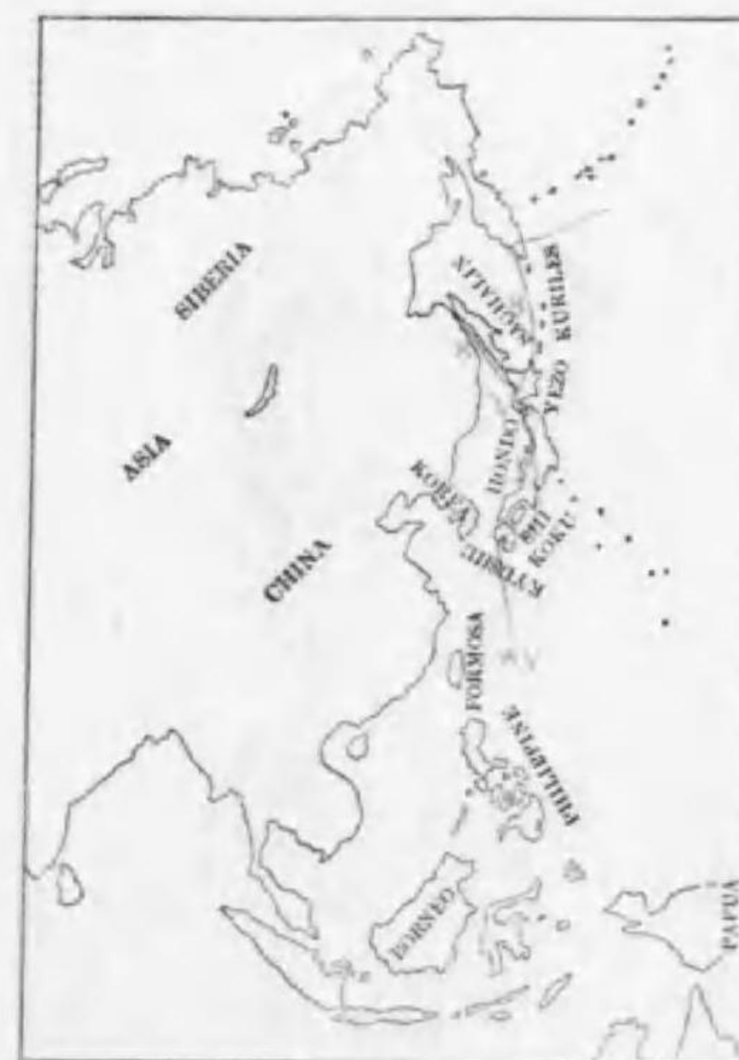
163. Anas platyrhynchos platyrhynchos (Linnaeus) マガモ