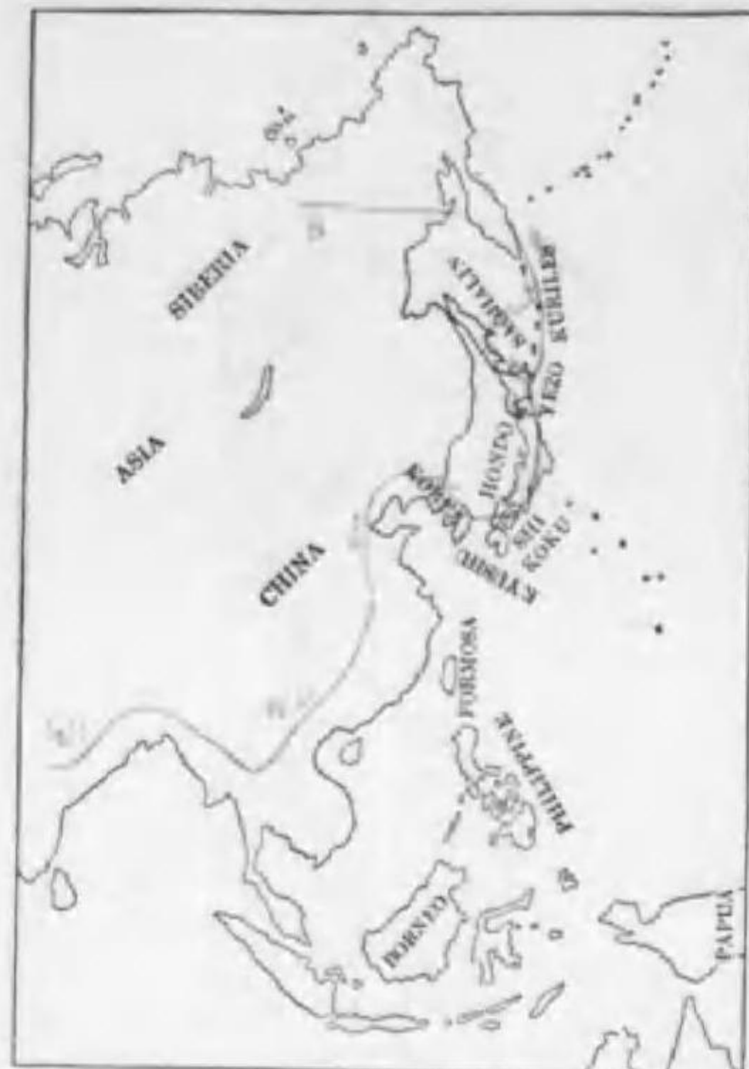
134. Falco subluteo subluteo Linnaeus チゴハヤブサ