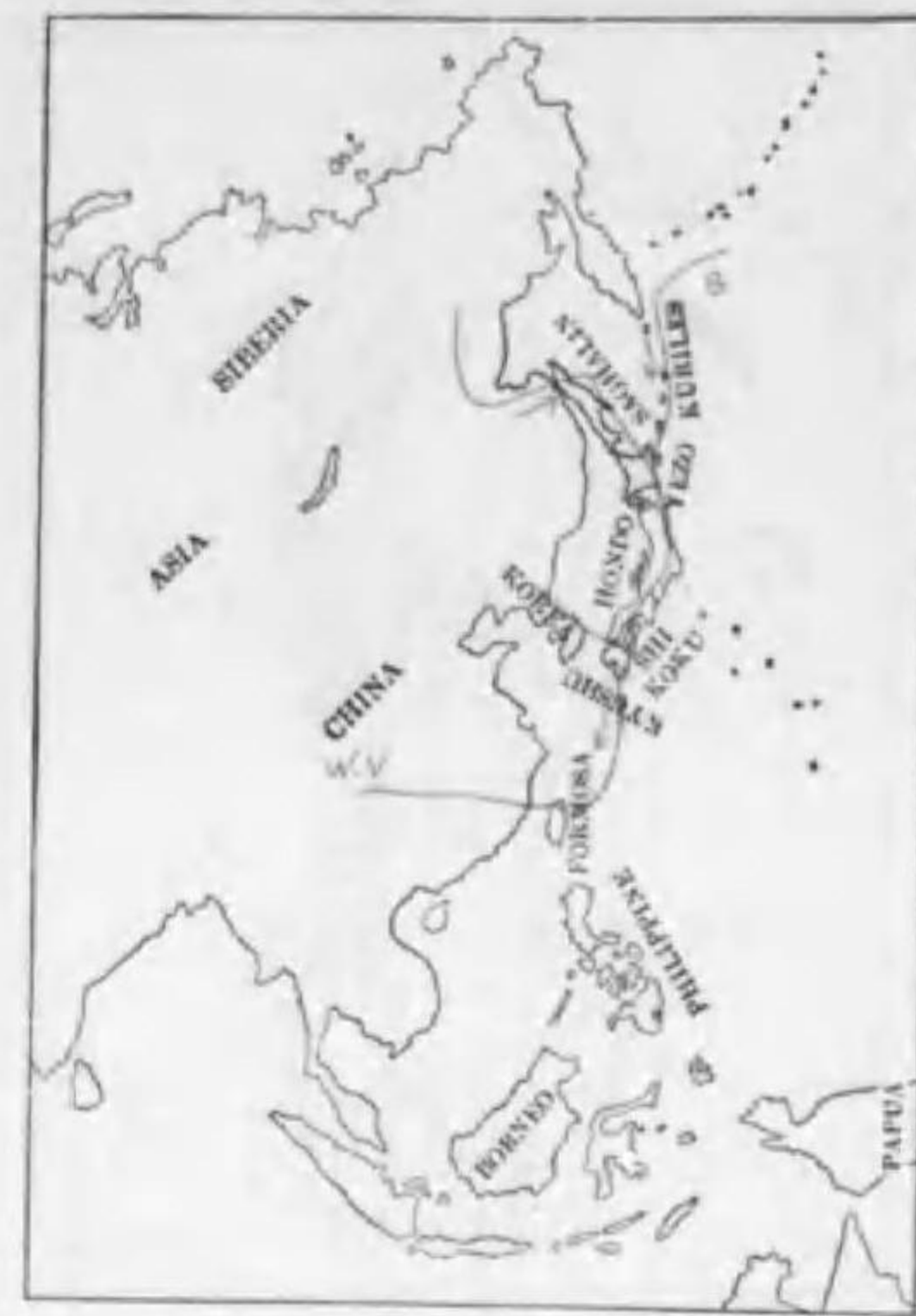
158. Anser albifrons (Scopoli) マガン