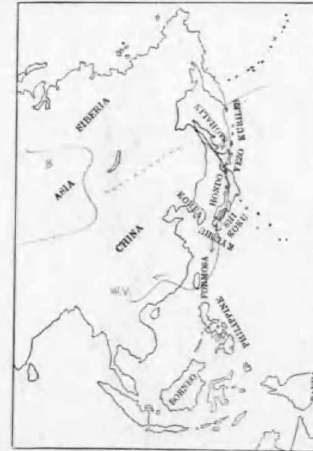
196. Colymbus stellatus Pontoppidan アビ