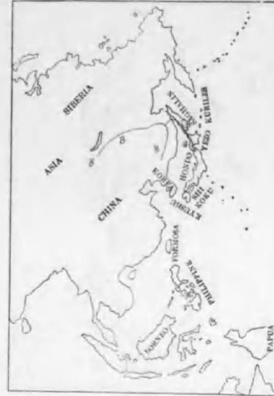
113. Dryobates minor amurensis (Buturlin) コアカゲラ (B)