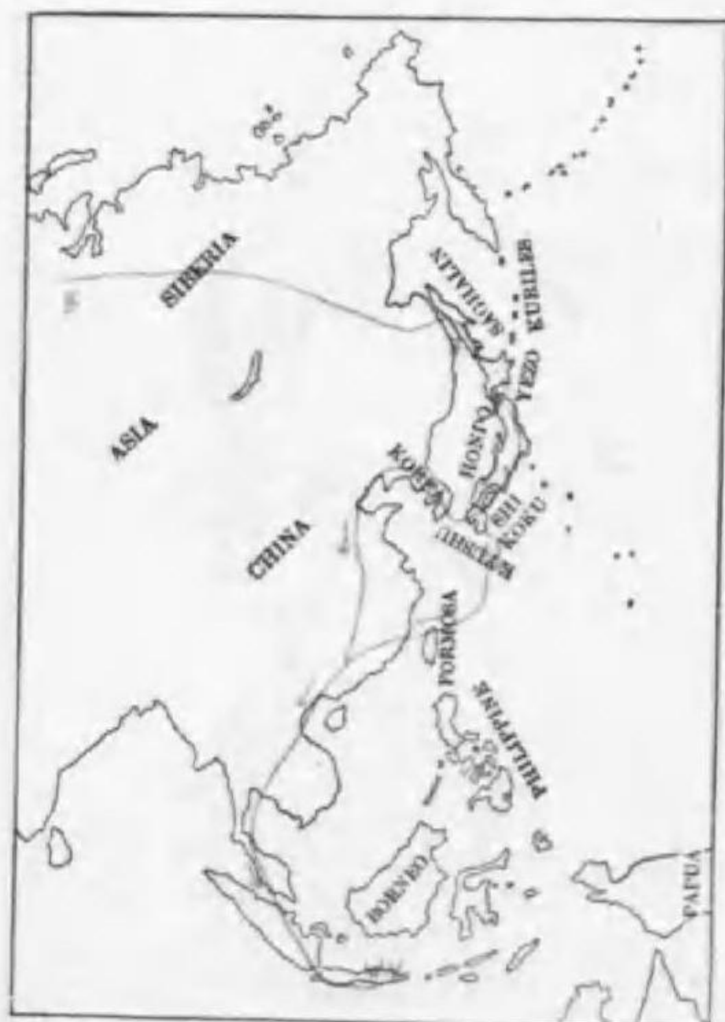
48. Dendronanthus indicus (Gmelin) (B) イワミセキレイ