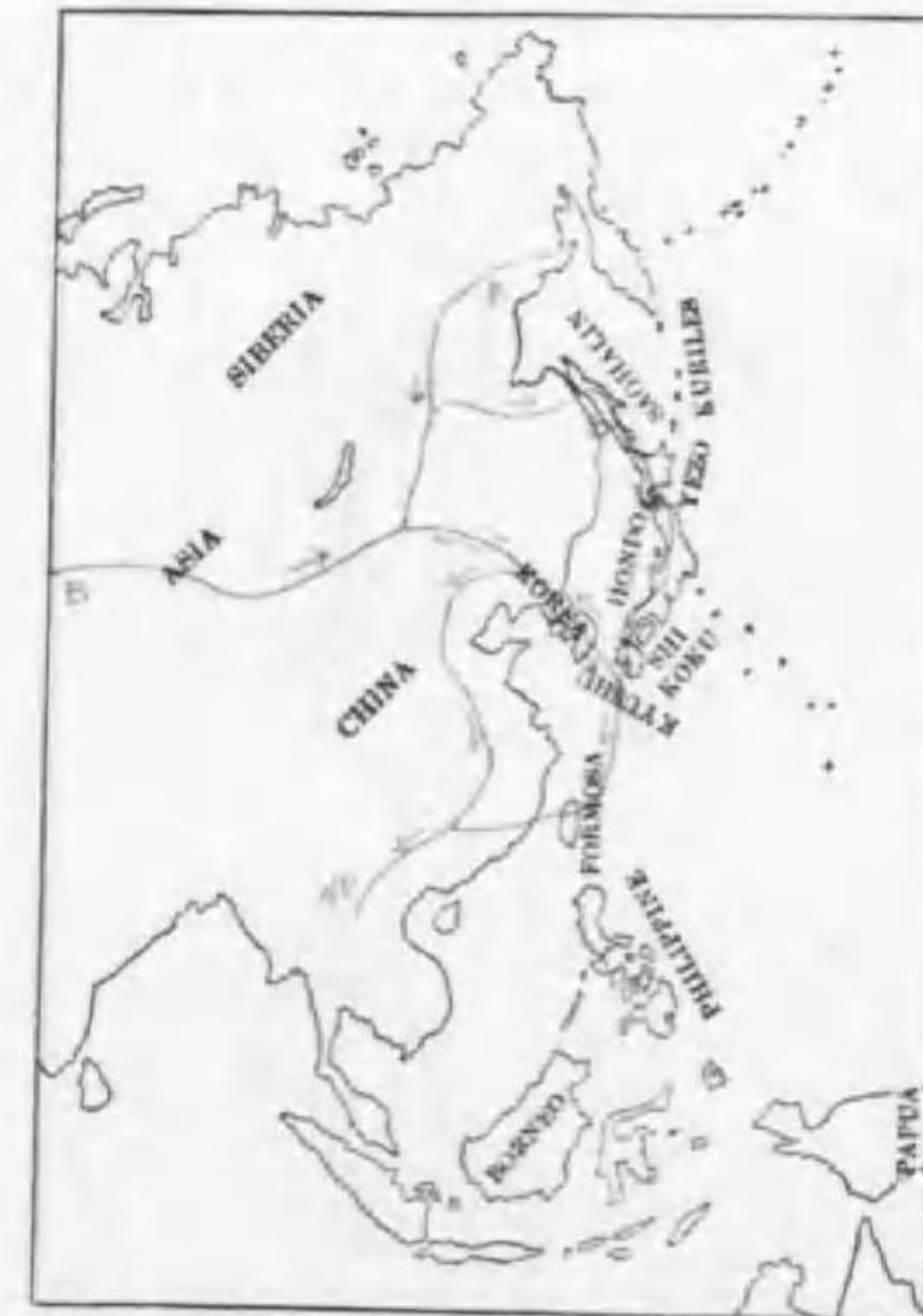
92. Phoenicurus auroreus auroreus (Pallas) ジャウビタキ (B)