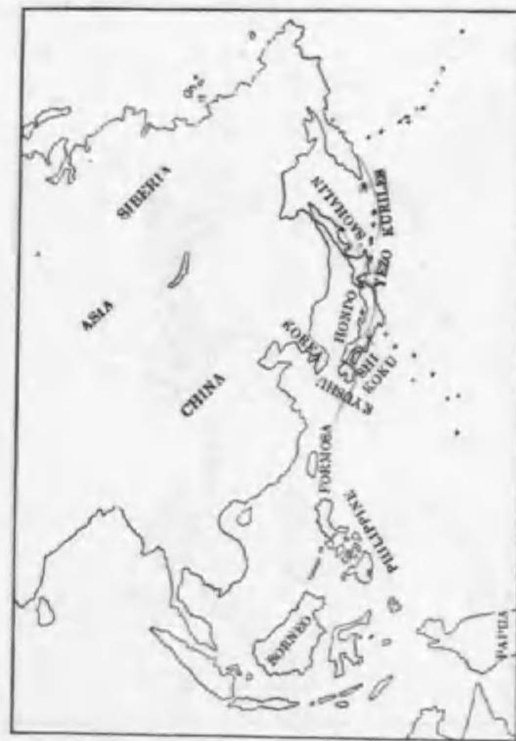
11. Chloris sinica kawrahiba (Temminck) オホカハラヒワ (R.V.)