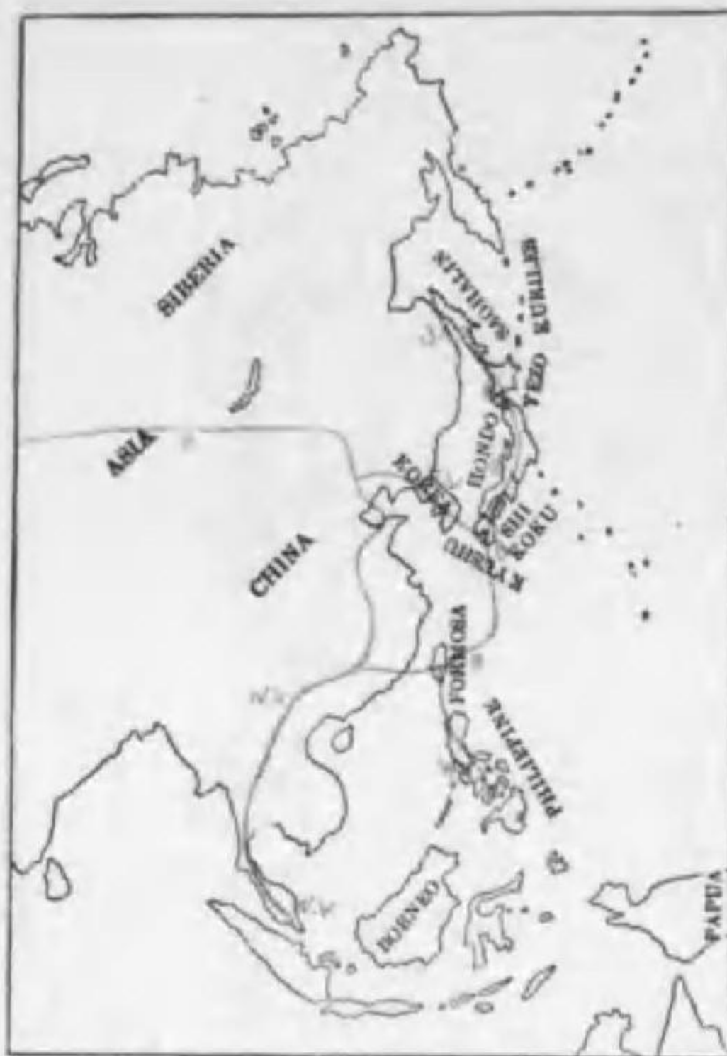
150. Nycticorax nycticorax nycticorax (Linnaeus) (St.) ゴキサギ