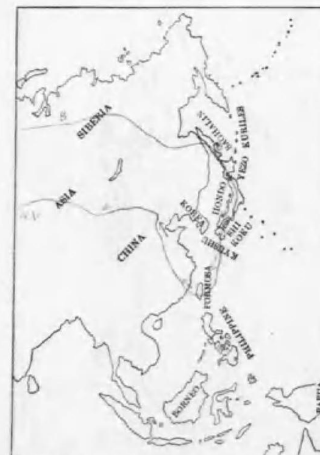
156. Cygnus bewickii jankowskii Alpheraky (B) ハクテウ