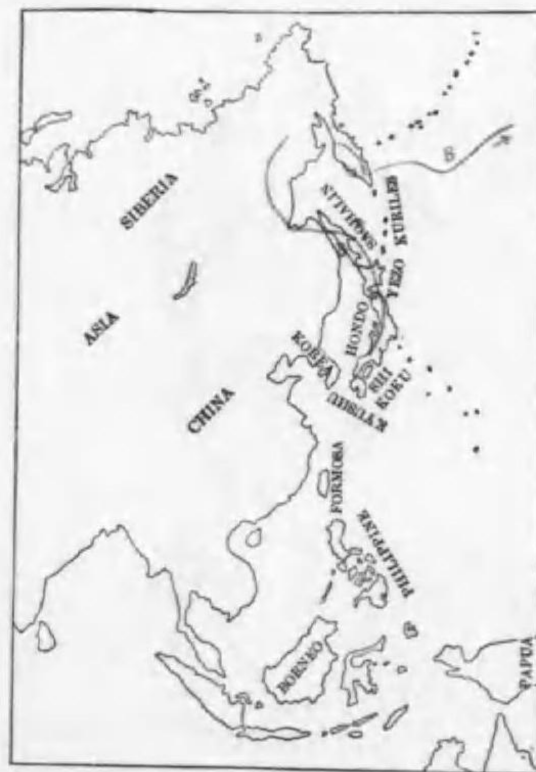
247. Larus hyperboreus Gunnerus (B) シロカモメ