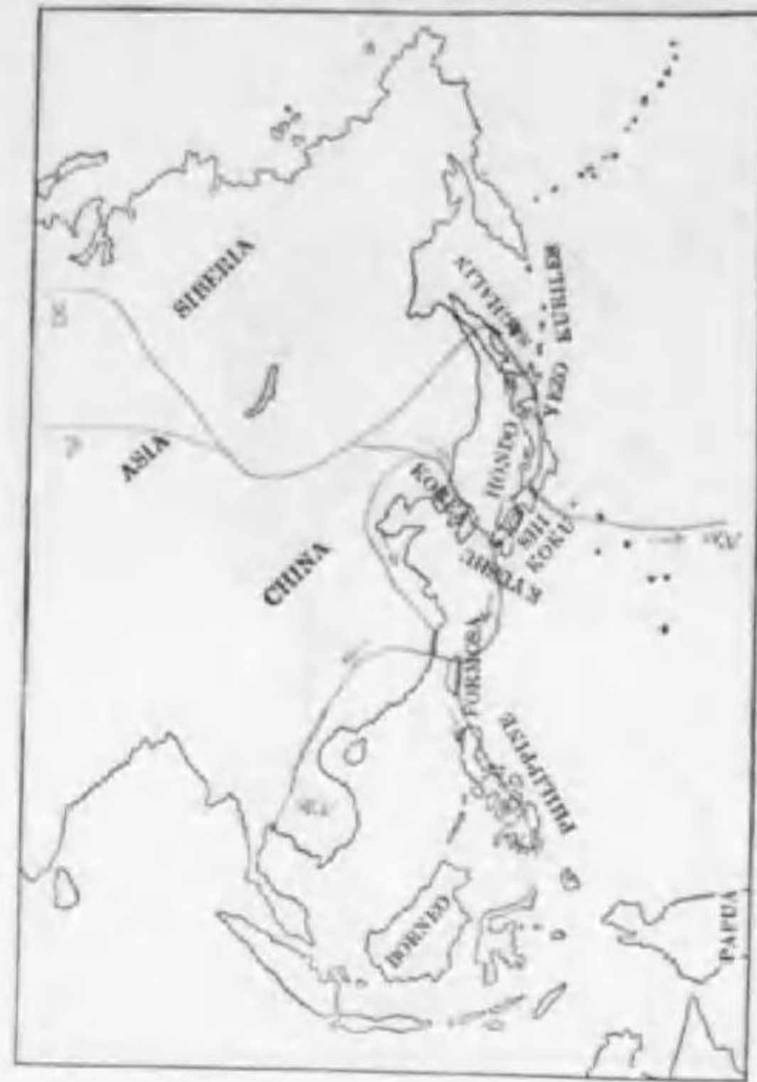
94. Luscinia calliope calliope (Pallas) ノゴマ (B)