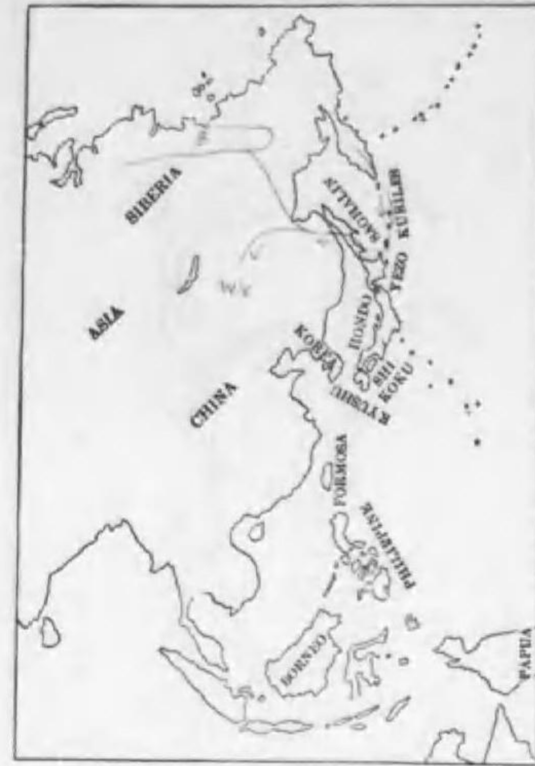
182. Somateria spectabilis Linnaeus ケワタガモ