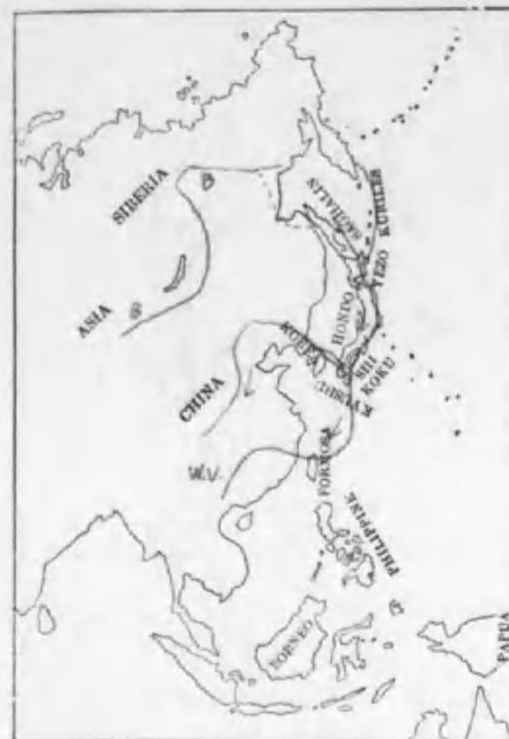
177. Bucephala clangula clangula (Linnaeus) ボネジロガモ