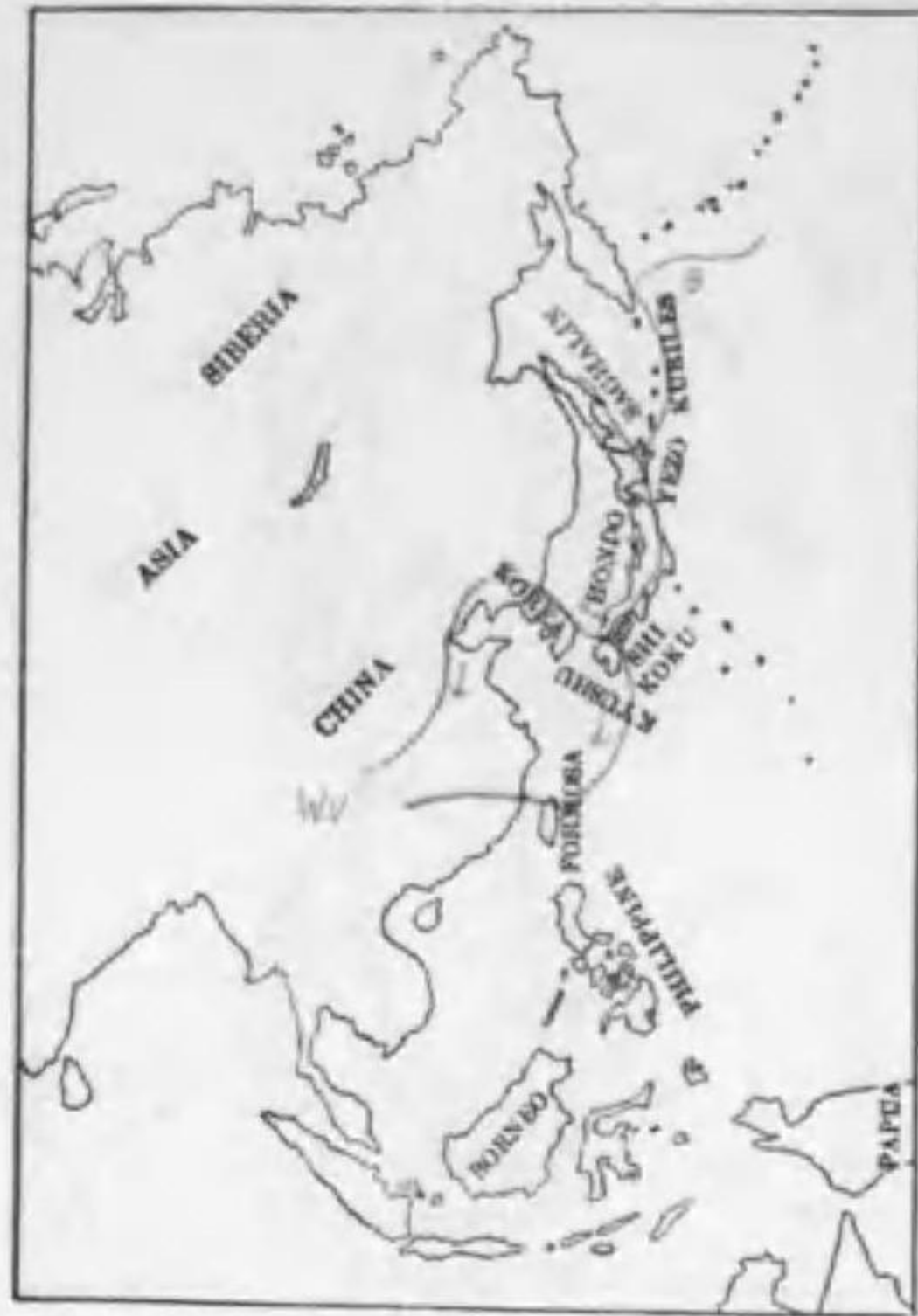
157. Cygopsis cygnoid (Linnaeus) サカヅラガン