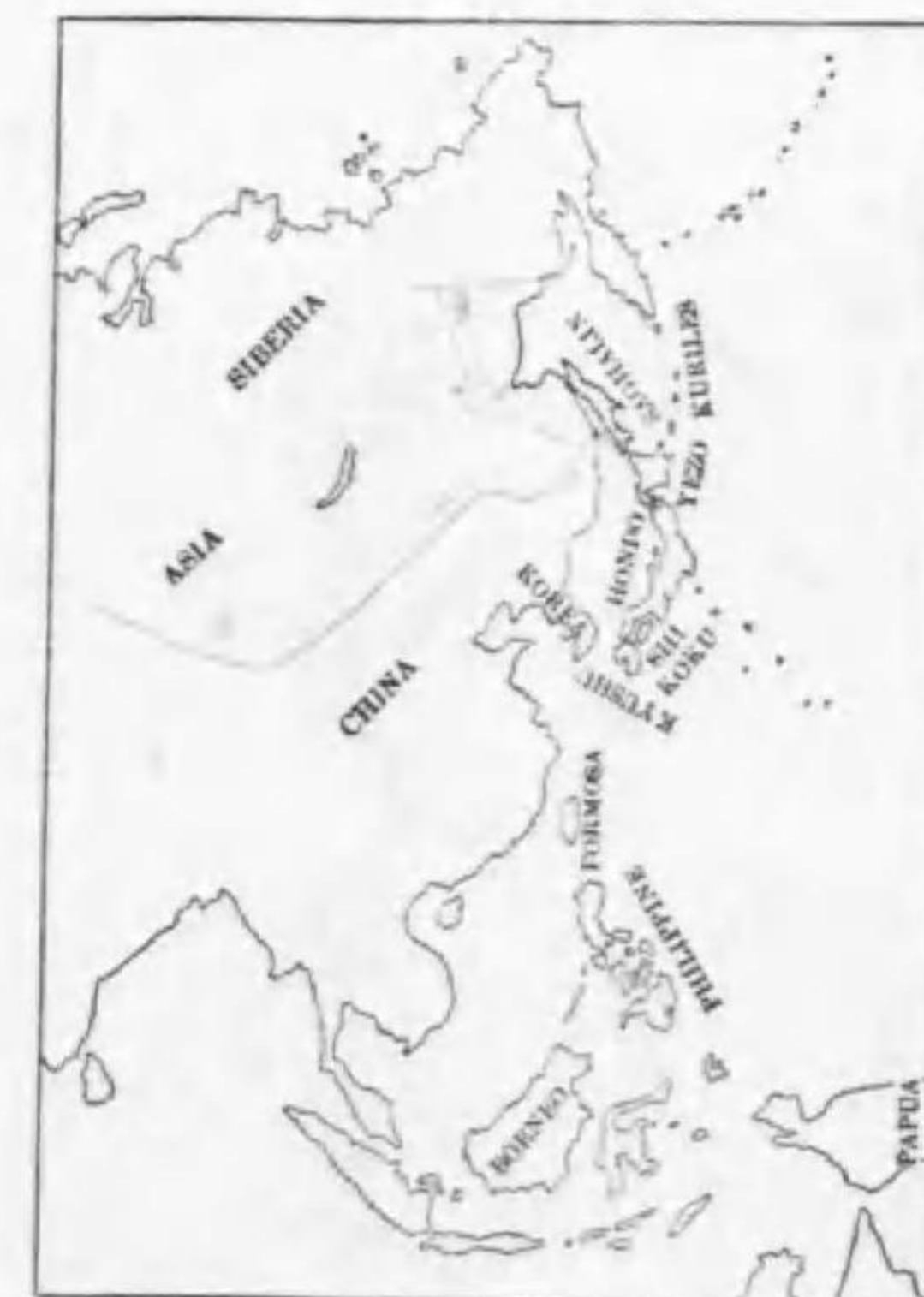
100. Delichon urbica schlegii (Swinhoe) シベリアイハツバメ