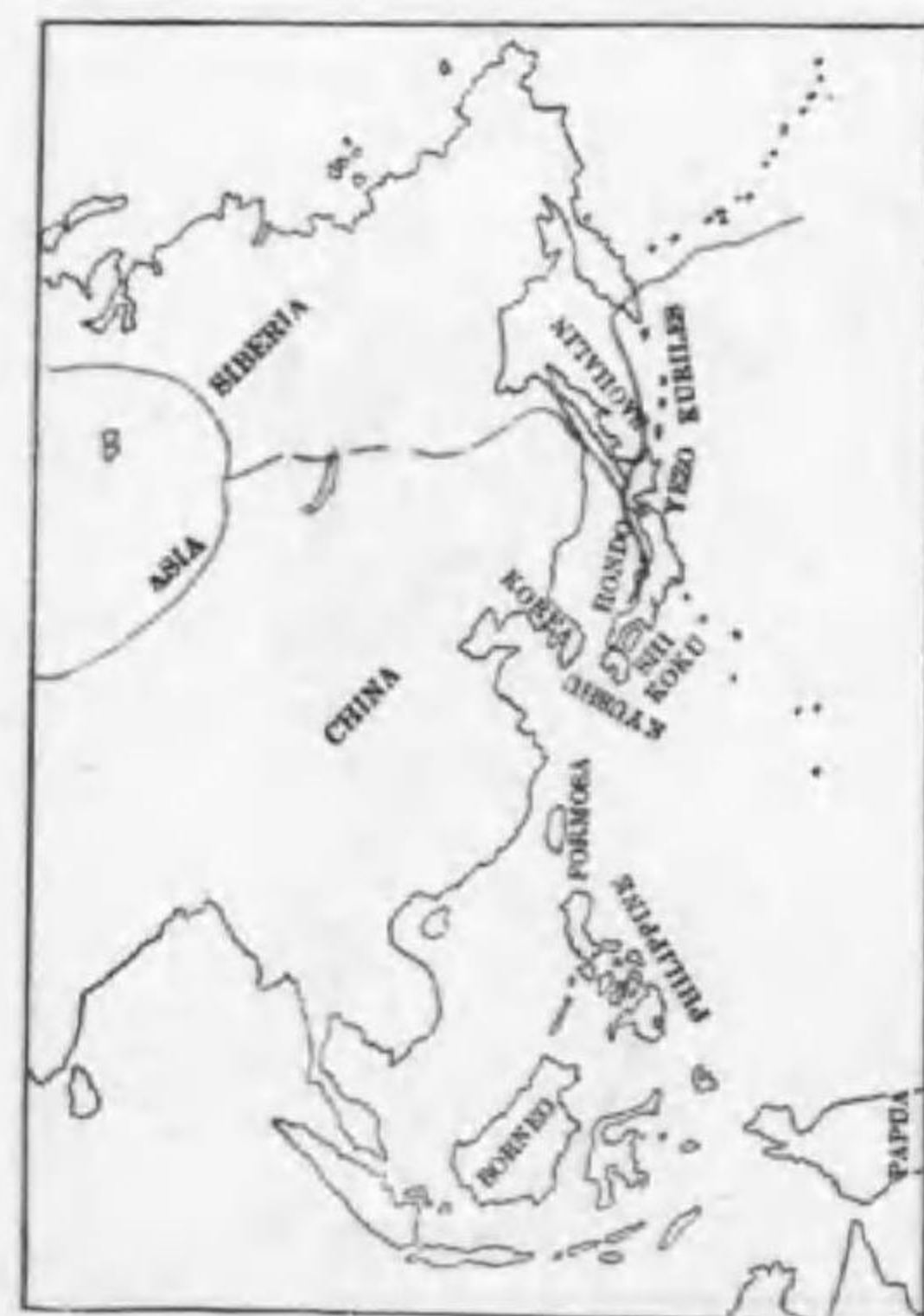
231. Eudromias morinellus (Linnaeus) コバシチドリ