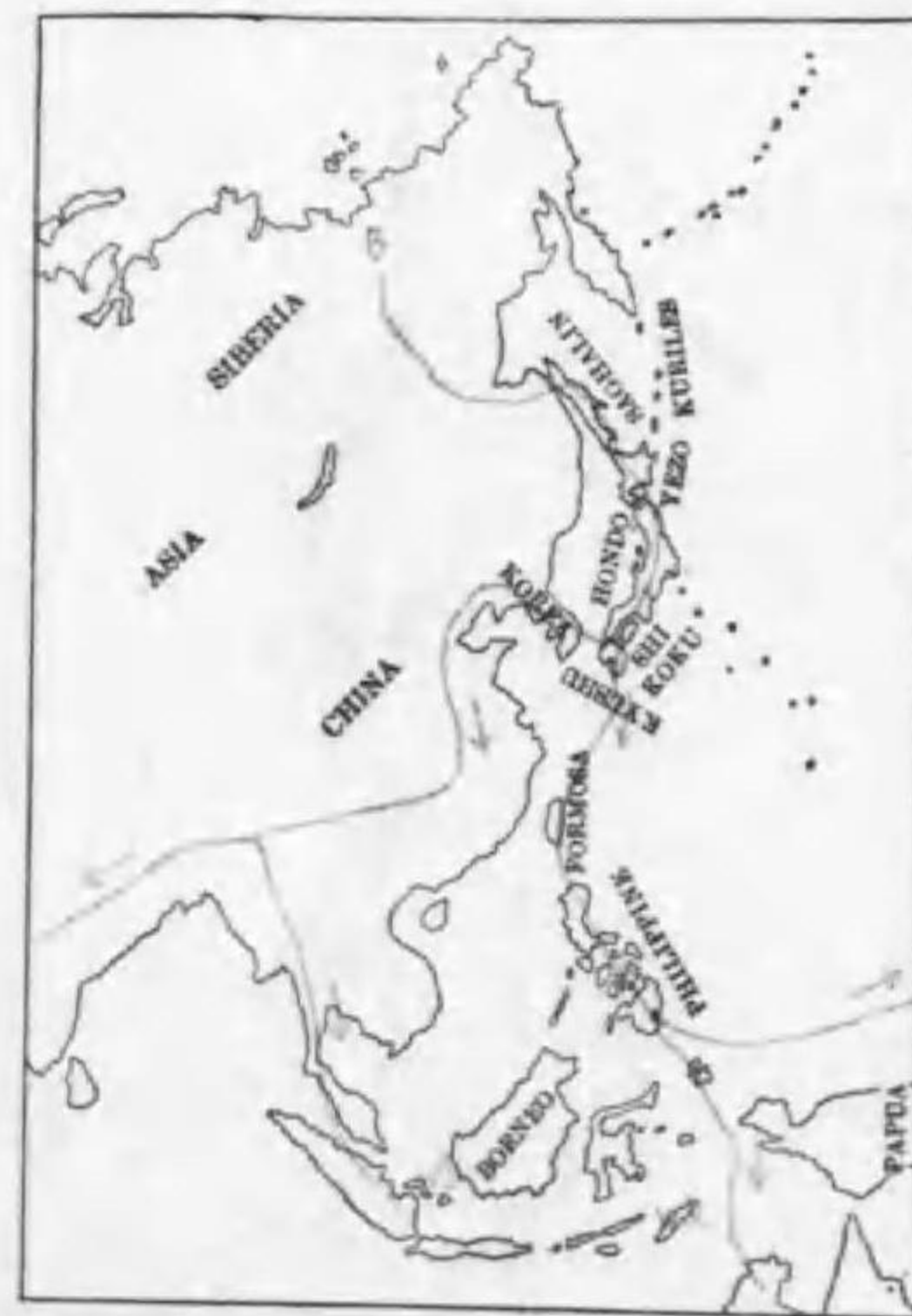
239. Arenaria interpres interpres (Linnaeus) キヤウジョシギ