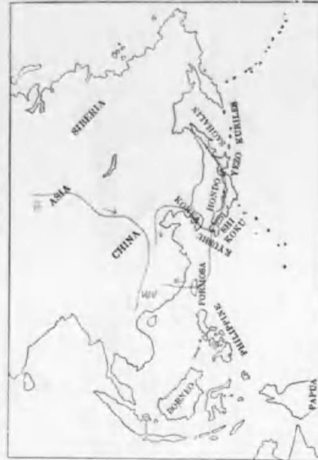
249. Larus sawadersi (Swinhoe) ヅクロカモメ