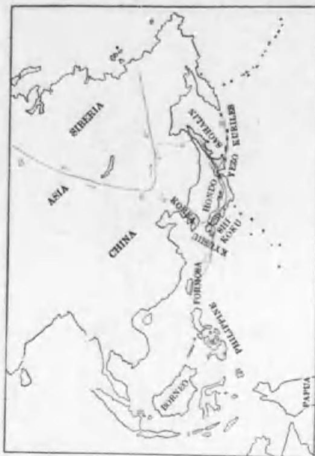
57. Regulus regulus japonensis Blkiston キクイタダキ (B)