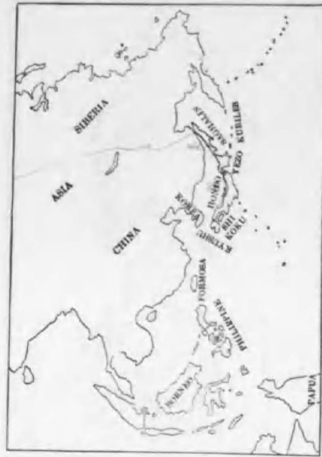
14. Carduelis flammea exilipes (Coues) コベニヒワ (W.V.)