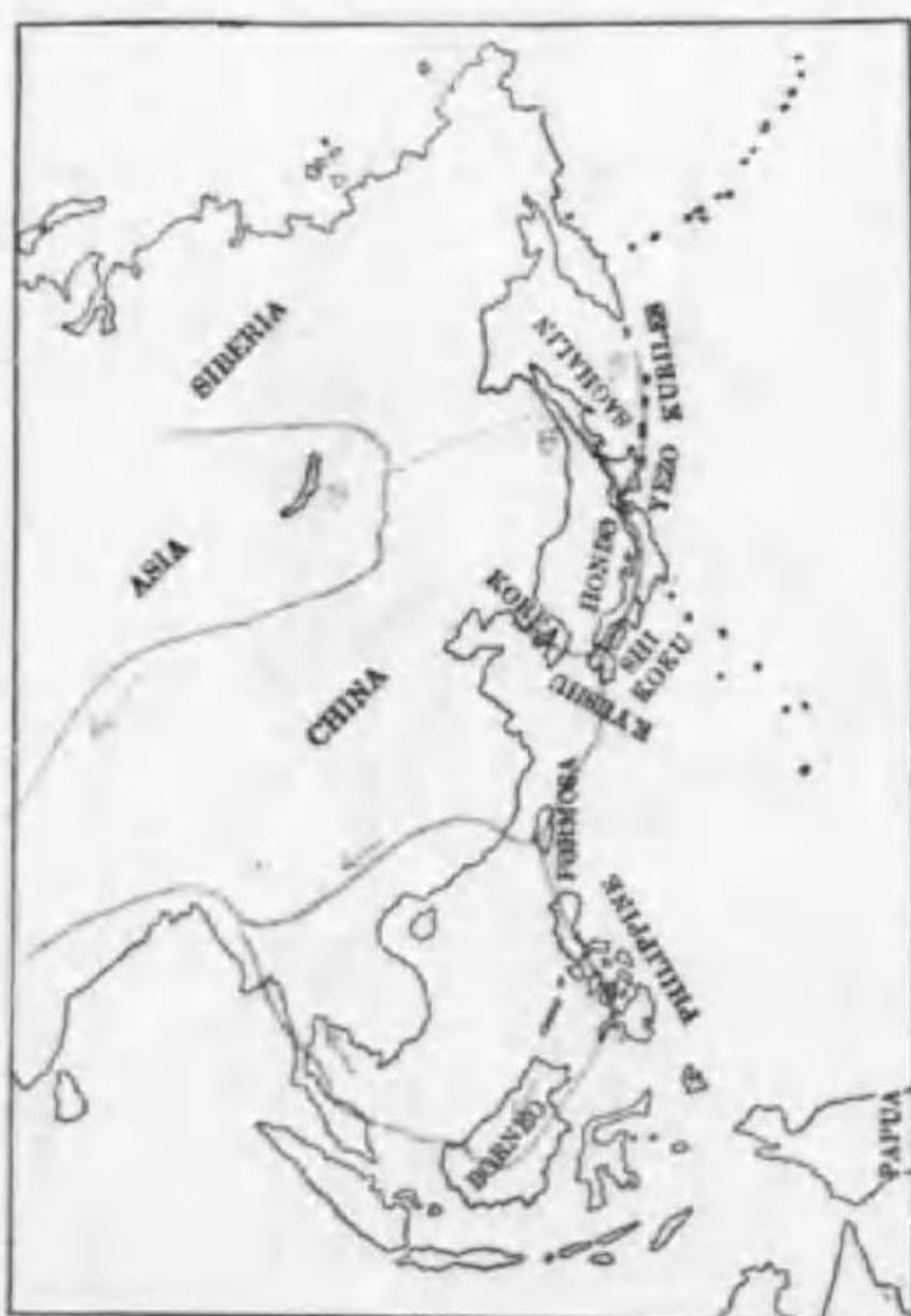
175. Nyroca fulviflata (Linnaeus) (B) キンクロバジロ