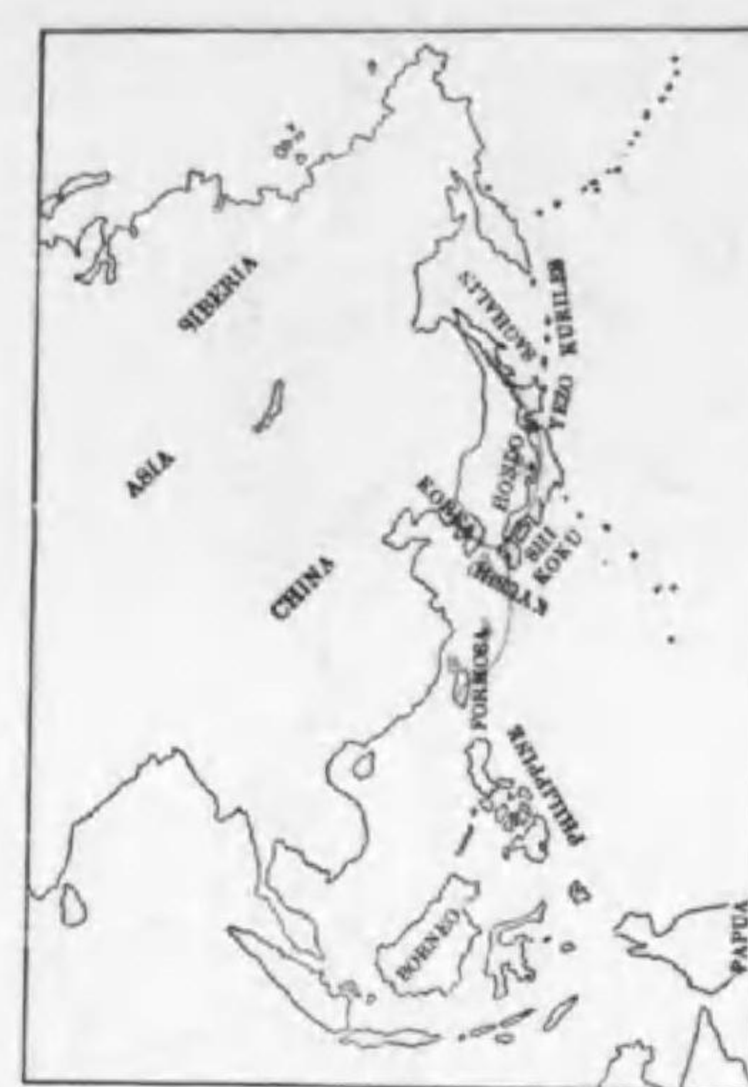
234. Charadrius alexandrinus dealbatus (Swinhoe) シロチドリ