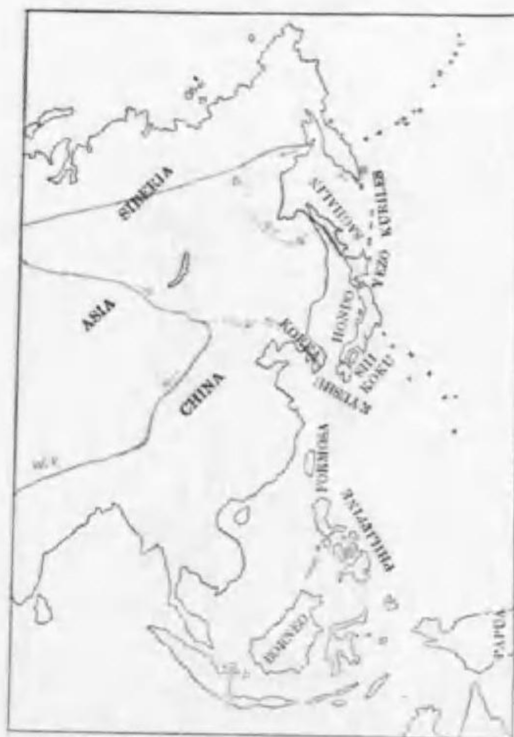
59. Lanius cristatus cristatus Linnaeus カラアカモズ