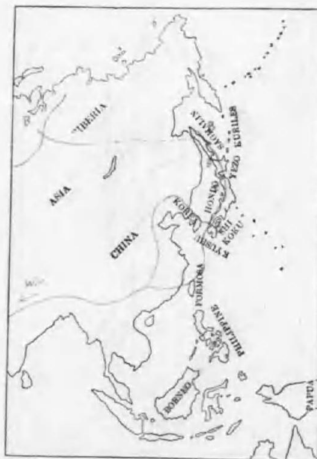
224. Scolopax rusticola Linnaeus (B) ヤマシギ