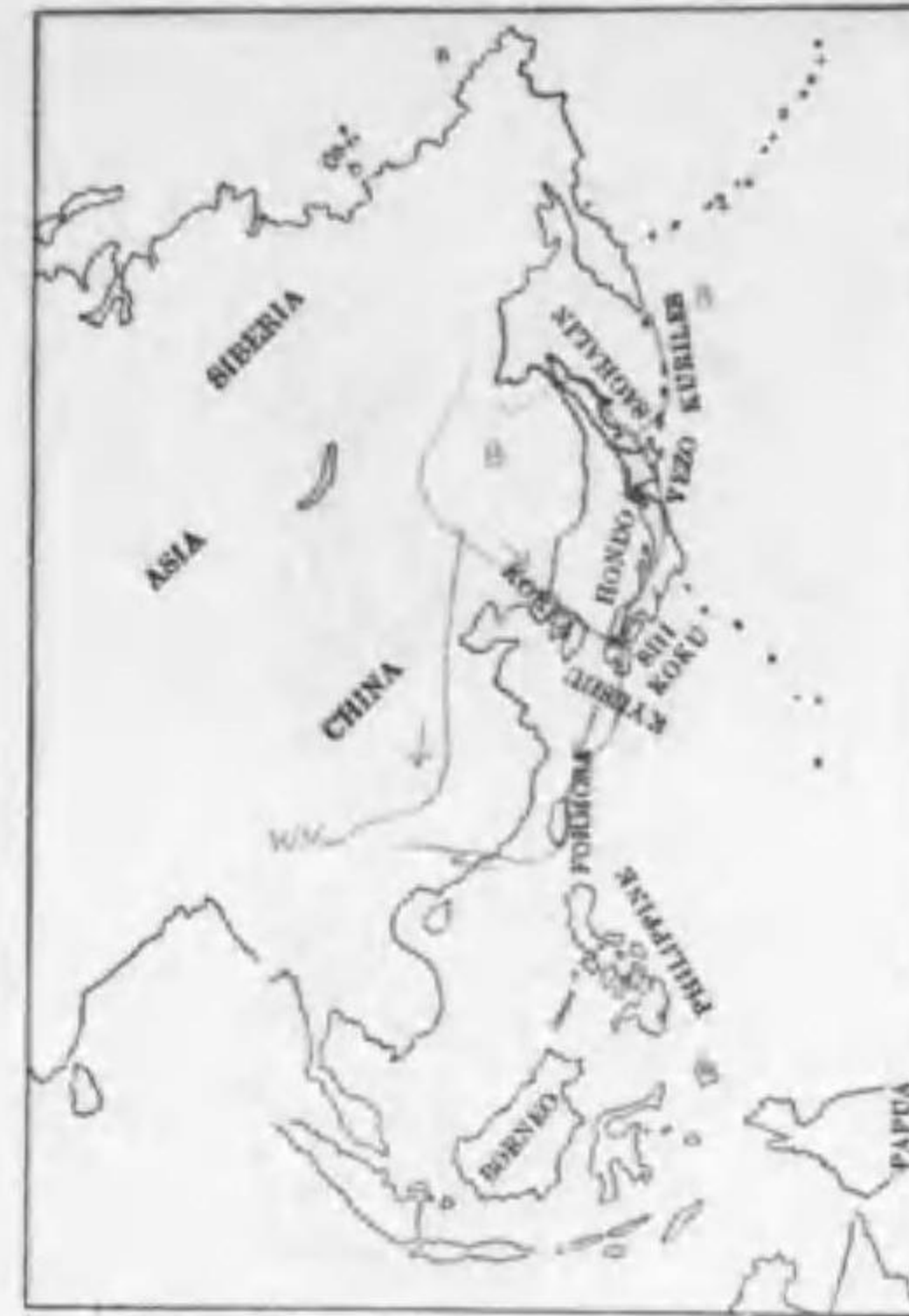
217. Erolia alpina sakhalina (Vieillot) ハマシギ