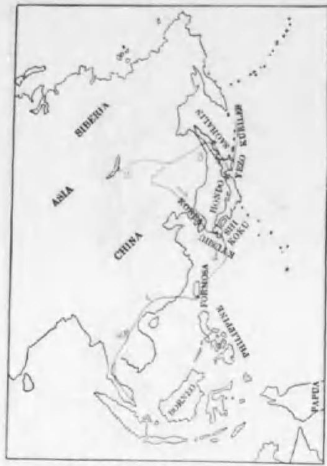
46. Motacilla flava taiwana (Swinhoe) ツメナガセキレイ (B)