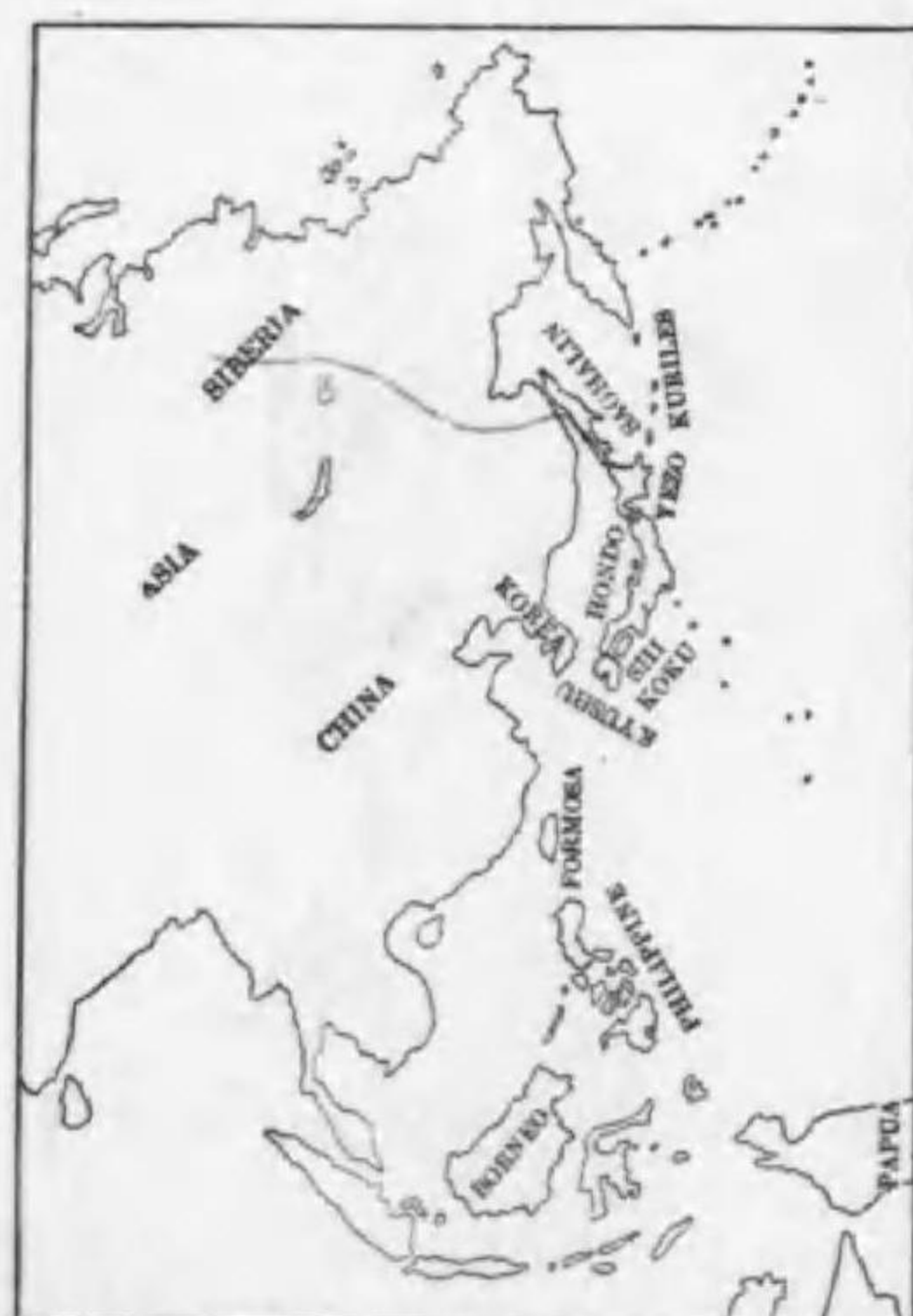
127. Glaucidium passerinum orientale Taczanowski (B) スズメフクロフ