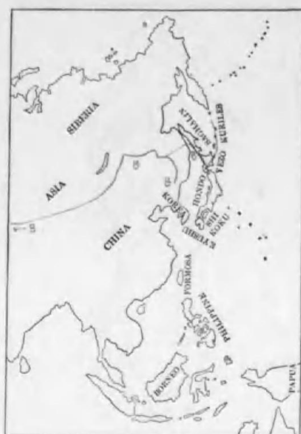
126. Aegolius funereus sibiricus (Buturlin) キンメフクロフ (B)