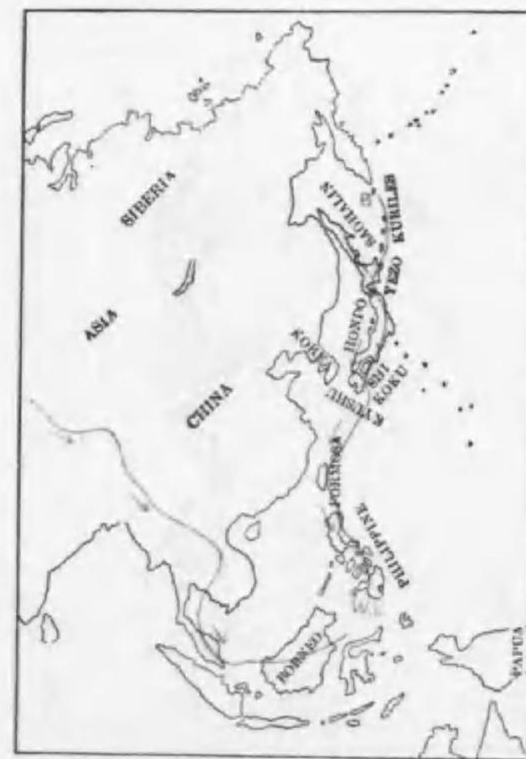
171. Dafila acuta acuta (Linnaeus) ヲナガガモ