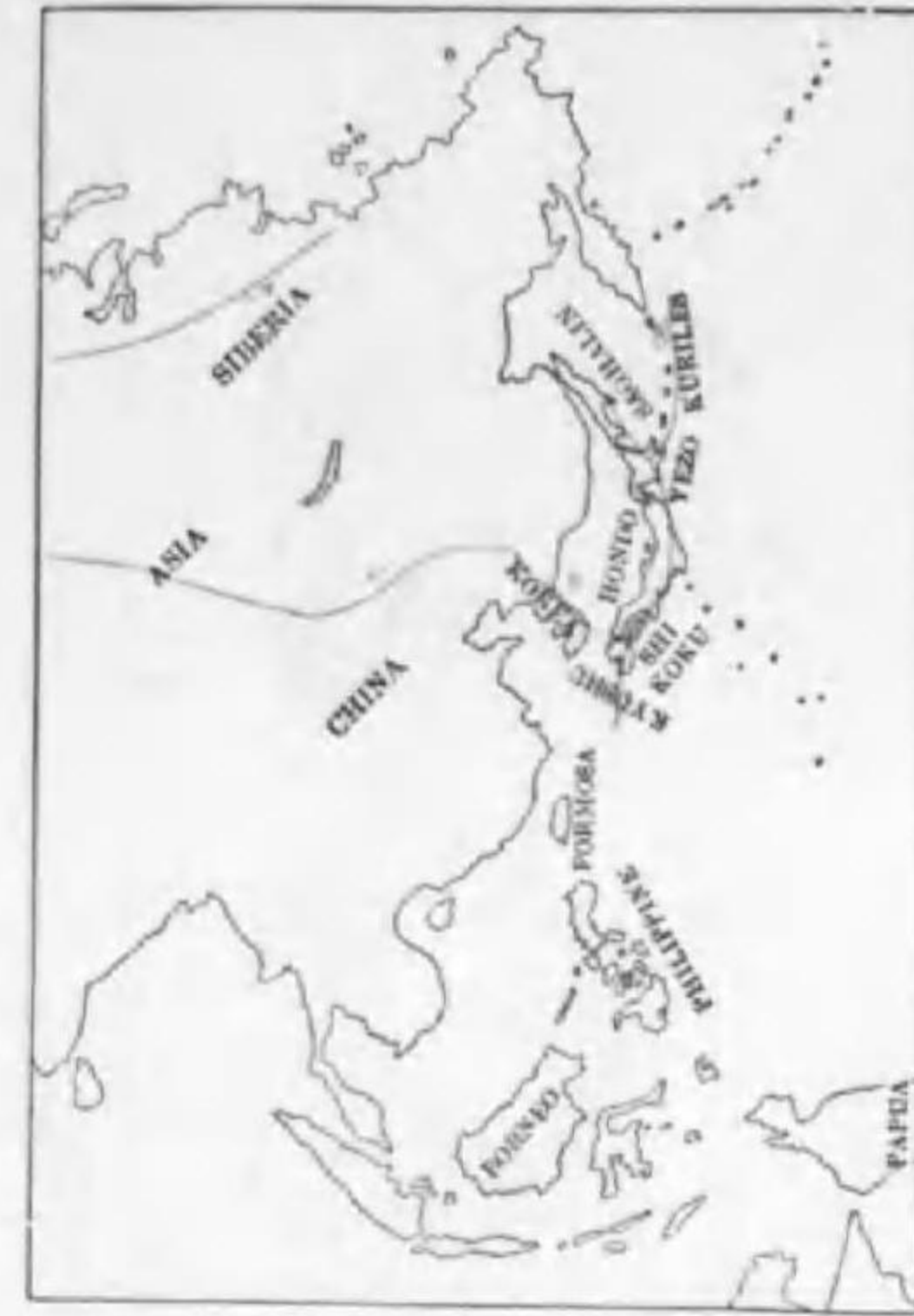
41. Anthus hodgsoni berezonskii Sarudny ヒンズイ (B)