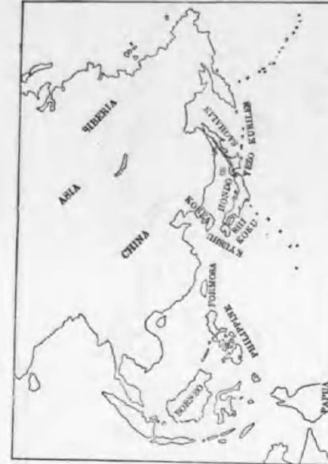
114. Dryobates kiziki seebohmi (Hargitt) エゾコゲラ (B)