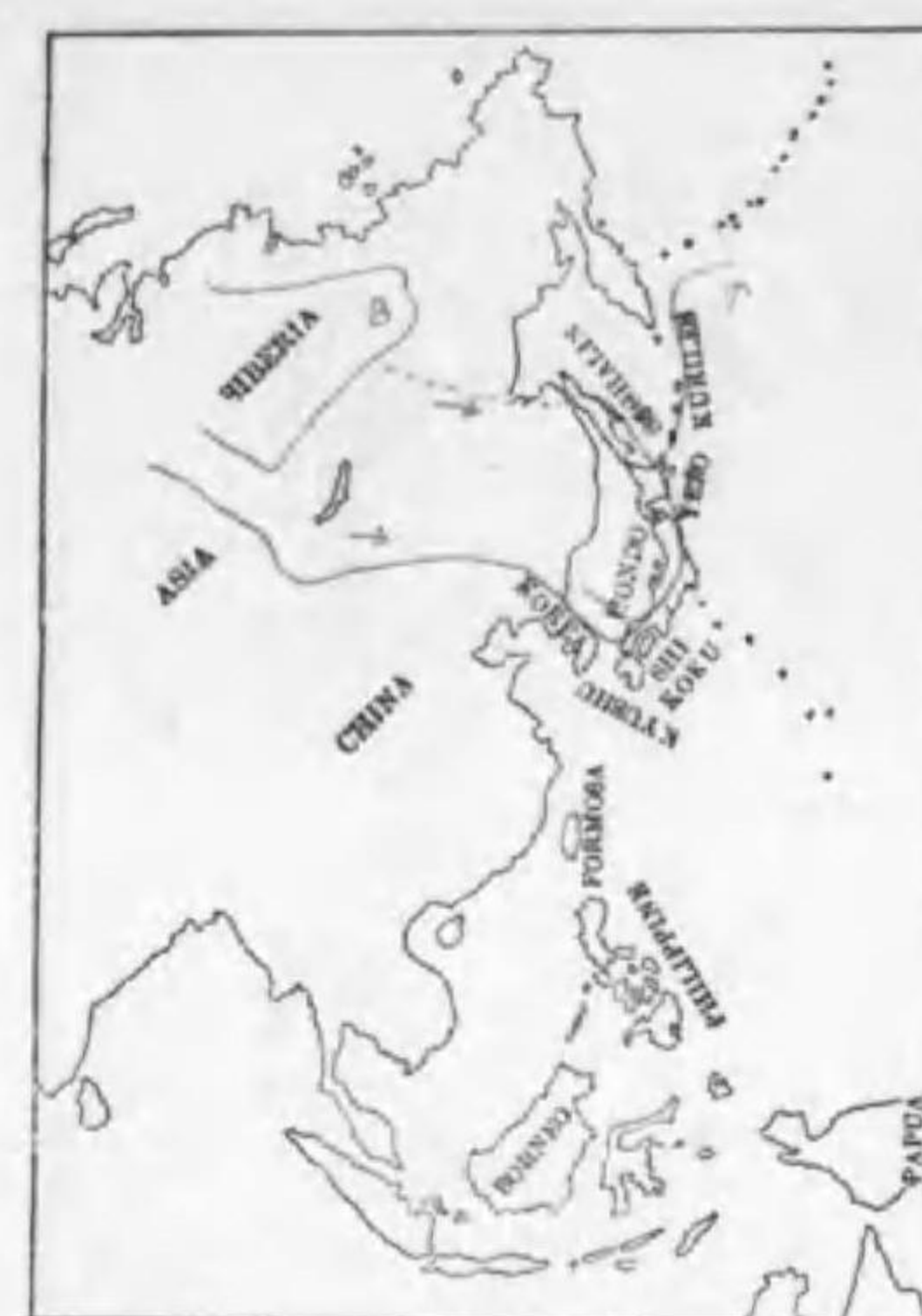
178. Clangula hyemalis (Linnaeus) コネリガモ