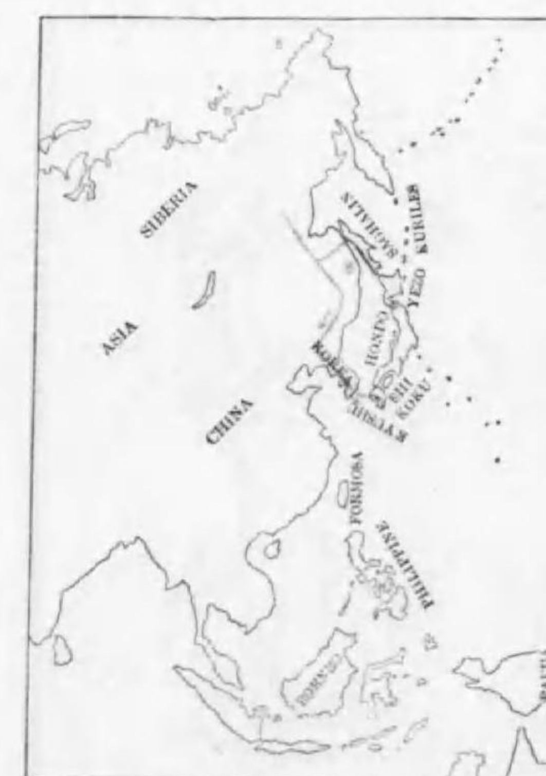
4. Nucifraga caryocatactes macrorhynchos ハシナガホシガラス (B)