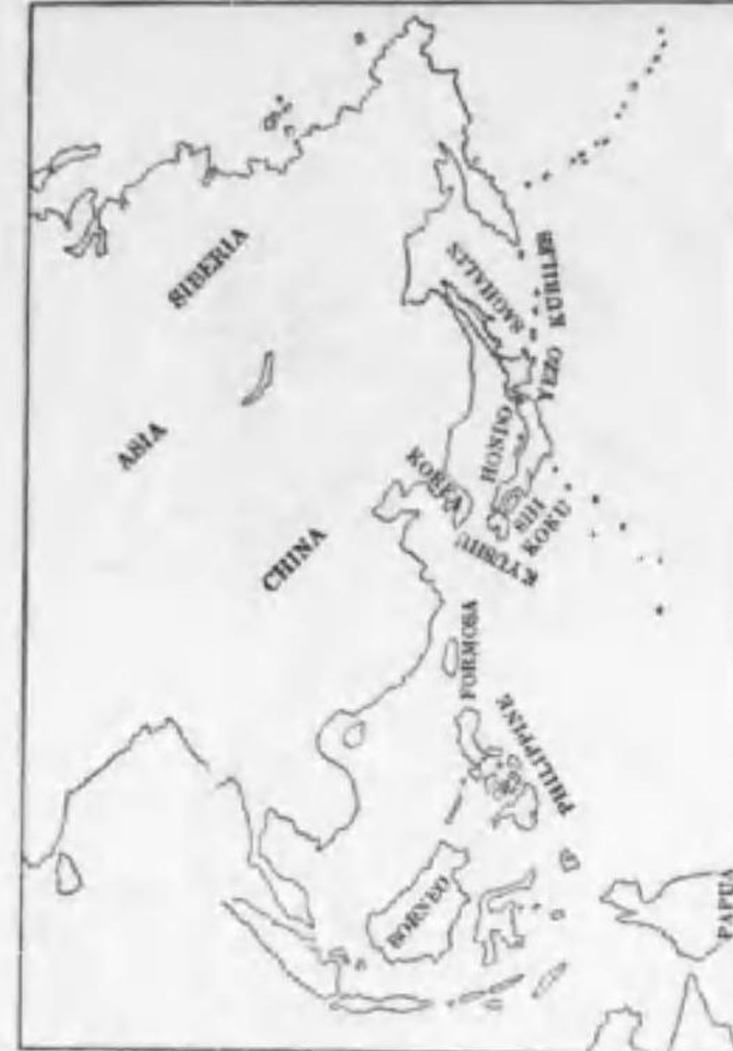
121. Bubo lubo borissowi Hesse (B) カラフトワシミミヅク