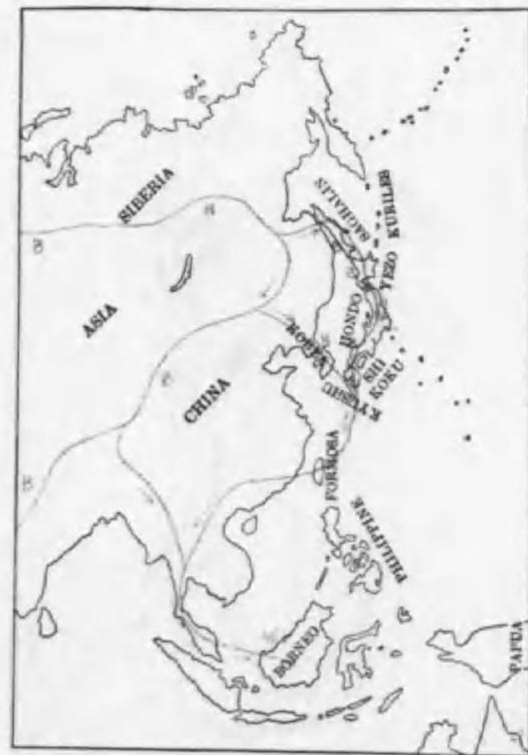
119. Cuculus optatus optatus Gould (B) ツツドリ