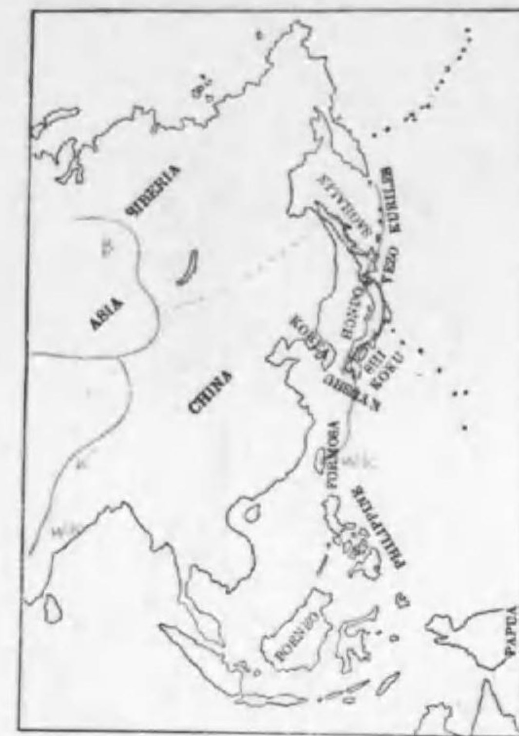
170. Mareca penelope (Linnaeus) ヒドリガモ