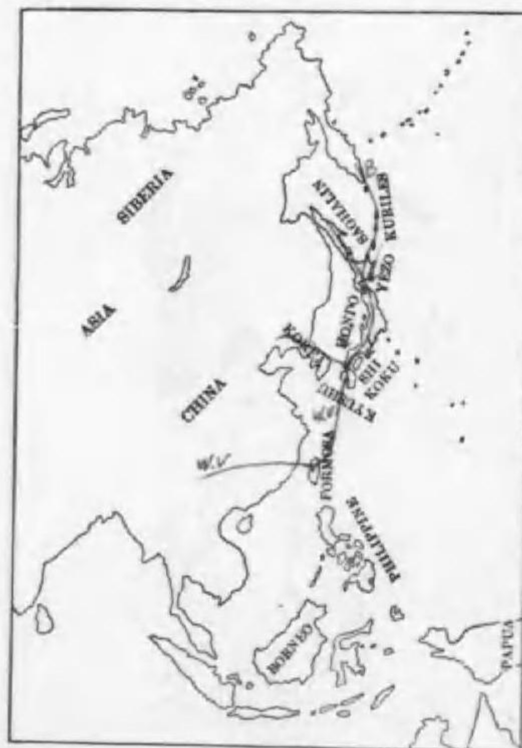
248. Larus ridibundus sibiricus Buturlin ユリカモメ