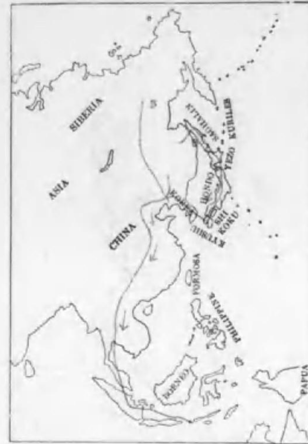
241. Sterna hirundo longipennis Nordmann (B) アヂサシ