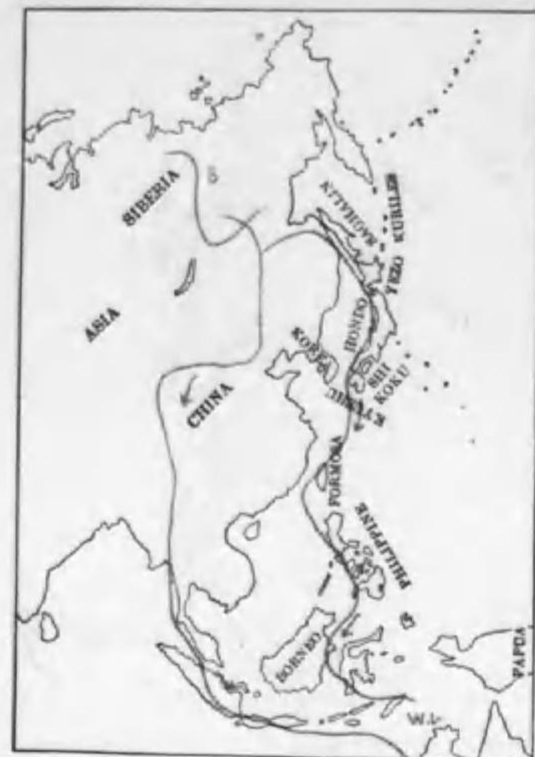
229. Squatarola squatarola hypomelaena (Pallas) ダイゼン