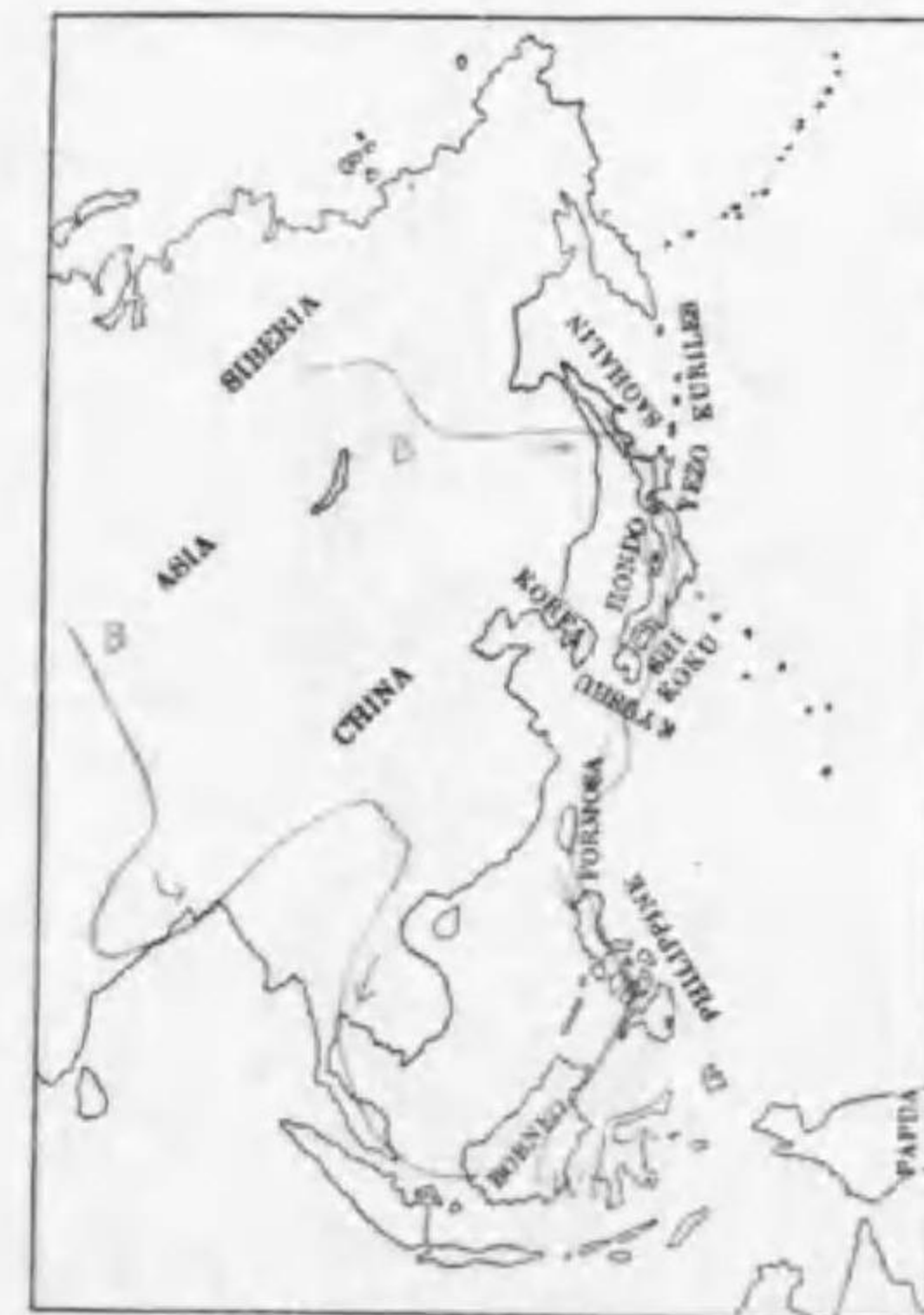
172. Spatula dypeata (Linnaeus) ハシビロガモ