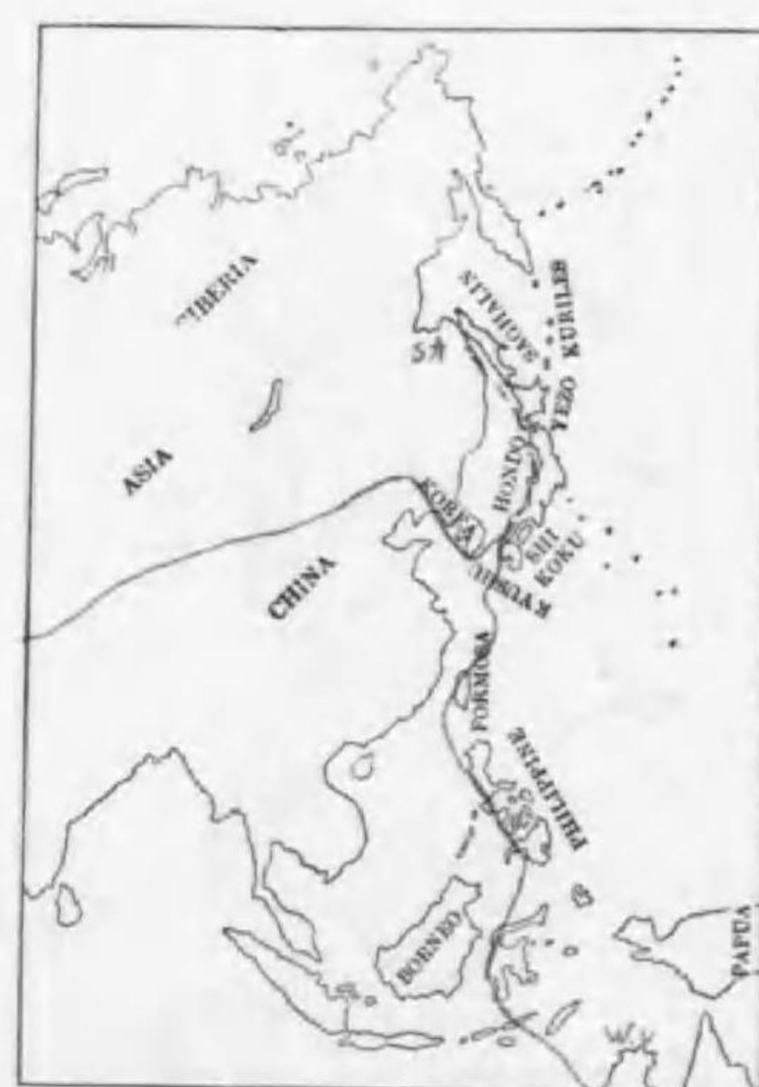
232. Charadrius leschenaultii leschenaultii Lesson (St.) オホメダイチドリ