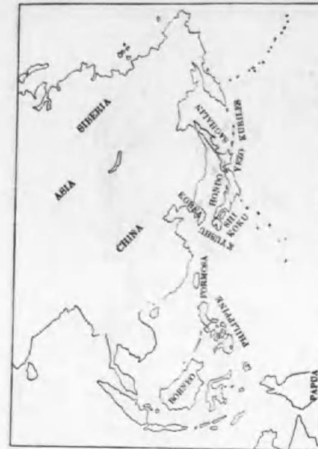
98. Cinclus pallasii pallasii Temminck キタカハガラス (B)