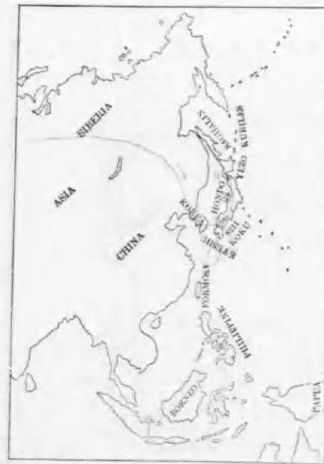
99. Hirundo rustica gutturalis Scopoli ツバメ