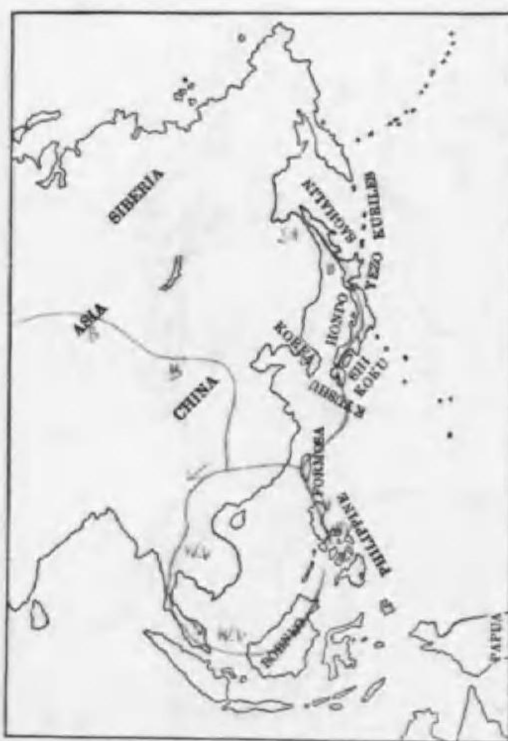
152. Izobrychus eurhythmus (Swinhoe) オホヨシゴキ (St.)