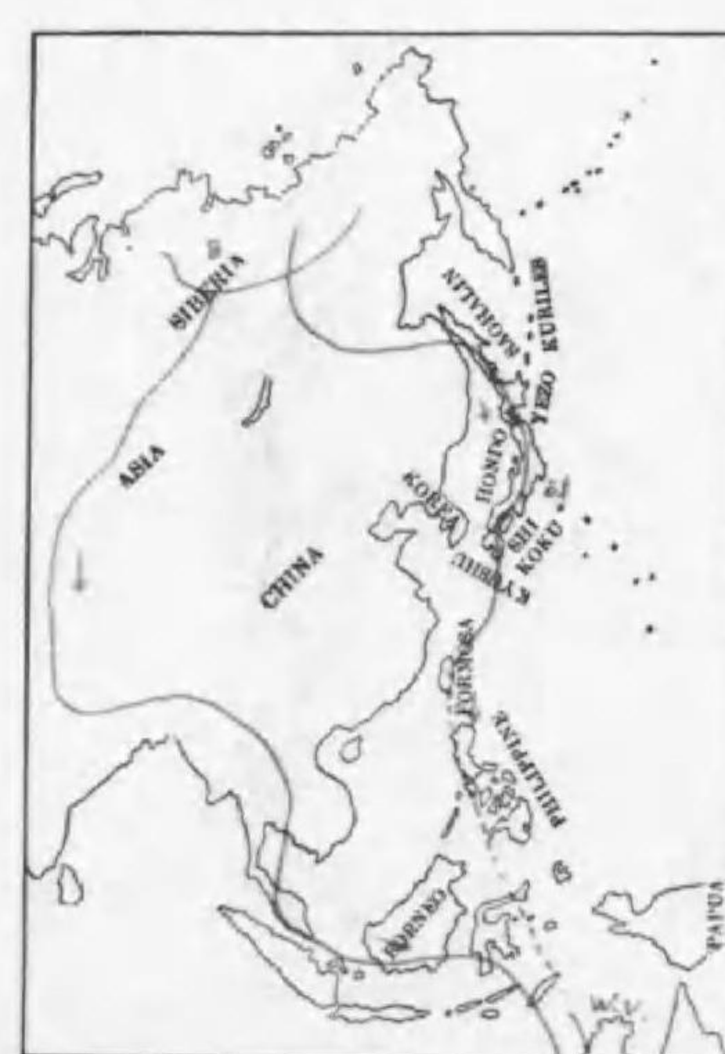
235. Charadrius hiaticula tundrac (Love) ハジロコチドリ