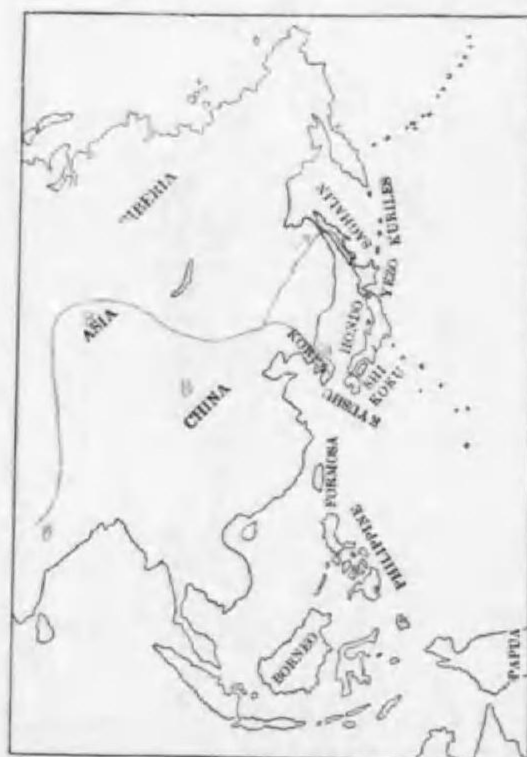
136. Aquila clanga fulvescens Gray カラフトワシ