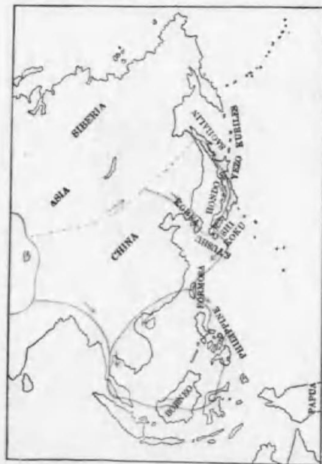
199. Tringa ochropus Linnaeus クサシギ