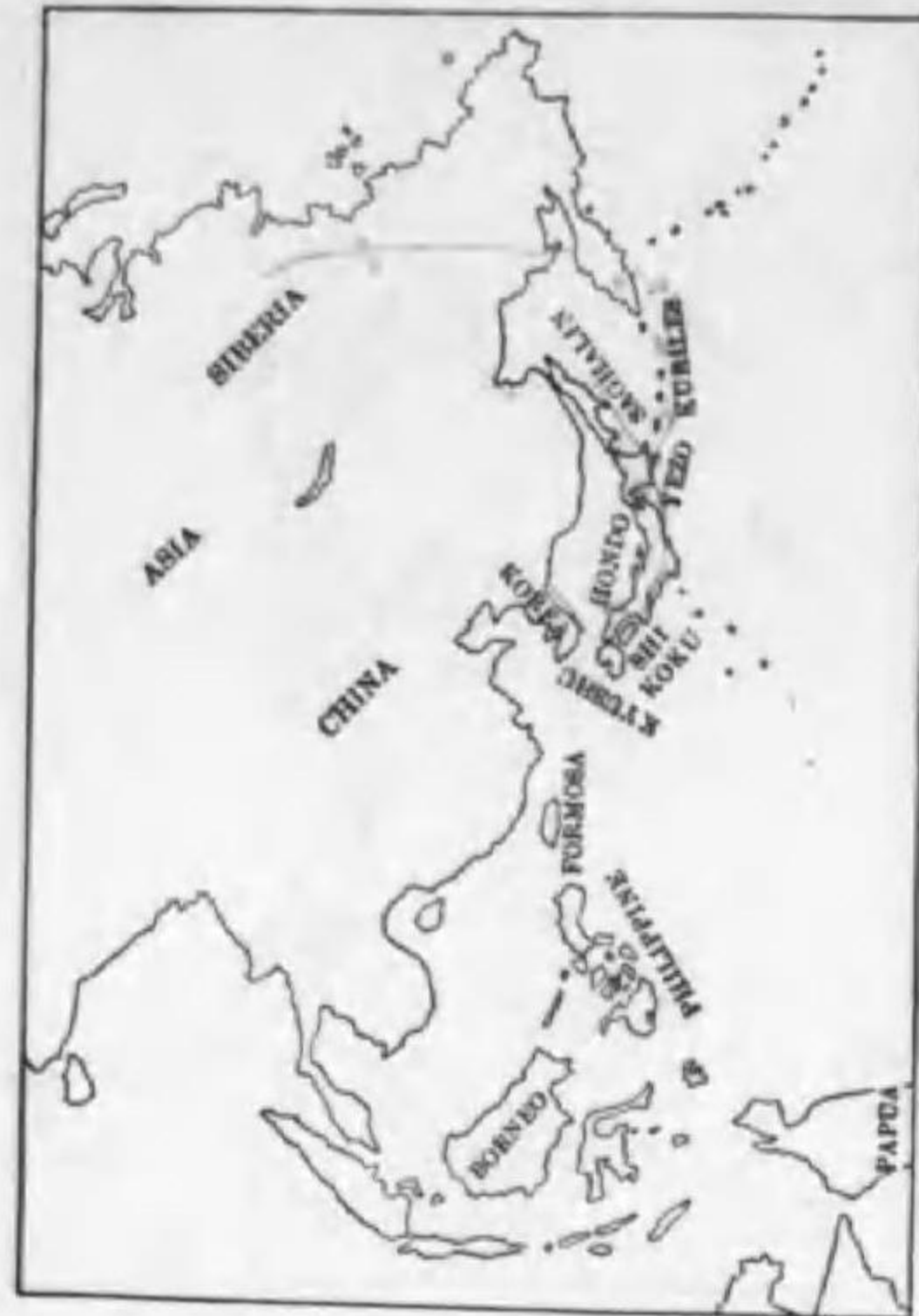
37. Alauda arvensis pekinensis Swinhoe オホヒバリ