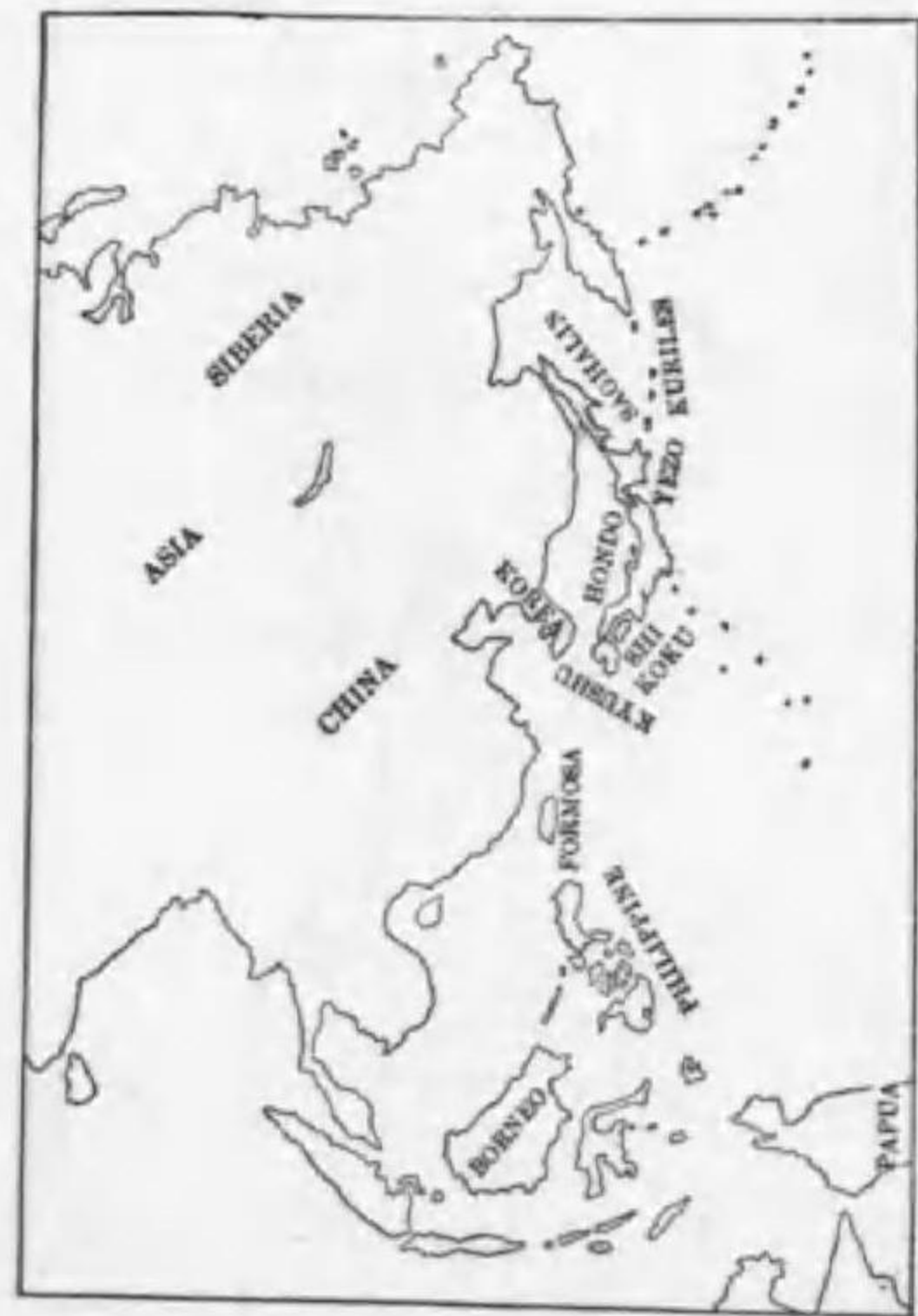
7. Perisoreus infaustus sakhalinensis Buturlin (B) アカカケス