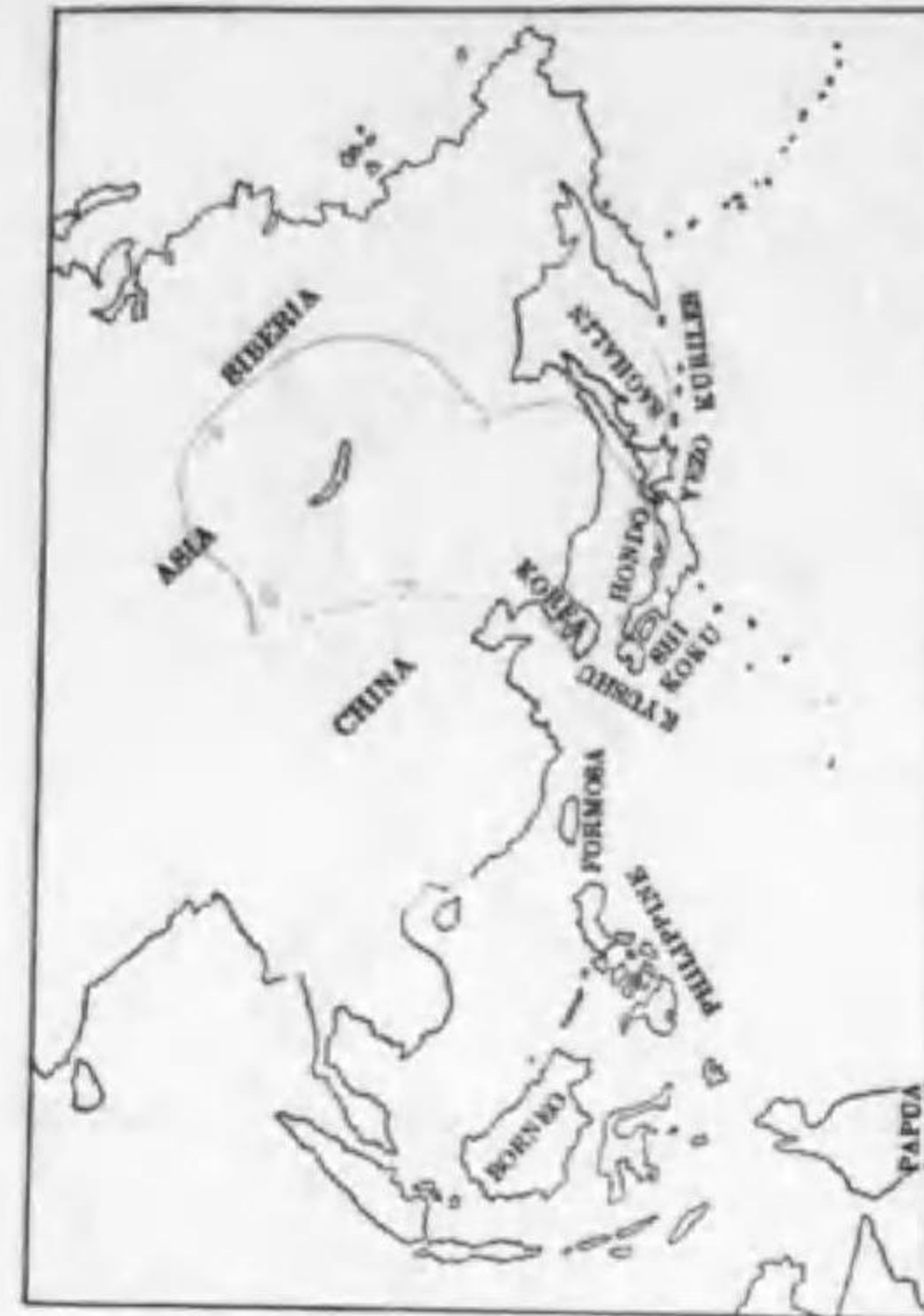
26. Emberiza leucocephalos leucocephalos S. G. Gmelin (R.V.) シラガホホジロ