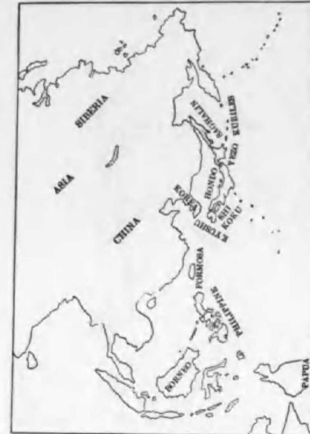
122. Bubo blakistoni karajutonis Koroda カラフトシマフクロウ (B)