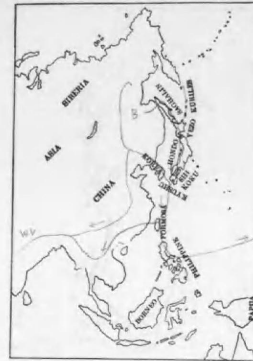
218. Pisobia minuta ruficollis (Pallas) トウウネン