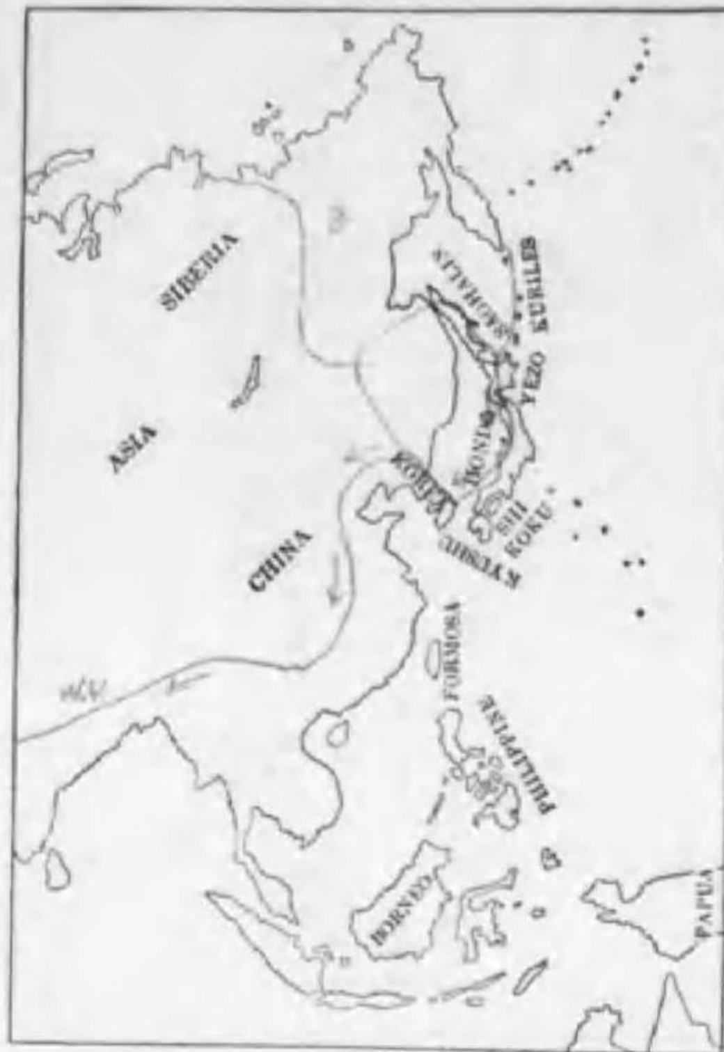
222. Eurymorhynchus pygmaeus (Linaeus) ヘラシギ