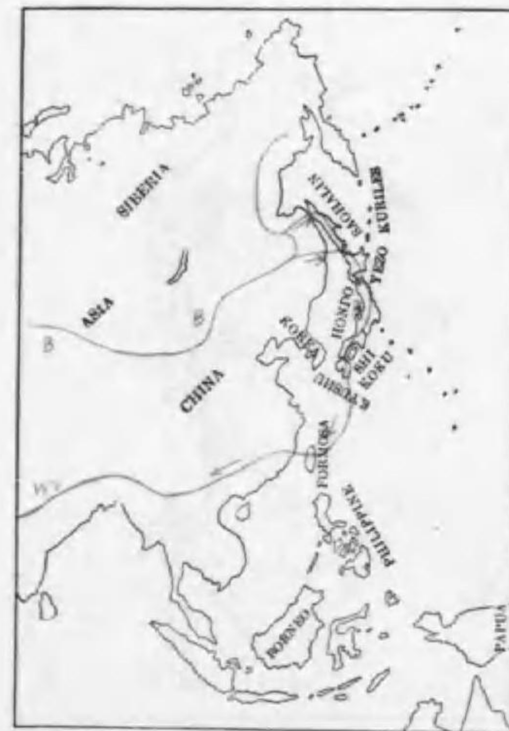
139. Accipiter gentilis schvedowi (Menzbier) オホタカ