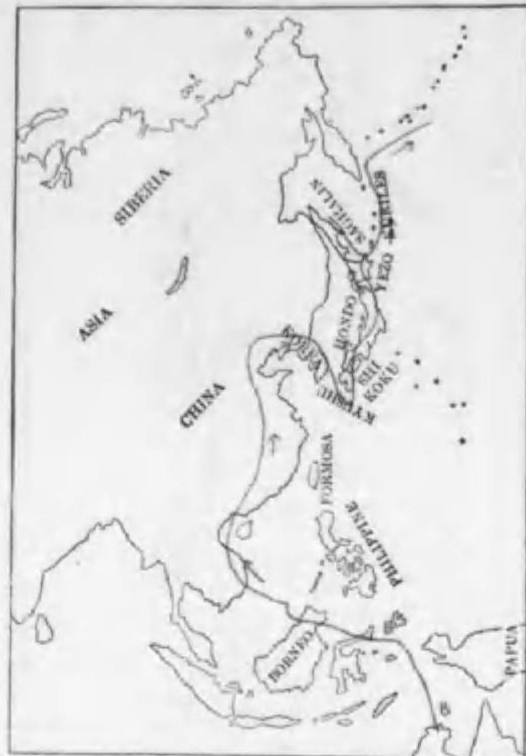
190. Puffinus tenuirostris (Temminck) ハシボリミヅナギドリ