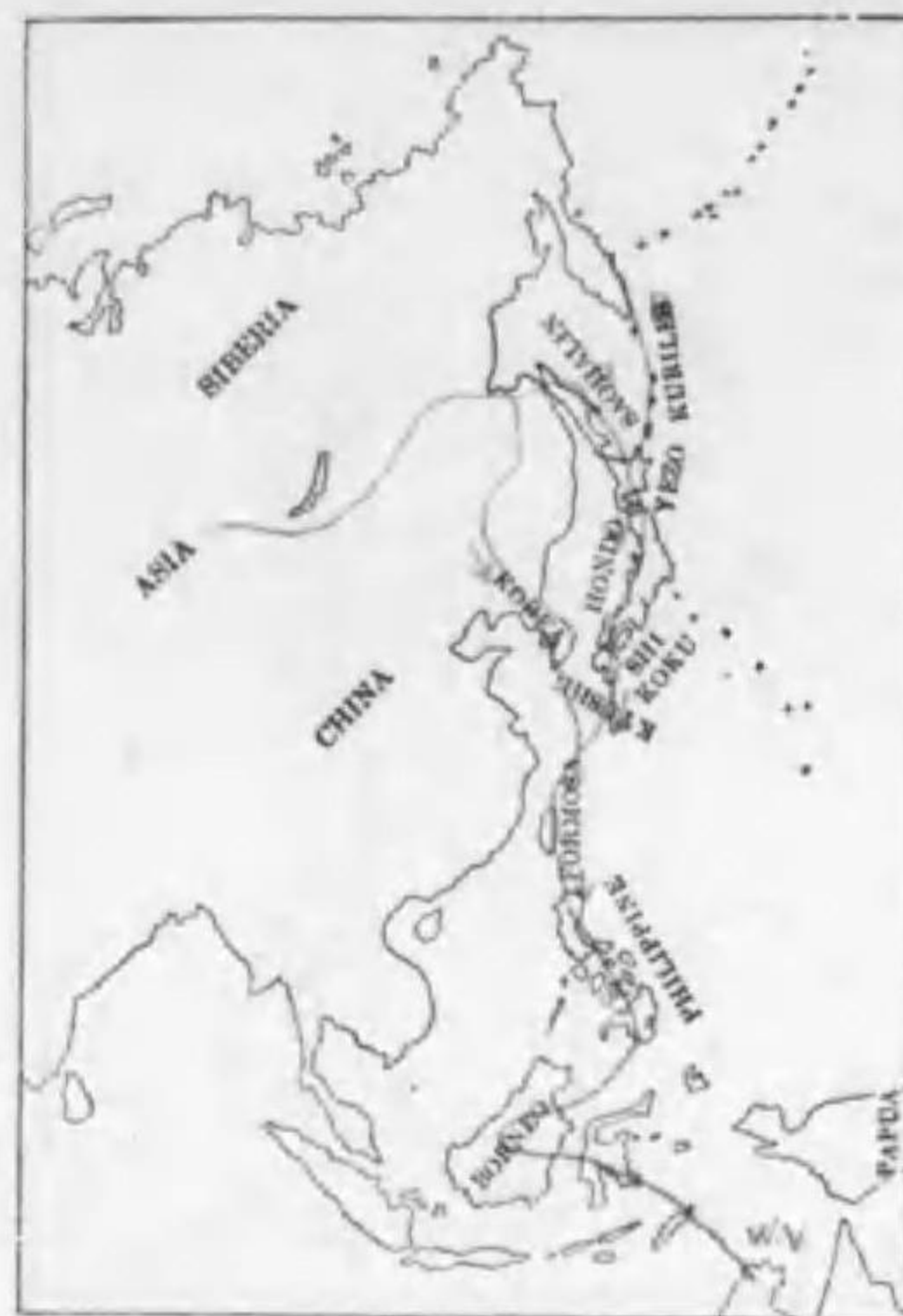
209. Limosa limosa melanuroides (Gould) ラグロシギ