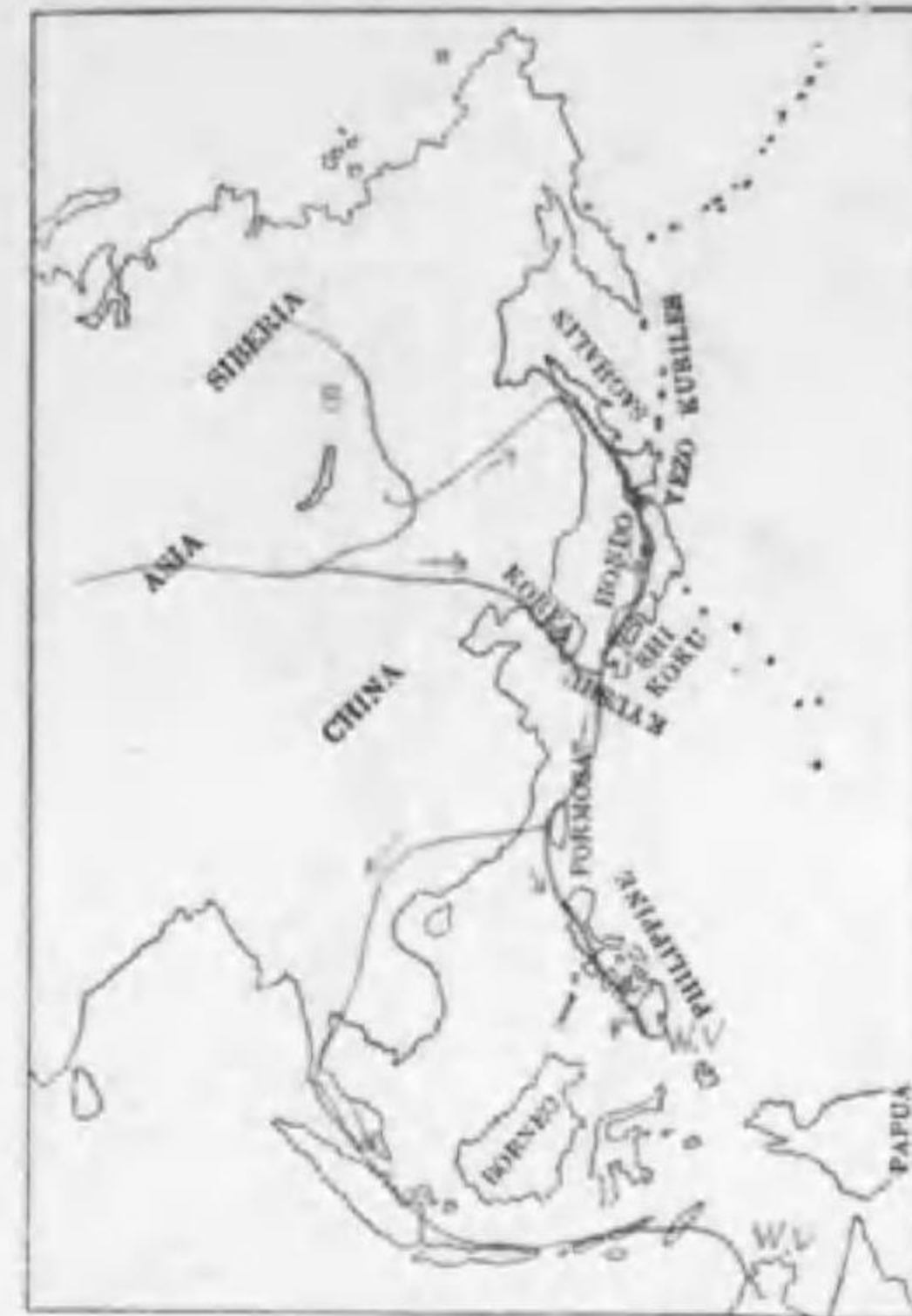
201. Tringa incana brevipes (Vieillot) キアシシギ