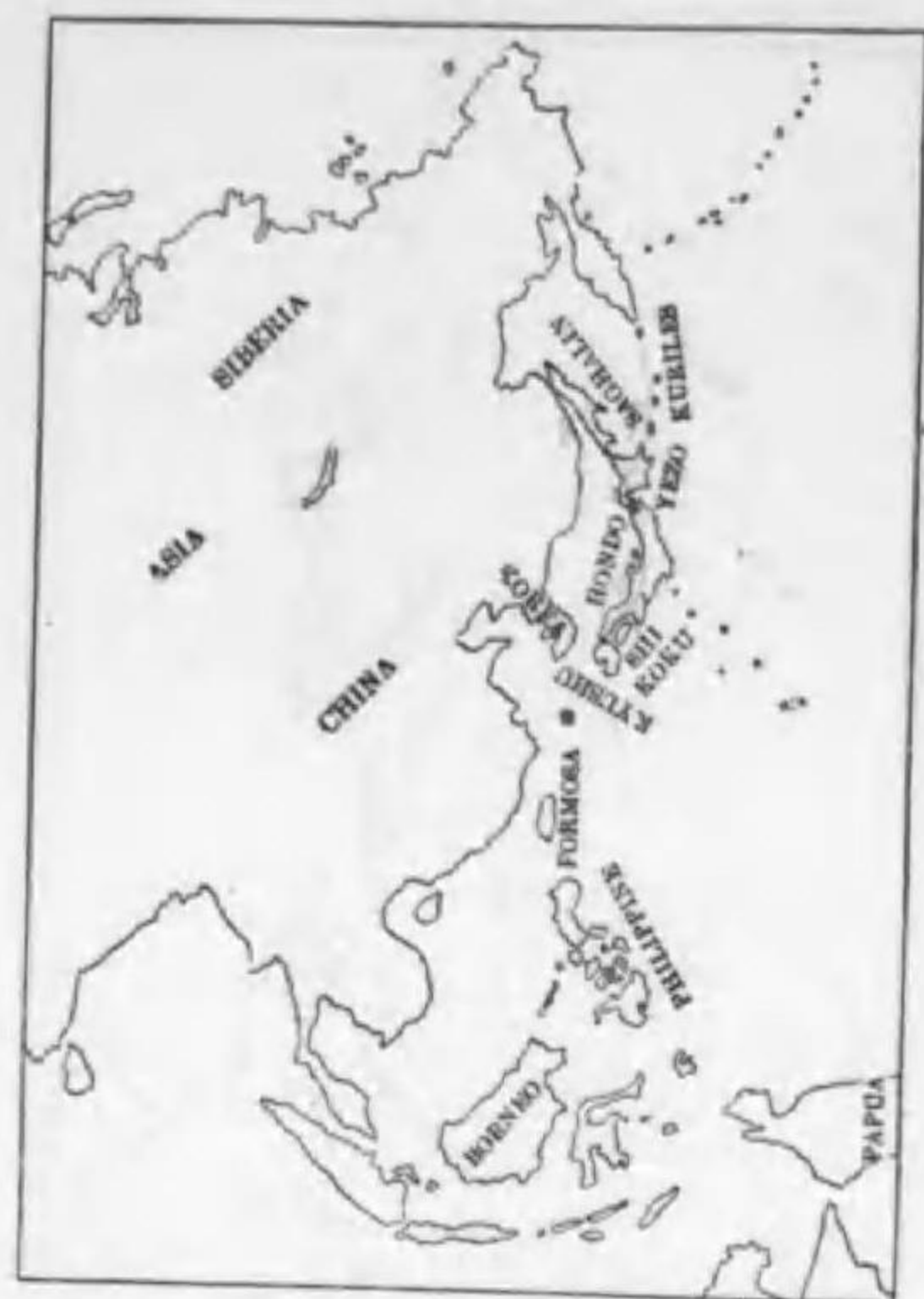
77. Horeites cantans sakhalinensis (Yamashina) (B) カラフトウグヒス