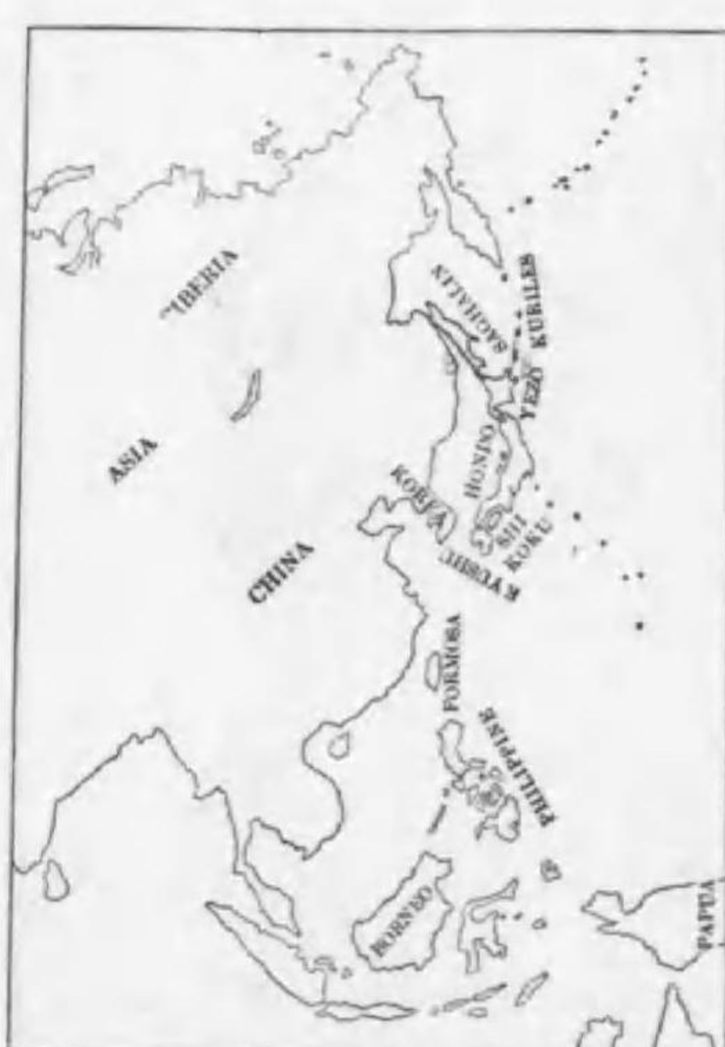
128. Surnia ulula pallasii Buturlin (B) ヲナガフクロフ