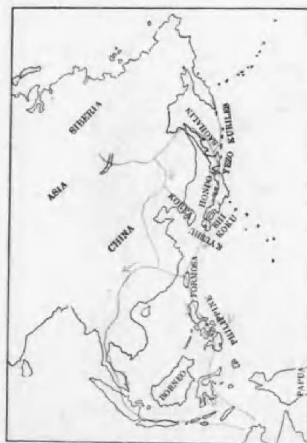
211. Numenius arquata orientalis Brehm (R.v) ダイシャクシギ