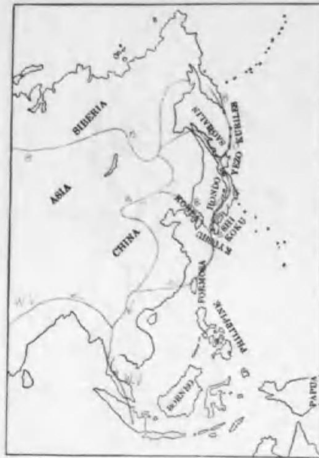
118. Cuculus canorus telephonus Heine (B) クワクコウ