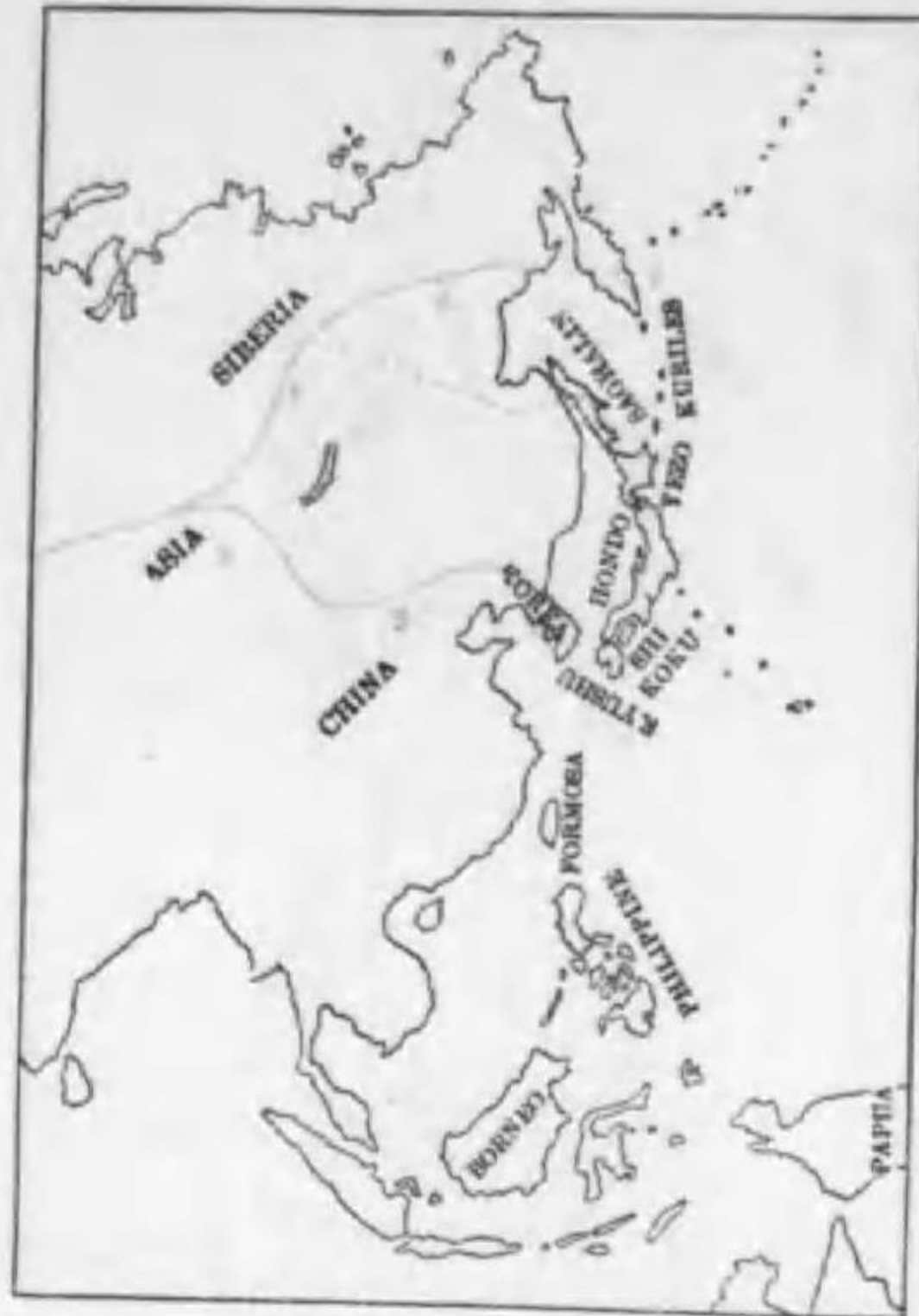
109. Dryobates major brevisrostris (Reichenbach) (St.) ハシブトアカゲラ