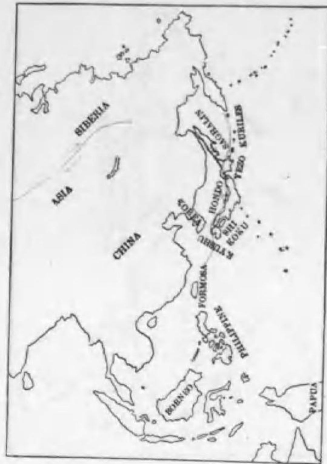
13. Carduelis spinus (Linnaeus) (B) マヒワ