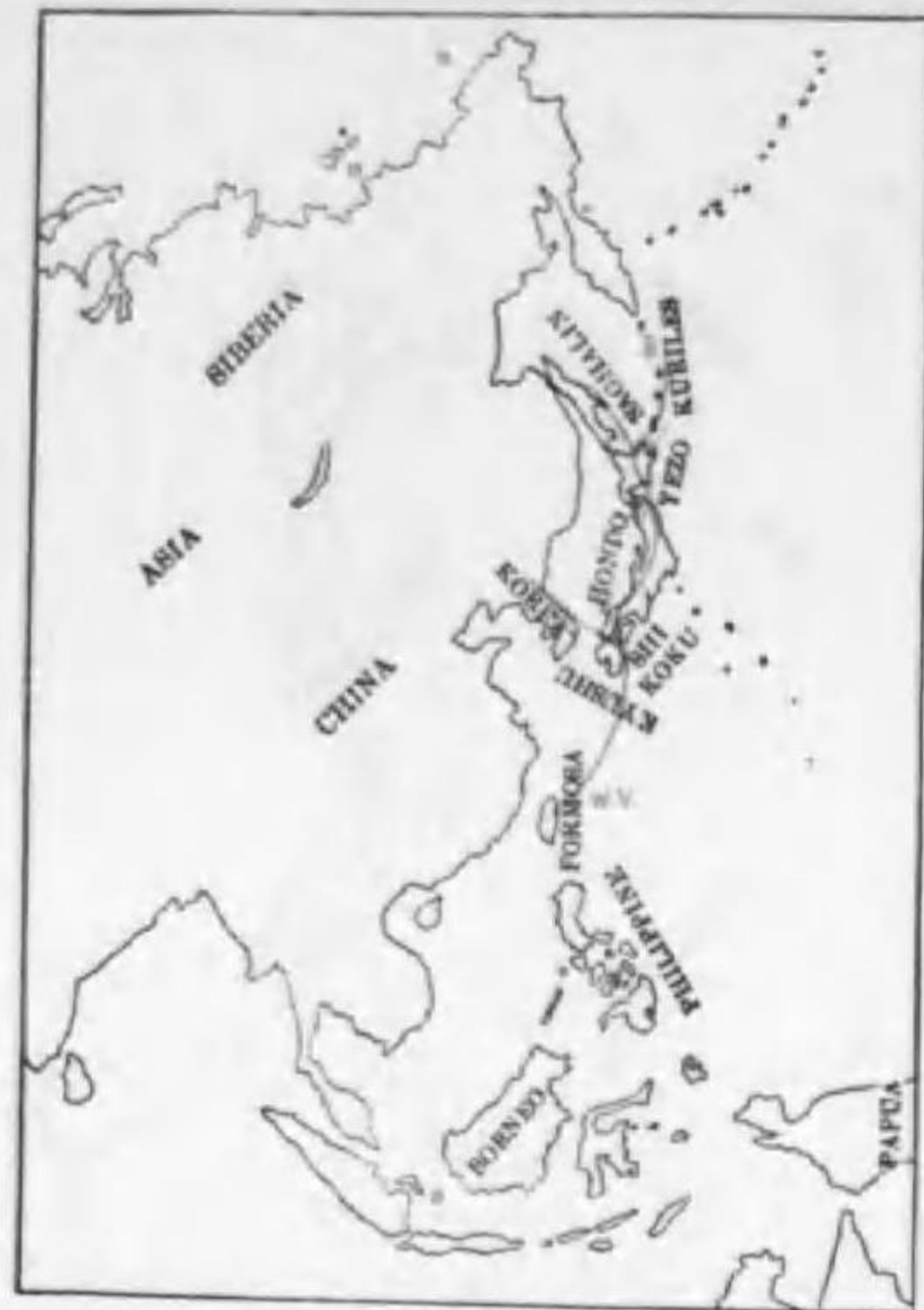
93. Luscinia calliope cantschatkensis (Gmelin) オホノゴマ