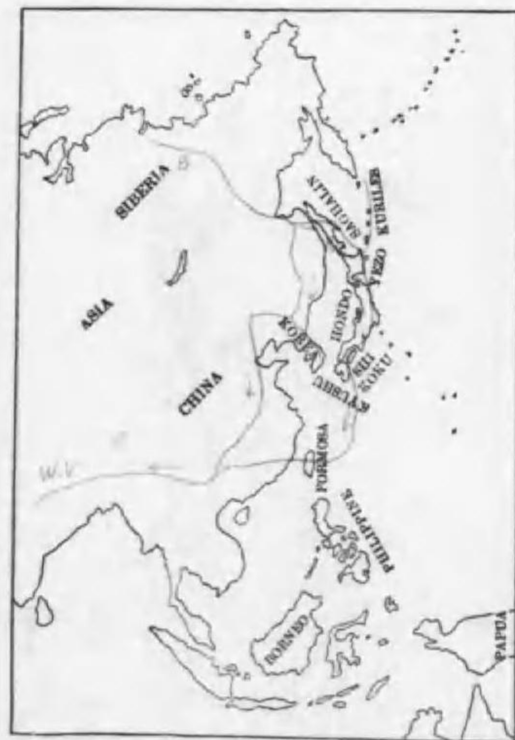
159. Anser erythropus (Linnaeus) カリガネ