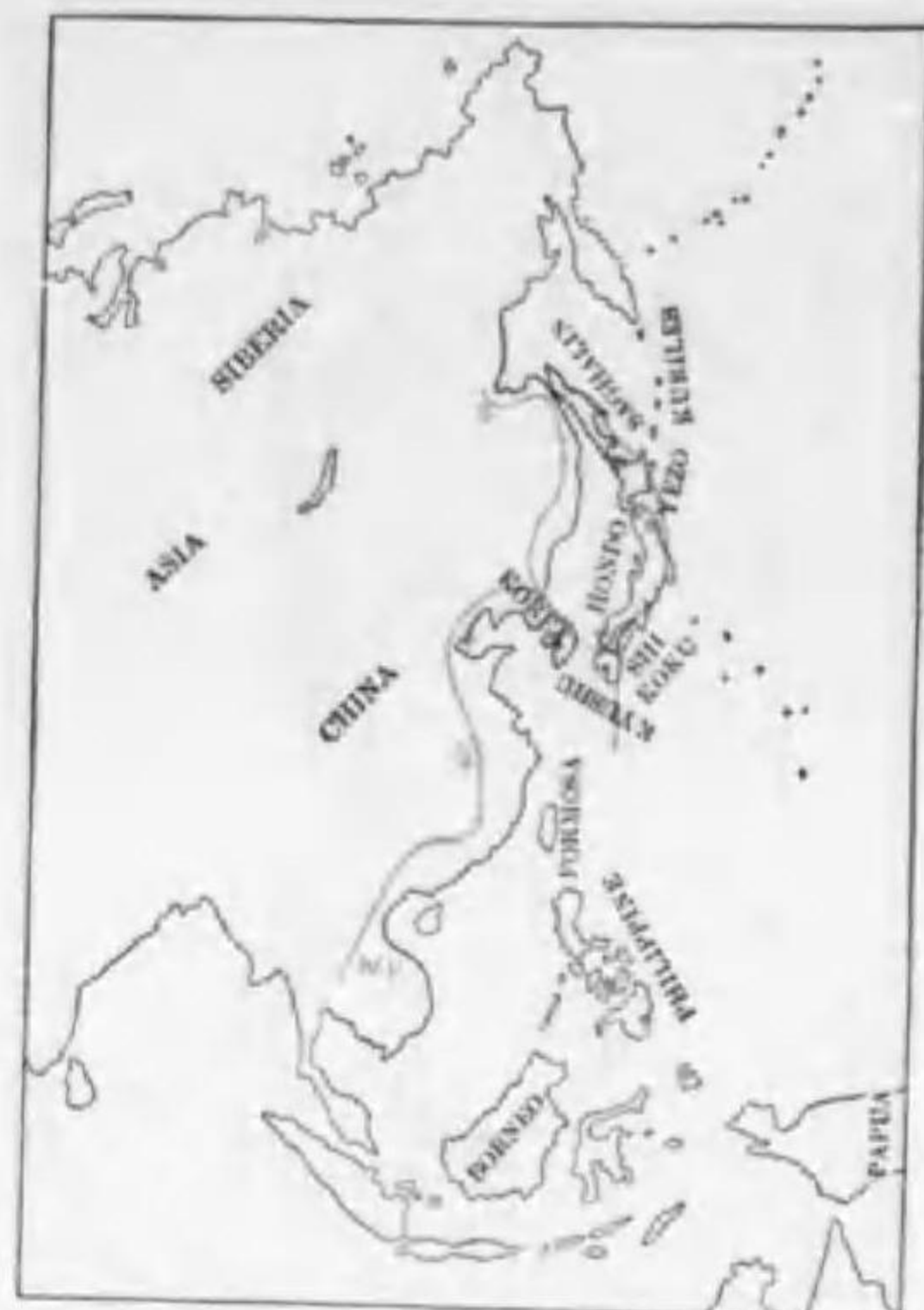
70. Acanthopneuste tenellipes (Swinhoe) エゾムシクヒ (B)