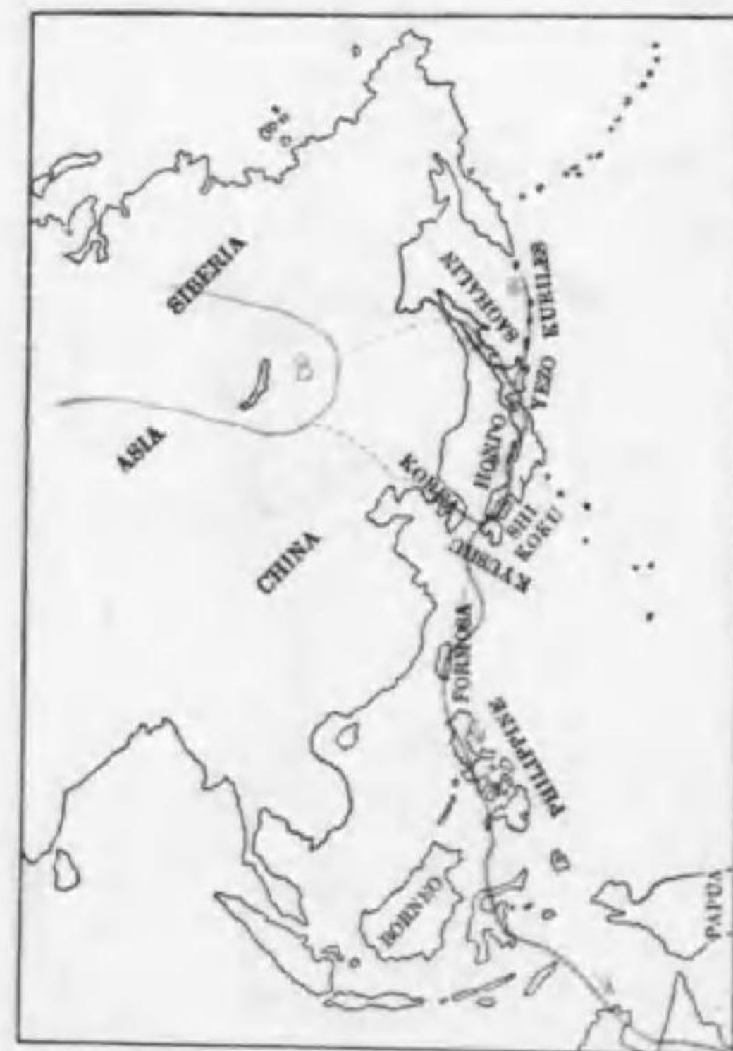
184. Mergus serrator Linnaeus ウミアイサ