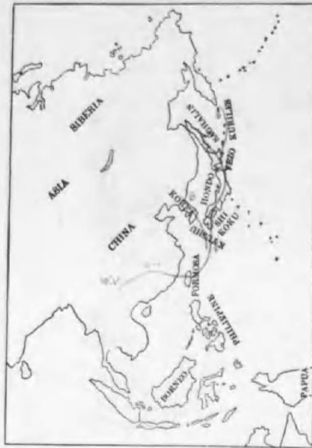
246. Larus crassirostris Vieillot (B) ウミネコ