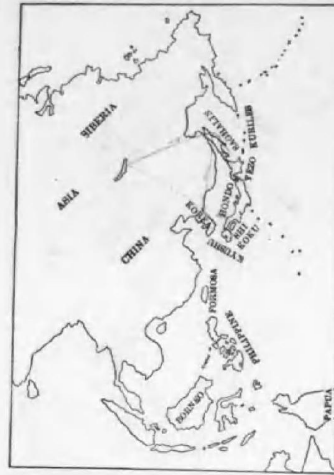
10. Coccythraustes coccythraustes verticalis Tugarinow & Buturlin (B) カラフトシメ