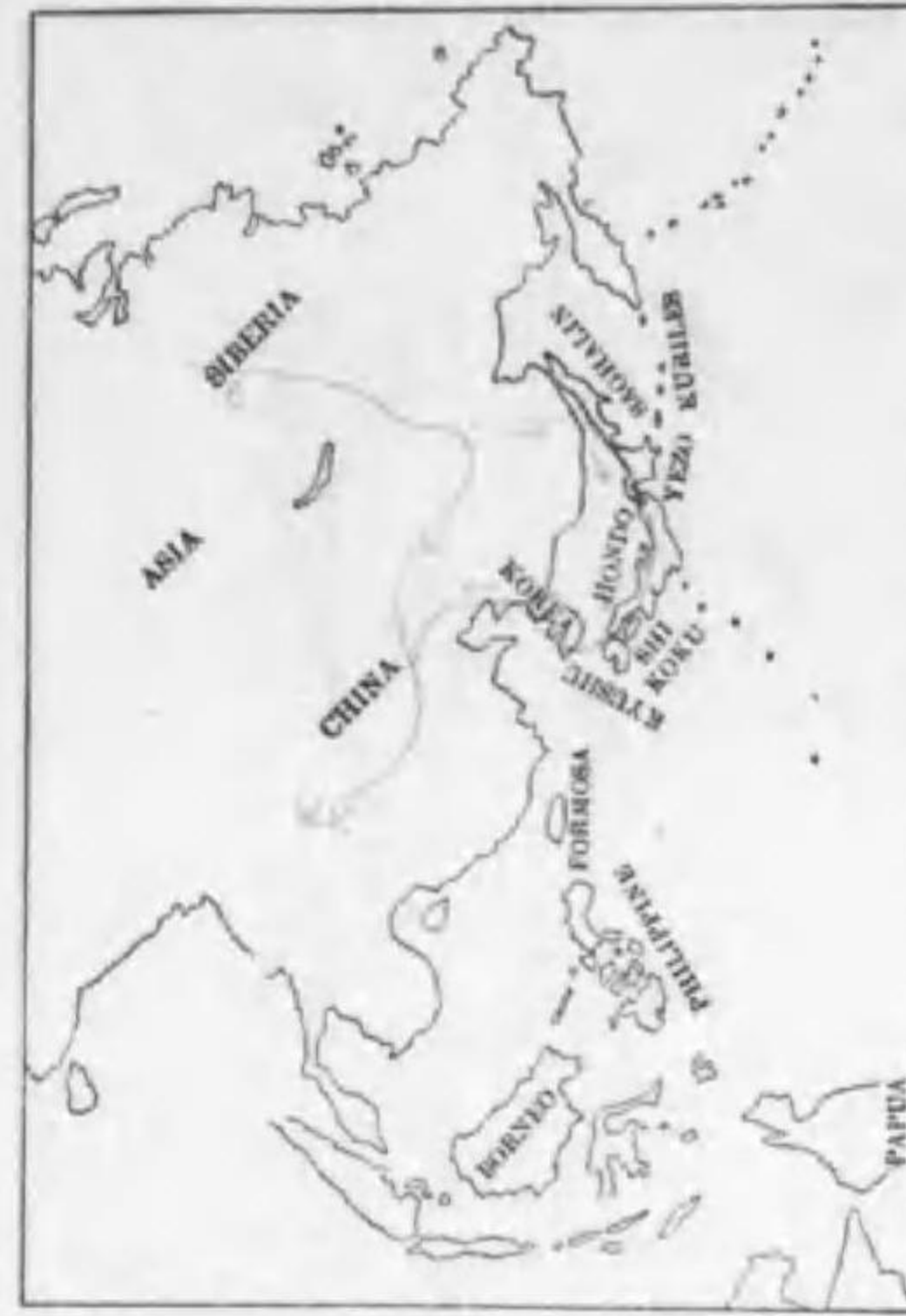
161. Anser fabalis sibiricus (Alphéraky) オホヒシクヒ