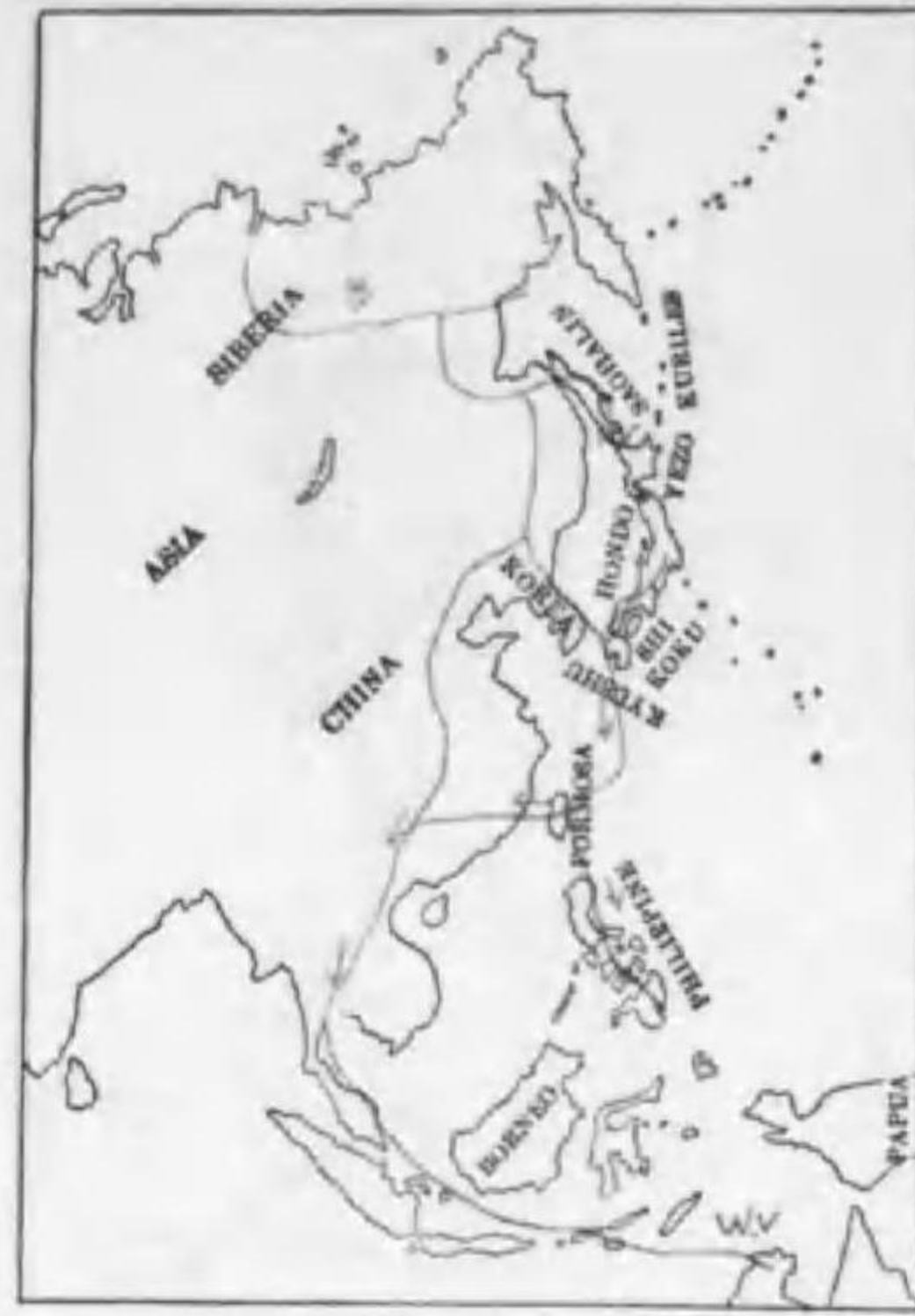
214. Numenius minutus Gould (Rv.) コシヤクシギ