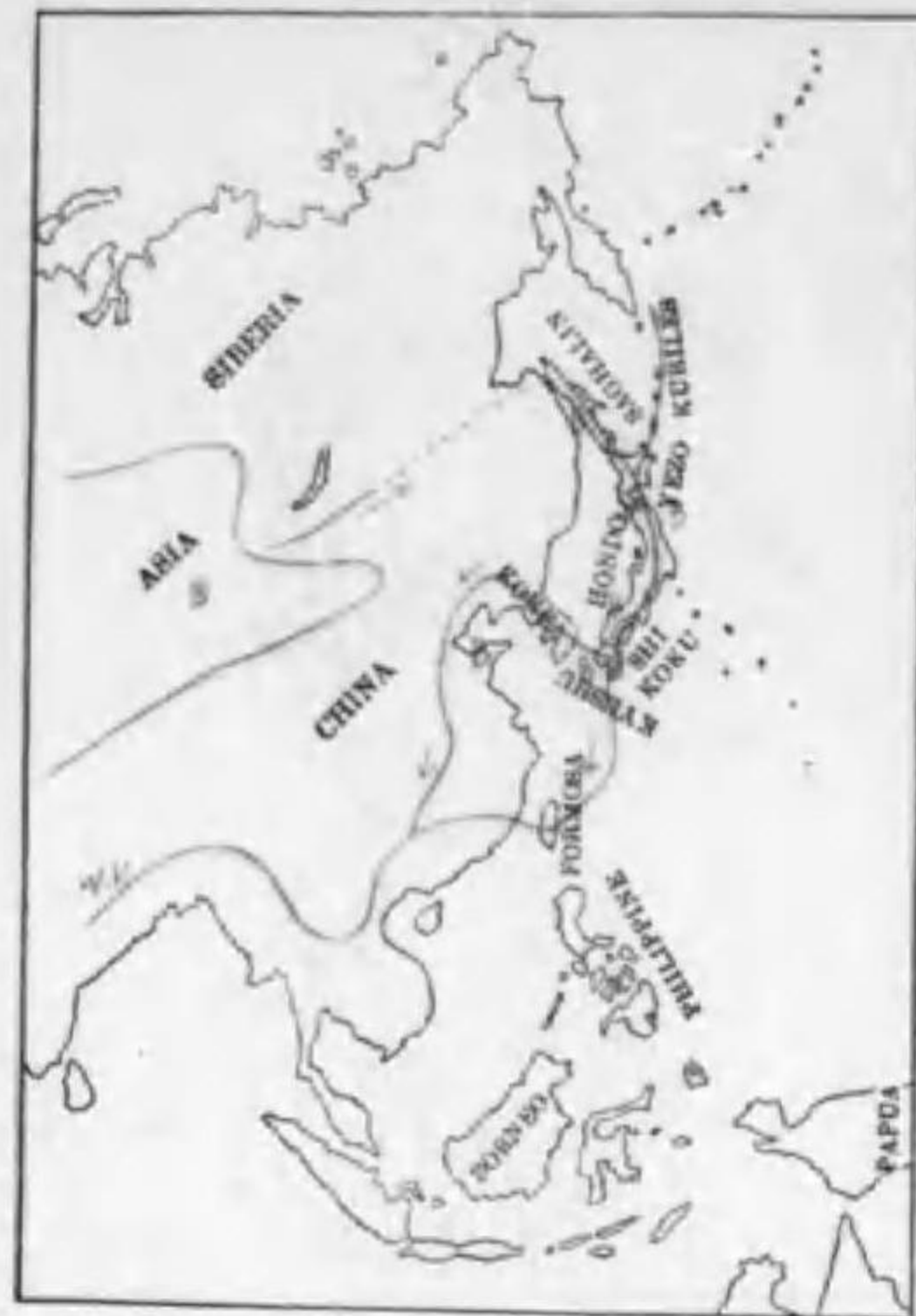
197. Streptopelia orientalis orientalis (Latham) (B) キジバト