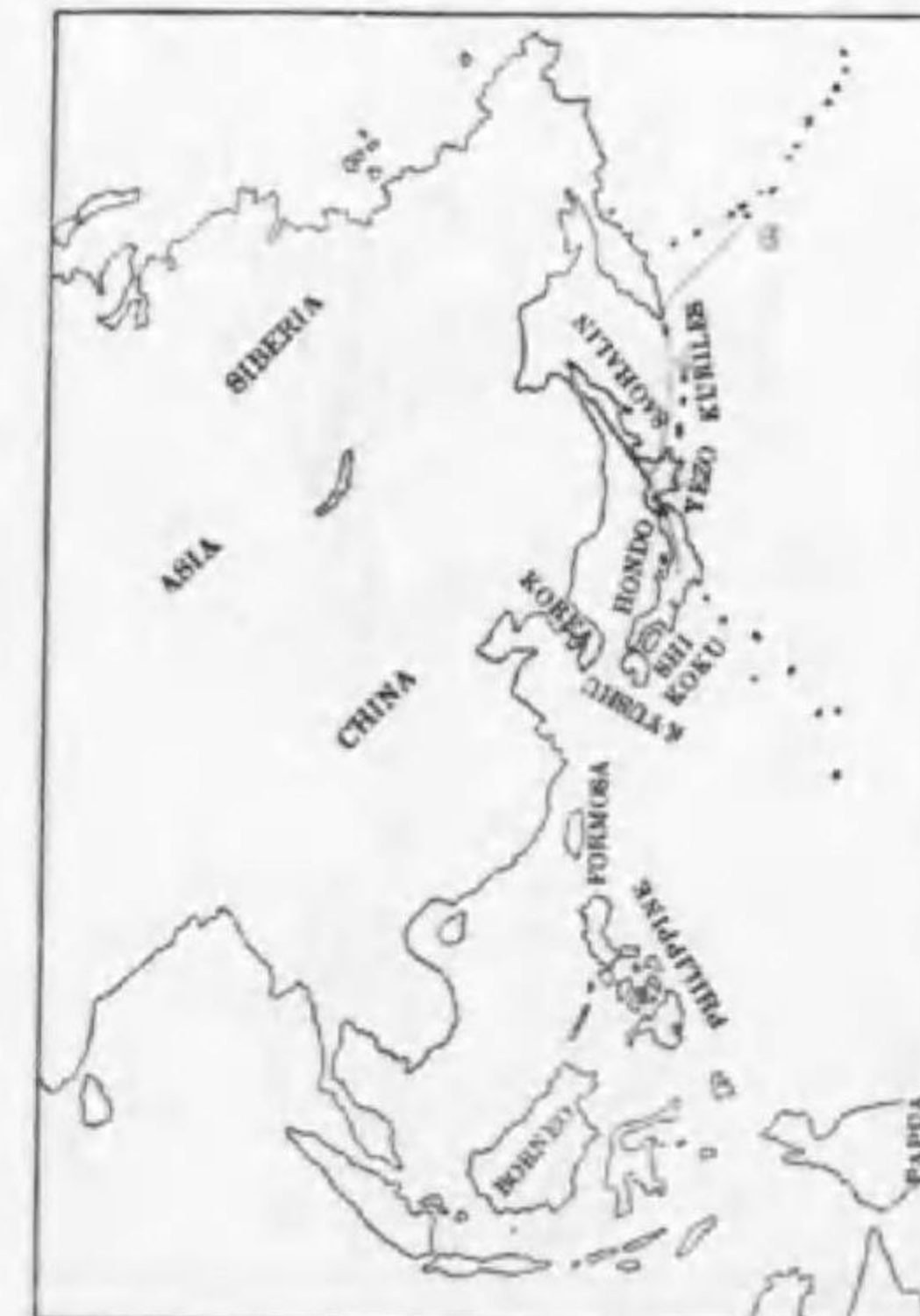
252. Stercorarius parasiticus parasiticus (Linnaeus) クロトウゾクカモメ