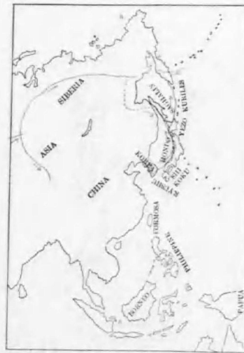
35. Plectrophenax nivalis nivalis (Linnæus) ユキホホジロ