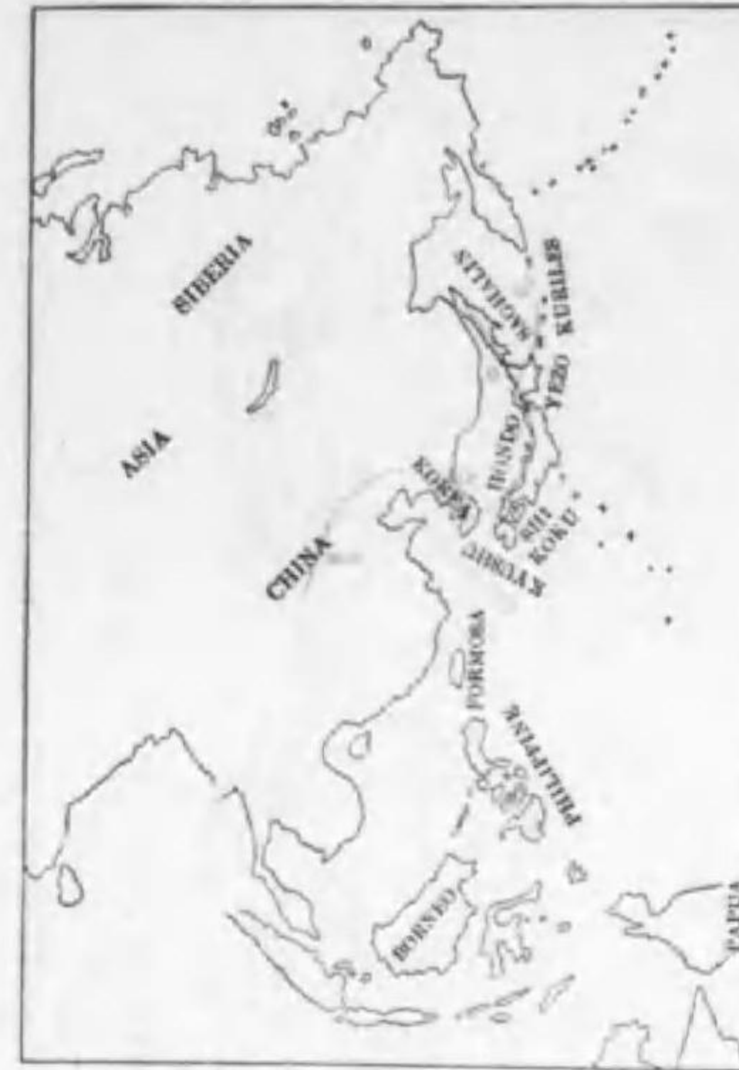
33. Emberiza schoeniclus pyrrhulinus Swinhoe (B) オホジュリン