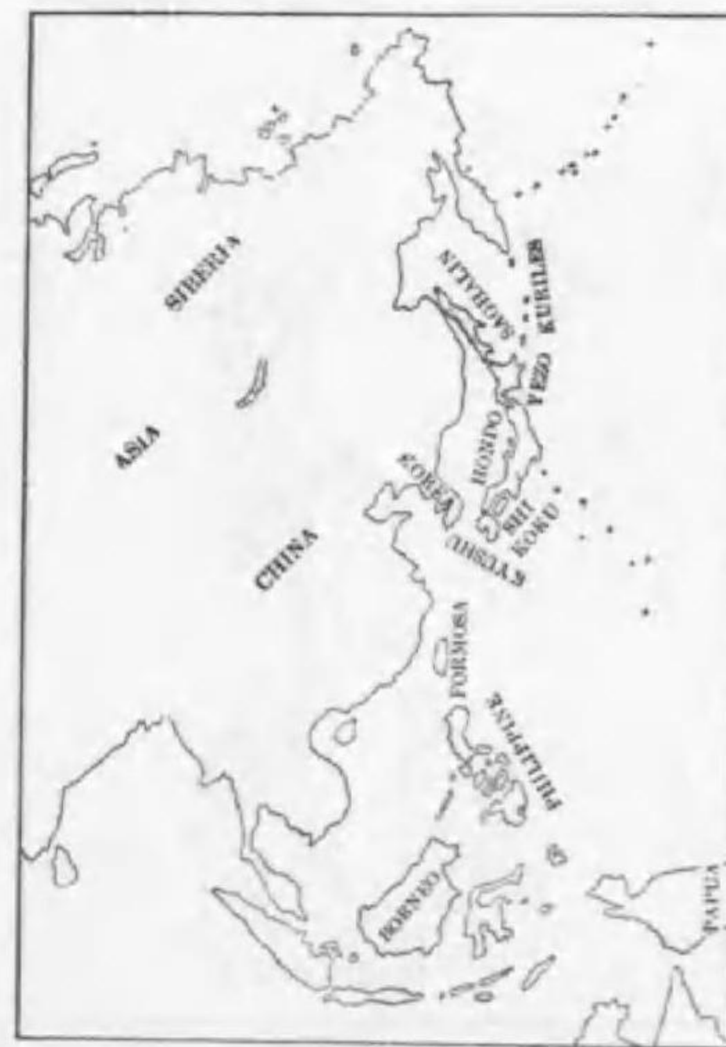
51. Parus major uladiwostokensis Kleinschmidt (B) ラナガシジフカラ