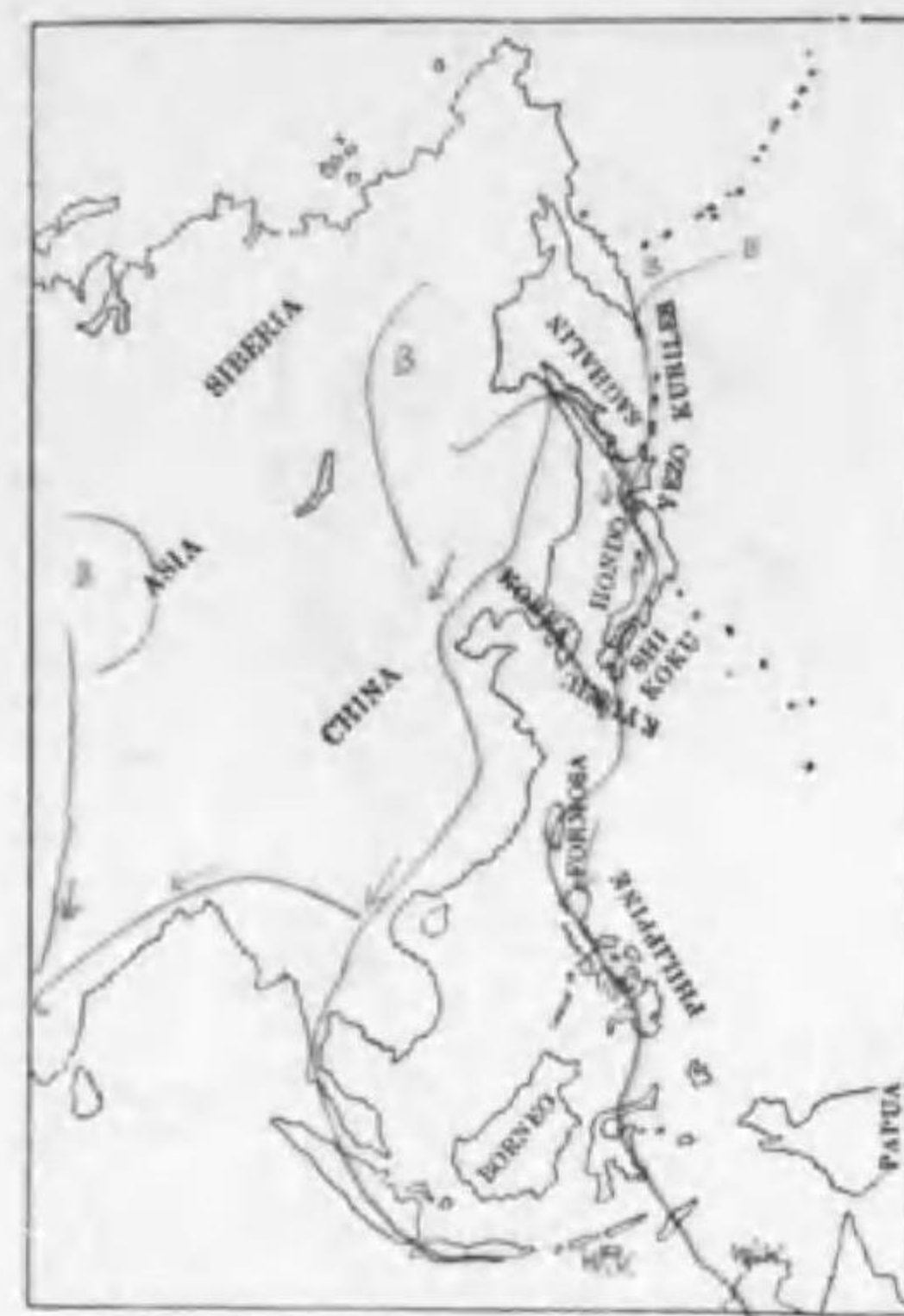
233. Charadrius mongolus mongolus Pallas メダイチドリ