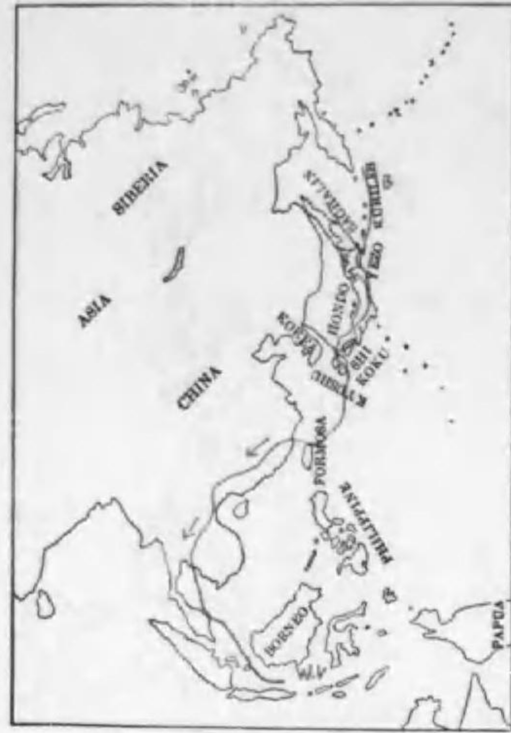
189. Puffinus leucomelas (Temminck) オホミヅナギドリ