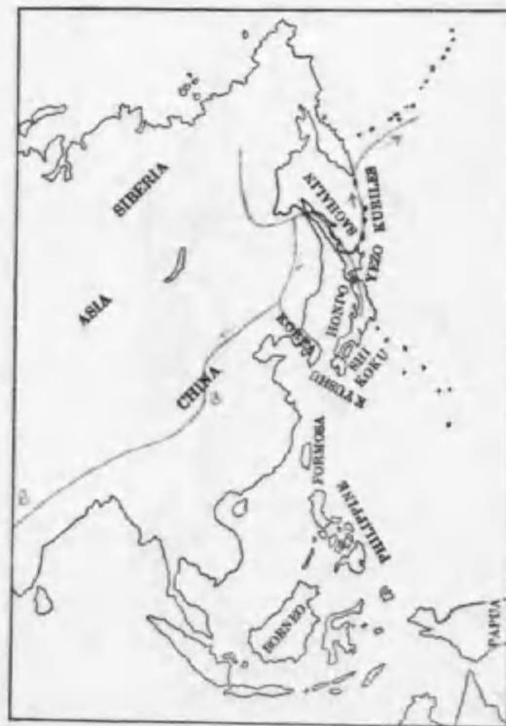
120. Nyctea scandiaca (Linnæus) (B) シロフクロフ