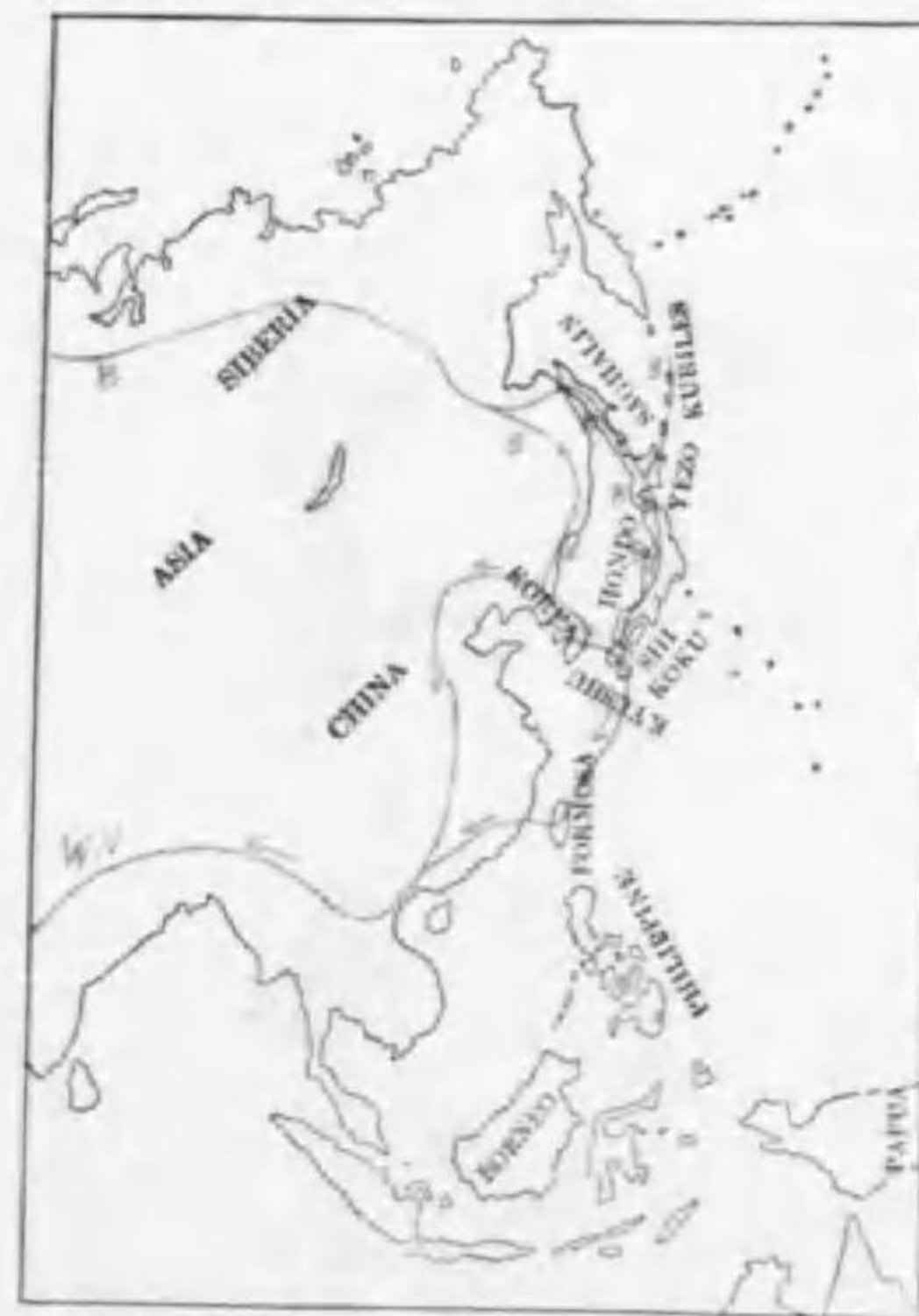
91. Ianthia cyanura cyanura (Pallas) ルリビタキ (B)