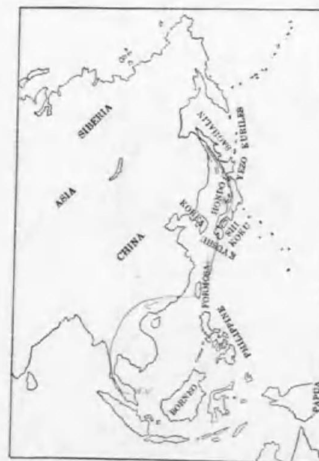
60. Lanius cristatus superciliosus Latham アカモズ