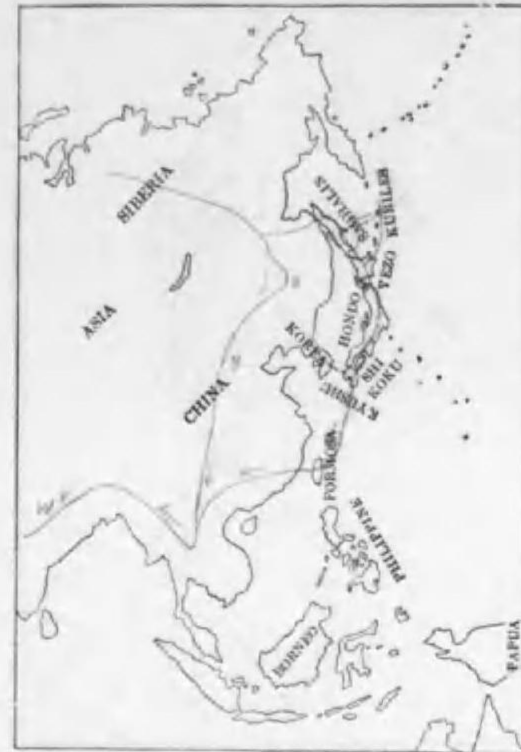
137. Buteo buteo burmanicus Hume ノスリ