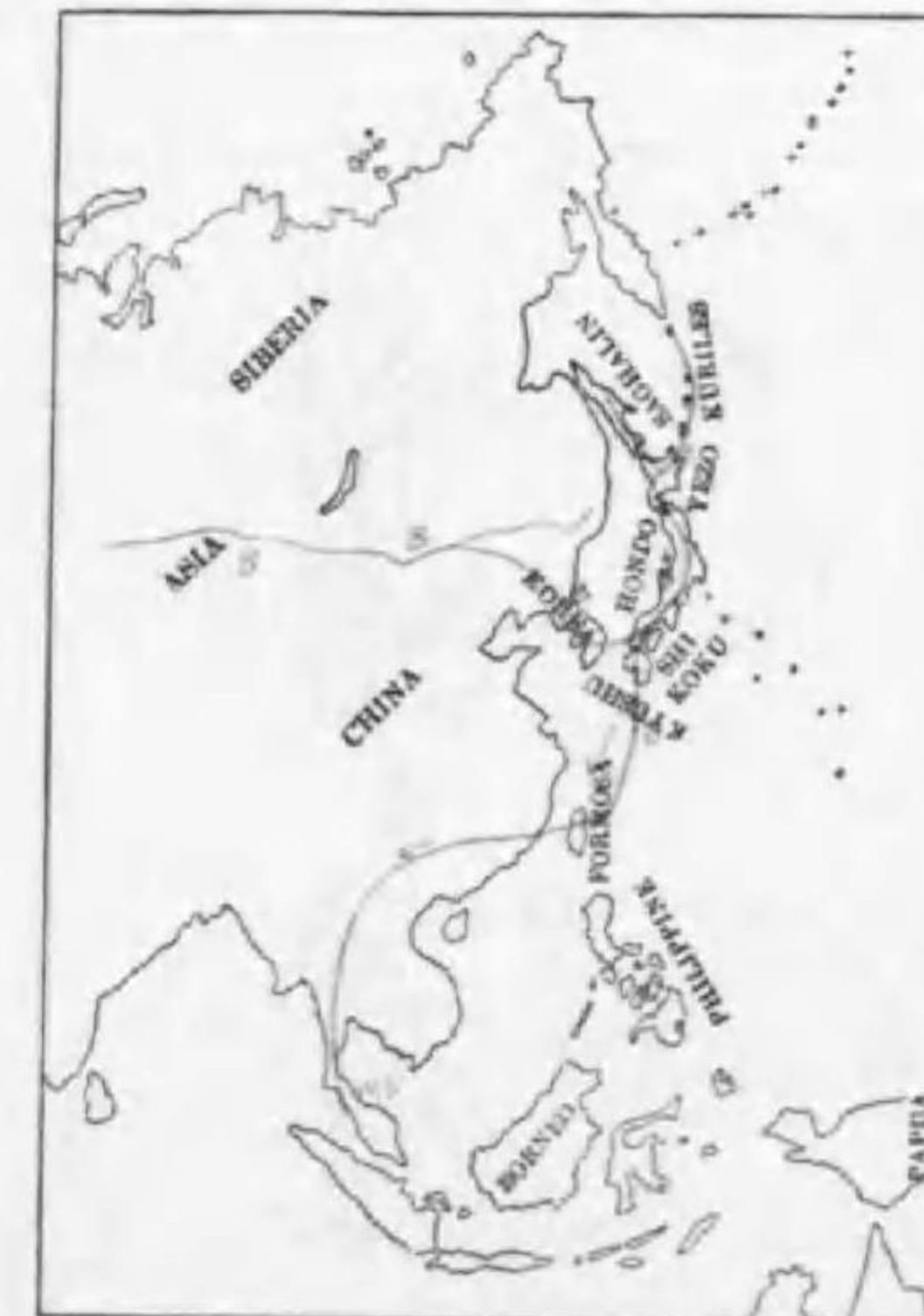
140. Accipiter virgatus gularis (Temminck & Schlegel) ツミ (♀) エツサイ (♂)