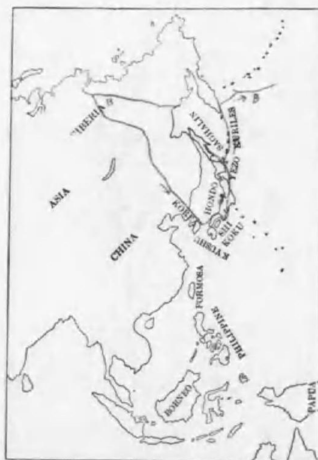
192. Podiceps griseigena holboellii Reinhardt アカエリカツブリ