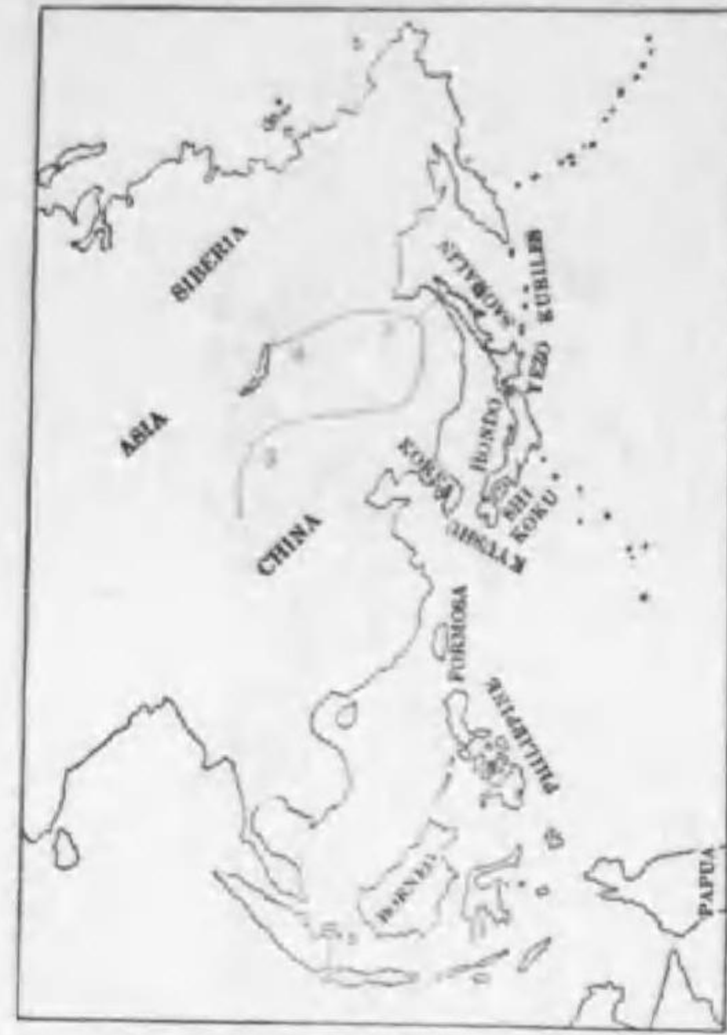
110. Dryobates major tscherskii (Buturlin) キタアカゲラ (B)