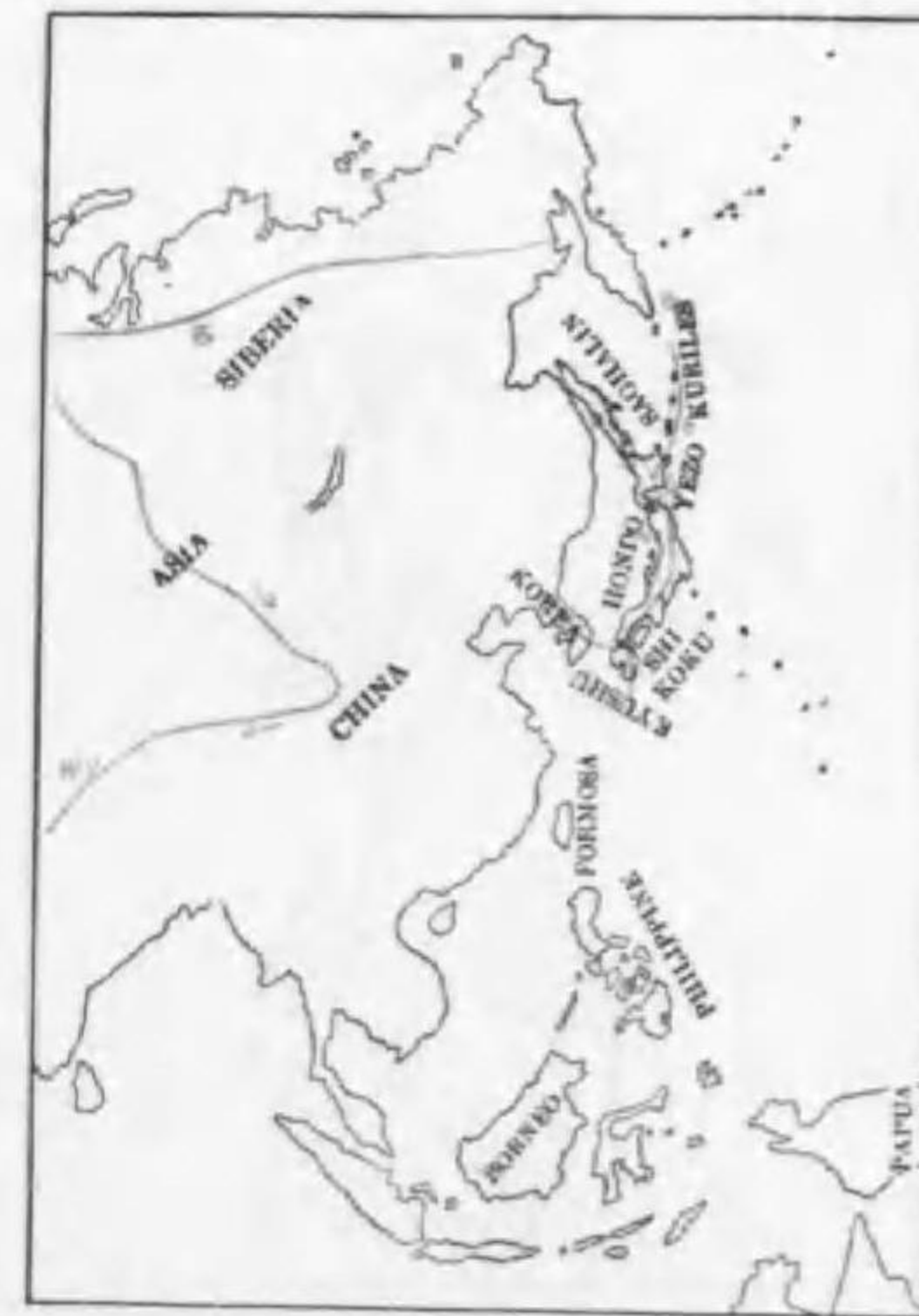
43. Anthus spinoletta japonicus Temminck & Schlegel (B) タヒバリ