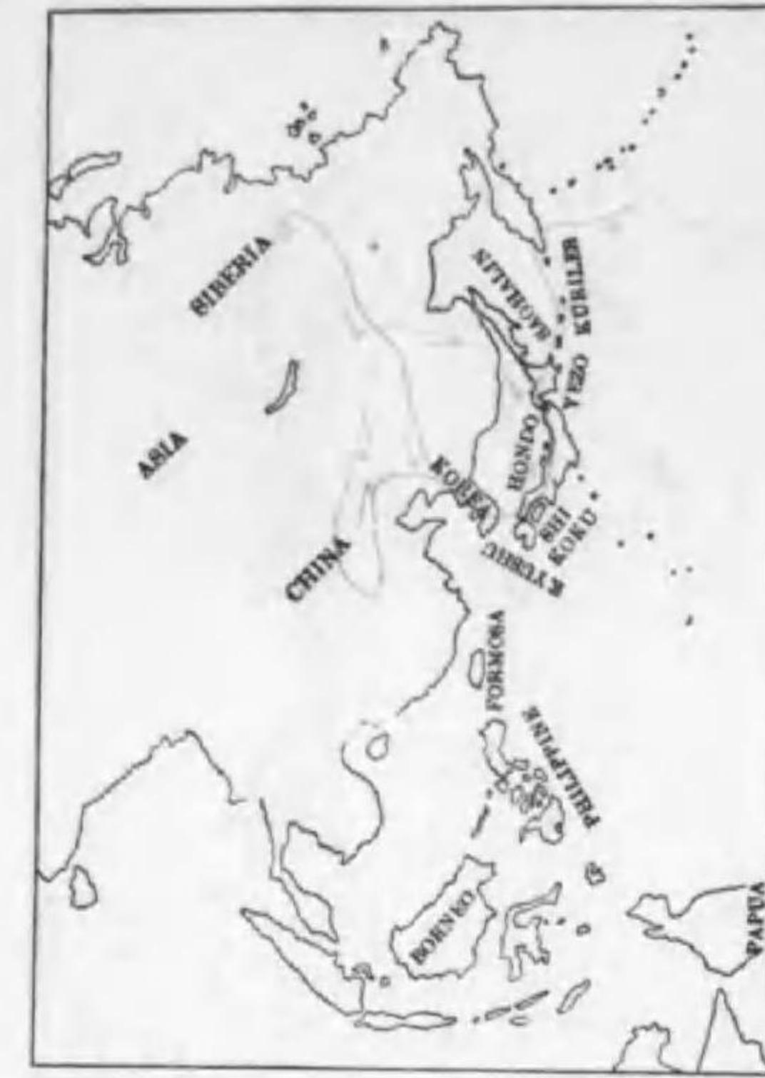
162. Branta bernicla nigricans (Lawrence) コクガン