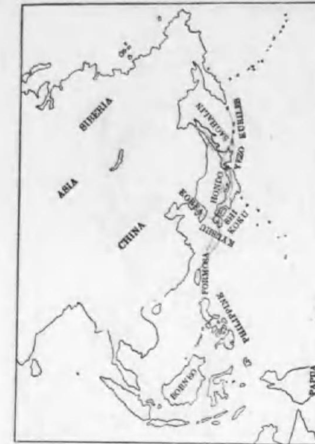
186. Phalacrocorax carbo hanedae Kuroda カハウ