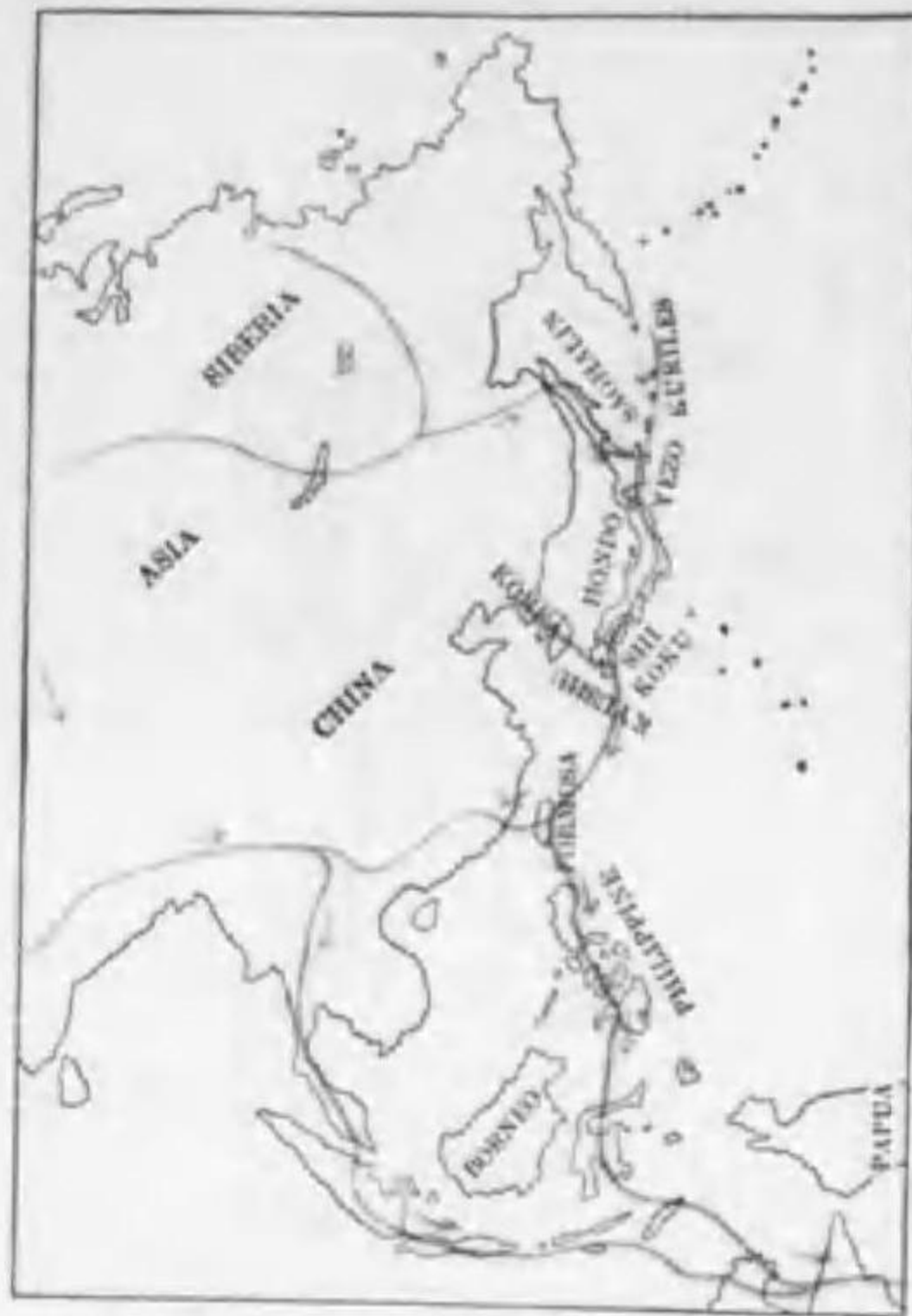
198. Lobipes lobatus (Linnaeus) アカエリヒレアシシギ