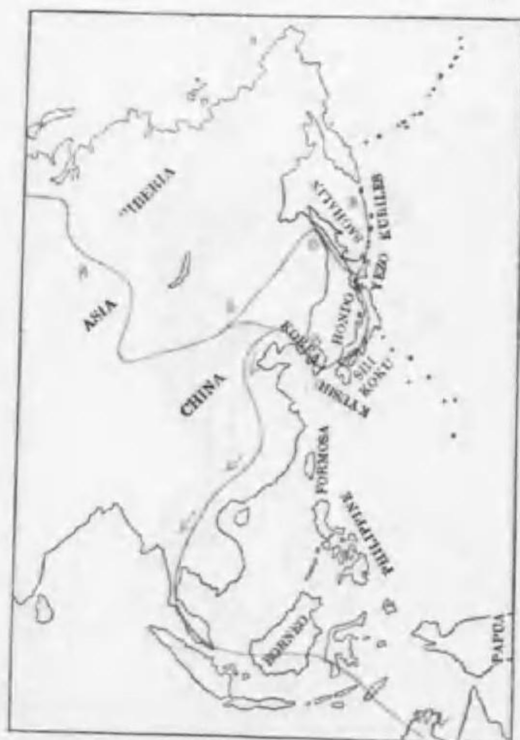
104. Chondestes caudacuta caudacuta (Latham) (B) ハリラアマツバメ