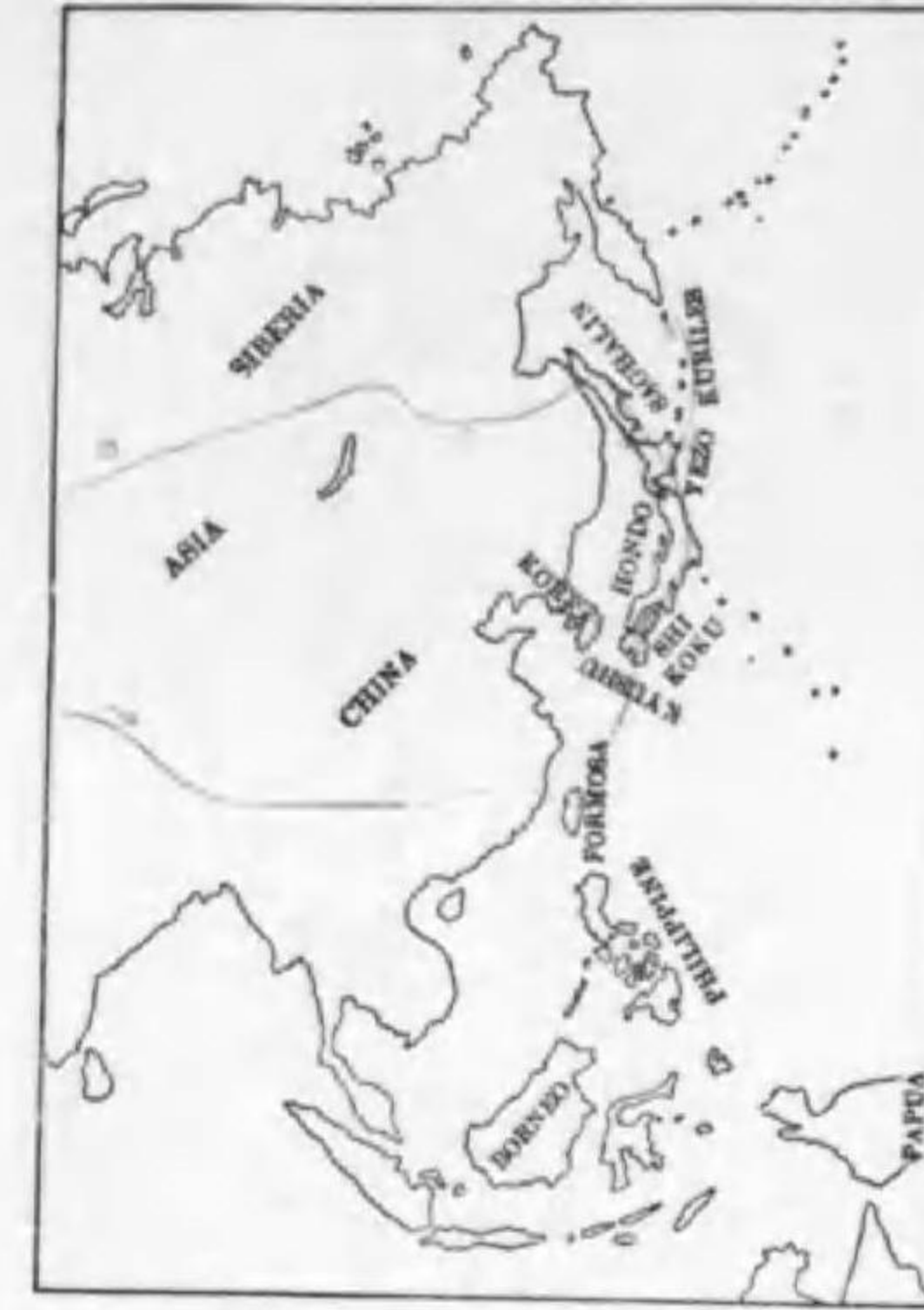
42. Anthus rufogularis Brehm ムネアカタヒバリ