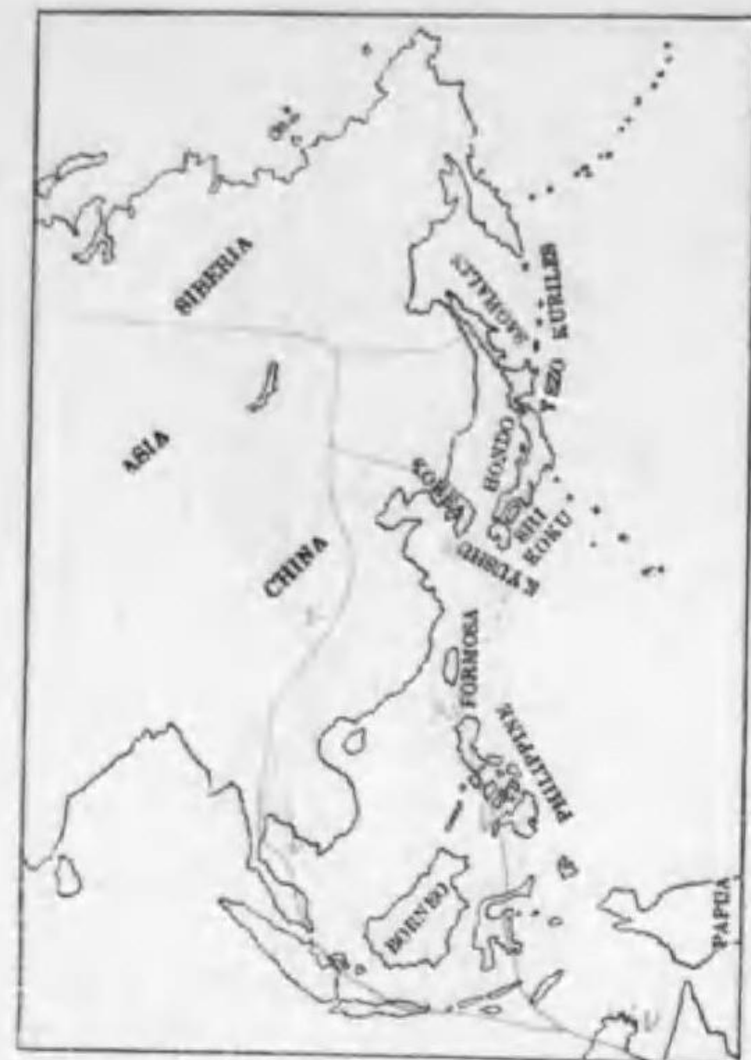
205. Glottis stagnatilis (Bechstein) コアアアシギ