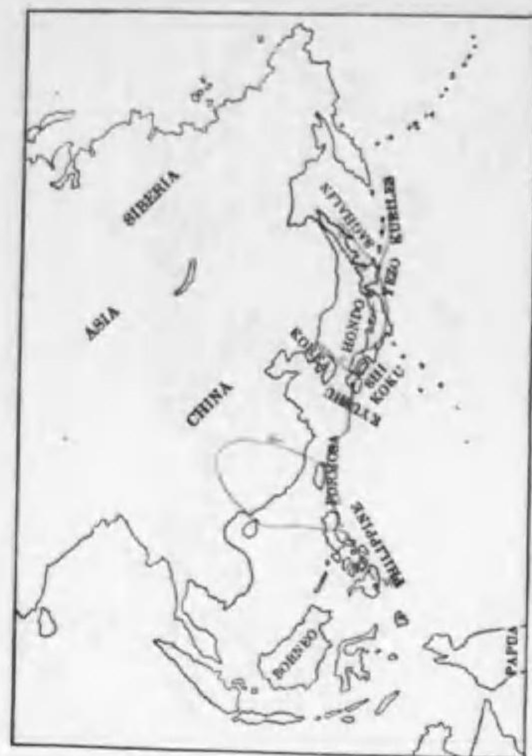
69. Zanthopygia narcissina narcissina (Temminck) (B) キビタキ