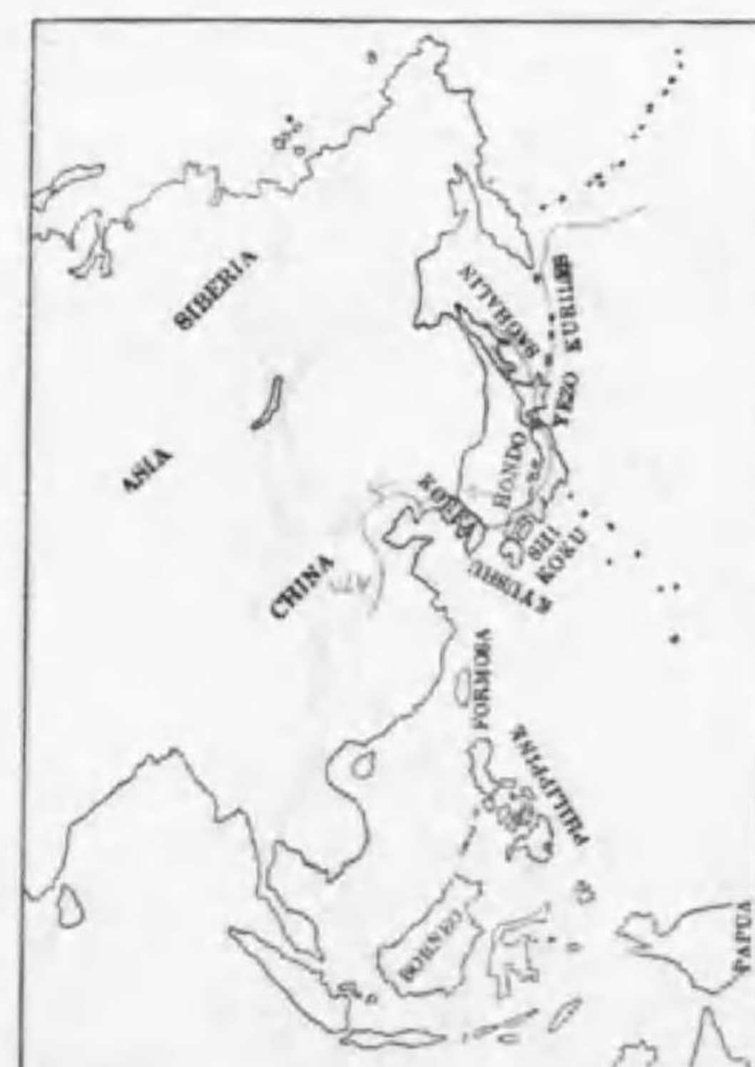
180. Melanitta nigra americana (Swainson) クロガモ