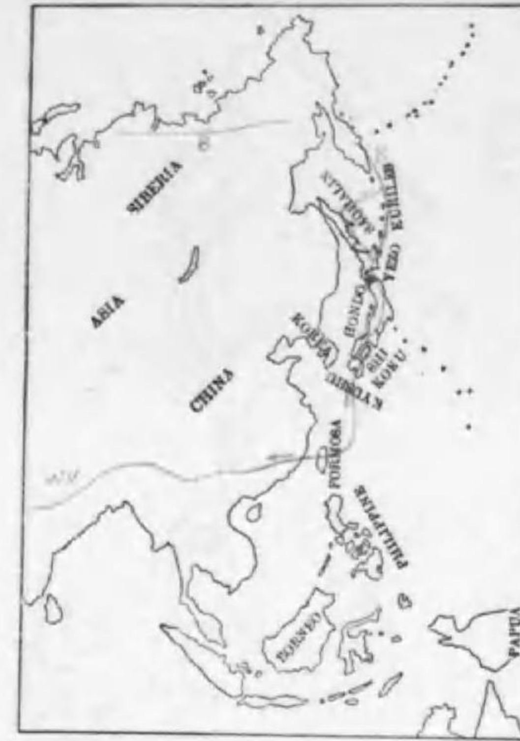
138. Circus cyaneus cyaneus (Linnaeus) ハイイロチウヒ