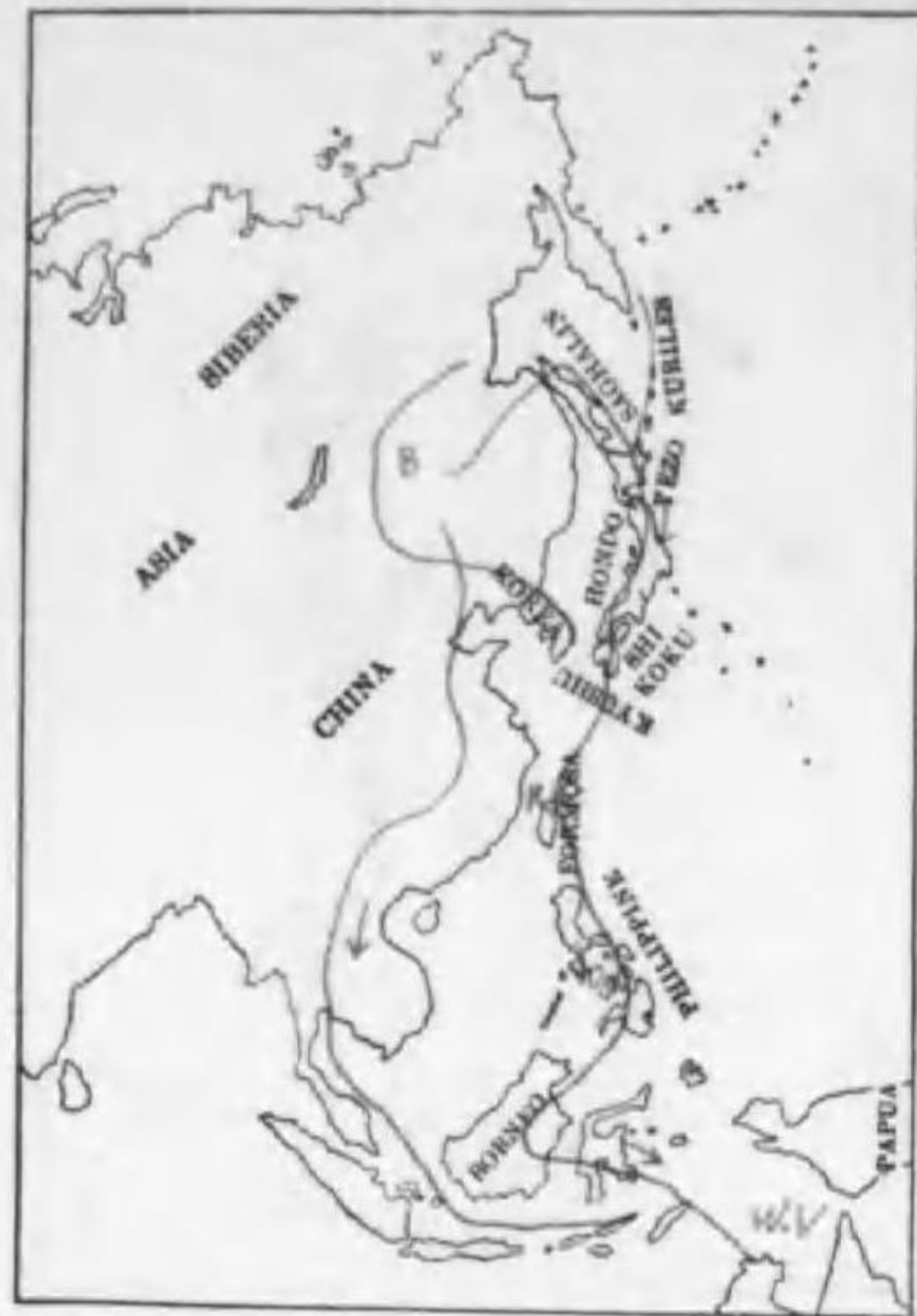
221. Limicola falcinellus sibirica Dresser キリアイ