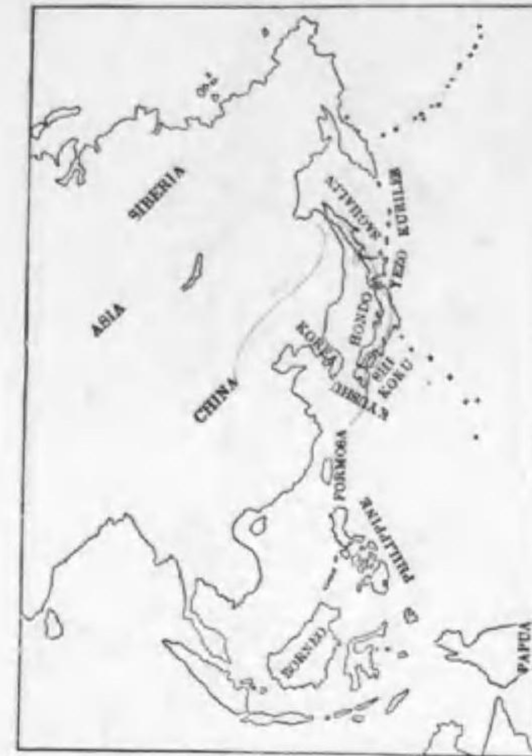
18. Pyrrhula pyrrhula griseiventris Lafresnaye (B) ウソ