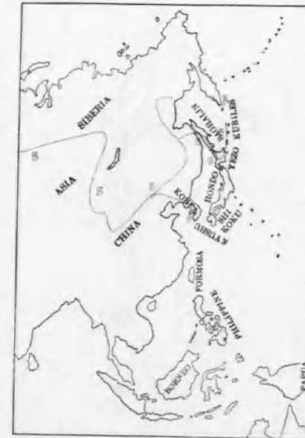
116. Dryocopus martius martius (Linnaeus) (B) クマゲラ