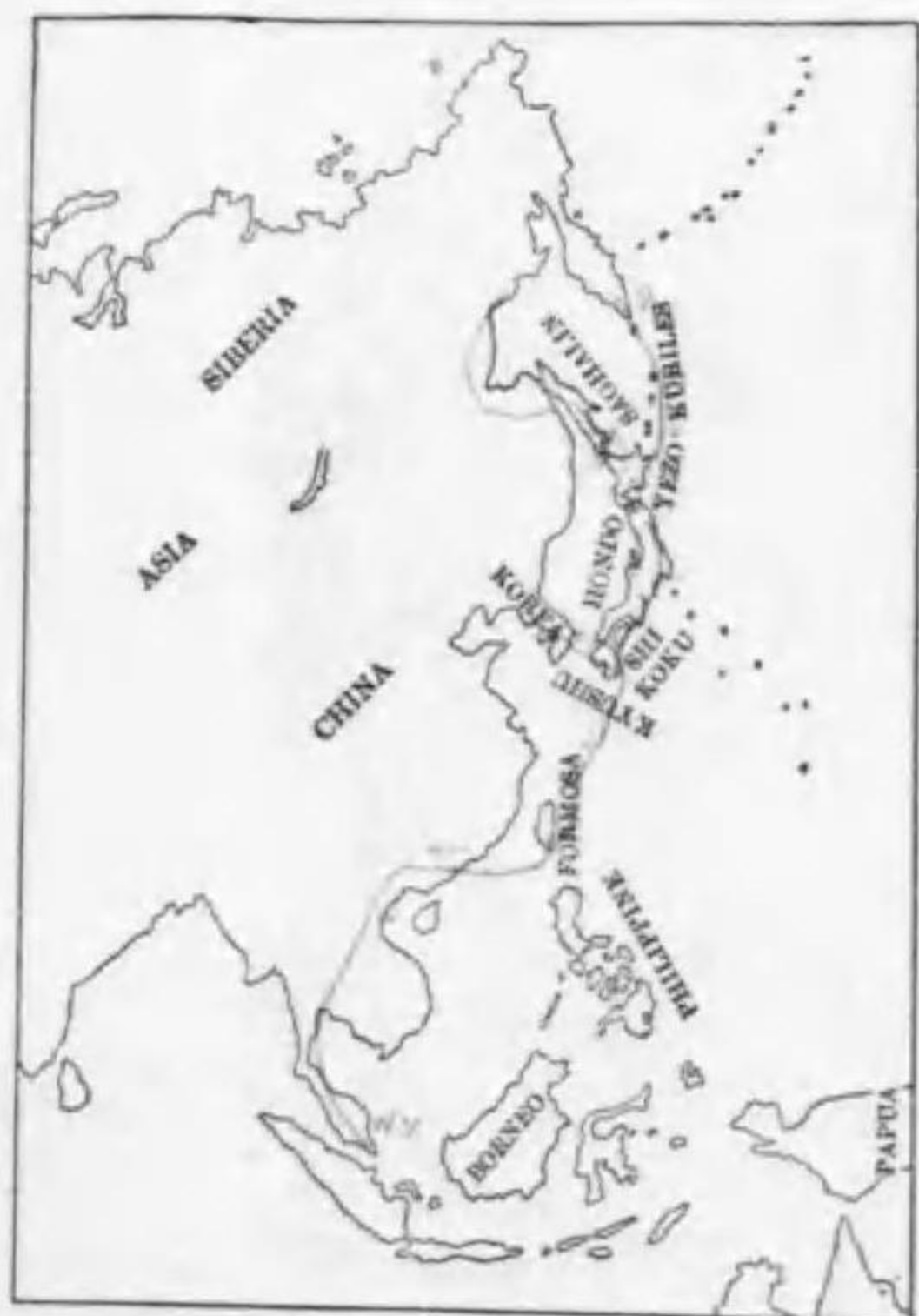
47. Motacilla flava similina Hartert マミジロツメナガセキレイ