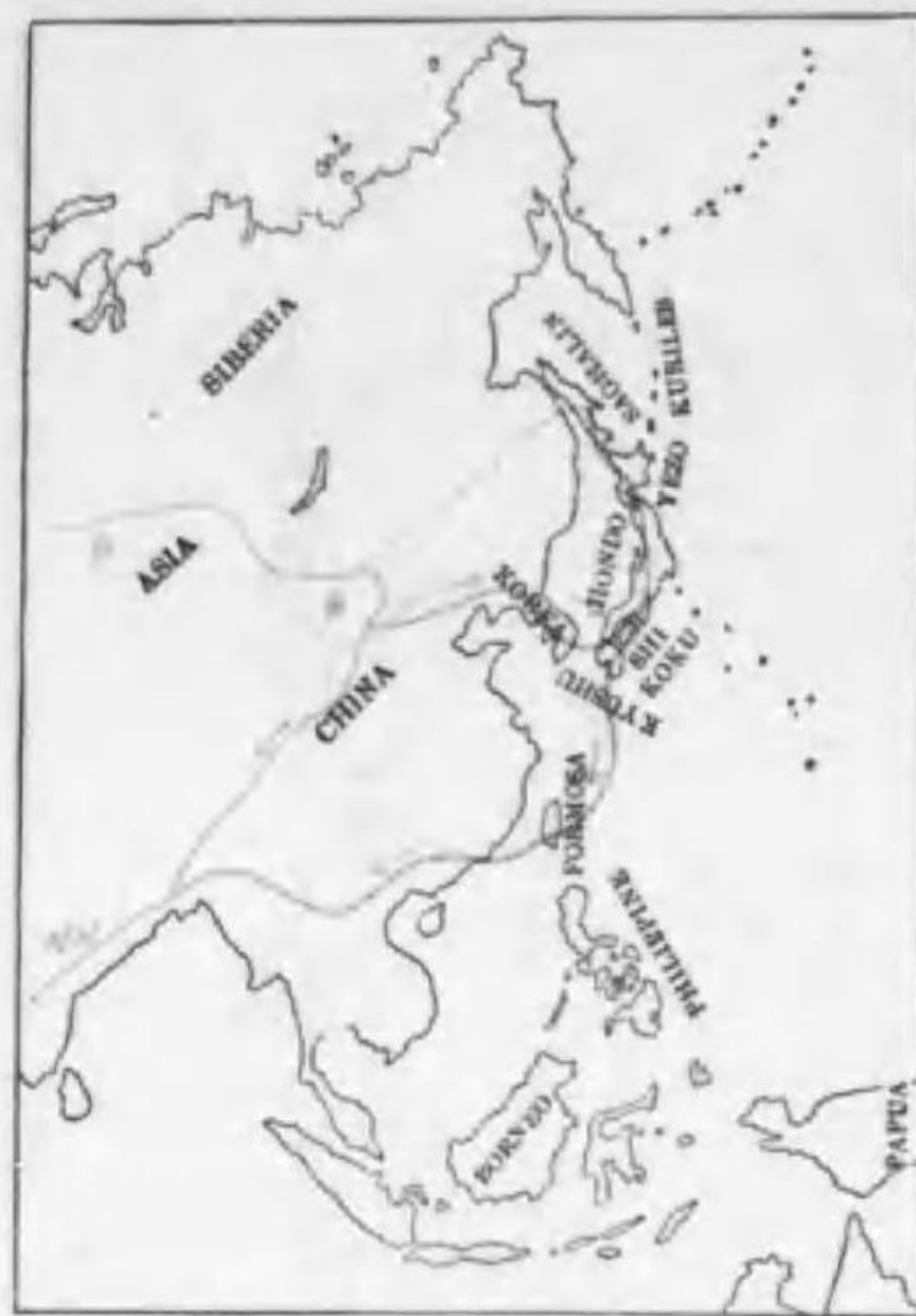
174. Nyroca ferina ferina (Linnaeus) (Rv.) ホシハジロ