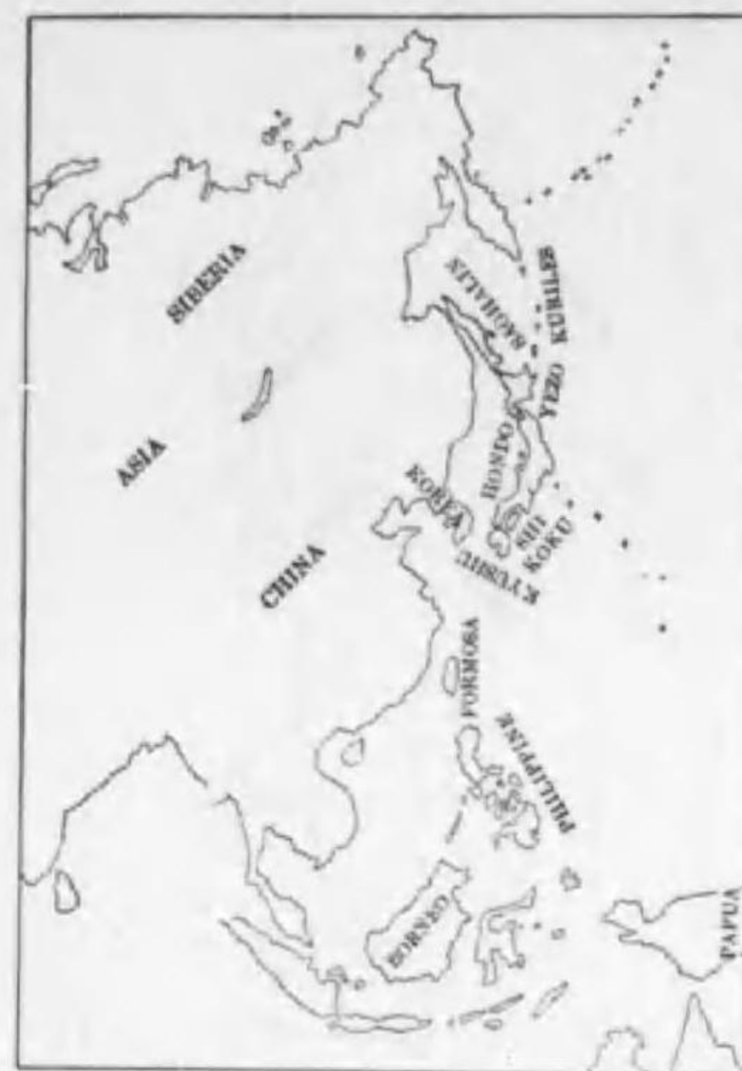
129. Strix nebulosa sakhalinensis (Buturlin) カラフトフクロフ (B)