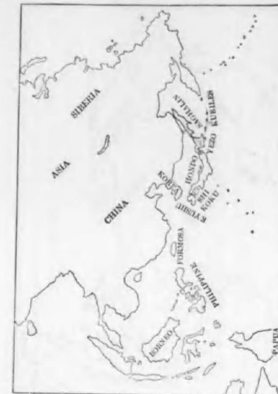
2. Coreus coronoides japonensis Bonaparte エゾハシブトガラス (B)