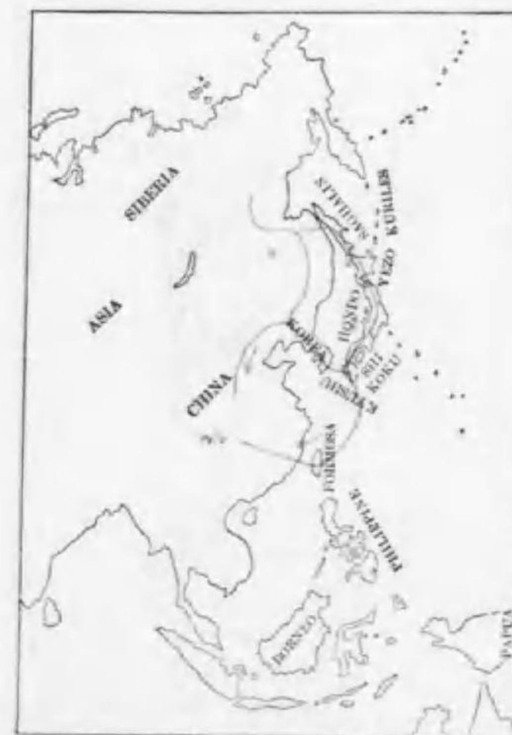
187. Phalacrocorax pelagicus pelagicus Pallas ヒメウ