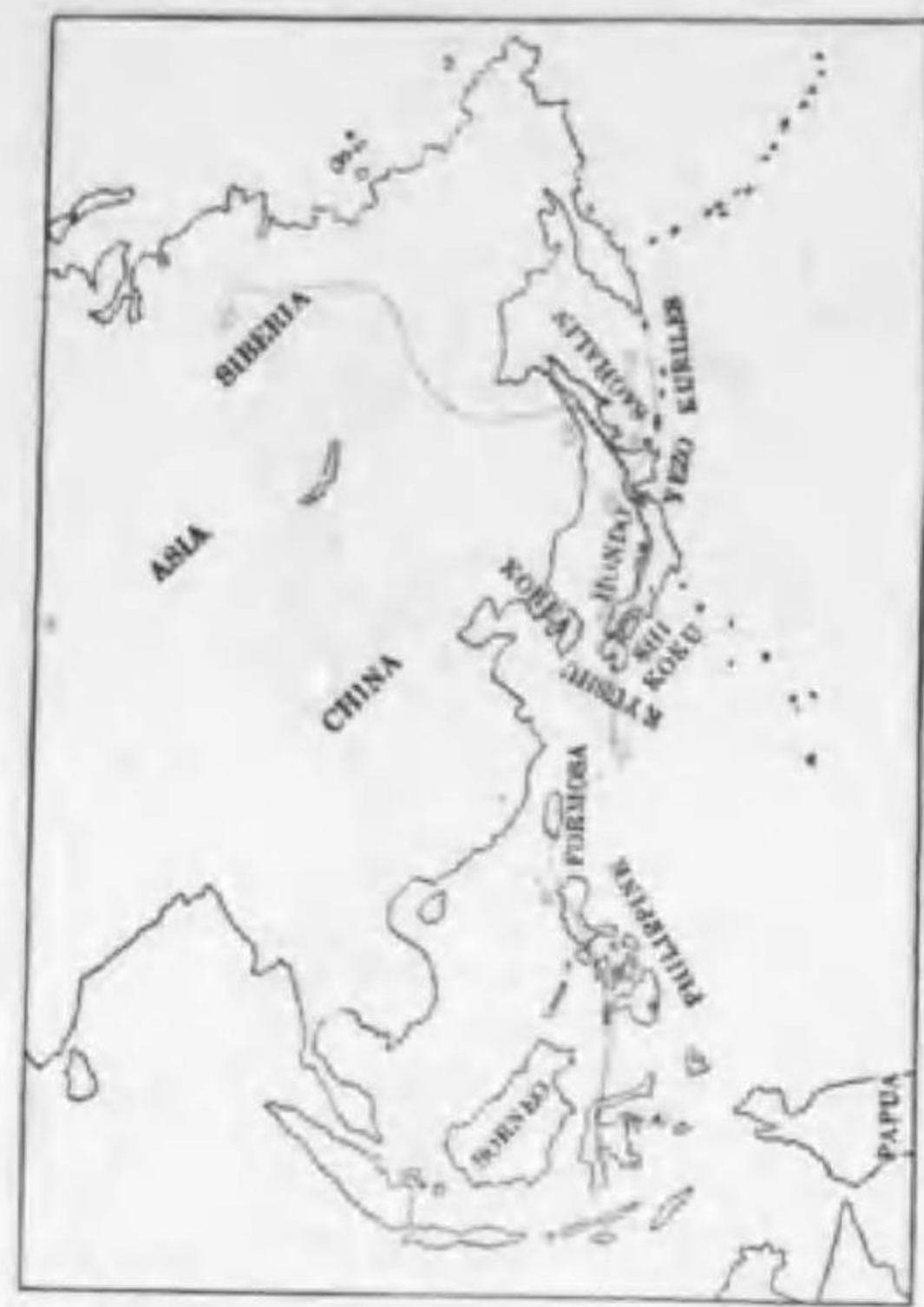
78. Locustella fasciolata (Gray) (B) エゾセンニウ