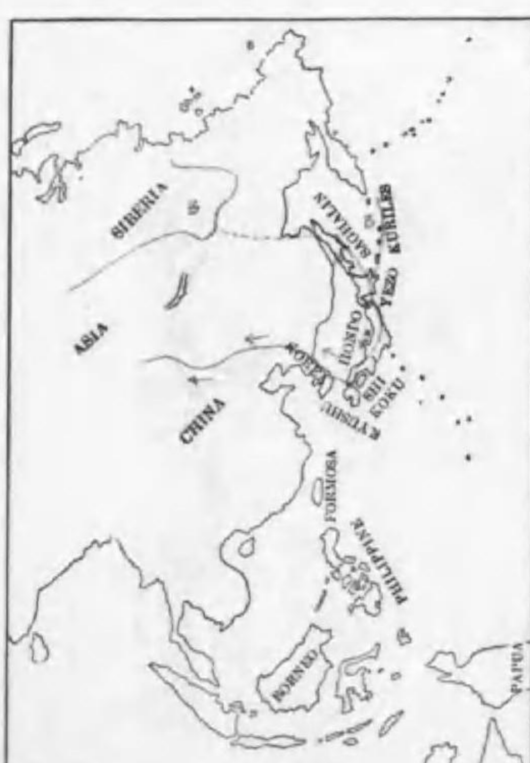
179. Melanitta fusca stejnegeri (Ridgway) (B) ピロウトキンクロ