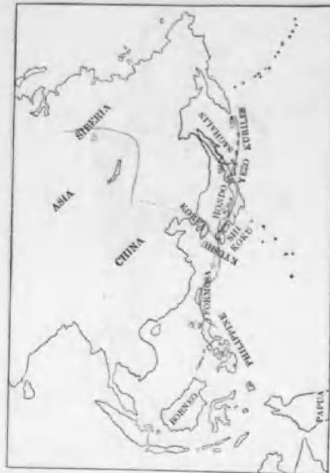
166. Querquedula ereca ereca (Linnaeus) (B) コガモ