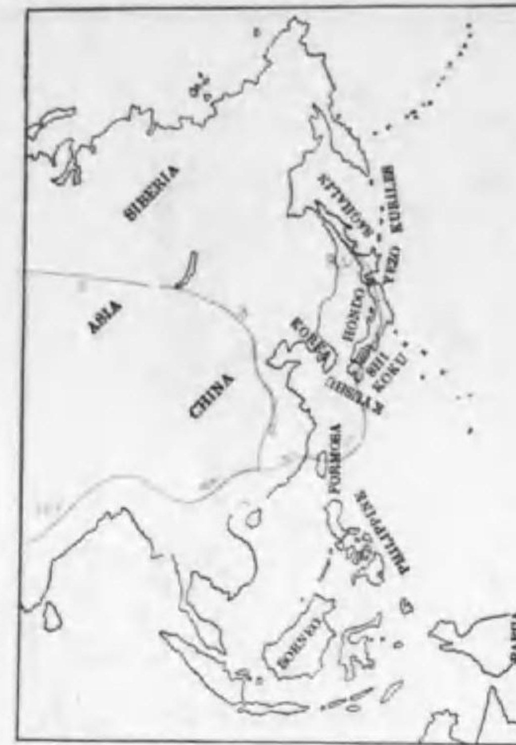
154. Botaurus stellaris stellaris (Linnaeus) サンカノゴキ (Rv.)