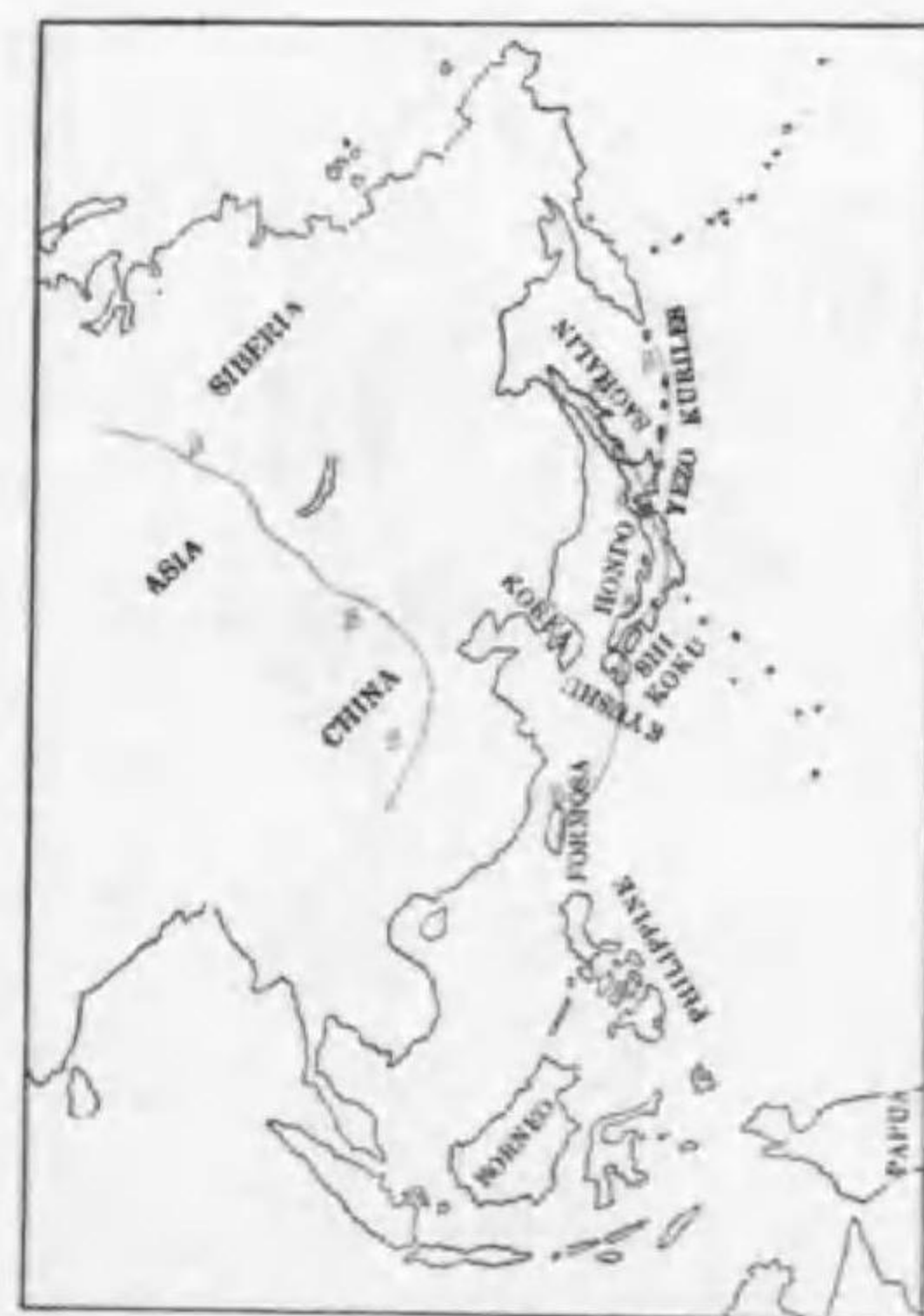
107. Alcedo atthis japonica Bonaparte (B) カハセミ