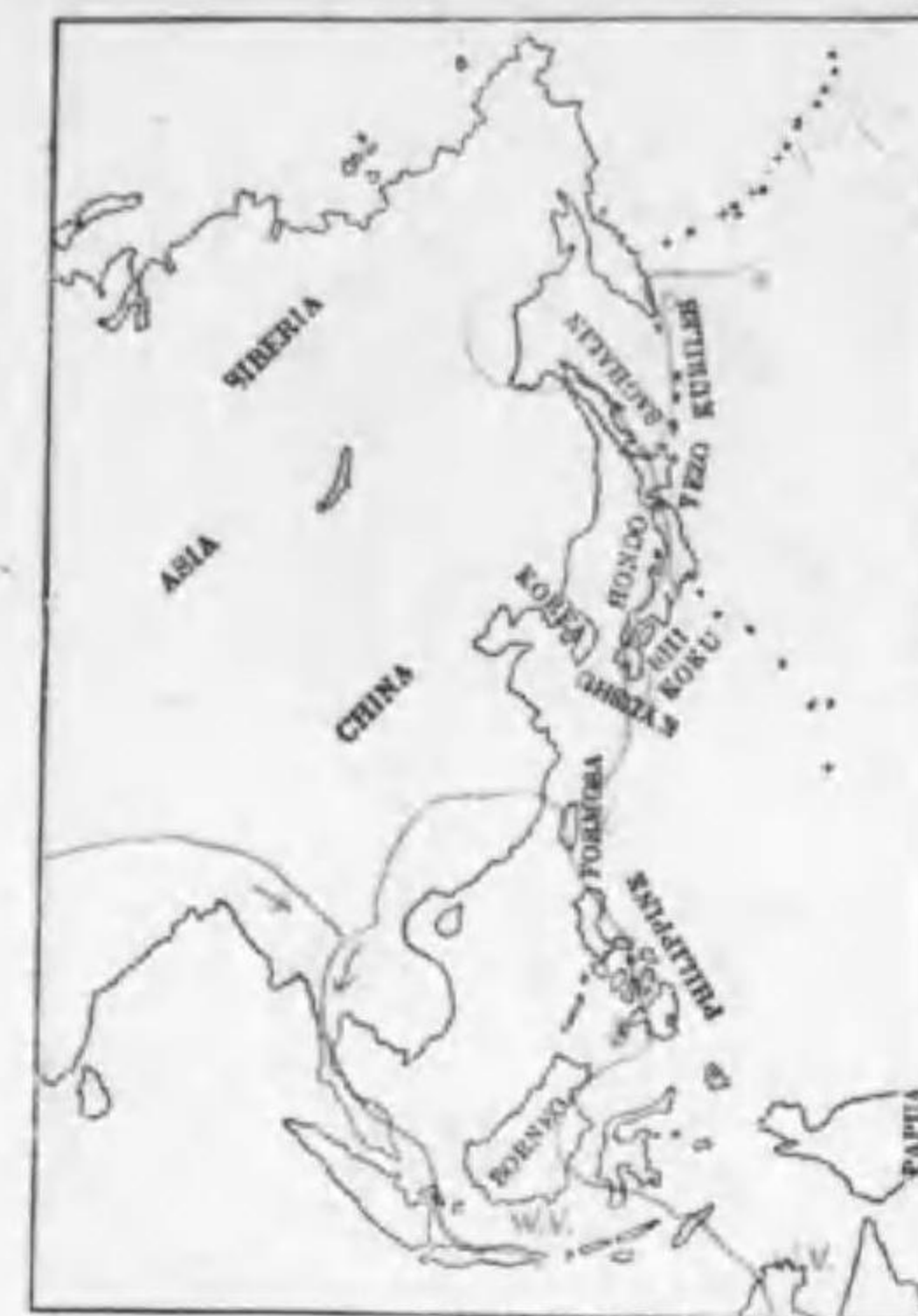
210. Limosa lapponica baueri Naumann オホソリハシギ (B)