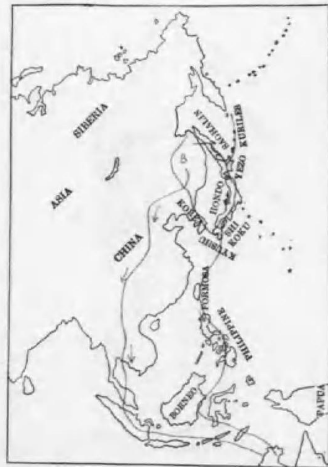
215. Calidris canutus rogersi (Mathews) コヲバシギ