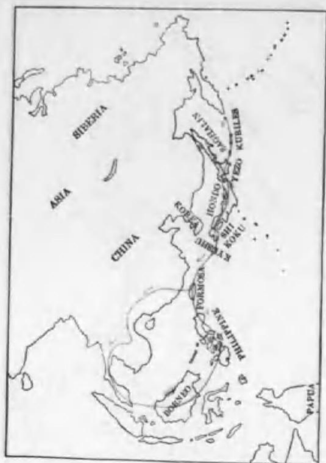
101. Delichon urbica dasypus (Bonaparte) イハツバメ (B)