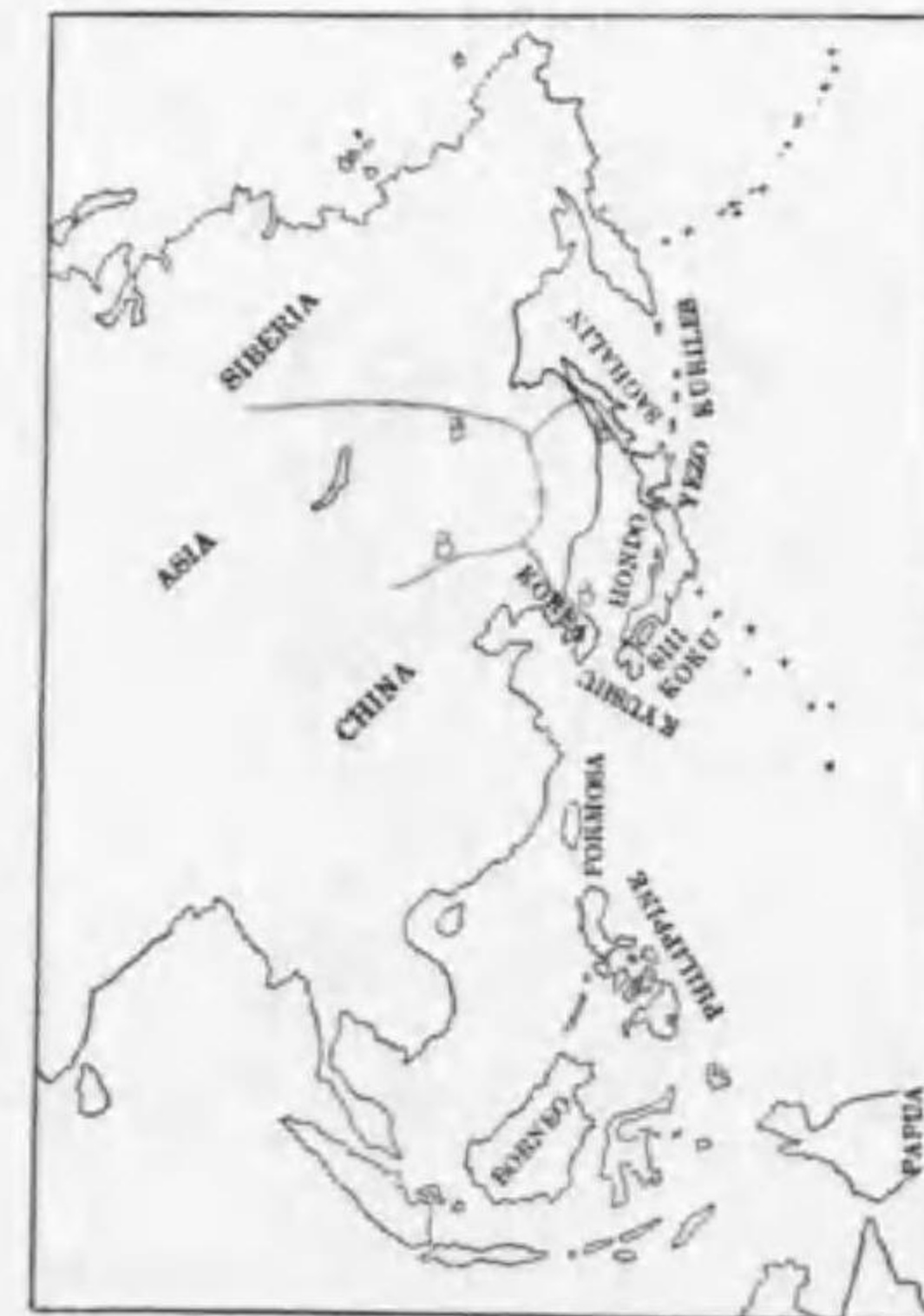
124. Otus scops stictonotus (Sharpe) (B) テウセンコノハヅク