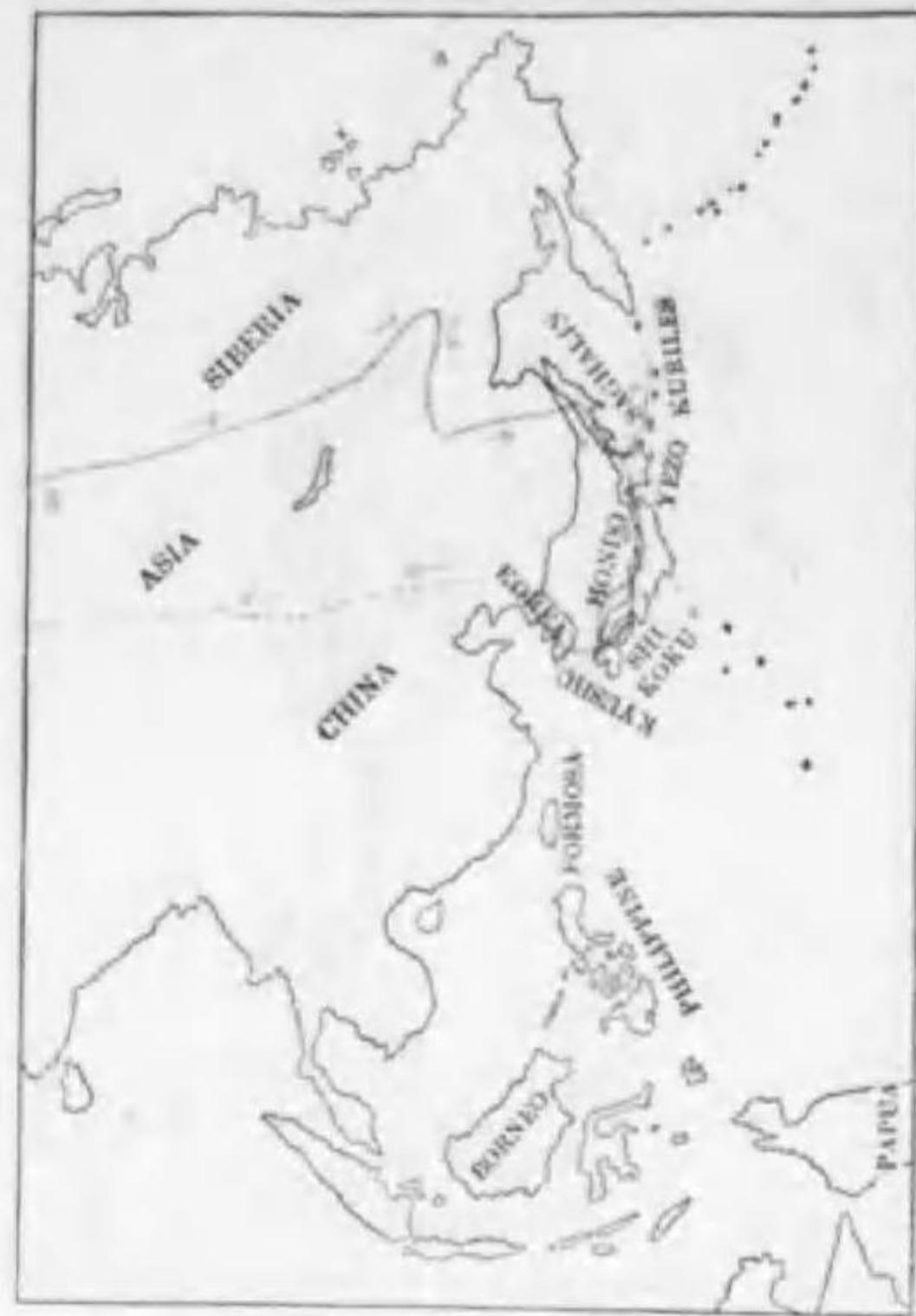
62. Bombycilla garrula centralis Poljakov キレンジャク