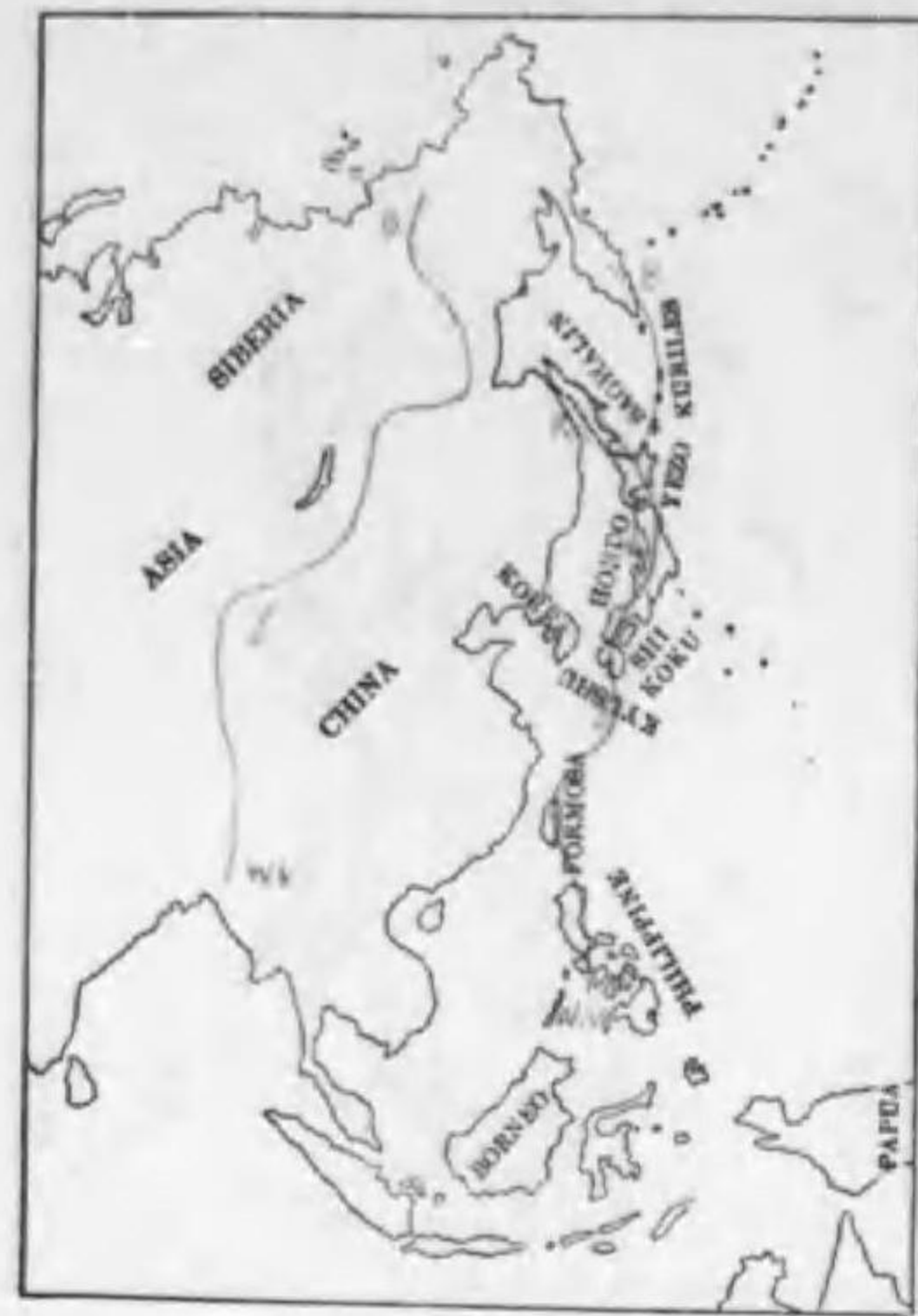
165. Anas strepera Linnaeus (Rv.) ヲカヨシガモ