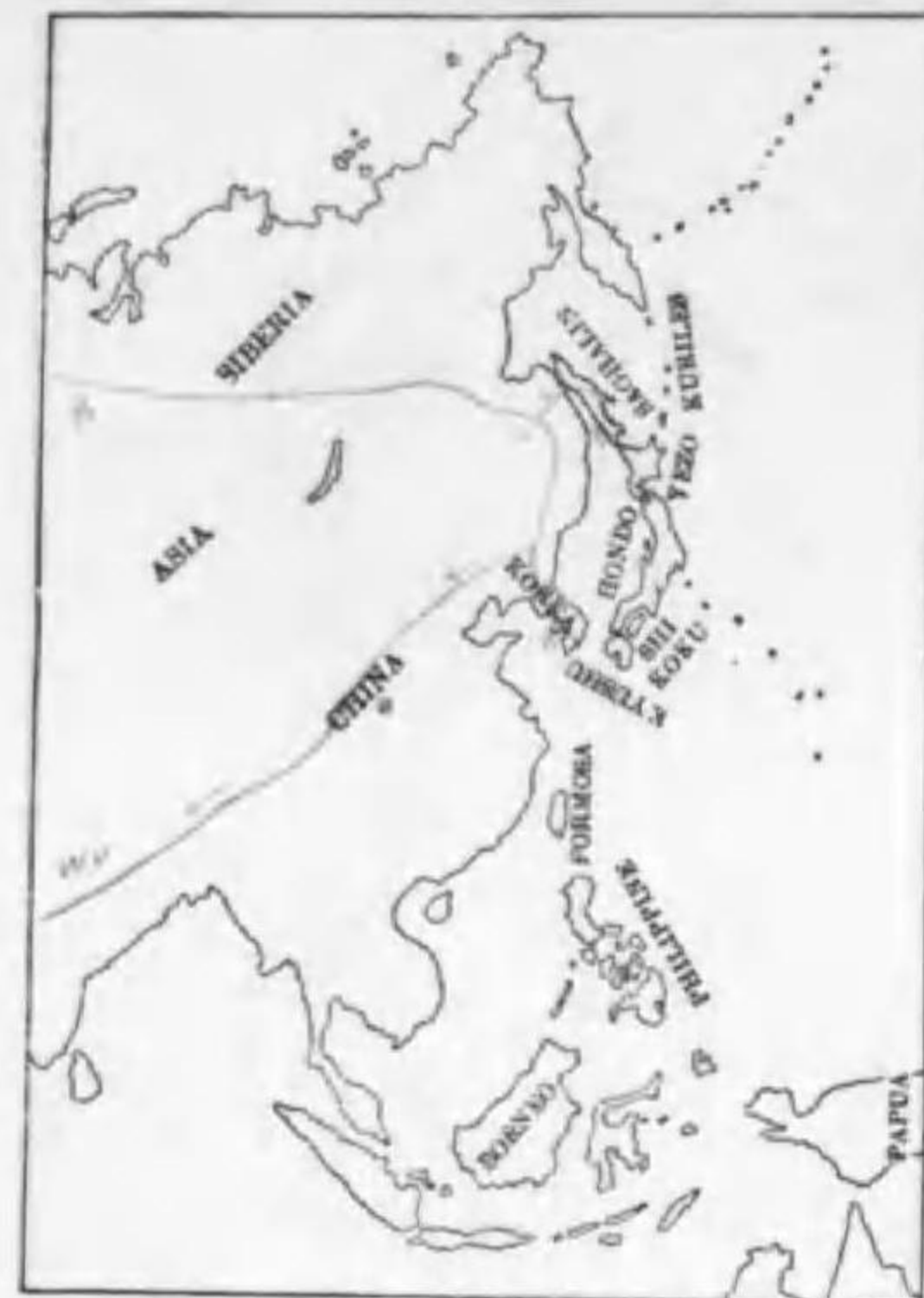
74. Phylloscopus proregulus proregulus (Pallas) (B) カラフトムシクヒ