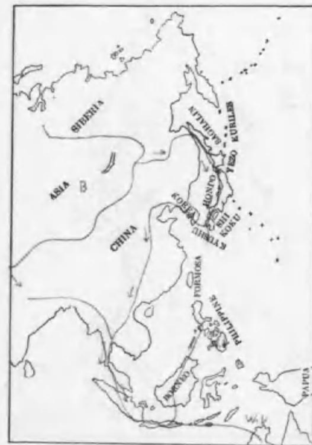
203. Tringa erythropus (Pallas) フルシギ