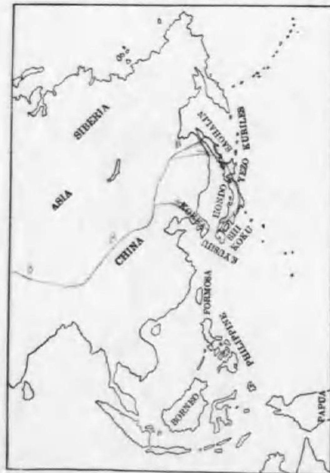
135. Falco columbarius insignis Clark コチャウゲンボウ