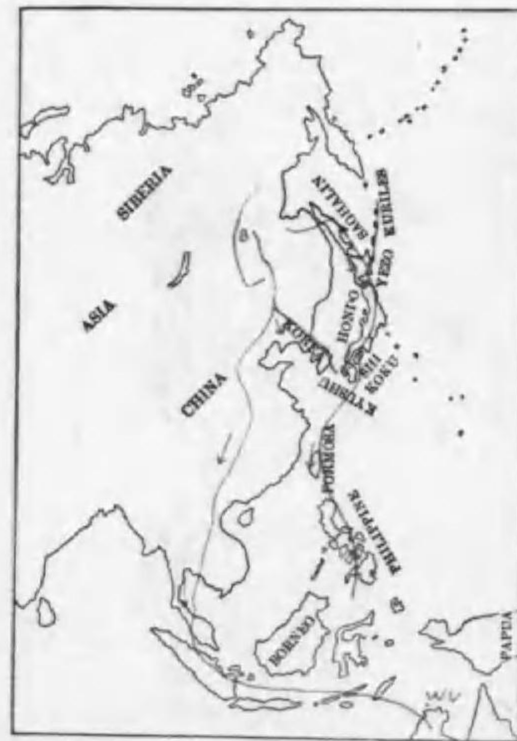
216. Calidris tenuirostris (Horsfield) ヲバシギ