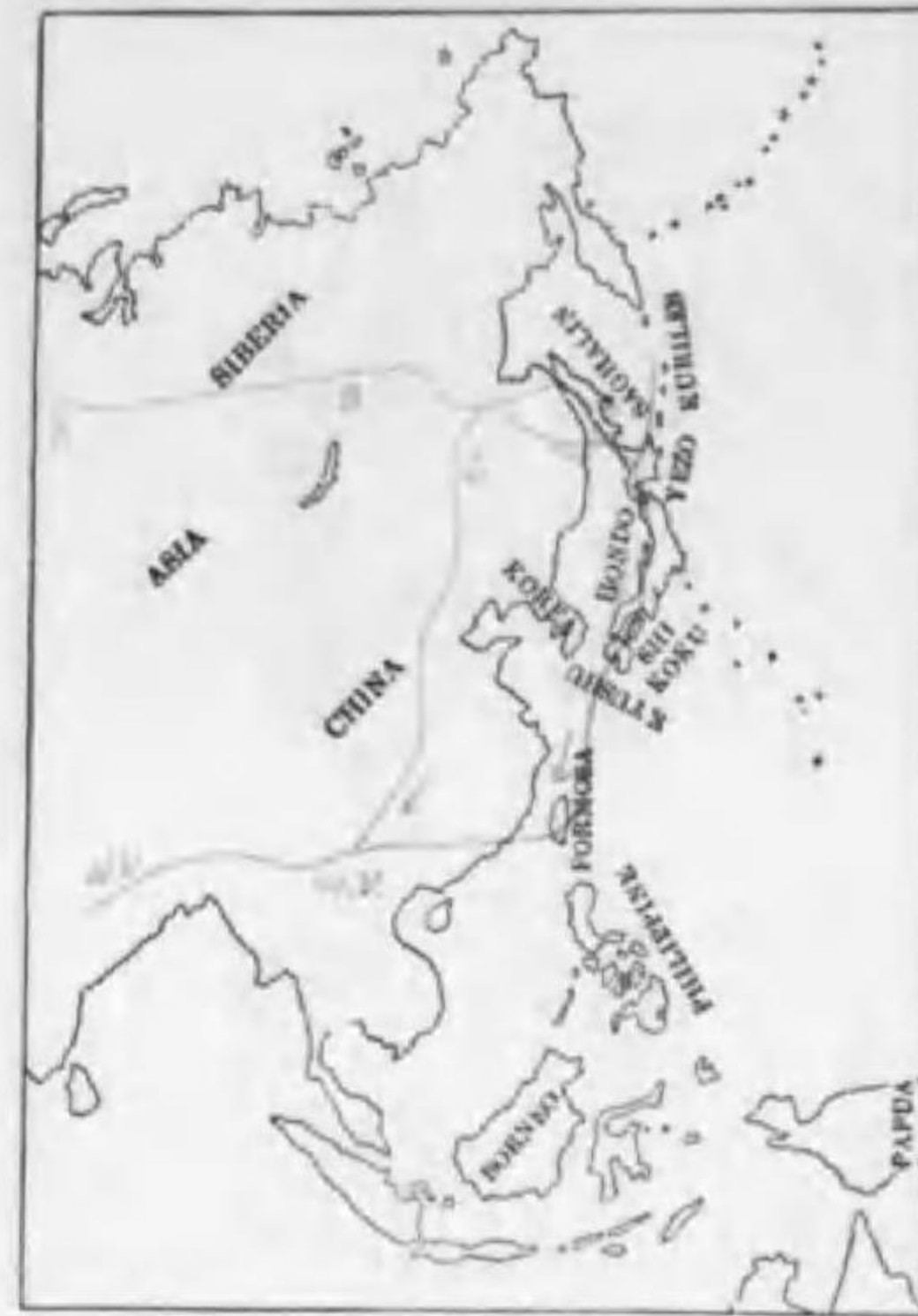
142. Haliaeetus albicilla albicilla (Linnaeus) (B) ラジロワシ