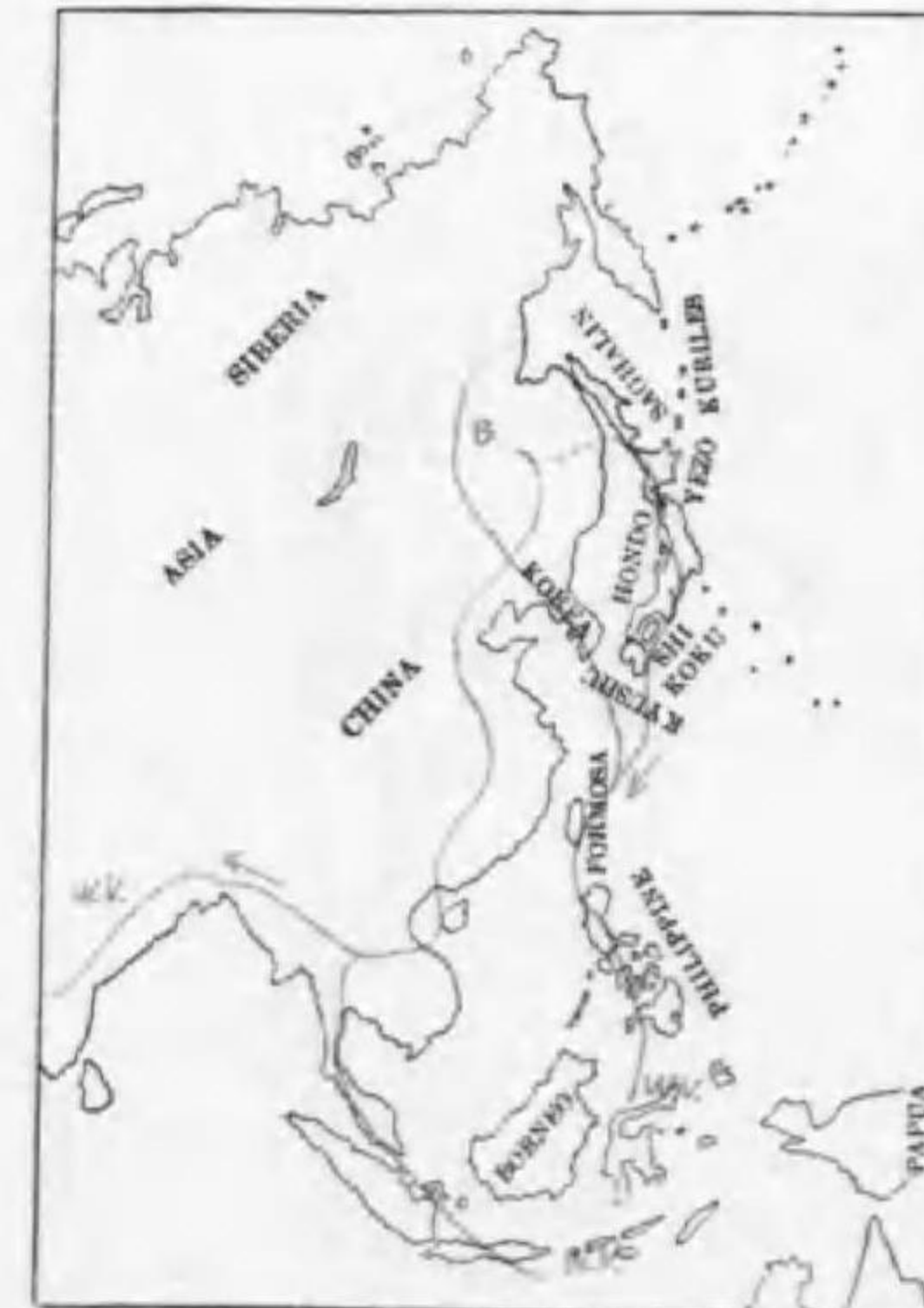
228. Capella stenura (Bonaparte) ハリヲシギ