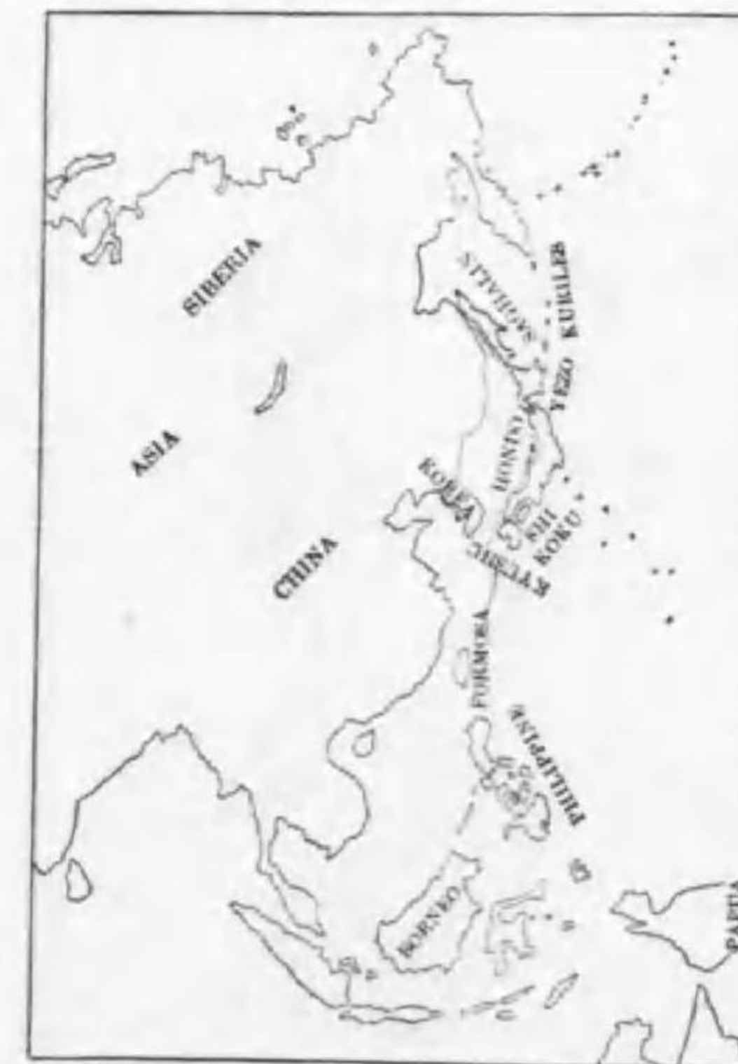
36. Calandrella brachydactyla dukhunensis (Sykes) カラフトヒバリ