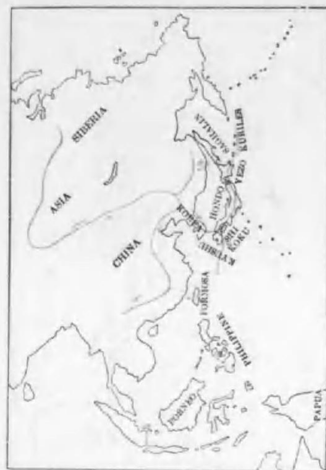
105. Upupa epops saturata Lönnerberg (Bt.) ヤツガツラ