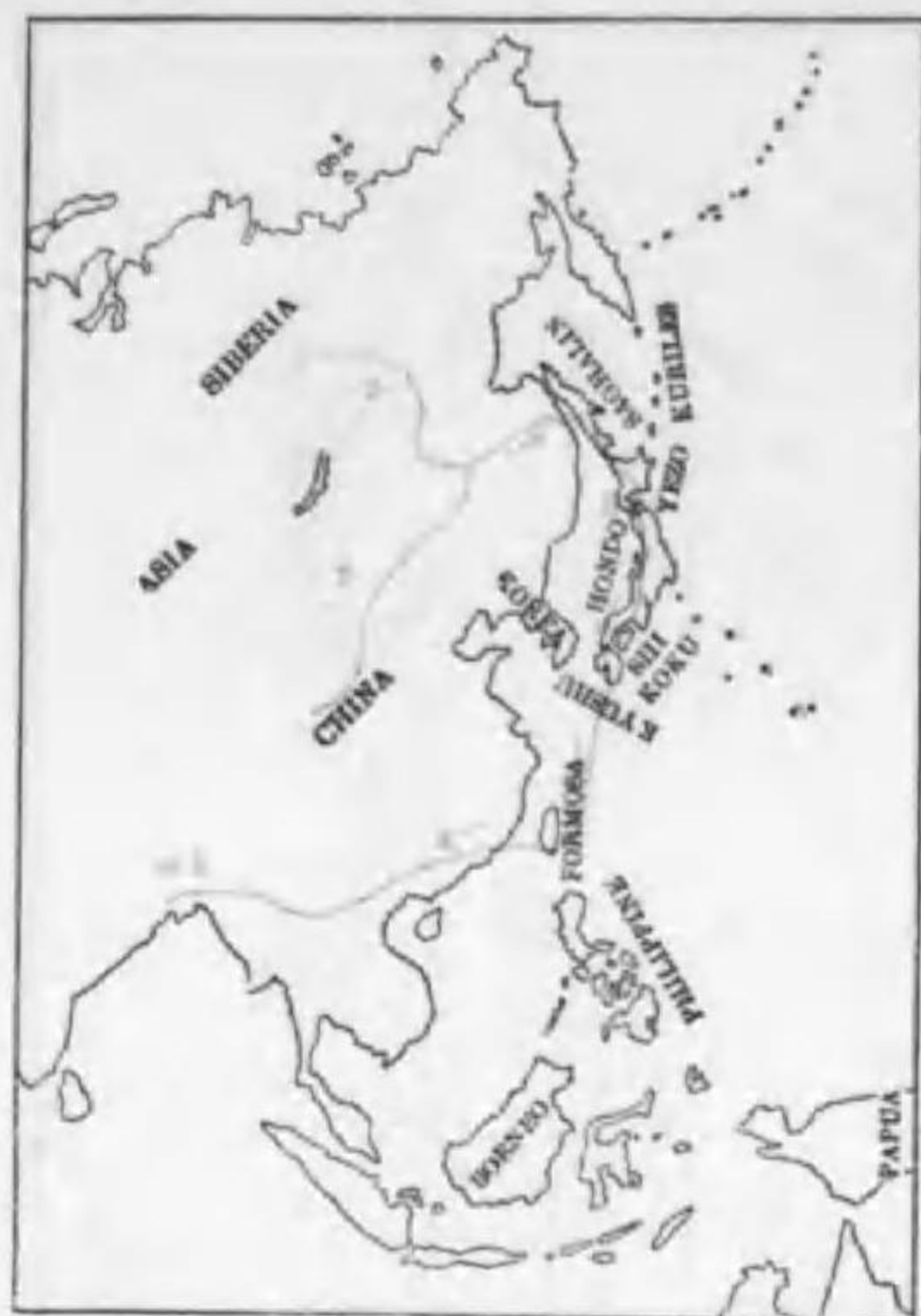
173. Aiz galericulata (Linnaeus) ラシドリ