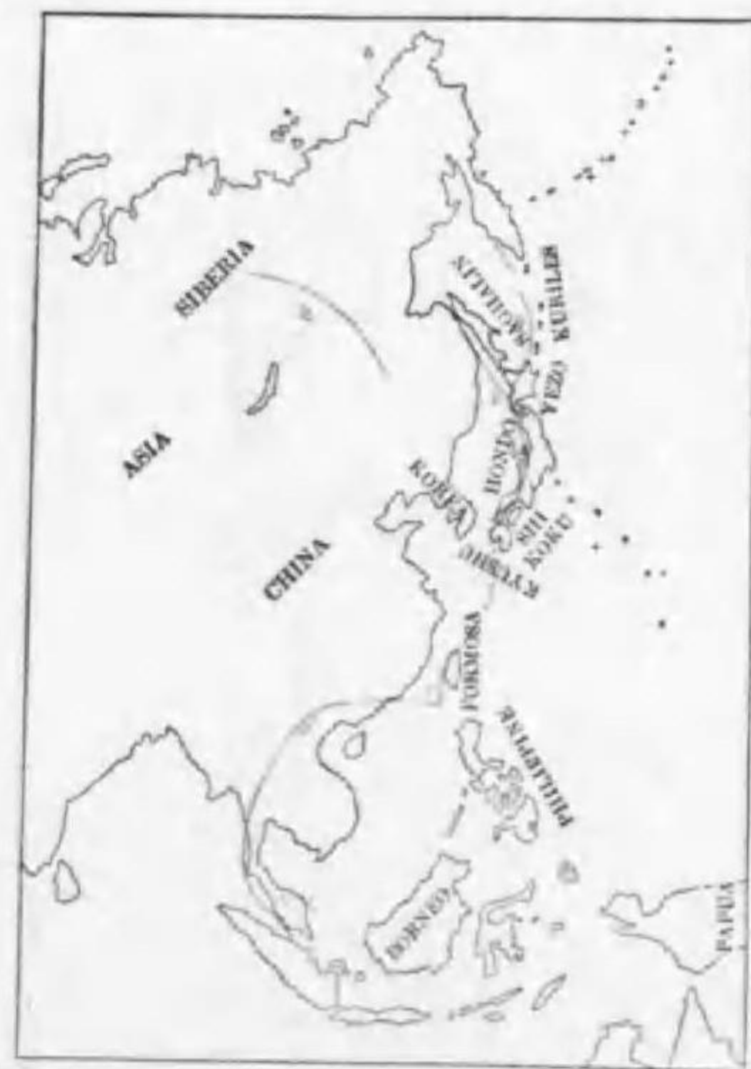
27. Emberiza aureola aureola Pallas (B) シマアラジ