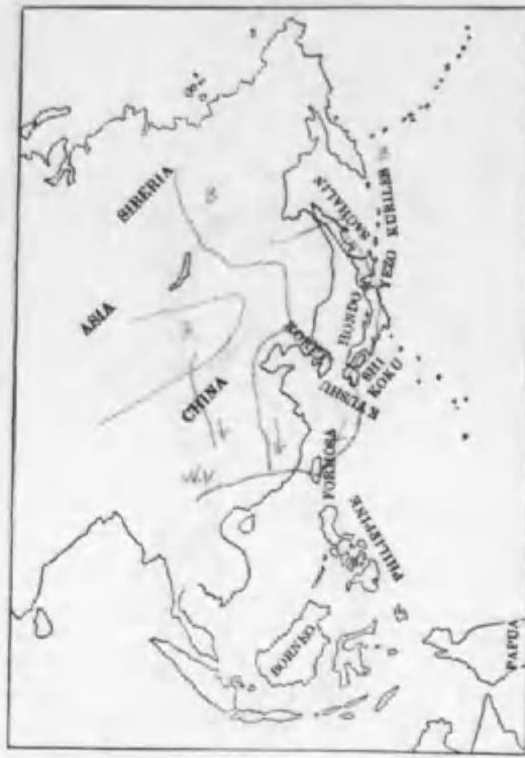
238. Haematopus ostralegus osculans Swinhoe ミヤコドリ