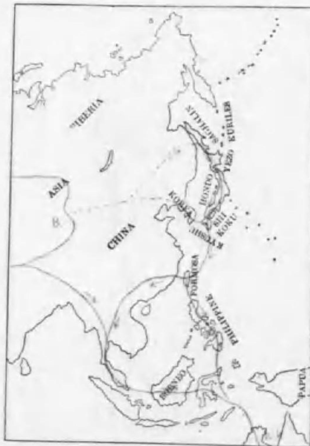
200. Tringa glareola Linnaeus タカブシギ