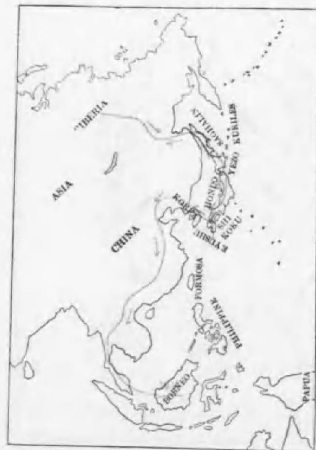
96. Larvivora cyane (Pallas) コルリ