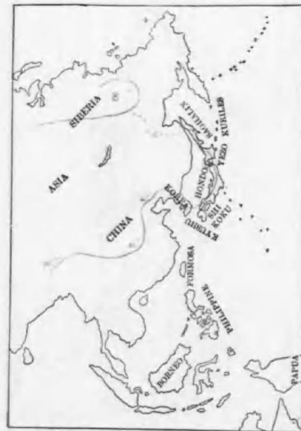
183. Mergellus albellus (Linnaeus) ミコアイサ