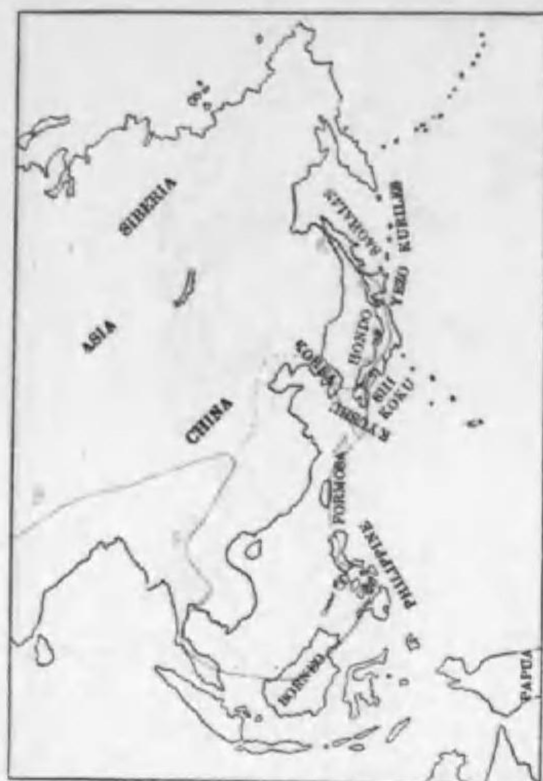
149. Egretta intermedia intermedia (Wagler) (Rv.) チウサギ