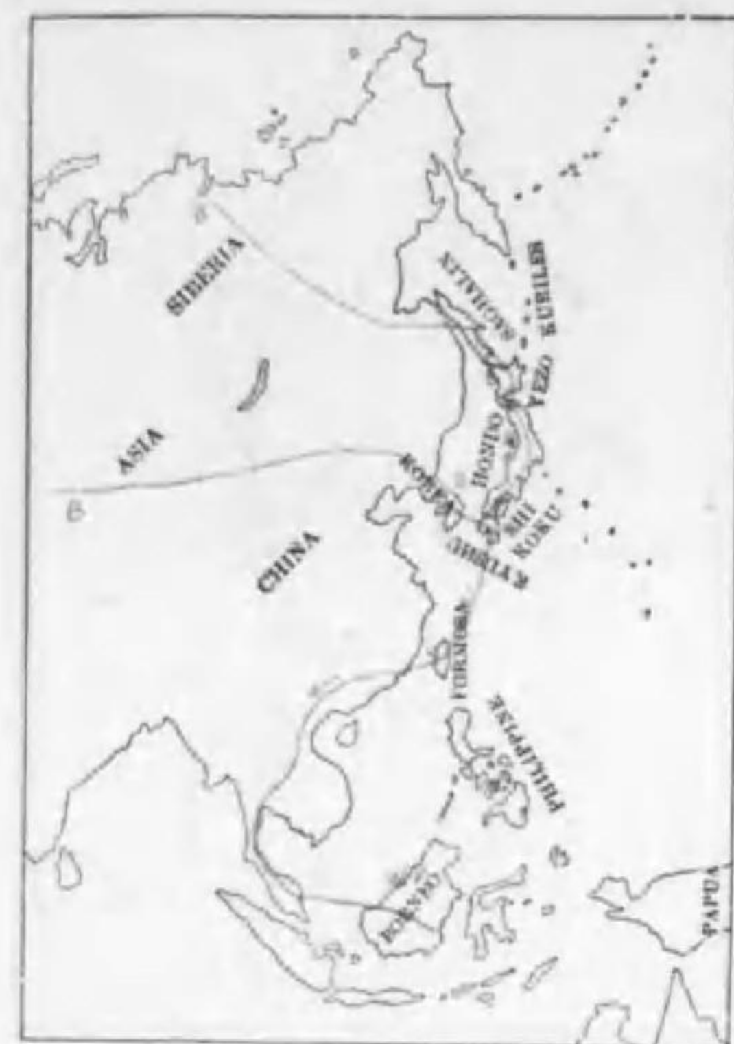
73. Acanthopneuste borealis xanthodryas (Swinhoe) (B) メボツ