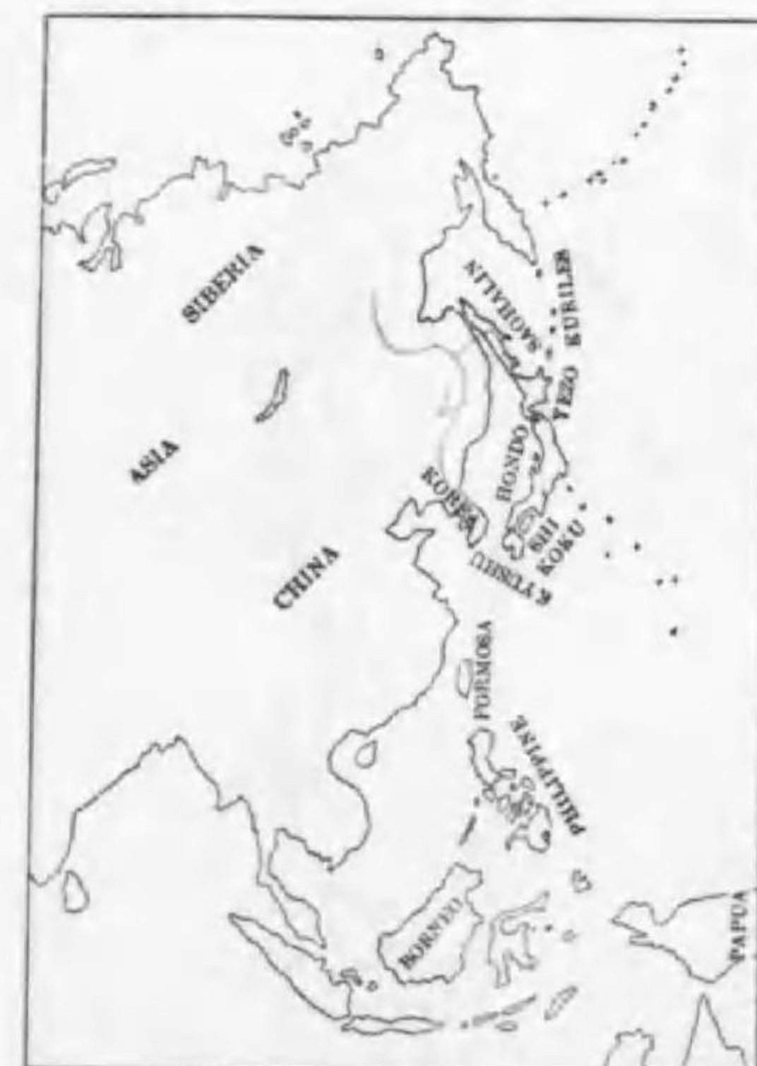
84. Turdus sibiricus sibiricus Pallas シベリアマミジロ