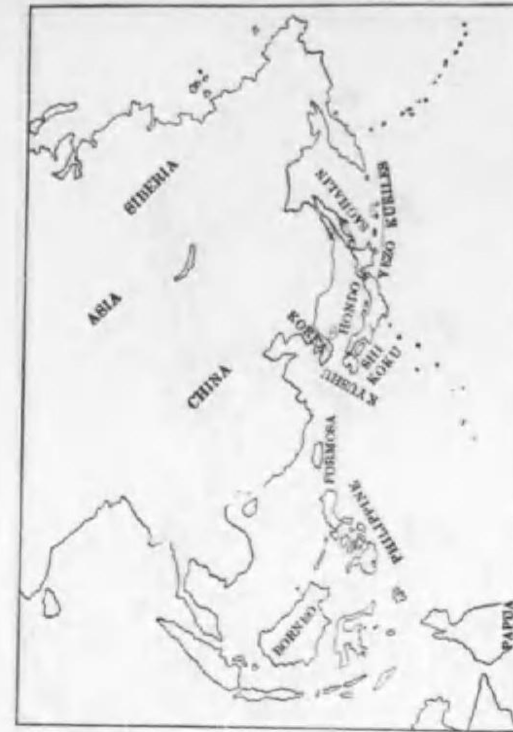
66. Hemichlidon sibirica incerta La. Touche (B) ウスサメビタキ