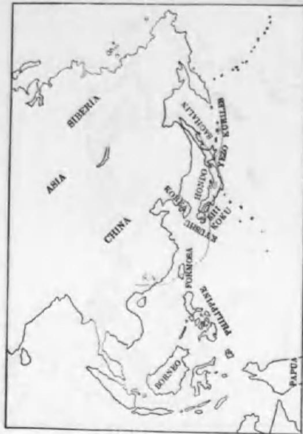
29. Emberiza spodocephala personata Temminck (B) アラジ