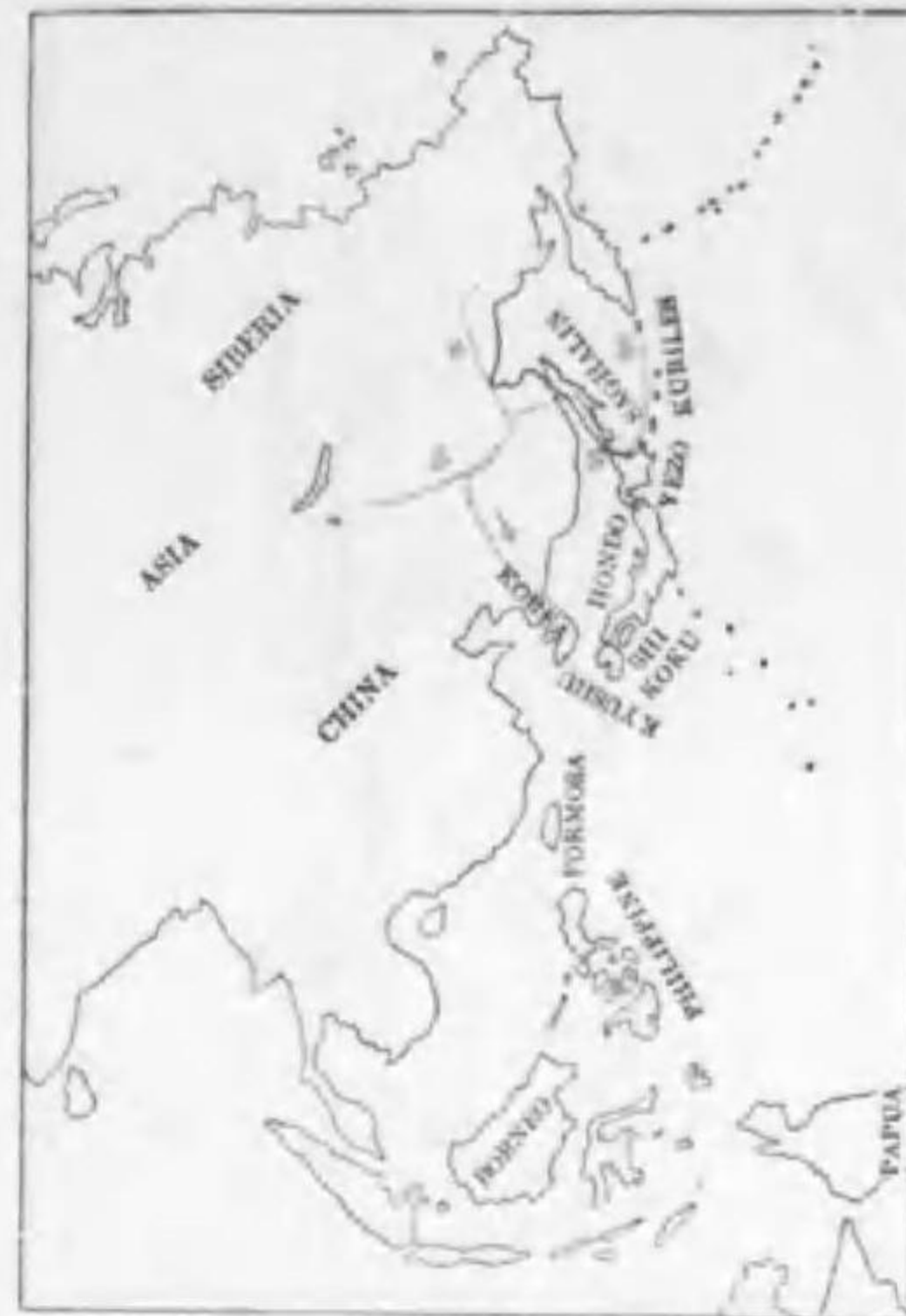
49. Certhia familiaris familiaris Linnaeus (B) キタキバシリ