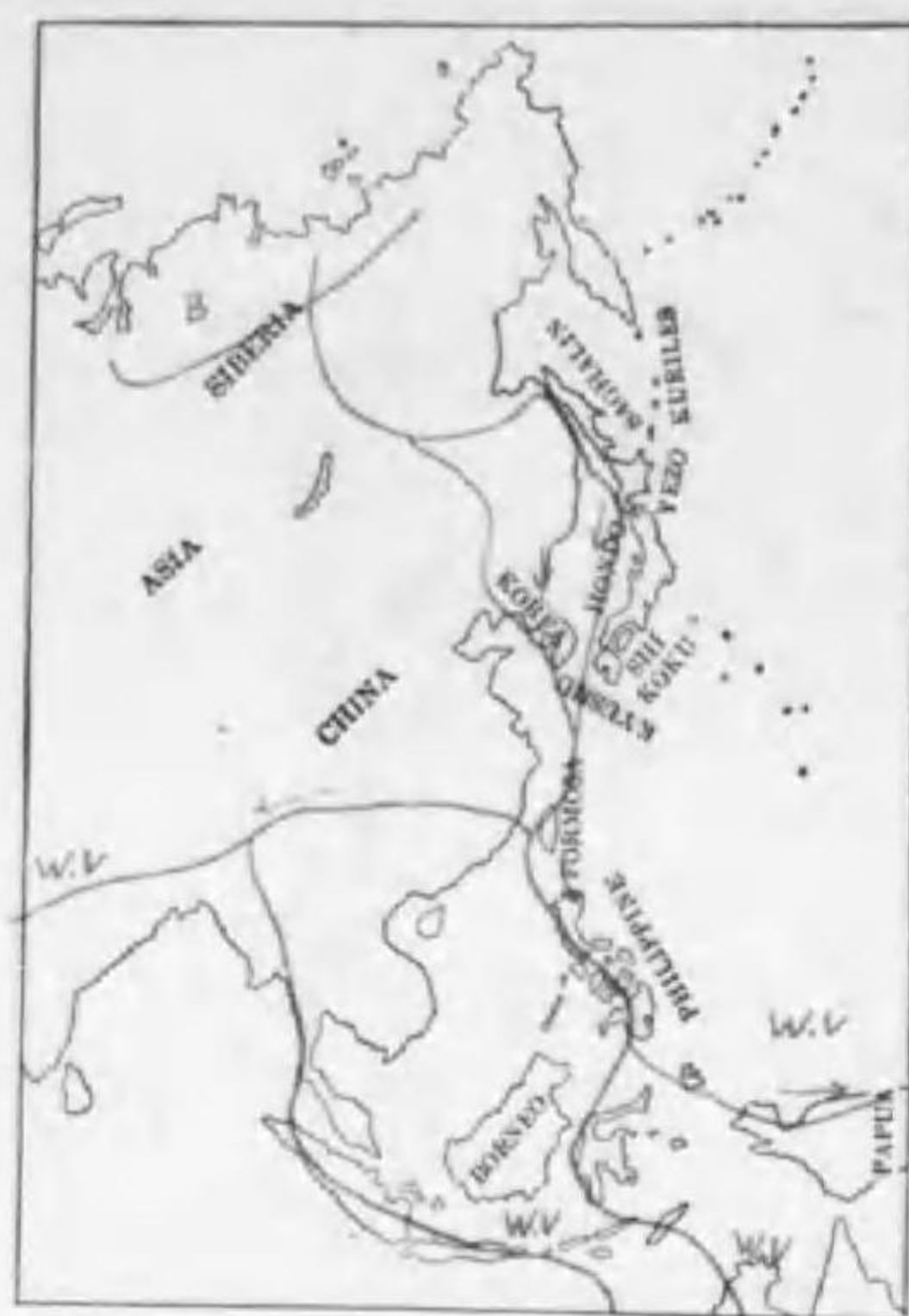
230. Pluvialis apricarius fulvus (Gmelin) ムナグロ