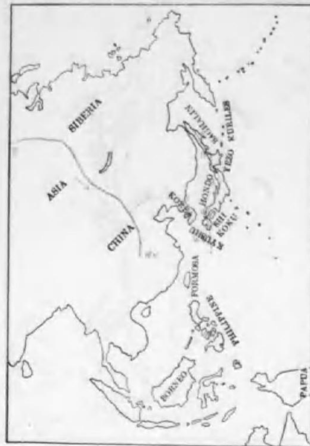
61. Lamius borealis Temminck & Schlegel モズ