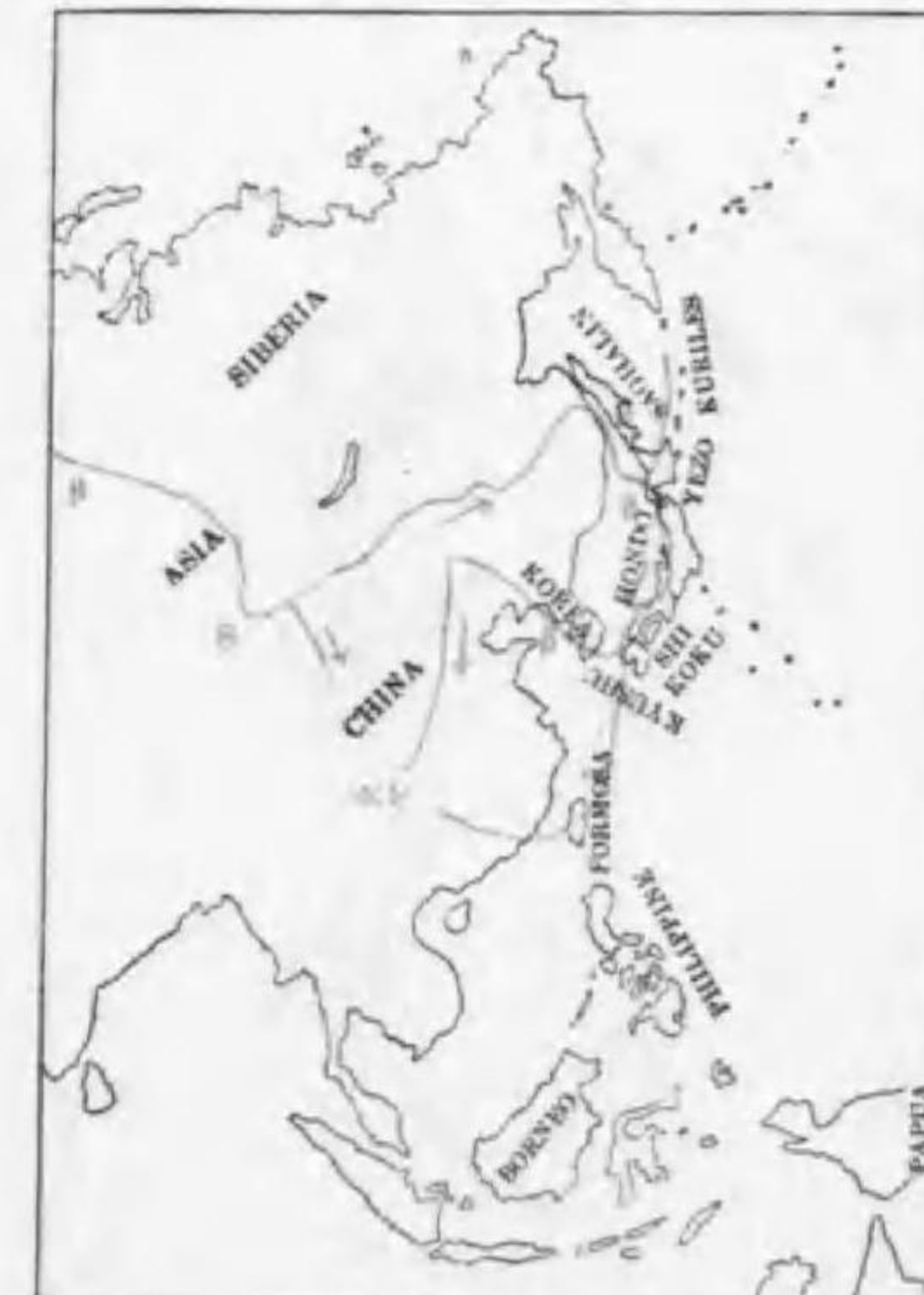
164. Anas poecilorhynchos zonorhynchos Swinhoe (B) カルガモ