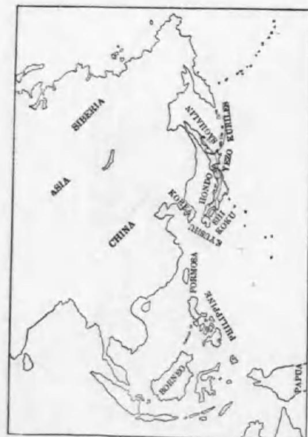
71. Acanthopneuste borealis examinandus (Stresemann) オホムシクヒ