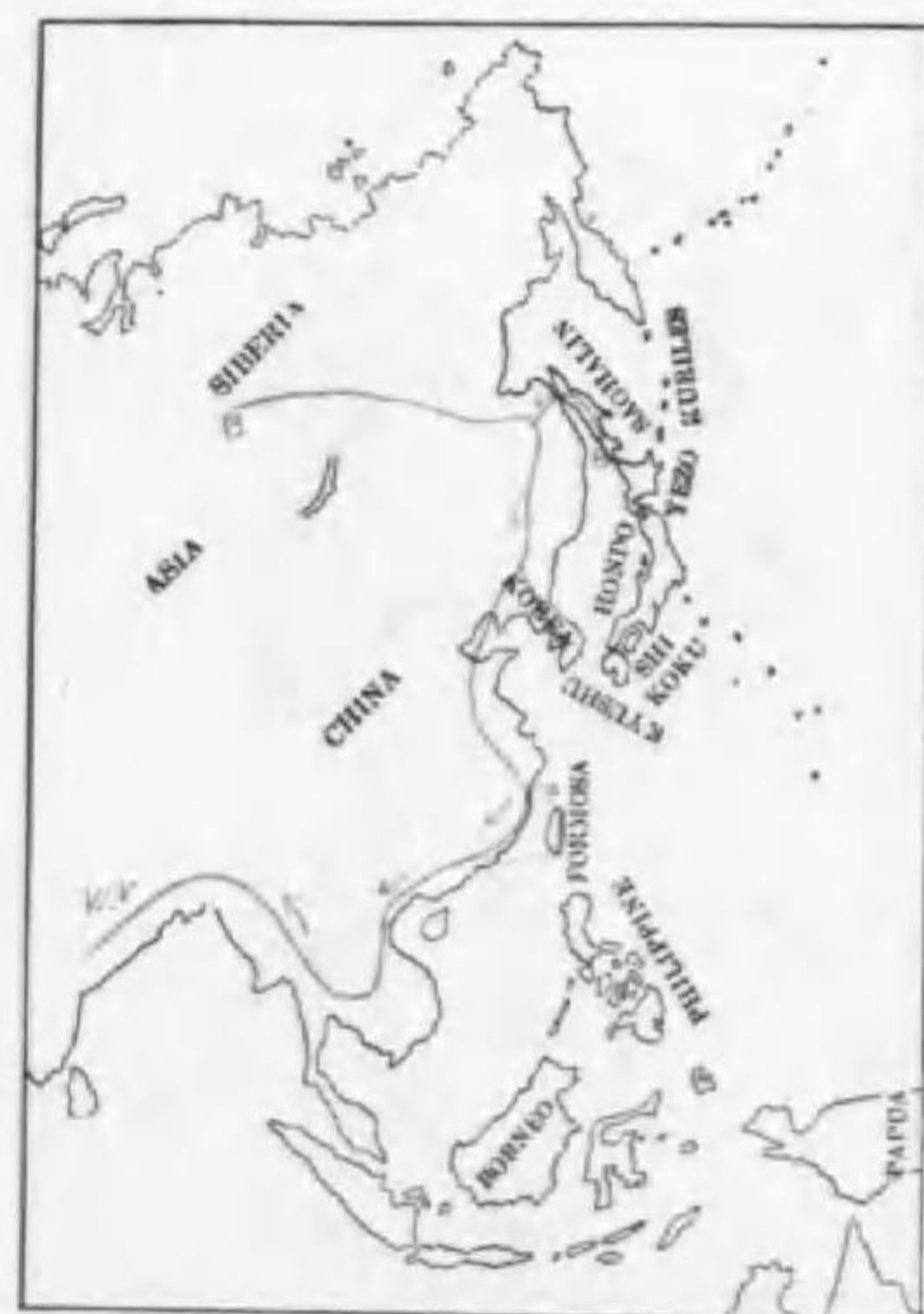
75. Phylloscopus fuscatus fuscatus (Blyth) ムヂセツカ (B)