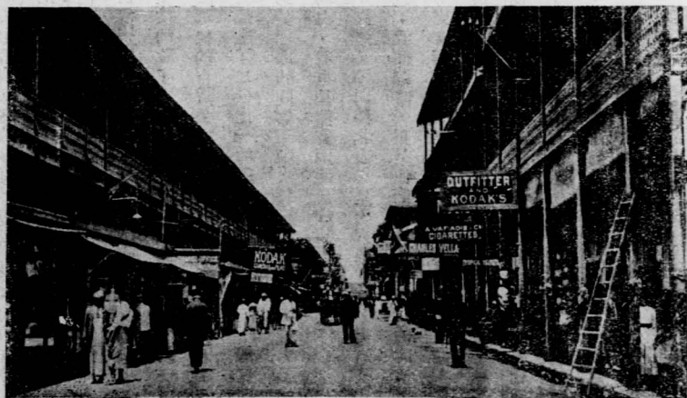
浦 賽 通 衢

隨意走到一個轉角的地方，一引規模不很大的鋪子，掛着一塊牌，很大的寫着黑底白字—— Exotiques ；我便停止