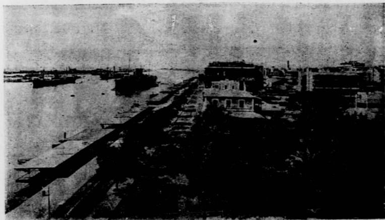
浦 賽 烏 瞰

浦賽全部的面積並不很大，大概祇要十分多鐘，就可走遍全市。我們在中來往，彷彿覺得有一種濃厚的英國氣味。各店鋪的招牌，也都是用的英文。同行的一個英國人願盼自如的說：『這是我們的殖民地啊！』當然英國人素有『 英旗無落日 』的豪語，他們的勢力，已遍布而支配了全