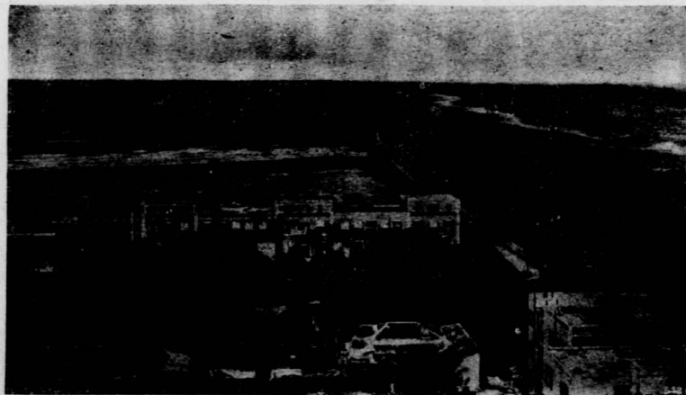
浦 賽 港 口

第五天的清早，我們的船已抵浦賽港口。這是我們航線上第一個埠頭；自馬賽啓碇以後，我們已四天四夜在海茫茫中飄泊，一旦看到了畔岸；好似一個萬里的遊子，投入了慈母的懷裏一樣安慰。這一天，我醒得特別早，起得也特別早；不但是我，客艙裏活動的聲音，也似乎比平