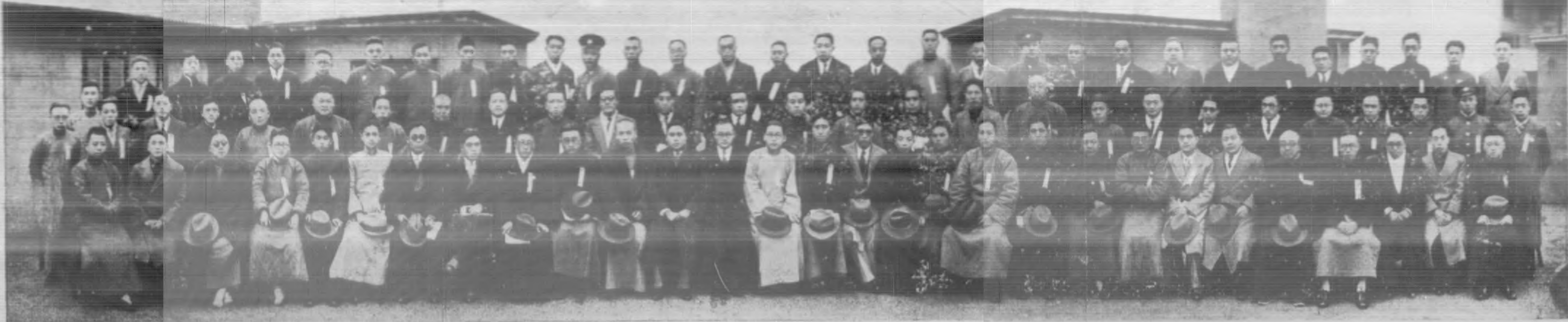
▲中華民國全國郵務總工會第三次全體大會代表全體攝影（廿五年三月十五日上海）