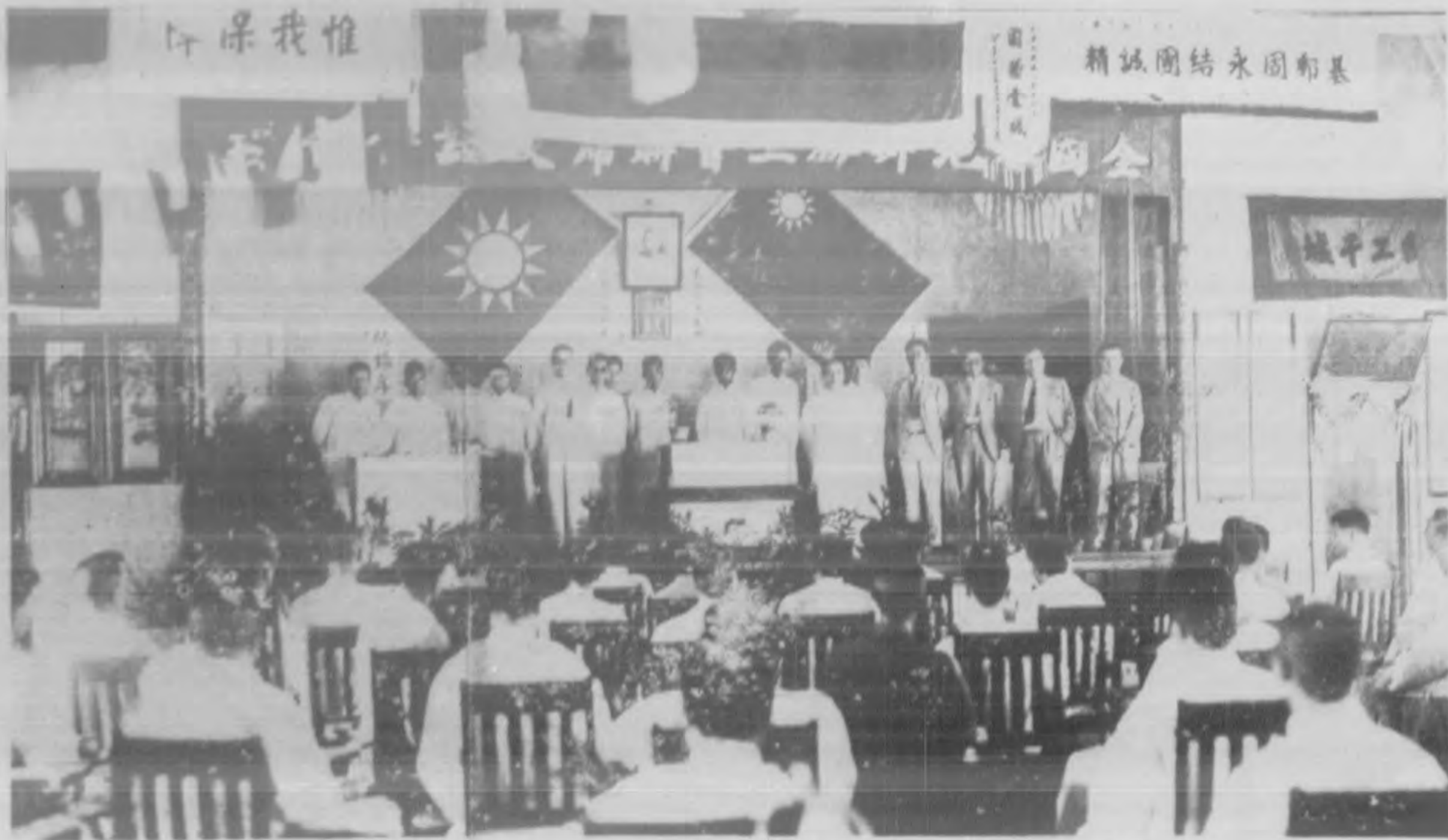
▲全國各地郵務工會聯席談話會會場攝影（廿一年七月廿五日南京）