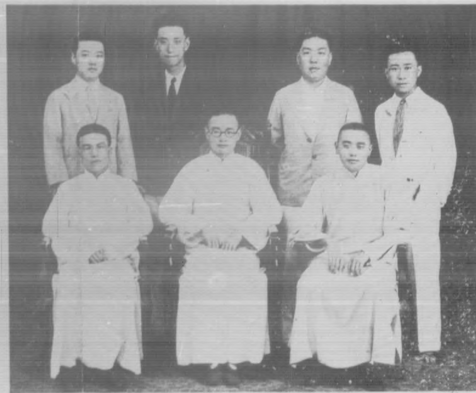
▲全國郵務總工會籌備委員會全體常務委員攝影（廿一年七月廿五日南京）