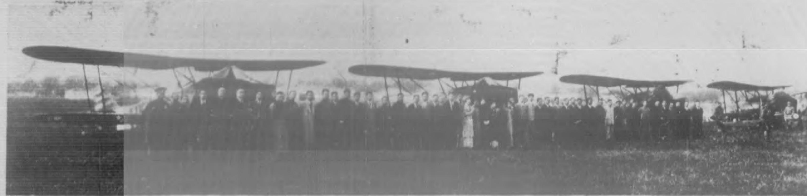
▲全國郵政員工飛航機一三二四號在京命名典禮攝影（日四月四年四廿國民）