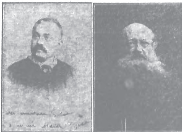
克魯泡特金 格拉佛