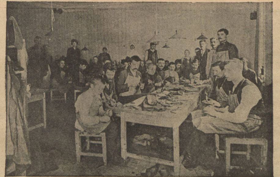
Сапожная мастерская бѣженцевъ.