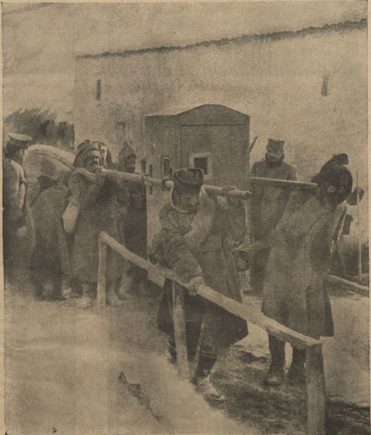
Отъѣздъ генерала Путника изъ Сербіи. Въ этихъ носилкахъ больной главнокомандующій сербской арміей воевода Путникъ совершилъ десятидневное путешествие черезъ Албанію въ Скутари.