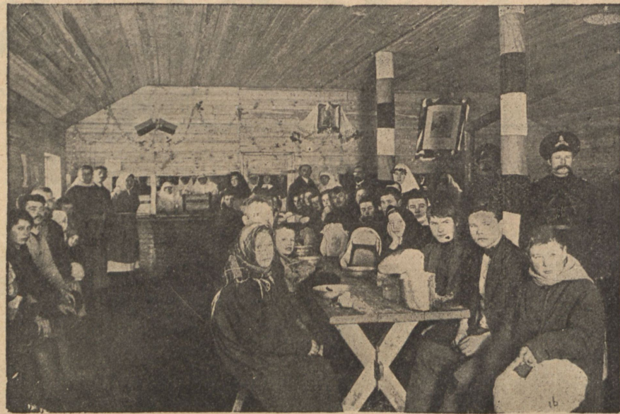
Столовая на ст. Кіевъ-товарный.