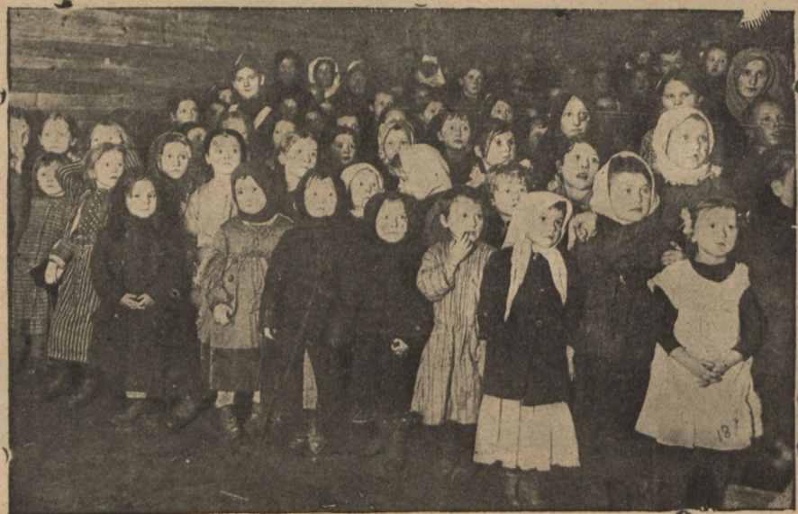
Дѣти - бѣженцы на елкѣ.