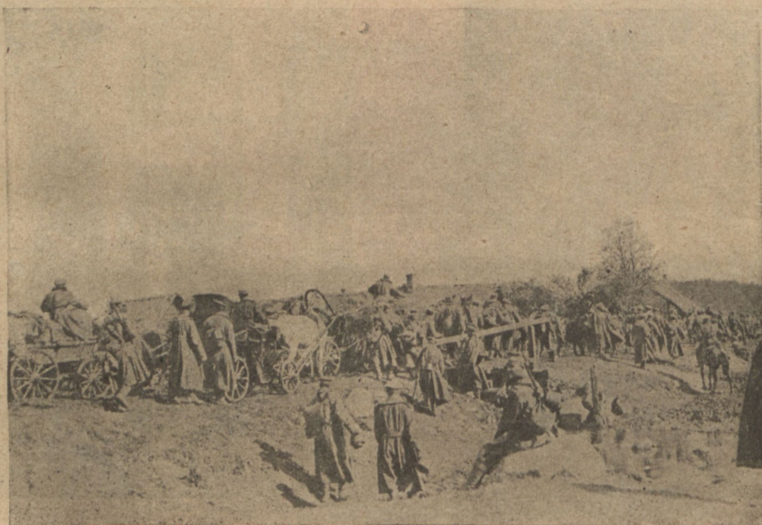
Переходъ войскъ на новую позицію.

10 коп. выр. выкройка, зак. прин. изъ лучш. журн. Курсъ кроя 5 р. Дмитріев. 12, Гал. пл. 6485