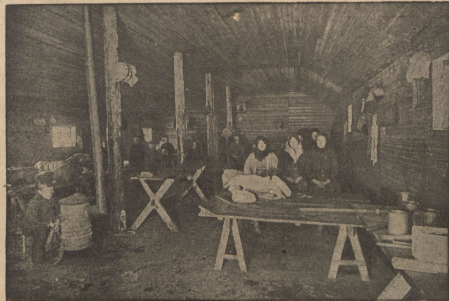
Убѣжище на ст. Кіевъ - товарный.