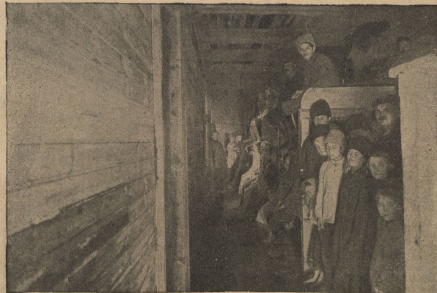
Убѣжище въ Гавани.