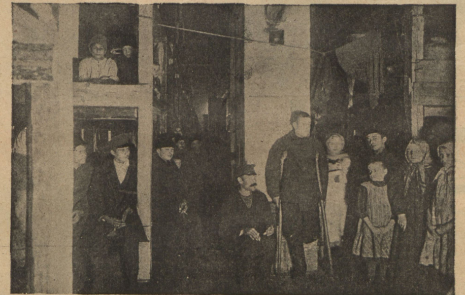
Убѣжище въ Гавани.