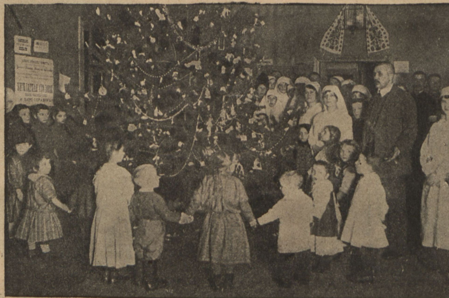
Елка для дѣтей - бѣженцевъ на вокзалѣ.