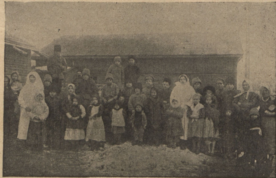
Дѣти - бѣженцы въ Гавани.