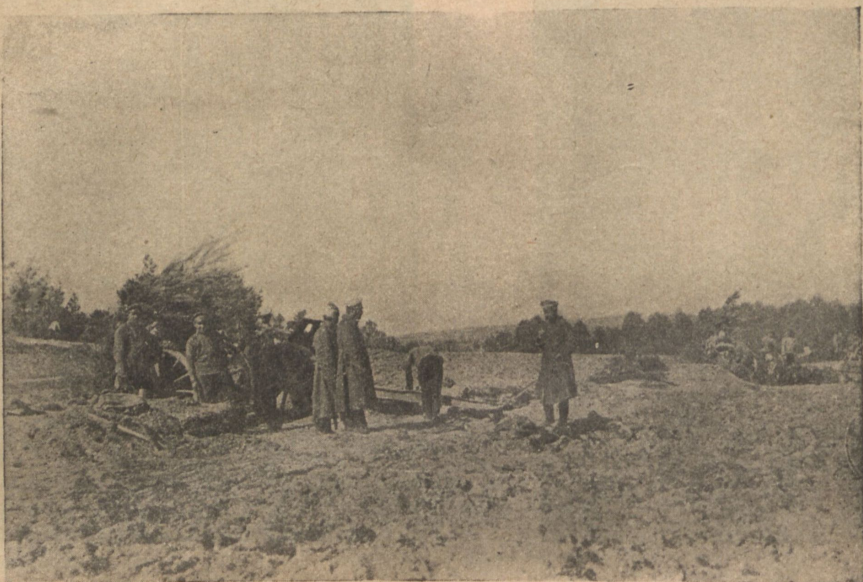
Выборъ позиціи для артиллеріи.