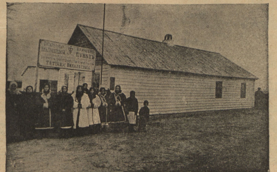
Питательный пунктъ для бѣженцевъ на Дитпрѣ.