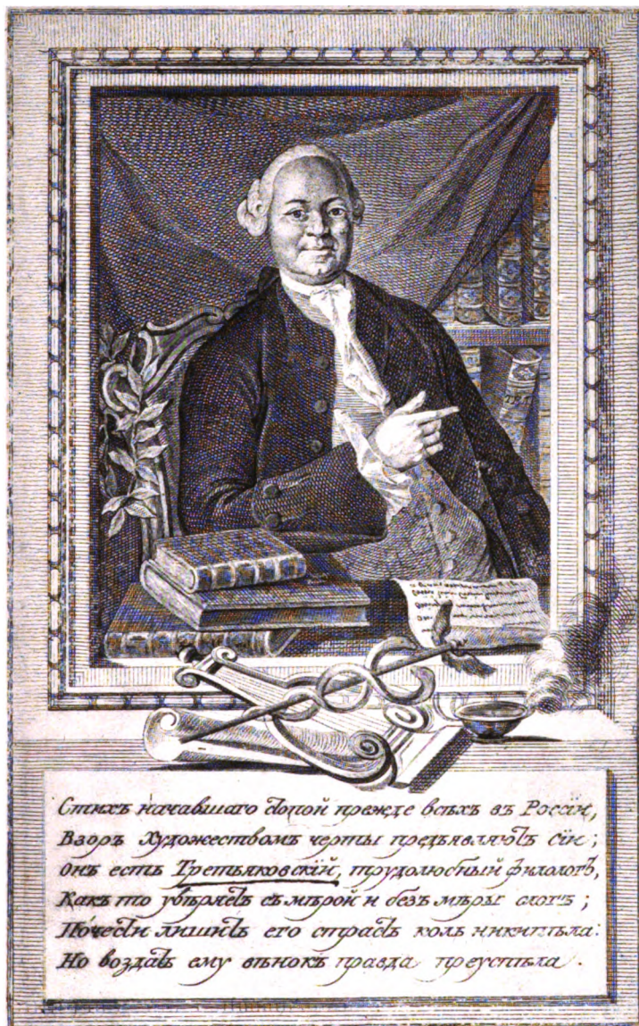
Фототипія Шереръ. Наболевъ и К о въ Москвѣ.