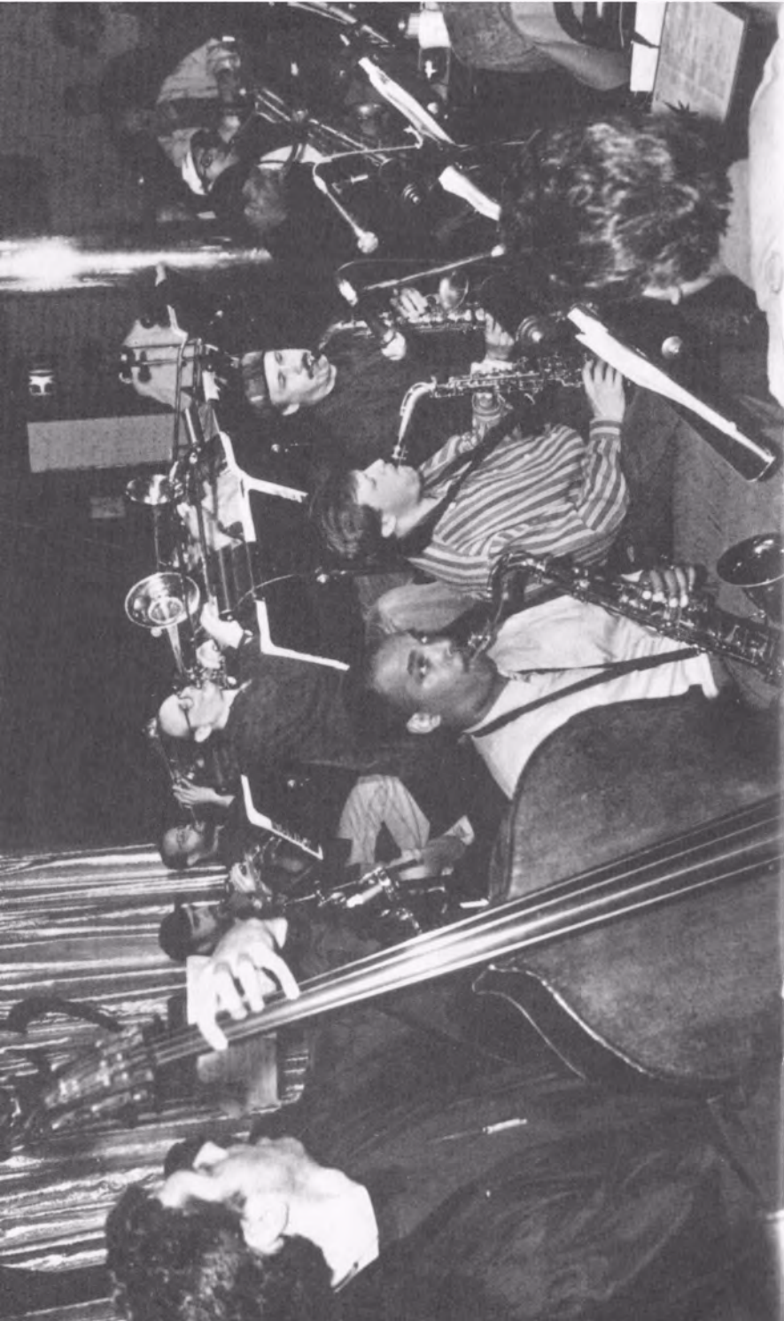
Mingus Big Band