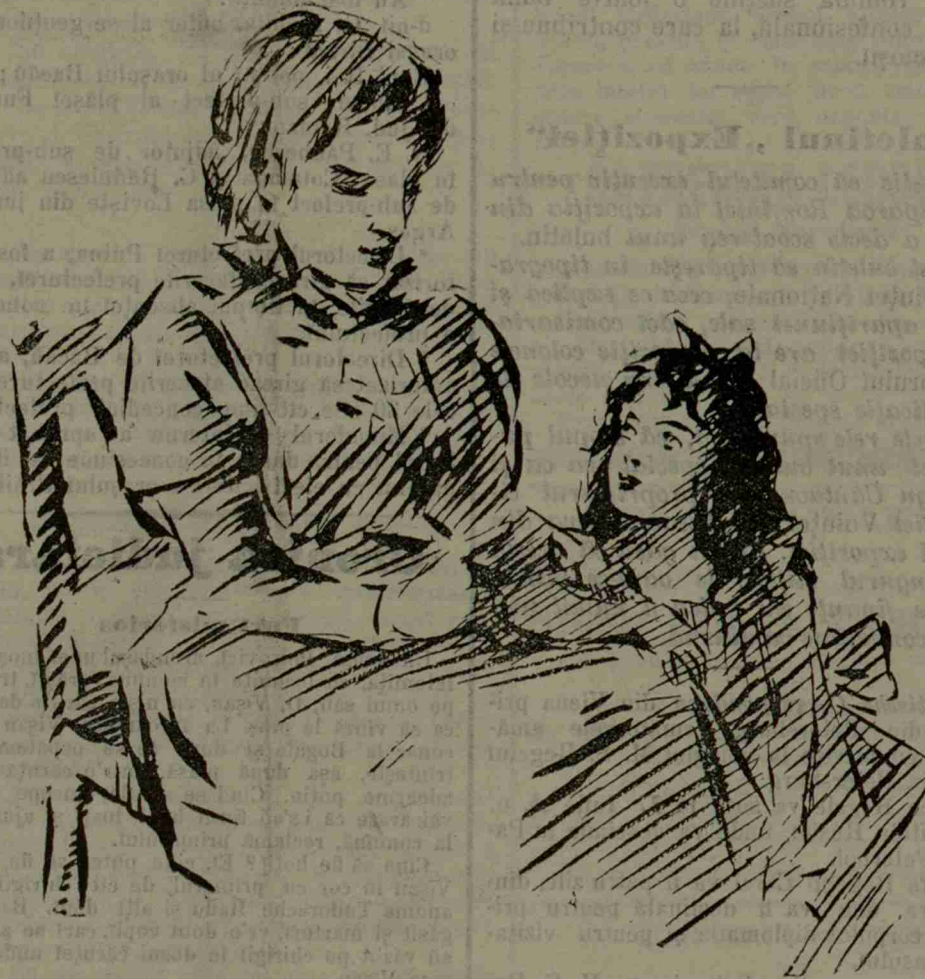
— Mamă, spune-mi ce este Sturduza? — Nu măi spune... că-i rușine!...