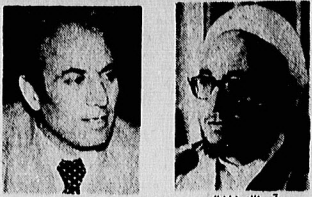
آیت‌الله خلغالی، آیت‌الله لاهوتی