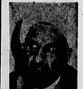
آیت‌الله قلموسی از مردم خواست تا ابلاغ اوامر امام به اوامر چه نکنند

مردم خواست تا ابلاغ اوامر امام به اوامر چه نکنند