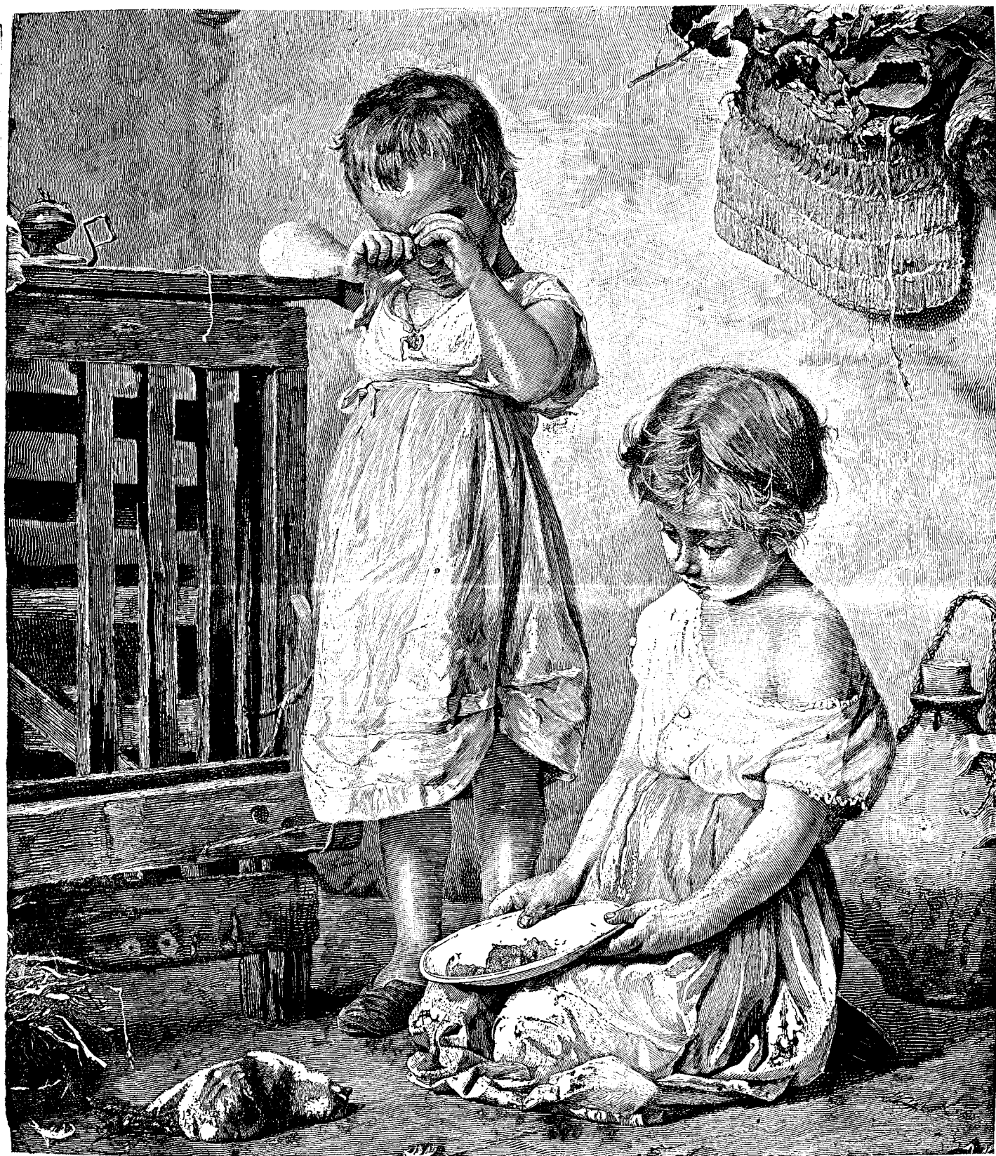
O jale adâncă.