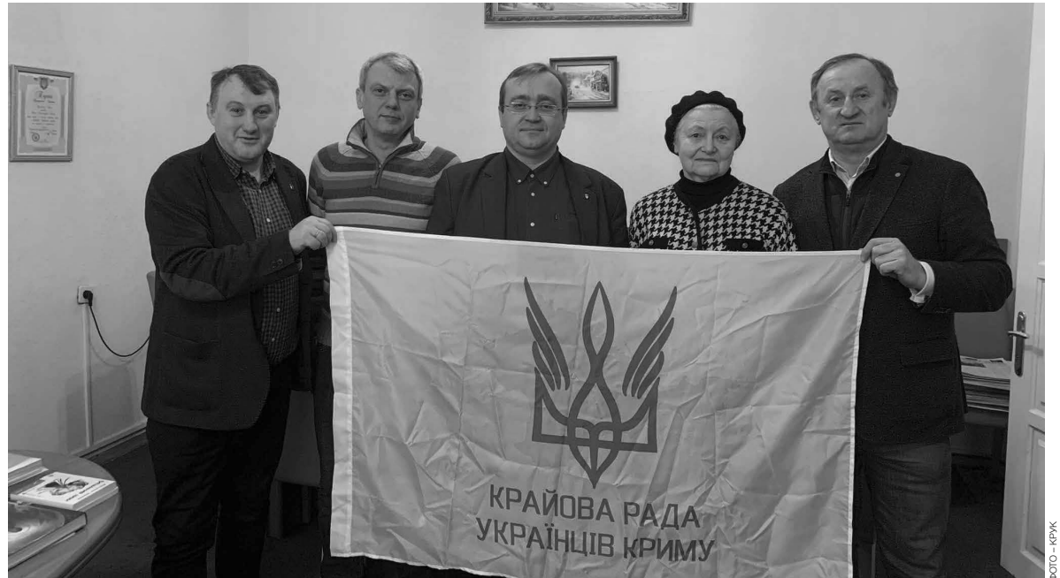
Представники УВКР та КРУК після зустрічі з питань прав та свобод українців Криму. 10 грудня 2021 року

Ми, представники УВКР і КРУК, констатуємо, що в результаті бруталного порушення міжнародного права та зобов'язань за двосторонніми українсько-російськими угодами Росія окупувала частину території України і створила загрозу знищення української ідентичності та асиміляції громади українців Криму. Окупаційна влада знищила в АР Крим і м. Севастополі українські політичні та громадські організації, українськомовні систему освіти та засоби масової інформації, переслідує лідерів та активістів української громади, конфесії, парафіянами яких є етнічні українці, здійснює масований інформаційно-психологічний українофобський тиск на кримчан, незаконно ізолювала їх від інформаційного та освітнього простору України, протиправно переміщає до оку-