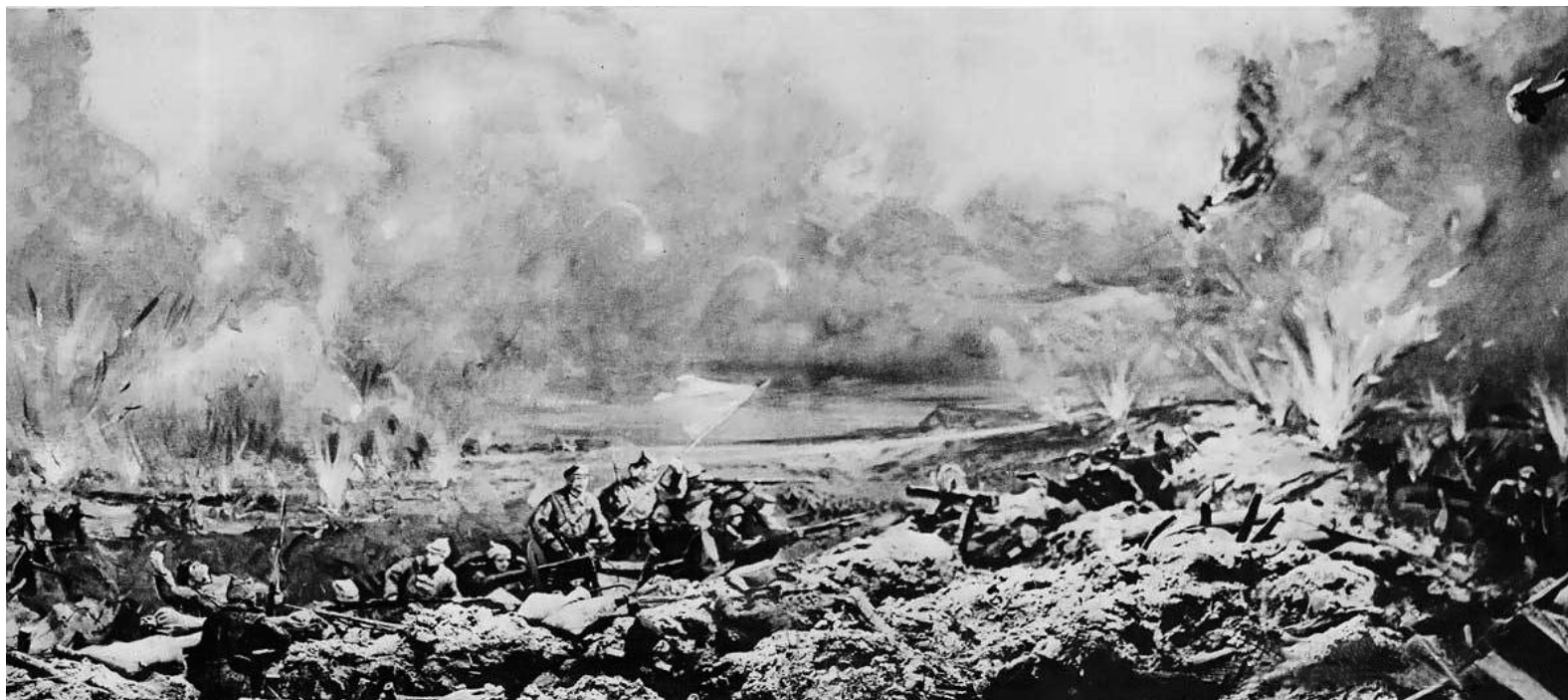
Штурм Перекопського (Турецького) валу