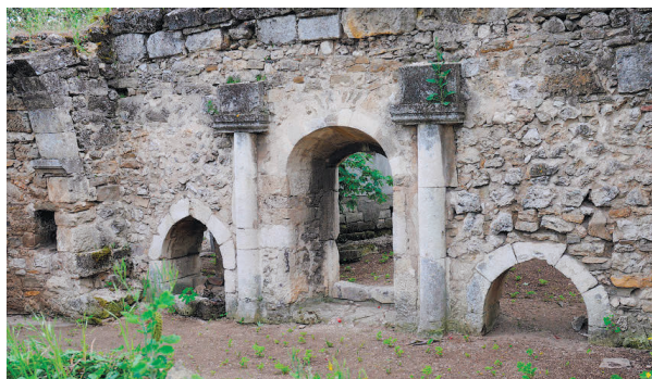
Церква Іоанна Хрестителя

Первинне ядро міста, що сягає античних часів, перекрито середньовічними археологічними нашаруваннями. До наших часів у Старому Криму збереглися пам'ятки старовинної архітектури або їхні залишки: мечеть хана Узбека, руїни медресе, мечетей Бейбарса, Куршум-Джами та Мюск-Джами, караїмської кенаси, караван-сарая (базару), храму Івана Хрестителя.