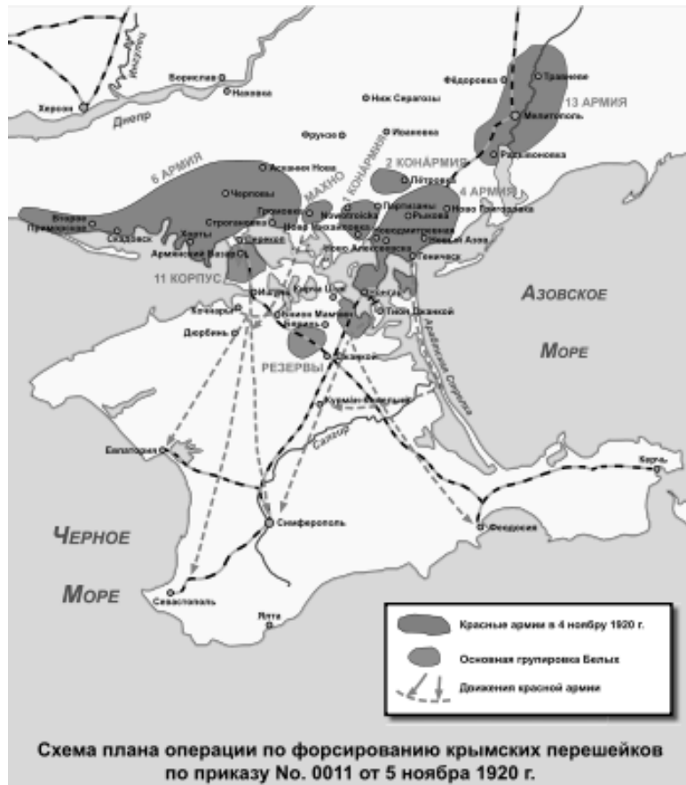
Схема наступу більшовиків на Крим, листопад 1920 р.