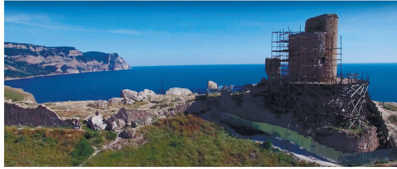
Фортеця Чембало. Сучасний стан