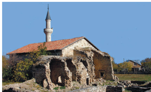
Мечеть хана Узбека