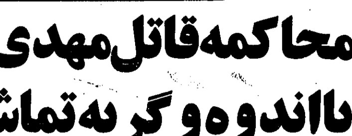
مهدی بورنیک، پسر بچه‌ای که بقتل رسید