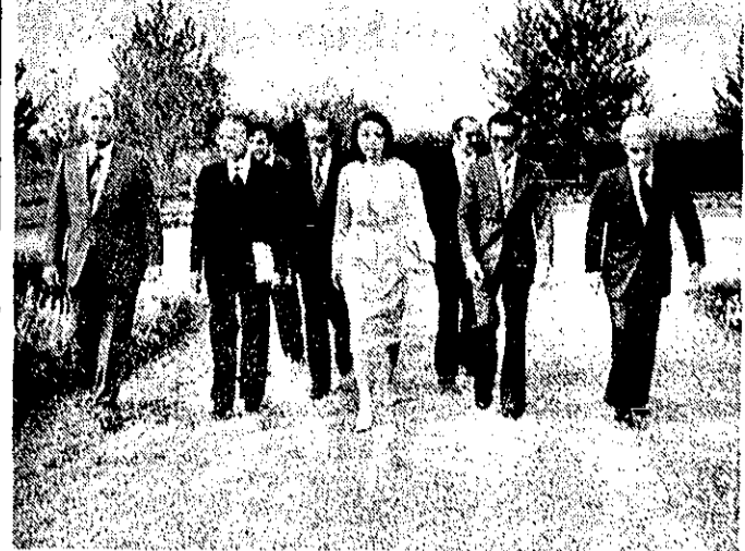
تشکیل جلسه هیأت امنای مؤسسه گیاه‌شناسی روز گذشته جلسه هیأت امنای مؤسسه گیاه‌شناسی آریابهر در حضور والاحضرت شاهدخت فاطمه پهلوی تشکیل شد والاحضرت پس از پایان جلسه، از قسمت‌های مختلف باغ گیاه‌شناسی آریابهر بازدید کردند.

دوشنبه دادگاه خوزستان تعطیل شد دوشنبه ۲۶ شنبه دادگاه استان خوزستان، باتوجه به کمی پرونده‌های موجود، به دستور وزیر دادگستری منحل شد و یکشنبه دادگاه جنایی در حوزه قضایی این استان افزایش یافت. وزیر دادگستری در سفر باهواز گفت: برای ایجاد دانشکده حقوق در اهواز، با رئیس دانشگاه چندی شاپور مذاکره‌ای بعمل آمد و این دانشگاه آسادی خود را برای تأسیس دانشکده مورد نظر اعلام کرد. در مورد همکاری سازمان زنان با دادگستری، موافقت شد که مدد کاران صلاحیتدار، در مورد حل اختلاف‌های قابل گذشت همکاری لازم را بعمل آورند.