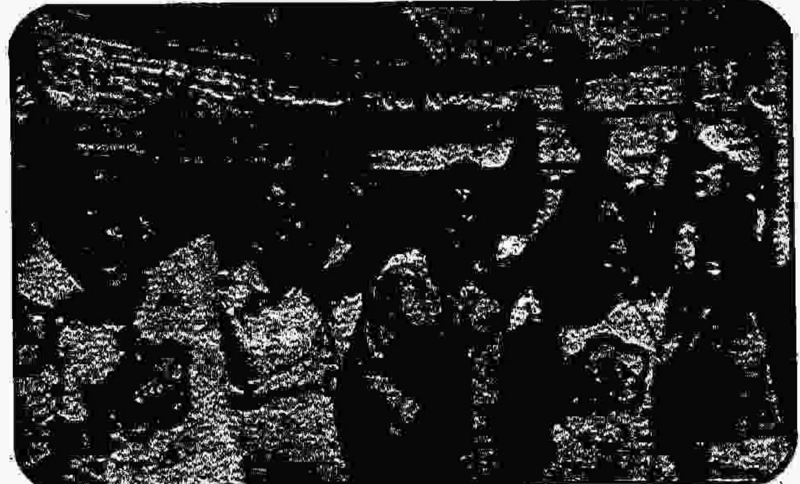
نمایندگان جوانان و دانشجویان در هاوانا، پایتخت کوبای سوسیالیستی (تابستان ۱۳۵۷)

میکوش باراباش میباید. گذاری فدراسیون جهانی جوانان دمکرات در کنفرانس جهانی جوانان در لندن در سال ۱۹۴۵ (۱۳۲۴) دارای دوانگیزه بود: نخست این اندیشه که، نسل جوان، پس از جنگ جهانی دوم، همه توان خود را در راه جلوگیری از آتش افروزی جدید در سطح جهانی بکار اندازد، و دوم آنکه بنیاد برای دفاع از منافع جوانان پدید آید.