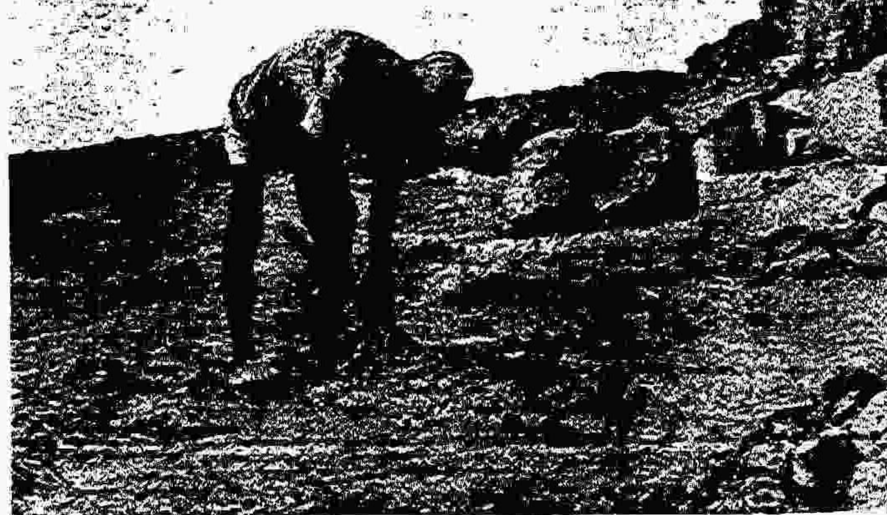
پرهش و استوار چون سنگ: «اگر يك روز کار نکنیم، هیچ نداریم»

باید زحمتی کار میکنیم و کارمان چه خطرانی تارت. یا ایحال هیچگونه وسایل ایمنی نداریم. هرلحظه ممکن است قسمتی از کوه خراب شود و به کارگران آسیب برساند. تازه پس از اینکه کارمندان سنگبری هم که آمده‌اند، متوجه واسطها اربان می‌خورند.