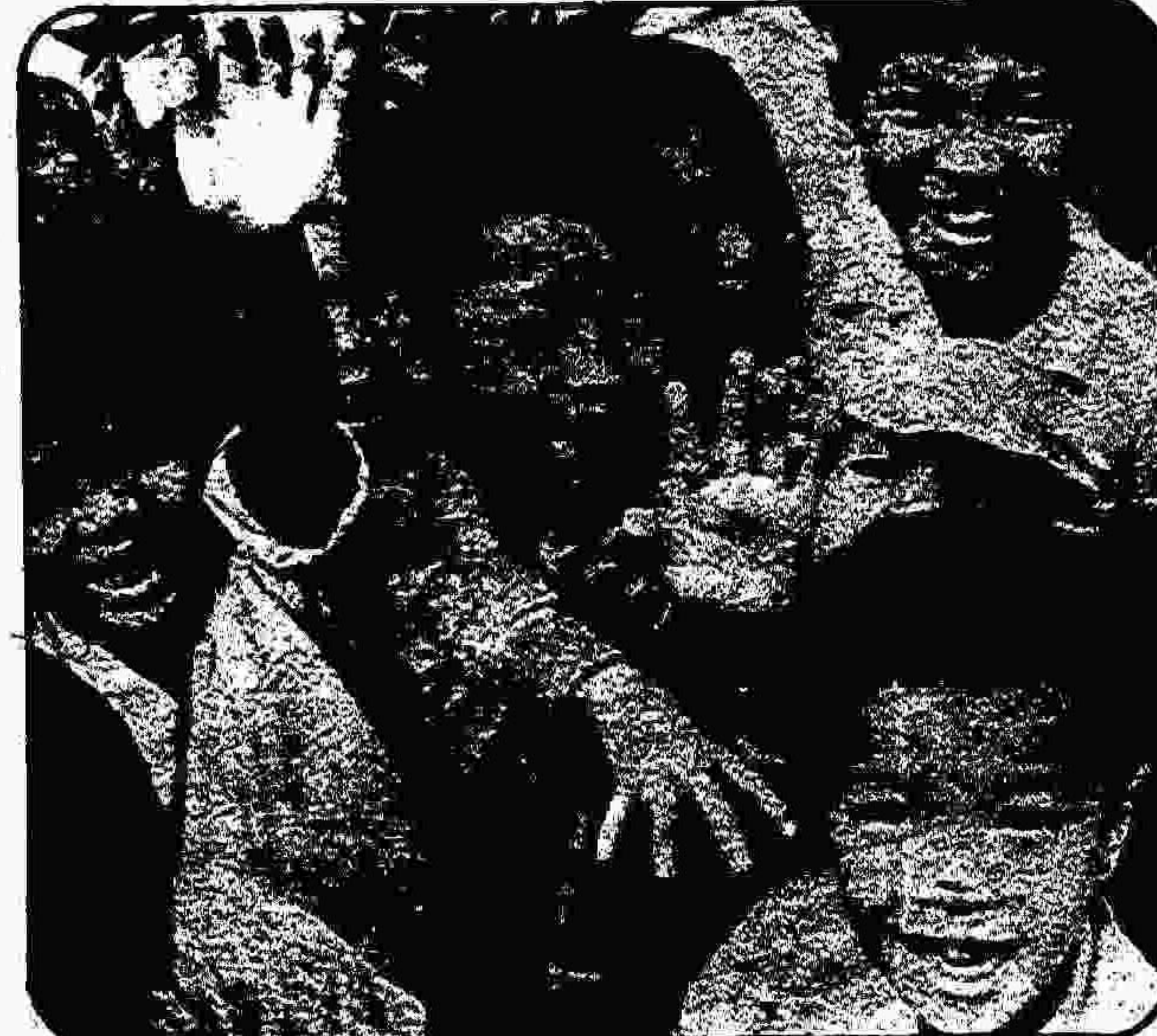
جایگزین آمریکایی برای کودکان ویتنامی جز میم تا پالم چیزی هدیه نیابردند ولسی جمهوری سوسیالیستی ویتنام زندگی شاداب و شگوفانی را برای کودکان ویتنامی تضمین کرده است.

در جمهوری سوسیالیستی ویتنام، تصویب قانون اساسی جدیدی تدارک دیده میشود. پیش نویس این قانون اساسی در بهار سال ۱۳۵۷ برای بحث و بررسی مردم آماده گشت. پس از آنکه در دو سال پیش، هزاران پیشنهاد اطلاعاتی از سوی مردم واصل و منظور گردید کمیته، مرکزی حزب کمونیست ویتنام، آخرین پلنوم خود، به شرح درباره، مقتضای اصلی متن کنونی پرداخت و آنرا تصویب کرد. این پیش - نویس اکنون، برای تصویب