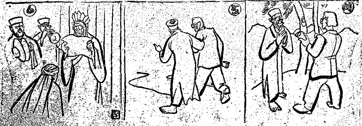
圖四、誦朗詩於山水之間，五、位一朗誦詩人、六、離出畫而集有事而來有向其國與得