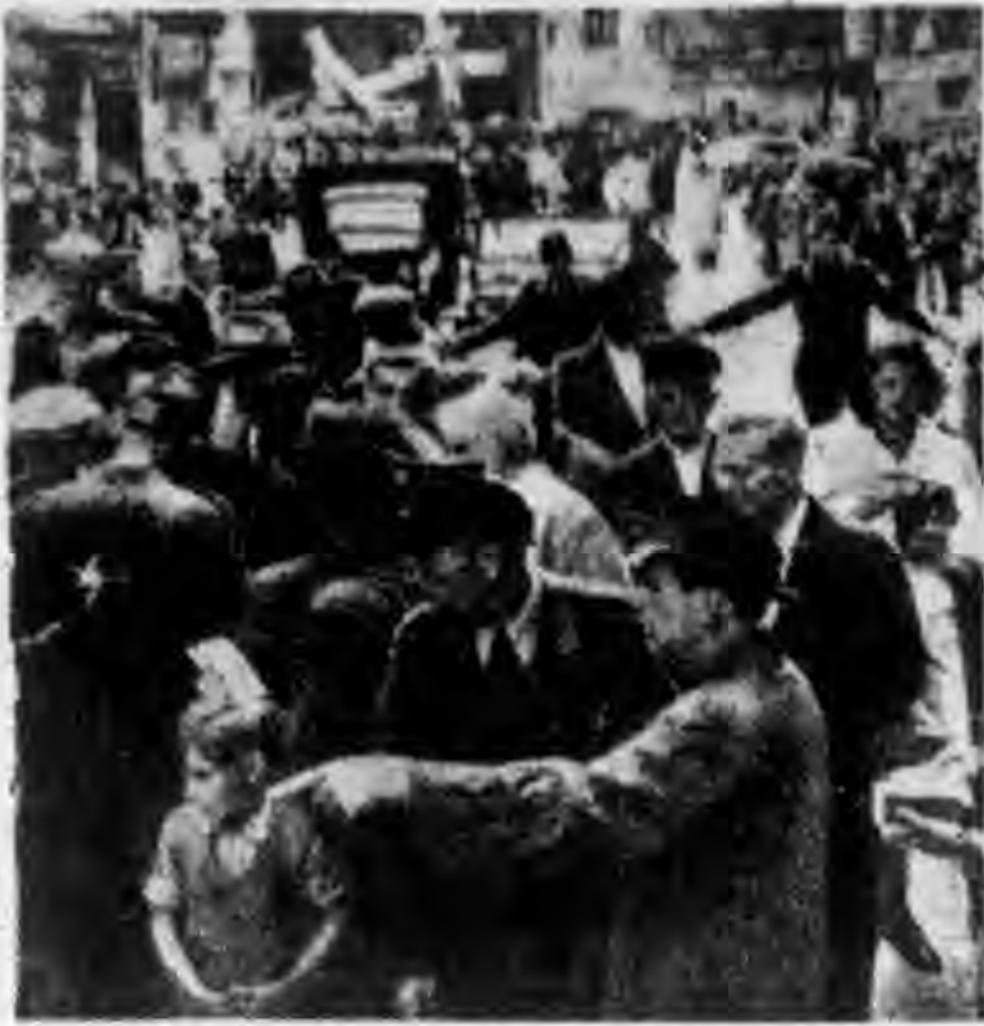
↑ 柏林市內，由德客開始為新發行的西德馬克券，以一與十之比兌換舊馬克券，及以一與二十之比兌換所發行的馬克券，及後，由美軍監督的德國警察，便在馬路邊散放禁果市場。