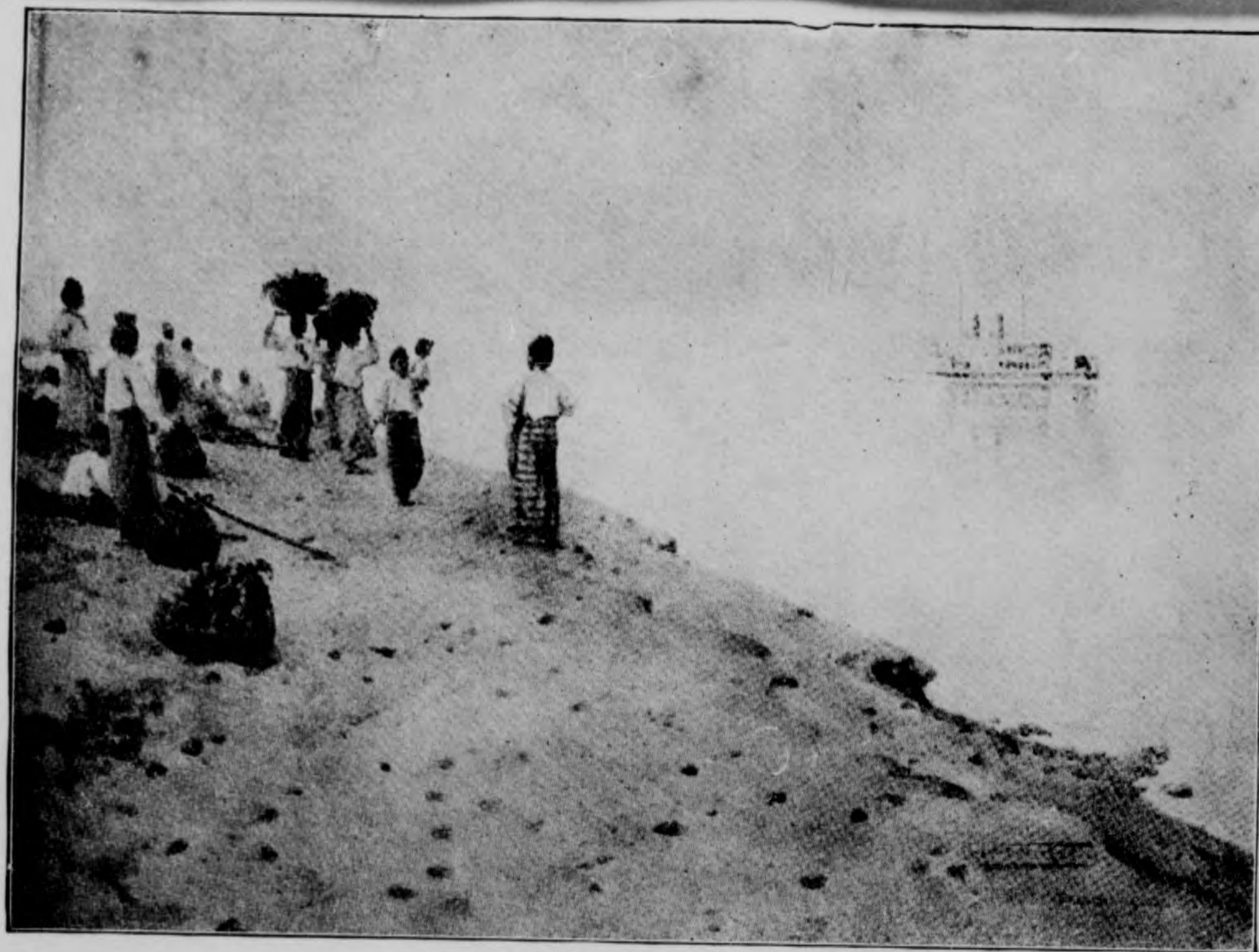
船汽的河底瓦落伊待等