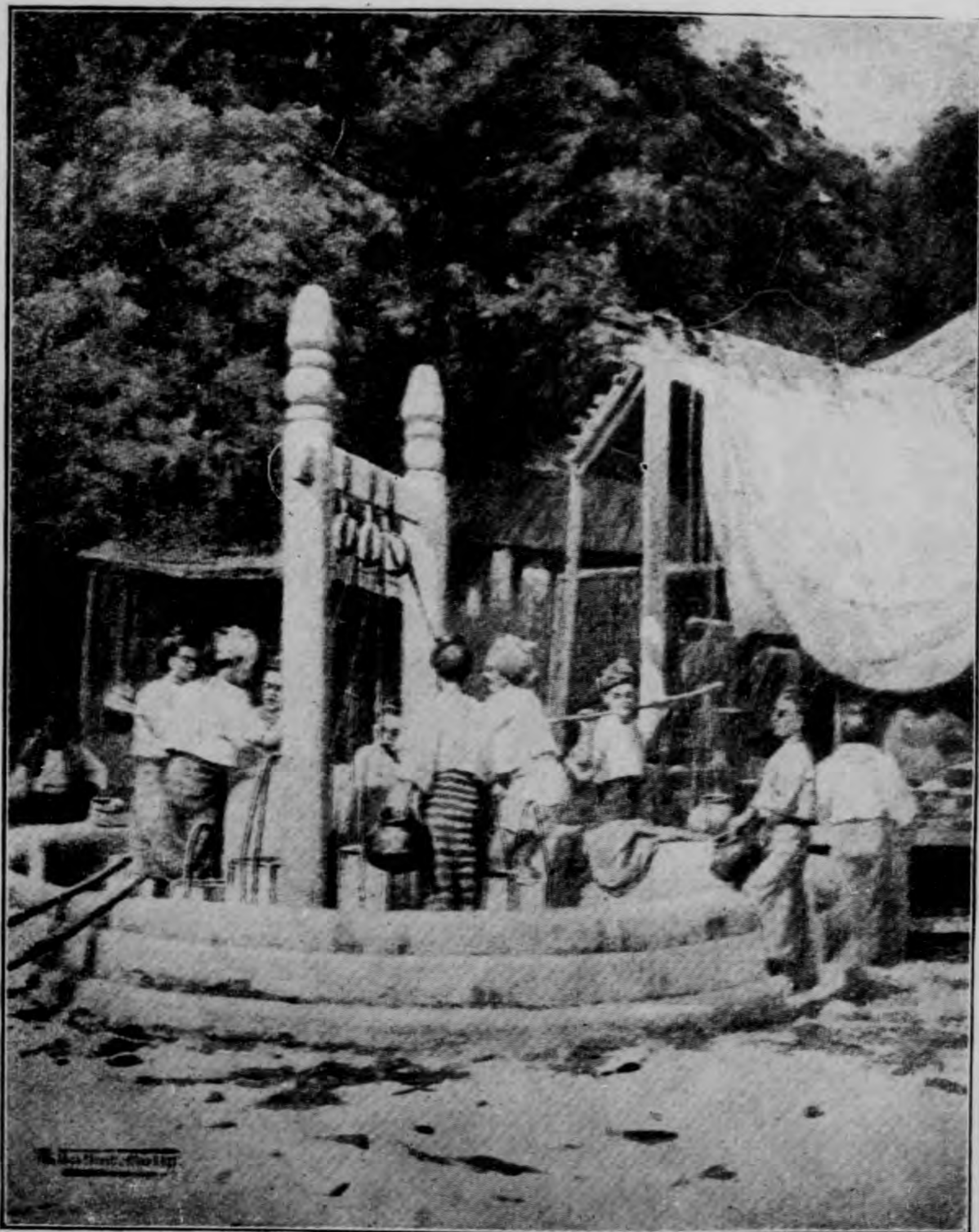
井 邊 的 遊 人