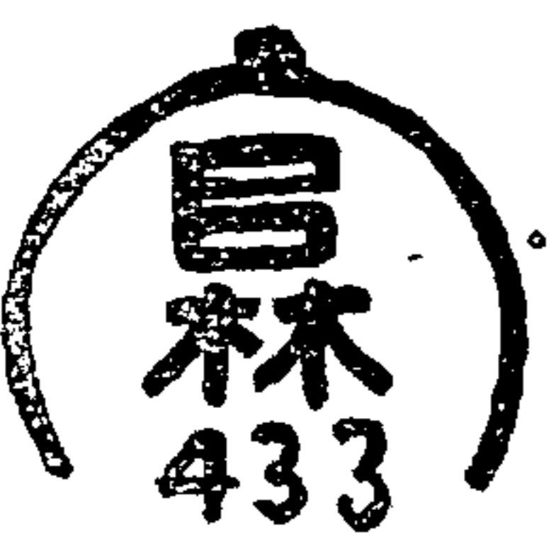
圓形徑三・二種鋼鐵矢形彫表面ニ番號ヲ附ス