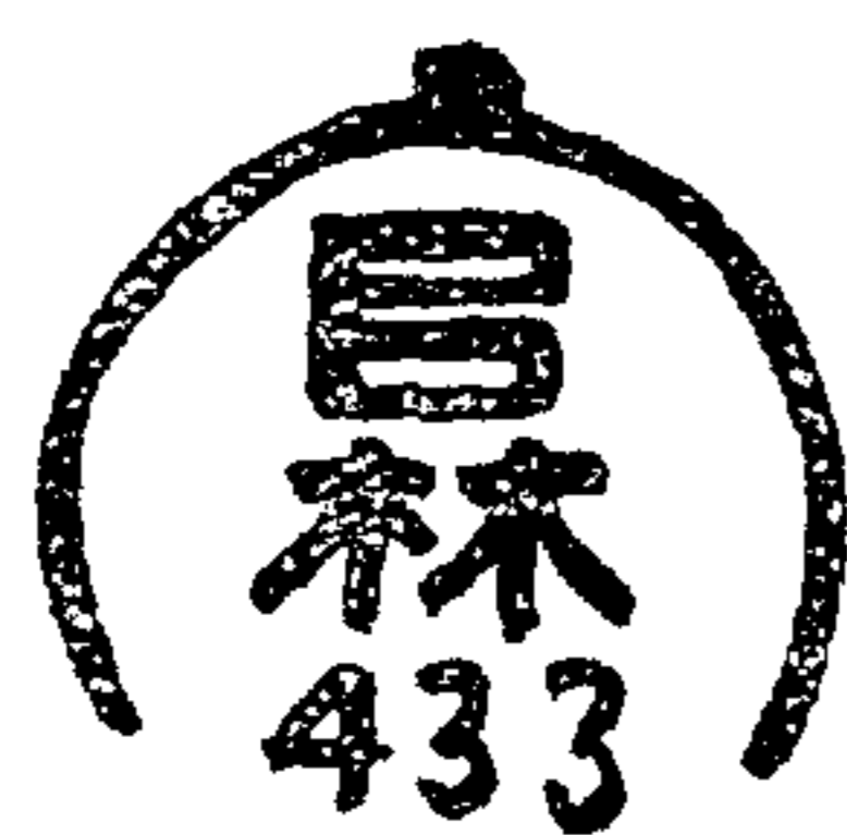
圓形徑三・二種鋼鐵鑄陽文表面附以號數