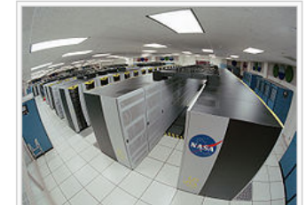
నాసా (NASA) వారి కొలంబియా సూపర్ కంప్యూటర్

కంప్యూటరు అనునది అనేకమయిన ప్రక్రియల ద్వారా సమాచారమును రకరకాలుగా వాడుకోటానికి పీలు కలుగచేసే యంత్రం . సమాచారము వివిధ రూపములలో ఉండవచ్చును: ఉదాహరణకు సంఖ్యలుగా, బొమ్మలుగా, శబ్దములుగా లేదా అక్షరములుగా ఉండవచ్చు. 'కంప్యూటరు' అను అంగ్లపదము కంప్యూట్ అనే పదము నుండి వచ్చినది. అలాగే తెలుగులో కూడా గణనము నుండి 'సంగణకము' అను పదమును కంప్యూటరుకు బదులుగా వాడవచ్చు.