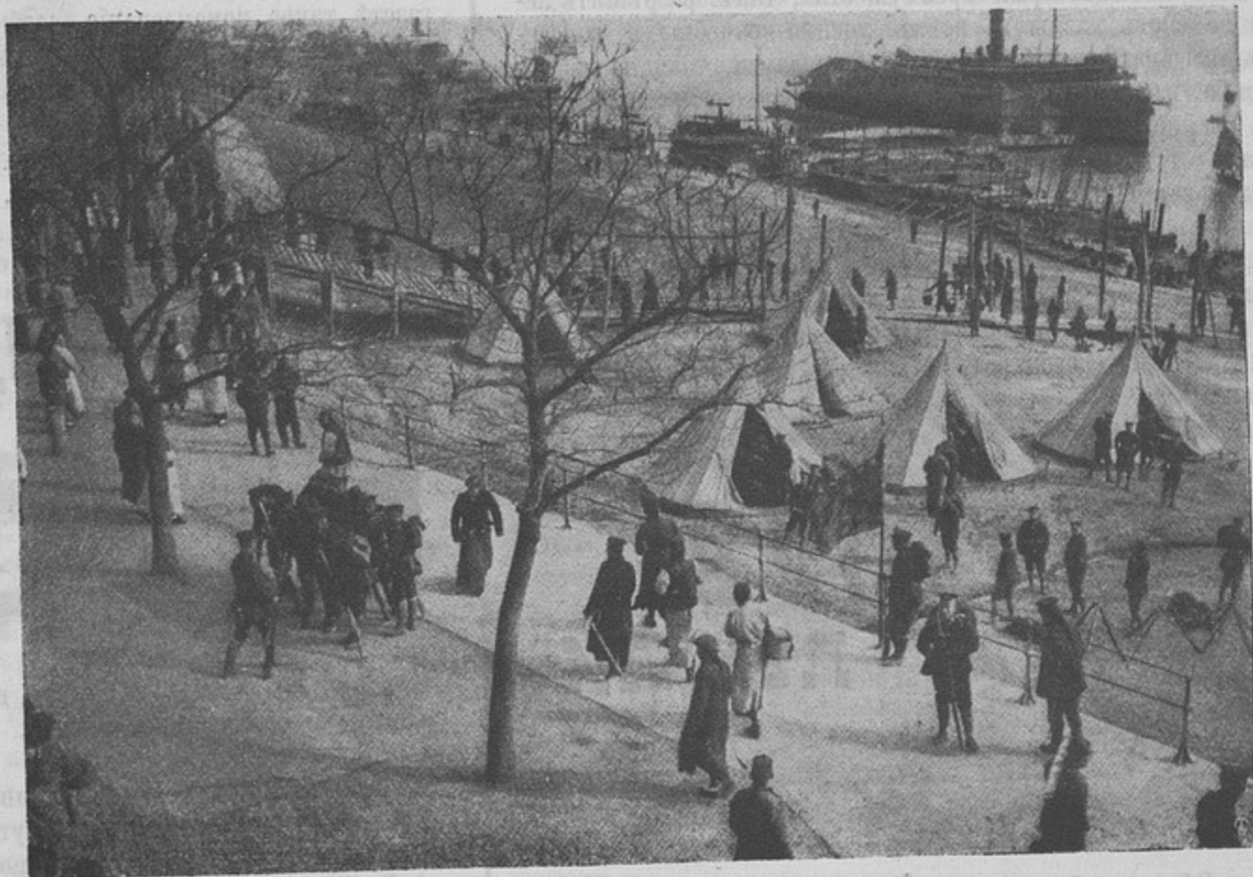
Новая китайская армія. Лагерь въ Ханькоу.

Во главѣ «дивизиона» стоитъ штабъ-офицеръ по назна-