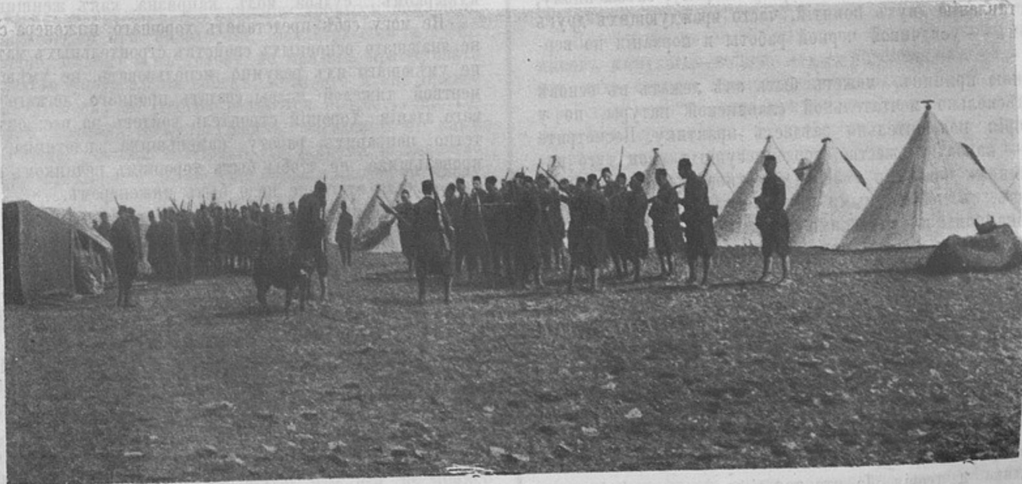
Экспедиція французовъ въ фецъ. Смотръ туземнымъ войскамъ.

— Здѣсь, — сказалъ онъ поучительнымъ тономъ, обращаясь ко мнѣ: — прежде, когда въ Италіи существовала