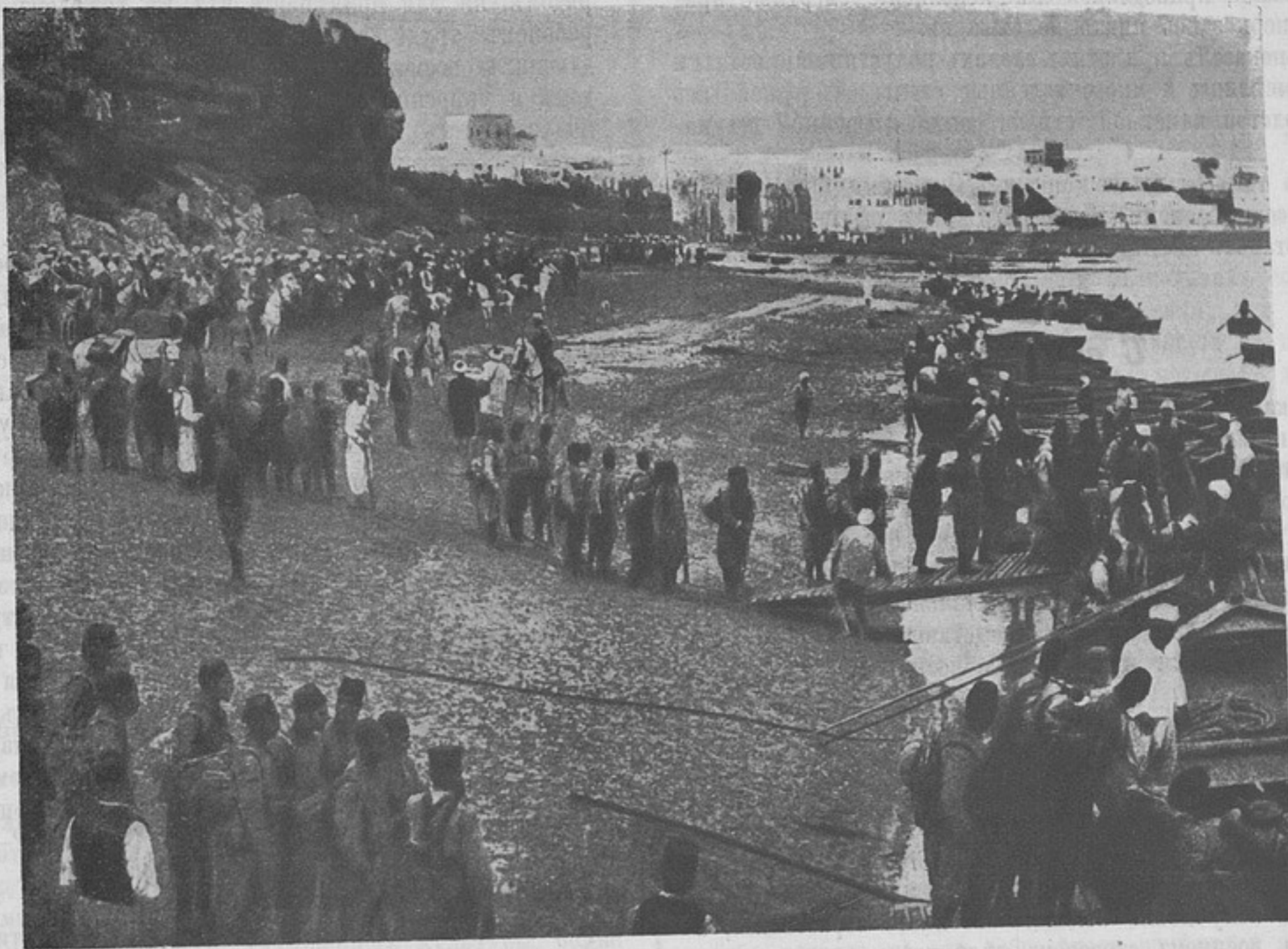
Экспедиція французовъ въ Фецъ. Посадка войскъ на суда.

рядки были бы и дороги, и сложны». А одинъ изъ сопровождавшихъ насъ офицеровъ сострилъ: «непрятности, связанныя съ приговоромъ суда, парализуются удовольствіемъ полного отдыха въ тюрьмѣ».