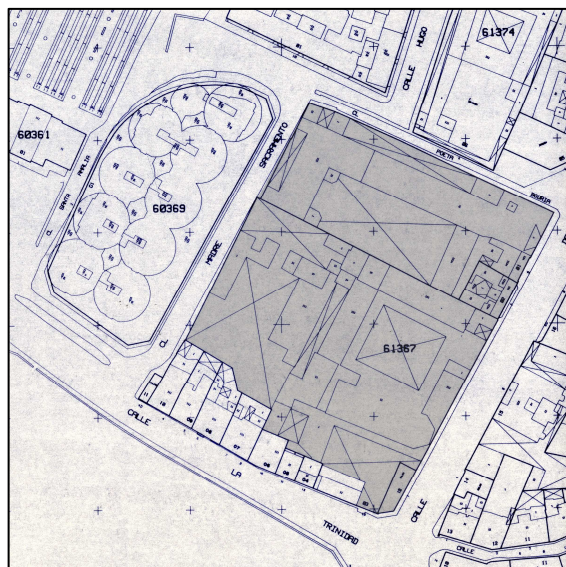
Cartográfico C.G.C.C.T. 1980