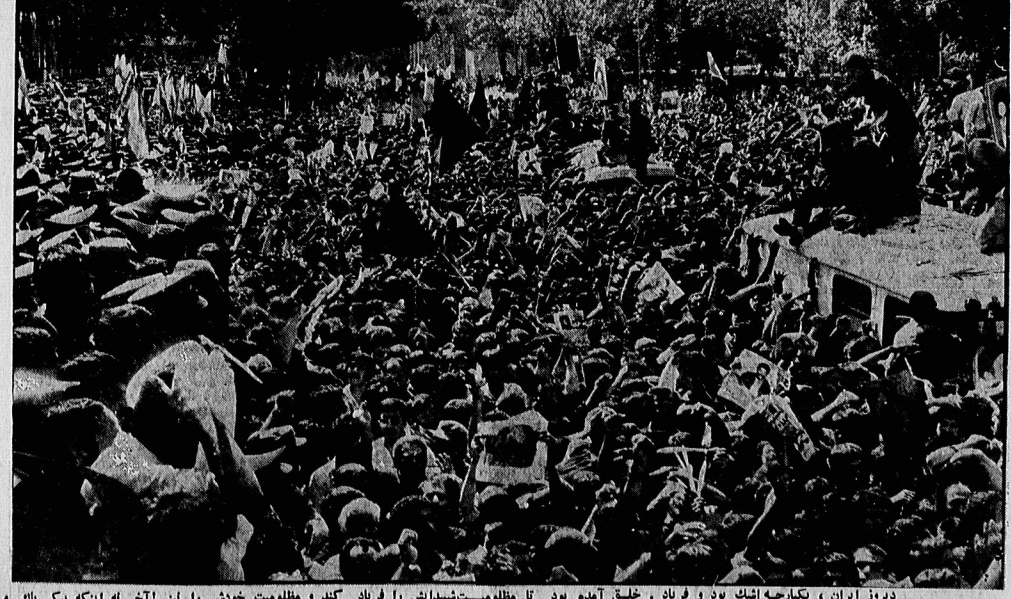
دیروز ایران، یکبارچه اشک بود و فریاد، خلق آمده بود تا مظلومیت‌شهادتین را فریاد کند و مظلومیت خودش را نیز آفریند. آنکه پیکر پاک و مطهر آئینه شهید را بنام خلق تکه تکه کرده بودند! فریاد مرگ بر آمریکا، مرگ بر منافق بنگار دیگر پرده زویر و دروغ منافقین را از هم برد.