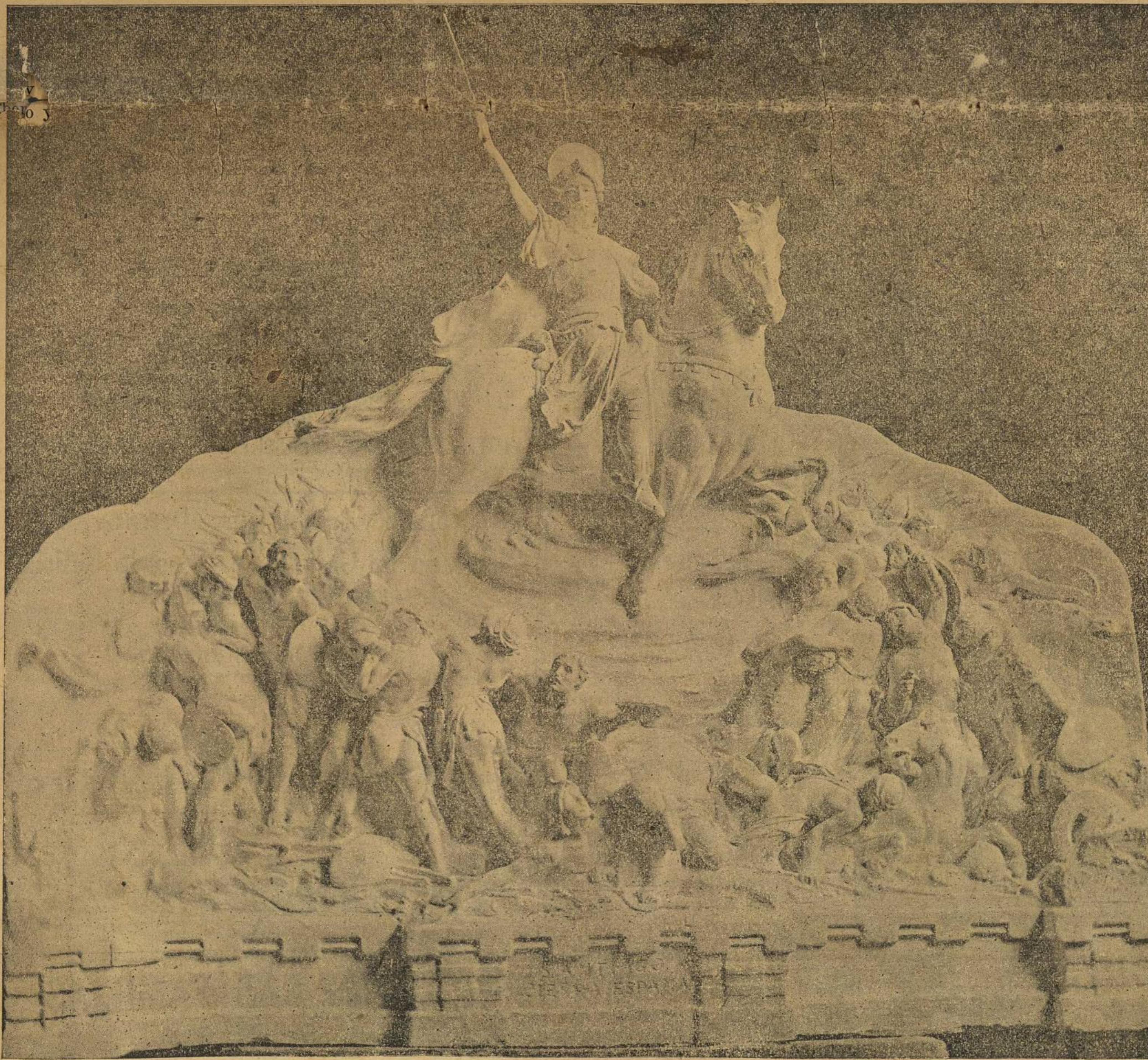
EL APOSTOL SANTIAGO

Pidámoslle o noso santo Apóstol que aga tamén agora milagros, moitos milagros, para que todos veñan a veneralo e visitalo, e sober todo que naxa ningún dalma morta en Santiago.