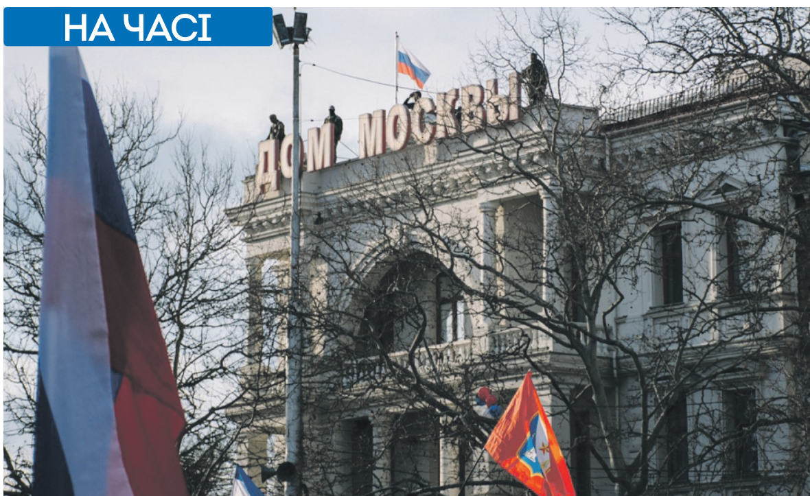
Снайпери на даху «дому Москви» під час мітингу за участі В. Путіна, 14 березня 2018 р., м. Севастополь

14 березня Путін таки прибув до Криму – не пішки по воді, а повітряним і наземним транспортом. У Севастополі під час мітингу на площі Нахімова, під надійним захистом снайперів, що обе-