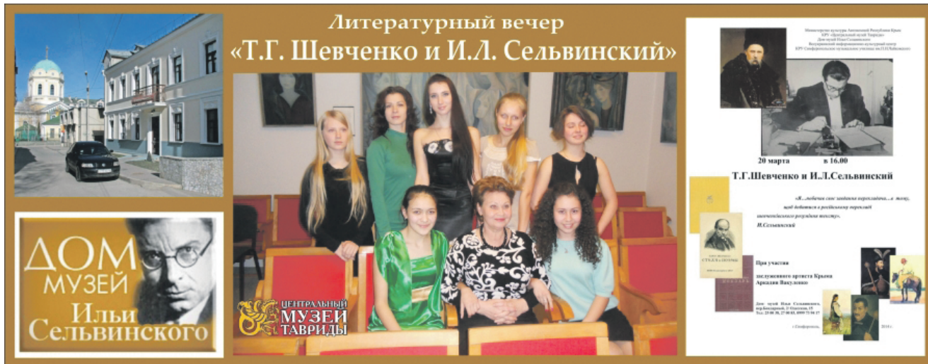
Афіша заходу, що проводився 20 березня 2014 р. у будинку-музеї Сельвінського в Сімферополі

Майже за місяць до цього, 23 лютого, у Севастополі відбувся велелюдний мітинг, на якому було задекларовано непокору Києву та обрано «народного мера». 16 березня під контролем «законних формувань» на півострові відбувається «референдум» про відокремлення від України. 18 березня Путін у Кремлі підписує зі своїми кримськими маріонетками Аксьоновим, Константиновим і Чалим «угоду про прийняття Республіки Крим і Севастополя до складу РФ». Тим часом на півострові в умовах російської окупації збираються мирні антивоєнні мітинги на підтримку українського суверенітету, учасники яких зазнають провокацій і нападів від сепаратистськи налаштованих громадян. У різних куточках Криму відбуваються акції за мир і єдність в Україні. Драматичним став день відзначення 200-ї річниці від дня народження Кобзаря: на одну з наймасштабніших акцій біля його погруддя в Сімферополі люди прийшли з українськими прапорами та плакатами на підтримку Украї-