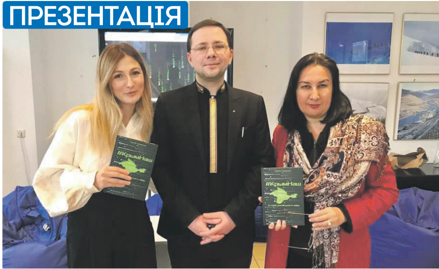
ФОТО З ВІДКРИТТЯ ДЖЕРЕЛ