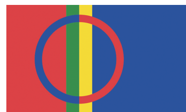
Прапор автономії саамів

Після цього на острови навіть висадилися шведські війська. На