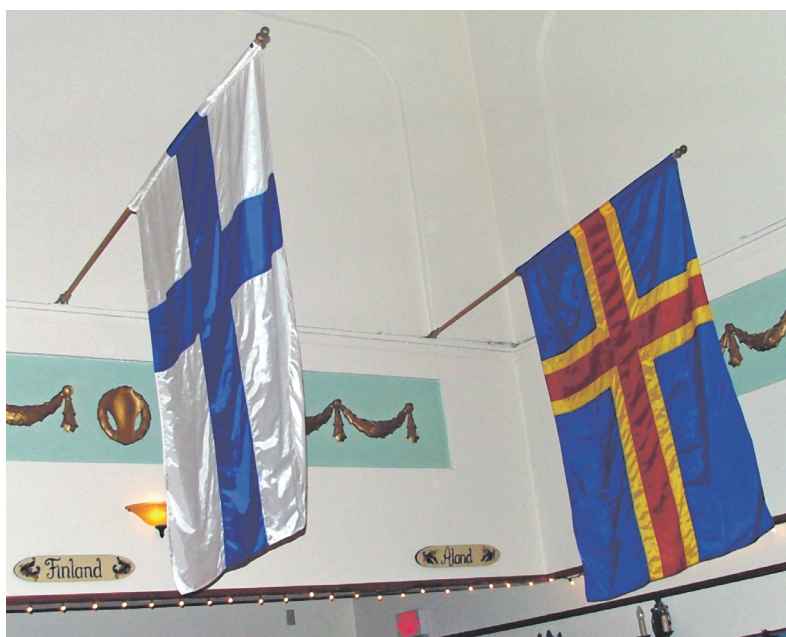
Прапори Фінляндії і Аландських островів

Ми розповімо читачам про найдавнішу європейську автономію; про автономію, якої не існує; про острови, віддалені від метрополій на тисячі миль, та про гірські долини; про цілковито самоврядні території та повністю підпорядковані центральній владі.