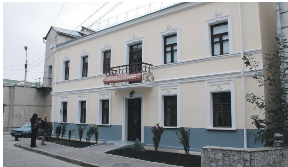
Будинок-музей Іллі Сельвінського в Сімферополі

Тим часом на півострові в умовах російської окупації збираються мирні антивоєнні мітинги на підтримку українського суверенітету, учасники яких зазнають провокацій і нападів від сепаратистськи налаштованих громадян. У різних куточках Криму відбуваються акції за мир і єдність в Україні. Драматичним став день відзначення 200-ї річниці від дня народження Кобзаря: на одну з наймасштабніших акцій біля його погруддя в Сімферополі люди прийшли з українськими прапорами та плакатами на підтримку Украї-