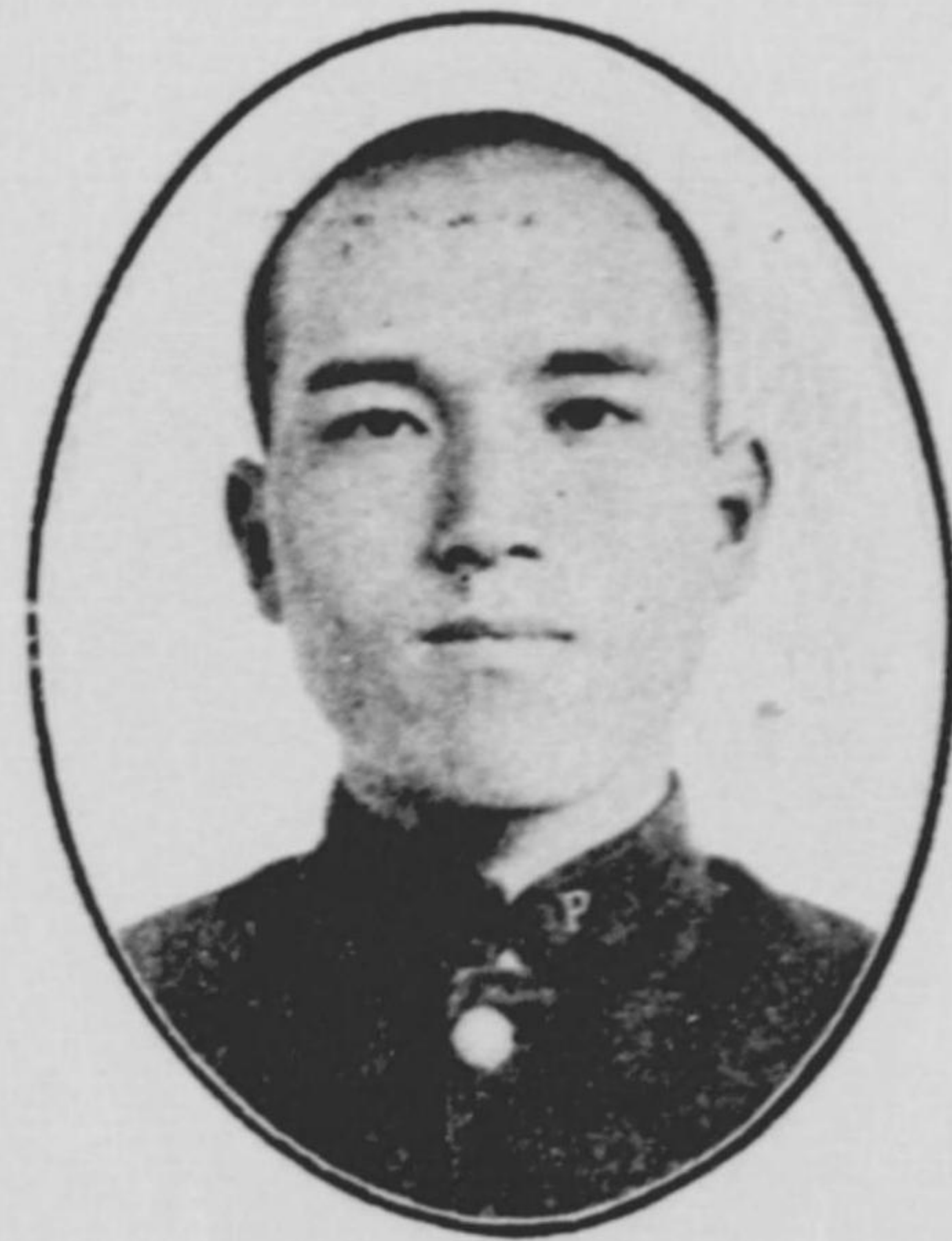
郎 三 池 菊