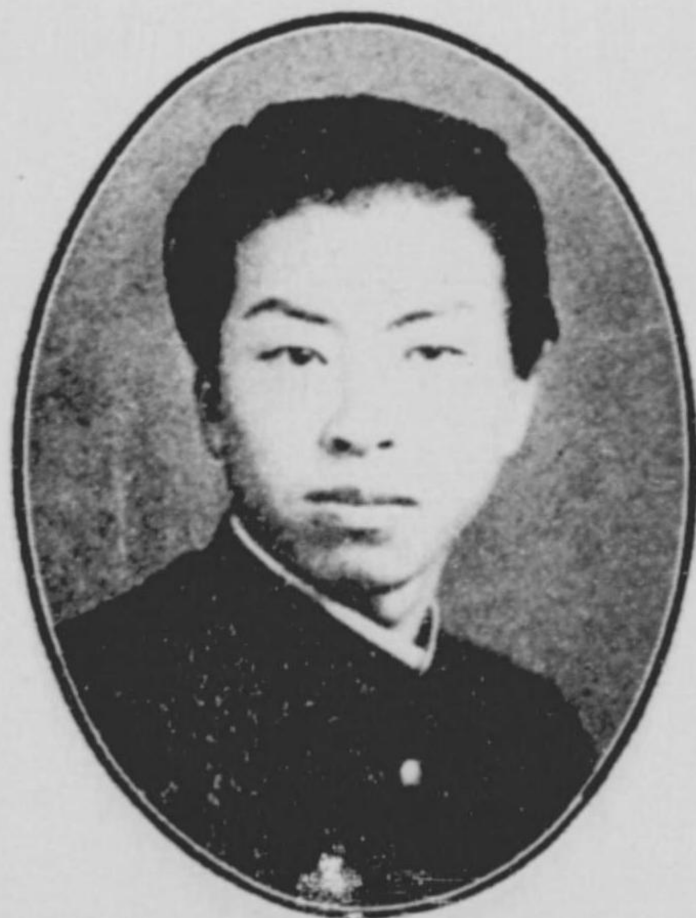
彌 元 矢 關