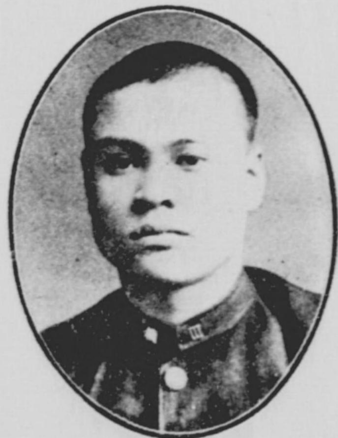
弘 嶋 竹