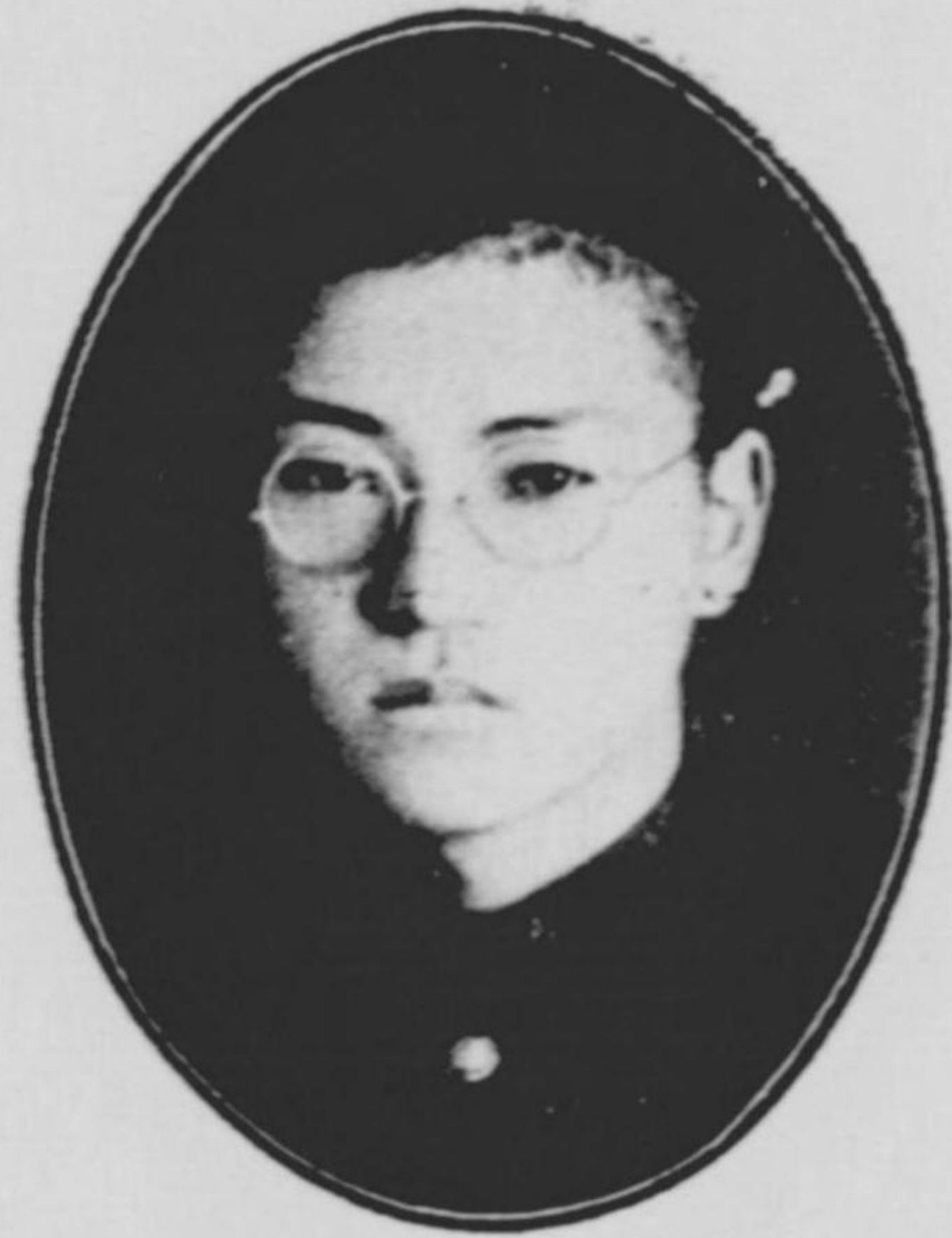
勇 川 乙