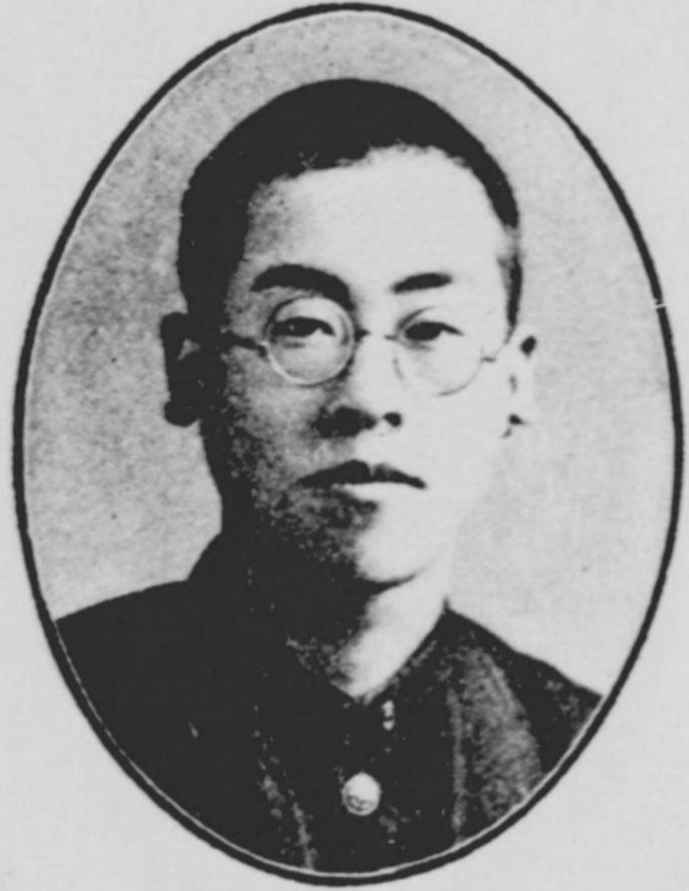
男 久 東